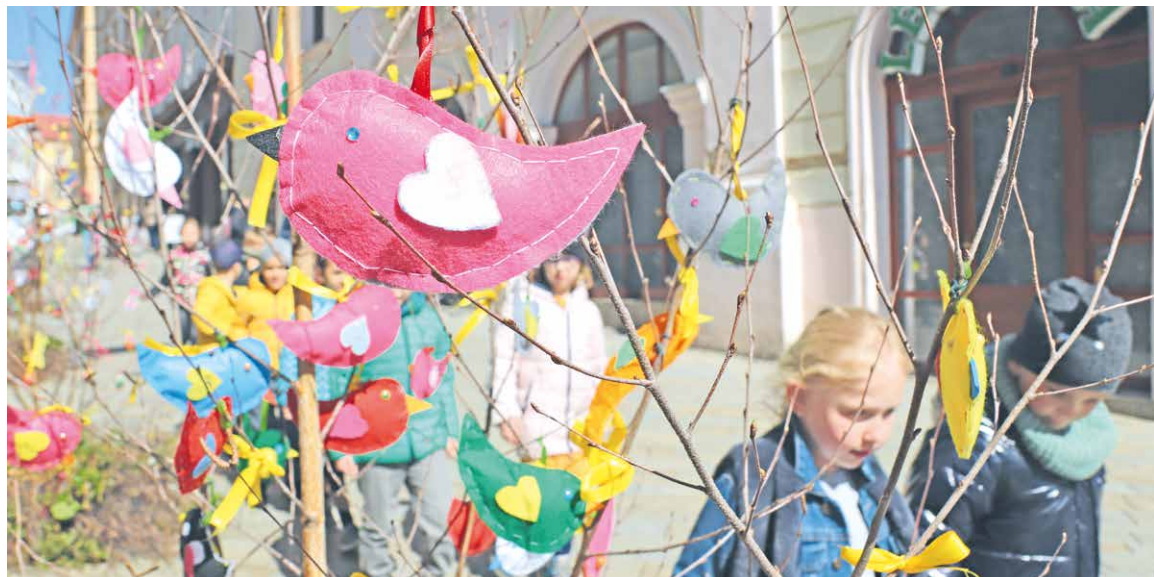
■ Obrokovu ulici opět zkrášlí břízky vyzdobené výrobky dětí znojemských škol a školek.

nahradili zvony, které utichnou právě před velkou nocí. Jsou to ale i historické řemeslné dílny, které připomenou tradici pletení pomlázky a další jarní tvoření. Program opět obohatí oblíbený Králíčí hop,“ popisuje František Koudela, ředitel Znojemské Besedy. Více na str. 8 a 9. lp