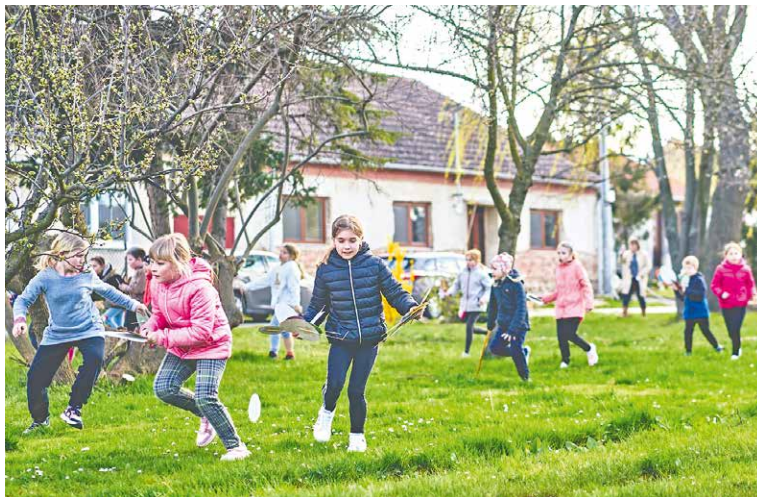
■ Finanční prostředky města pomohou v příměstských částech i s pořádáním velikonočních oslav. V Načeratících plánují na 23. března tradiční Vejcohraní (na fotografii). Hradiště města čeká zdobení velikonoční břízky, a to v neděli 24. března, v Oblekovicích si ji nazdobí v sobotu 30. března.

„V minulém roce se činnost nově složených komisí dobře rozpochovala. Komise fungují, v příměstských částech to žije a dostáváme pozitivní zpětnou vazbu od občanů. Proto bychom rádi ještě více podpořili dění v jednotlivých příměstských částech, a tak jsme se rozhodli navýšit příspěvky pro letošní rok pro každou komisi o 10 tisíc korun,“ přiblížila starostka Znojma Ivana Solařová.