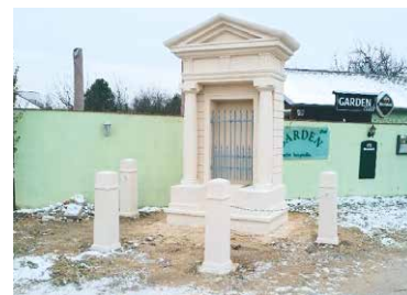
■ Opravená poklona

Do konce března můžete hlasovat v soutěži Nejlépe opravená kulturní památka Jihomoravského kraje.