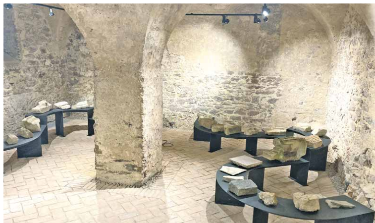
■ Nově vznikající lapidárium v Centru Louka.

Město Znojmo se jako člen Sdružení historických sídel Čech, Moravy a Slezska každoročně připojuje k celonárodní akci Brány památek dokořán. V rámci ní mají lidé možnost zdarma navštívit vybrané památky. V letošním roce si budou moci zájemci prohlédnout nově připravovanou expozici kamenných prvků v lapidáriu a nahlédnout i do ostatních prostor v Centru Louka. „Lapidárium bude letošní novinkou. Vystaveny budou prvky nalezené při rekonstrukci budovy,