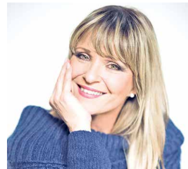
■ Chantal Poullain