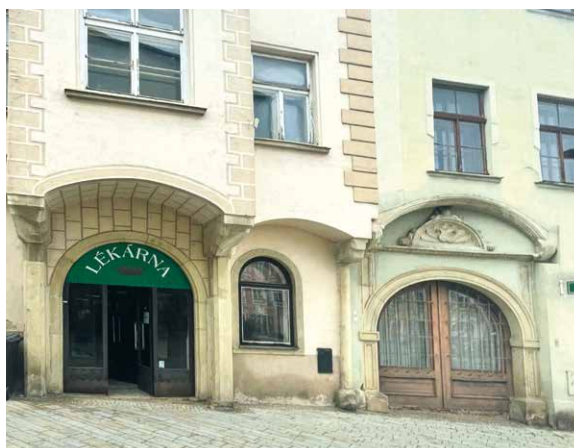
■ Bývalá lékárna na rohu ulic Obrokové a Záměčnická.

Projekt vzniká ve spolupráci s Oblastní charitou Znojmo, Chráněnými dílnami SANSIMON Znojmo, Klubem rodičů a přátel dětí s PAS – Budme v tom spolu a OHK Znojmo. „Jsem