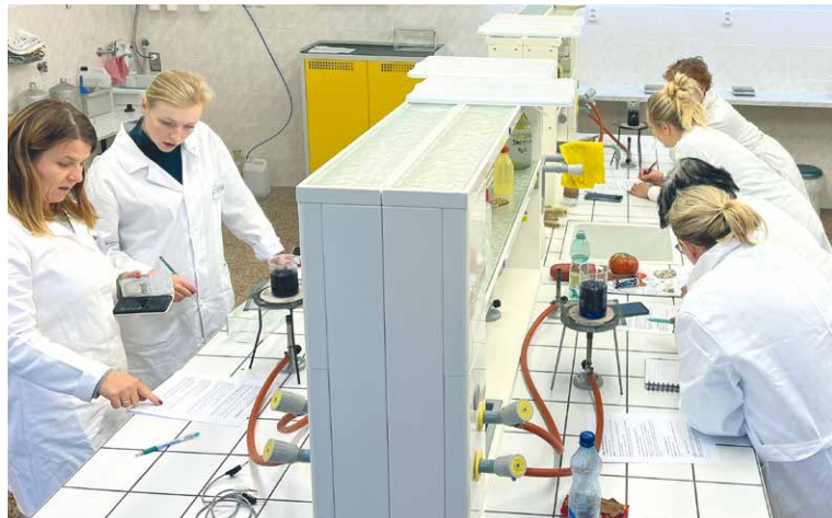
■ Učitelé při praktických pokusech na půdě gymnázia.

„Z každého setkání v rámci Chemického elixíru si učitelé odnášejí spoustu námětů na zpestření a zlepšení výuky. Všechno směřujeme k tomu, aby se děti co nejméně pasivně učily z učebnic poučky nebo vzorce, a co nejvíce toho viděly na vlastní oči na konkrétních příkladech. Měly by si ty věci samy vyzkoušet, sáhnout si, očichat. To je nejefektivnější způsob výuky, a proto používám při výuce chemie hodně pokusů. Ono se to nezdá, ale i jednoduchý pokus je pro učitele náročná disciplína. V zahraničních školách nebo na vysokých školách je běžné, že učitelé mají k ruce laboratorního asistenta. V naší zemi si musíme se vším poradit sami. Mnozí učitelé se proto do pokusů moc pouštět nechťejí. Nevěří, že se jim pokus povede nebo nemají potřebné pomůcky a chemikálie. A v tomto je jim nápomocný právě Chemický elixír. Z našeho setkávání si odnáší promyšlený nápad, pokus si na místě vyzkouší, a pokud potřebují, dostanou nebo si vypůjčí i potřebné