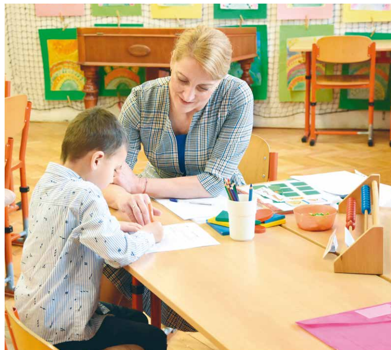
■ Zápis dětí do 1. třídy na ZŠ Mládeže.