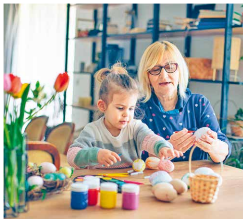
■ Zapojit se do tvorby kraslic může každý.

Vybrat si malovanou kraslicí a další dekorace pak budete moci na velikonočních trzích 29. a 30. března vždy od 10.00 do 17.00 hodin ve stanu na Horním náměstí. Vaše darovaná či zakoupená kraslice tak může přispět některému z pacientů k záchraně života. lp