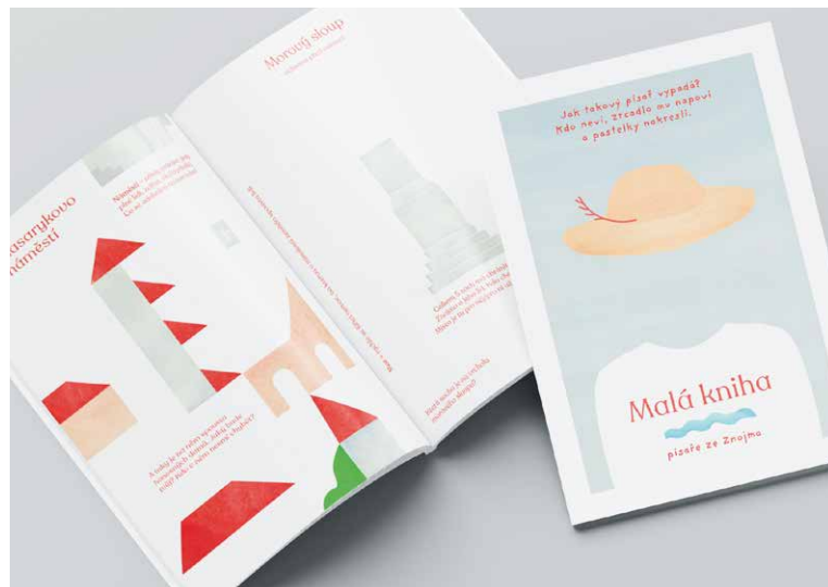
■ Malá kniha písaře ze Znojma.

Malá kniha písaře ze Znojma ale nepatří do rukou jen dětem, přínosem je i pro dospělé. Vždyť, ruku na srdce, kolik z nás místních opravdu zná své město? KS, lp