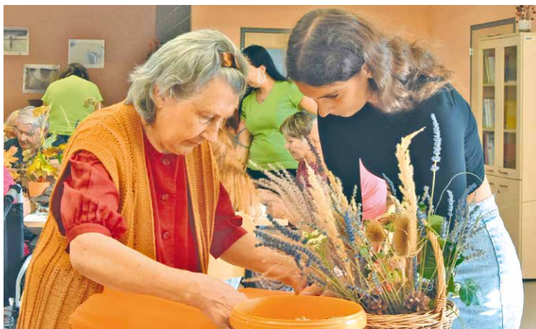
■ Klienti Domova pro seniory při tvoření se studenty.

Maceška a 91 tisíc na kulturní a volnočasové aktivity GaPu na Kollárově ulici. Nižší dotace do výše 50 tisíc korun pak míří například rodičovským spolkům u základních a mateřských škol nebo SVČ na jejich projekt Diamantbrání. Individuální dotaci ve výši 400 tisíc korun poskytne město Oblastnímu spolku Českého červeného kříže Znojmo, který vedle svých dalších činností organizuje přednášky nebo kurzy první pomoci. Kompletní výčet poskytnutých dotací naleznou zájemci na webu města. pk