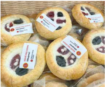
■ Na každého příspěvatele čeká sladká odměna.

Oblastní charita Znojmo každoročně v říjnu pořádá pro veřejnost akce, které nejen pobaví, ale zároveň pomohou druhým. Nejinak tomu bude i letos.