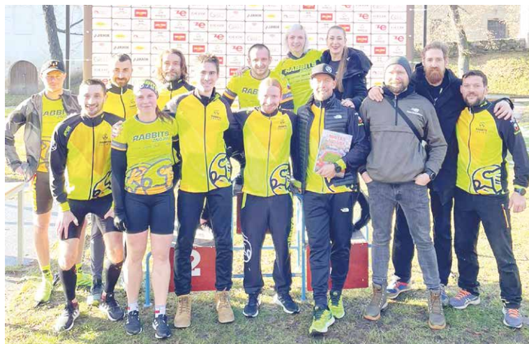
■ Rabbits Znojmo.