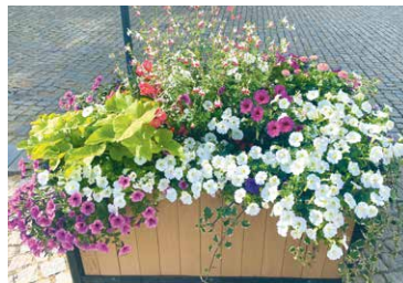
■ Znojmo se pyšní množstvím mobilní zeleně.

Velké mobilní kontejnery umístěné na zemi jsou už tradiční součástí výzdoby, po městě jich je v sezóně rozmístěno na 160. Většina z nich se používá celoročně a slouží hlavně k vymezení parkování nebo lemování parkovišť. „Základem je vyšší stromek nebo keř, jako třeba habr nebo muchovník, které doplňují nižší keře, například růže, a v sezóně letničky. V květnu pak ze zahradnictví vyvážíme 48 kontejnerů s letničkami a převýslými rostlinami. Najdete v nich