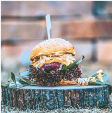
■ Dvoudenní festival Dej si Food je výzvou pro všechny labužníky.

V Hradní ulici ukáže to nejlepší z gastro nabídky zdejšího kraje doplněné o kvalitní produkty z celého Česka. Spojením kvalitní gastronomie, podávané v degustačních porcích pro maximální užitek návštěvníka, a lokální kultury zažijete nezapomenutelnou atmosféru. Ta je navíc podpořena doprovodným programem, který odráží genius loci města a sceluje tak myšlenku festivalu užít si dobré jídlo v neotřelém prostředí. Festival Dej si FOOD bude veřejnosti přístupný v pátek od 14.00 do 22.00 a v sobotu od 10.00 do 18.00 hodin. Vstupné je jako každý rok darem. Více info i k doprovodnému programu najdete na webu dejsifood.eu.