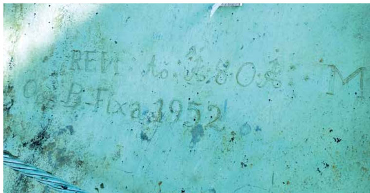
■ Na původní střešní krytině byly objeveny nápisy klempíře Fixy z roku 1952.

Dojde také na obnovu věžních hodin. Opravena a znovu natřena bude omítka ciferníku, osazeny budou nově pozlacené minutové terčíky a zlacení získají i hodinové ručičky a římské číslice. V prvním patře se navíc chystá nová expozice věnovaná historii a současnosti věže. Spolu se slavnostním otevřením opravené památky bude spuštěn prodej speciálních mincí vyrobených ze sundaných historických plechů krytiny. Do jedné z osmi men-