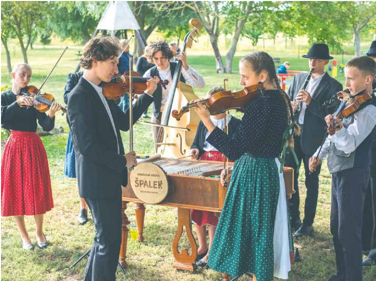
Na setkání zahraje i Cimbálová muzika Špalek.

Letošní rok nás čeká již devátý ročník Setkání cimbálových muzik.