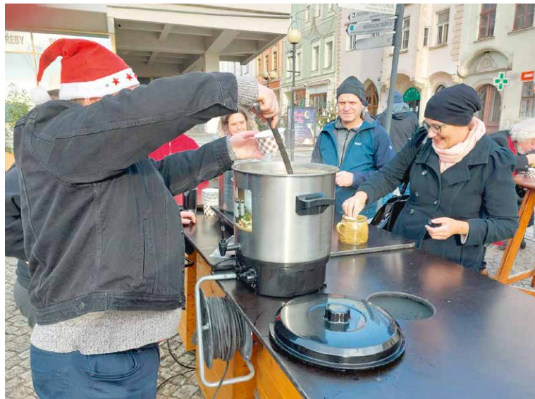
■ Vánoční štědrovka ve Znojmě.