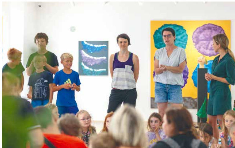
■ Tým GaPu v mnoha svých aktivitách seznamuje mladou generaci s různými podobami umění.