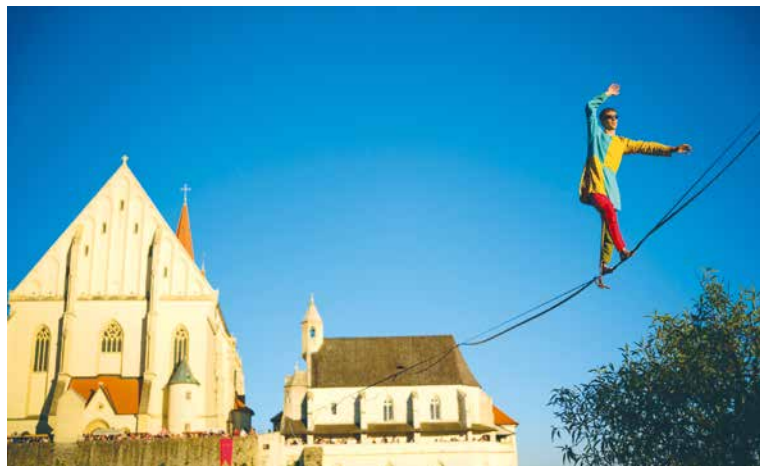
■ Letošní novinka funambules – provazochodci, kteří se při přechodu Jámy v historickém centru postarali o dechberoucí podívanou.