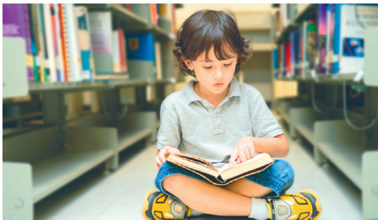
■ Knihovnu ve Znojmě navštěvují stovky malých čtenářů.

A chybět nemůže ani oblíbená Noc s Andersenem, kterou si děti užijí v poslední březnový den od 16.00. V Kulturním přehledu na straně 14 najdete další aktivity knihovny. Podrobnosti k březnovému programu získáte na kontaktech ( www.knihovnazn.cz , tel. 515 224 346). lp