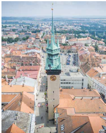
■ Radniční věž se tyčí do výšky 66,58 metrů.

„Jsem velmi ráda, že se zápisem radniční věže na seznam národních kulturních památek zúročilo dlouhodobé úsilí a spolupráce mnoha lidí. Díky zápisu se nám například otevrou nové možnosti čerpání dotací. Je ale