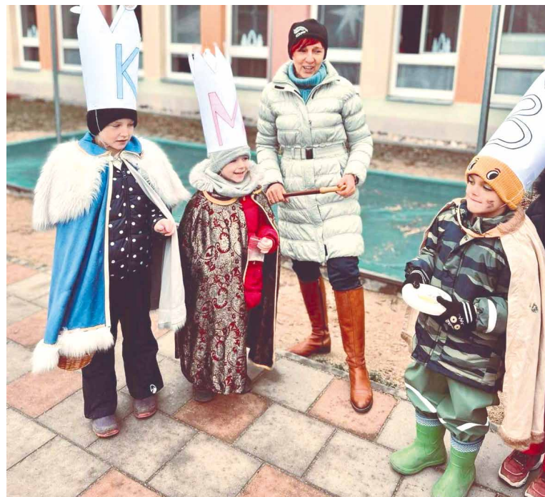
■ Děti se jako koledníci patřičně vystrojily.

v Rodinném centru Maceška, které má sídlo v areálu, a také zaměstnanci školy a rodiče. Malí koledníci tak dostaly 3600 korun. Nejvíce přispěli dospěláci ve třídě Žabiček. Rozhodnutí, co s penězi, bylo od dětí jasné – pomohou zvířecím kamarádům žijícím v útulku. Nakoupí pro ně hlavně konzervy. lp