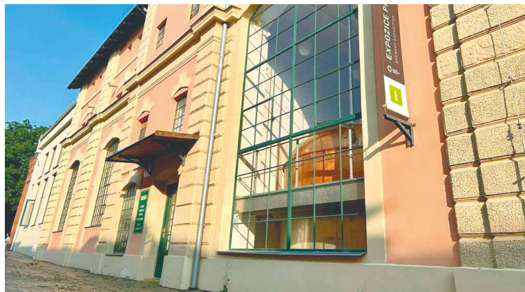
■ Certifikované Turistické informační centrum na Hradní ulici je označené zelenou tabulí s bílým „ičkem“ uprostřed.

Nové Turistické informační centrum najdou lidé na ulici Hradní v Expozici pivovarnictví, kam se přemístilo z původních prostor Jižní přístupové cesty.