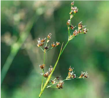
■ Letos kvetoucí sítina tmavá v Národním parku Podyjí. Semena sítiny čekala v bahně na svou příležitost, která přišla po sto letech!

Sítina tmavá roste na podmáčených půdách a v Čechách ani na Moravě ne-