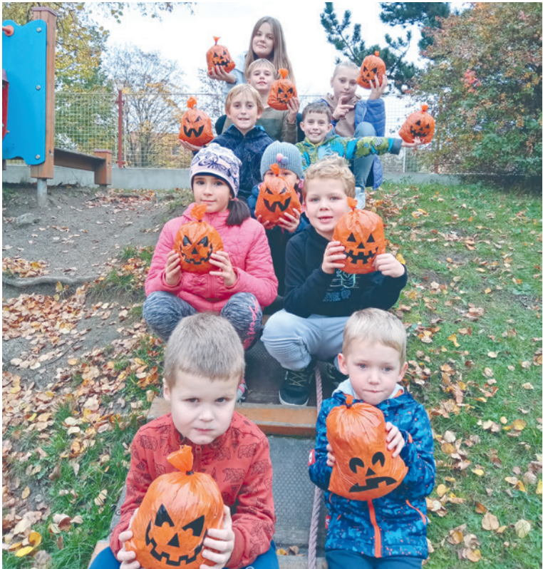
■ Jakékoliv tábory jsou dětmi vítané.

RC Maceška sídlí v areálu Mateřské školy Pražská. Jarní příměstský tábor zde budou moci děti navštívit od 13. do 15. března. Program od 8.00 do 16.00 hodin je koncipován s ohledem na počasí, požadavky a věk dětí (4–15 let). V plánu je výlet do Božic s koupáním ve slané vodě, s vířivkou v Relax centru, tvořivé dílničky, kino a další aktivity. V ceně 1200 Kč (3 dny) nebo 450 Kč (1 den) je ranní a odpolední svačinka formou švédského stolu, každý den teplý oběd, jízdné a vstup