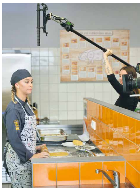
■ Natáčení štábu rakouské televize na Přímce.

„Příмка“ je škola s gastronomickou tradicí, a tak si nemohli žáci gastronomických oborů nechat ujít muzejní výstavu Vídeň na talíři do-