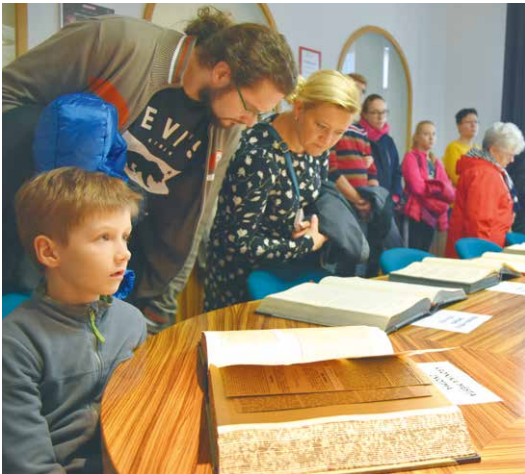
Velký zájem vždy budila prohlídka vystavených kronik města Znojma. I letos si je budou moci lidé prohlédnout.

V rámci doprovodného programu bude zdarma otevřena Expozice pivovarnictví na Hradní ulici a Centrum Louka na ulici Loucká. Na prohlídky bude možné vyrazit od 9.00 do 13.00 hodin. Jihomoravské muzeum nabídne zdarma prohlídku vystavených fotografií znojemských sportovišť a plováren z fotoarchivu muzea s názvem Svoboda v pohybu. Výstavu bude možné zhlédnout v mázhauzu Domu umění na Masarykově náměstí od 9.00 do 17.00 hodin. dm