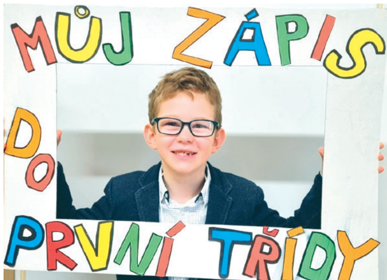
■ Děti jsou kreativci i u zápisu do své první třídy.