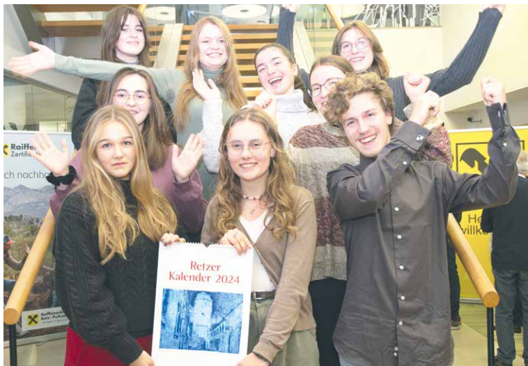
■ Žáci výtvarného oboru znojemské ZUŠ na slavnostní prezentaci kalendáře v Retzu.

Kalendář Retzu má téměř třicetiletou tradici. Obrazy z kalendáře i další díla znojemských žáků jsou pak k vidění také na výstavě v bance Raiffeisenkasse na hlavním náměstí v Retzu, kde si je návštěvníci mohou prohlédnout v běžné otevírací době banky až do 5. ledna. dm