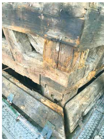
■ Až vystavěné lešení s přístupem do nejvyššího bodu věže poskytlo odborníkům pohled na rozsah poškození trámů, bednění i měděné krytiny. Do té doby se tak vysoko nikdo podívat nemohl.