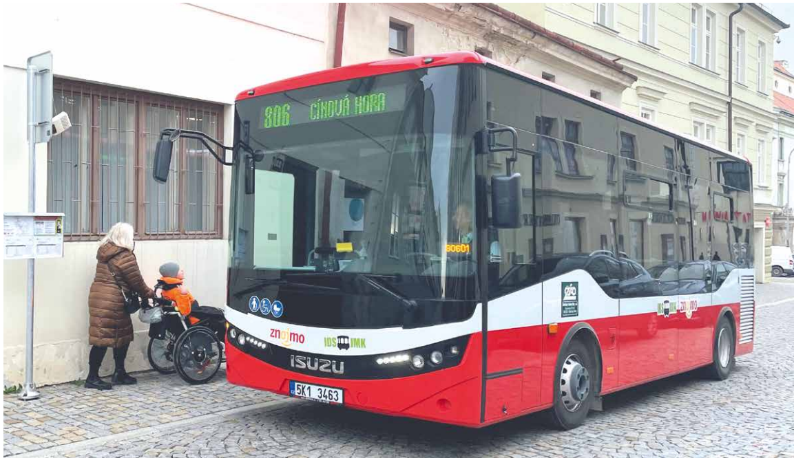
Lidé si zvykají na nové zastávky, linky i způsob plateb v autobusech.

tující o trpělivost. „Nový systém s sebou přináší spoustu změn. Víím, že to je náročné i pro vás cestující, vše se musí zaběhnout. Spolu s dopravcem a Kordisem intenzivně pracujeme na tom, aby MHD fungovala k maximální spokojenosti všech cestujících.“ Pokračování na str. 8.