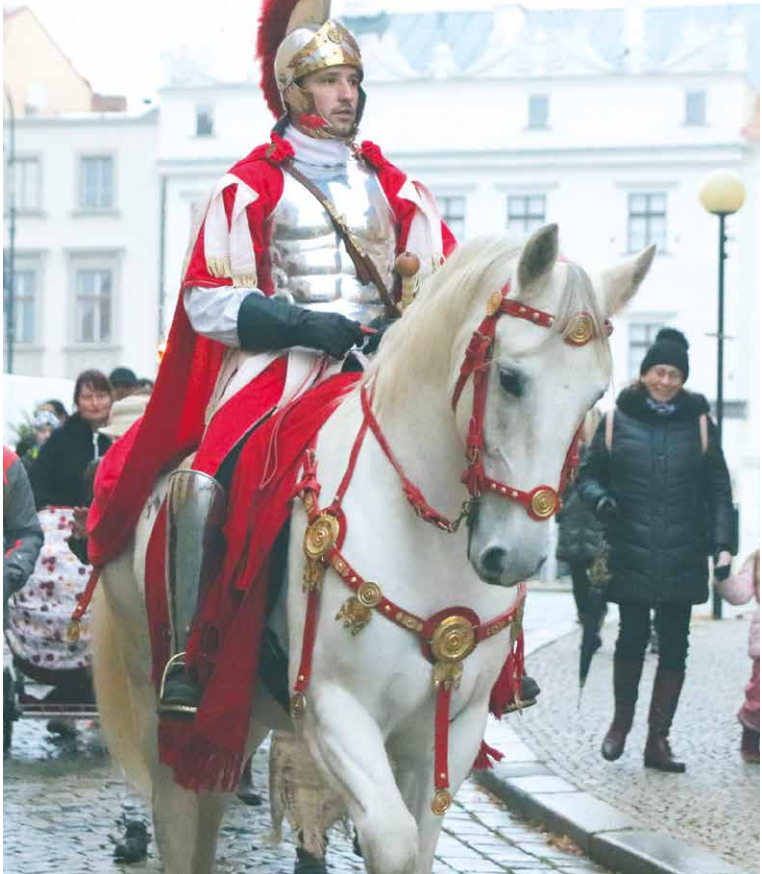
■ Svatý Martin na bílém koni přiveze letošní mladá vína.

Původně keltský svátek Halloween, který už zdomácněl i v našich krajinách, postraší návštěvníky znojemského podzemí. Svatý Martin přijede na bílém koni, aby rozlil do číši Svatomartinská a mladá vína všem milovníkům božského moku. Den před 17. listopadem rozezní cimbálové muziky Centrum Louka a v samotný památný den sametové revoluce mohou obyvatelé města nahlédnout do útrob znojemské radnice a setkat se tam s vedením města. Divadlo chystá bohatou Noc divadel. Zváni jsou všichni, kdo se chtějí podívat do hlediště i zákulisí a zazpívat si s herci v divadelním baru. Městská knihovna vyšla novou otevírací dobou vstříc požadavkům svých čtenářů a opět připravila besedy se spisovateli. GaP / Galerie a prostor nabídne mimo jiného besedu s Michaelem Kocábem. V Jihomoravském muzeu se na výstavě Ryby v lidové tradici dozvíte o využití ryb v lidové kuchyni a výstavní novinku připravila také Znojemská Beseda, a to z prostředí tvorby animovaného večerníčku Krysáci. Ti budou na malé hosty čekat v Dolním sále až do konce roku. Více se dozvíte uvnitř listu.