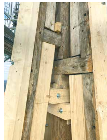
■ Pokud to jejich stav dovolí, jsou ponechány na místě původní trámy. Trouchnivějící nebo napadené škůdci jsou odstraněny a nahrazeny novými. Dřevo je také řádně ošetřeno.