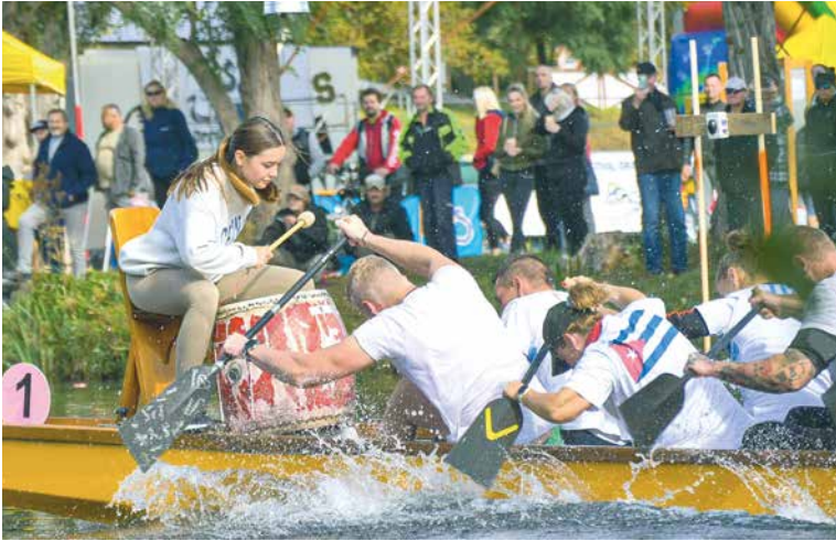
■ Dračí lodě skýtají atraktivní podívanou na řece Dyji.

Diváci včetně dětí si během sobotního programu budou moci sami vyzkoušet jízdu na dračí lodi. Mimo samotných závodů bude k vidění slavnostní nástup zúčastněných posádek, atraktivní vyhlášení výsledků, velký dračí ohňostroj, podvečerní Gladiátorské sprinty na osvětlených lodích s ohňovými efekty a vystoupení kapely Ryan music. Představí se rychlostní kanoisté, vodní záchranáři a přichází malé děti se na písčité pláži mohou projet v mini lodičkách nebo vyzkoušet jinou atrakci pro děti. Akci bude moderovat herec Miroslav Hrabě. Zahájení programu hlavního festivalového dne v sobotu 30. září je plánováno na 11. hodinu. Více informací k akci naleznete na webu dracifestznojmo.cz.