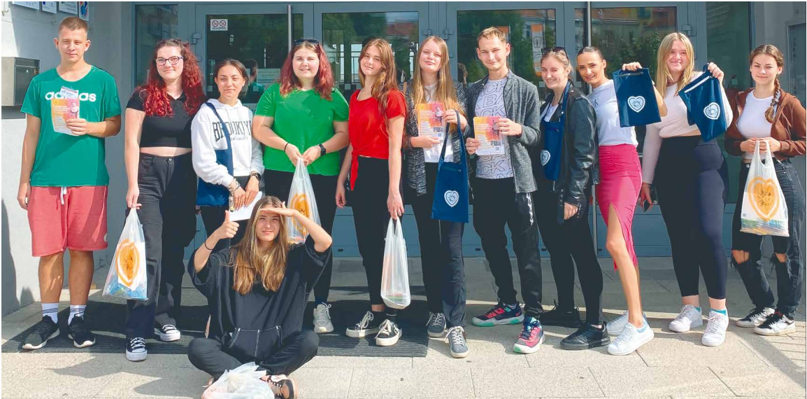
■ Studenti, kteří aktivně podpořili svoji účastí Srdíčkové dny, veřejnou sbírkou na pomoc rodinám s vážně nemocnými dětmi.

Každý rok třetí týden v září pořádá Nadace Život dětem akci Srdíčkové dny, která spojuje střední školy a učiliště z celé republiky ve společném úsilí pomoci těm, kteří to nejvíce potřebují. Proto se i studenti 3. ročníku oboru Sociální činnost vydali do ulic Znojma s nadějí, že prodejem sbírkových předmětů přinese úlevu a podporu rodinám, které čelí vážným onemocněním svých dětí. Náklady na léčbu a péči o tyto děti bývají finančně náročné a mnohdy přesahují možnosti rodin. „Je velkým povzbuzením vidět, jak naši žáci berou zodpovědnost za své okolí vážně. Tato akce nám připomíná, že i malý kousek naší péče může mít obrovský dopad na život druhých. Naši žáci se i tímto způsobem práce učí empatii, solidaritě a společným úsilím ukazují, že každý může být nositelem pozitivní změny v naší společnosti,“ říká vedoucí oboru Marcela Sabová. Znojemští studenti