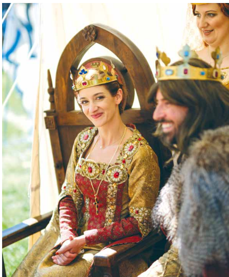
■ Charismatická herečka Marta Dancingerová poprvé na vinobraní v roli královny.