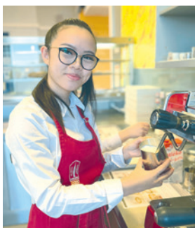
■ Ve školním baru se učí řemeslu baristé, číšníci i kuchaři.

se promítají do každého zhotoveného pokrmu, což se samozřejmě projevuje na kvalitě, vzhledu a výborné chuti produktů,“ přiblížila práci svých svěřenců učitelka odborného výcviku Zdeňka Doubková. Prozradila, že ve školním baru jsou v současné době velkým raním hitem míchaná či sázená vejce. Škála zhotovených pokrmů, které žáci vyrábí, je ale mnohem širší. K výběru je čokoládový dort, tiramisu, vafle s jahourem i fresh z čerstvého ovoce. Baristé také umí připravit kávu na mnoho způsobů. „Přijměte pozvání do našeho školního baru. Otevřený je nejen pro naše studenty, ale i pro veřejnost každý všední den od 7.00 hodin ráno do 13.00 hodin odpoledne,“ zve Zdeňka Doubková. lp, zdroj: Z. Doubková, L. Karpíšková