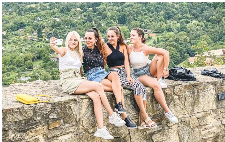
■ Chill-out u rotundy.

Každé pondělí v Jižním hradebním příkopu v prostoru za Vlkovou věží najdou děti pohádkové vystoupení, ukázkou dravého ptactva, střelbu z luku, přehlídku zbraní a zbroje, historické vojenské ležení a šermířské souboje. Hradební pondělky začínají vždy v 10.00 a doplňují tak tematickou prohlídku hradebního opevnění, na kterou se můžete vydat denně v 9.30 a 13.30.