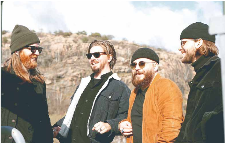
■ Black River Delta, švédští blues rockoví hoši.