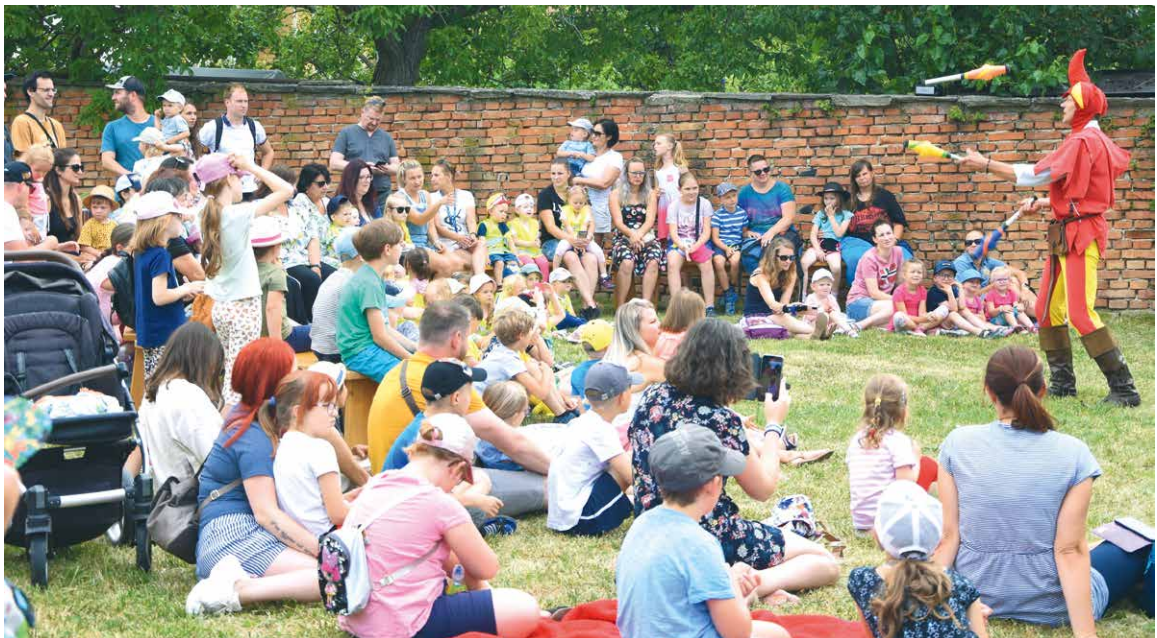
■ Vyhledávané jsou Hradební pondělky. Rodiče s dětmi je najdou v prostoru za Vlkovou věží.

Vybrat lze i návštěvu několika skvěle připravených muzejních výstav nejen na znojemském hradě. A i ty nejmenší caparty uvítají na pohádkách v Domě umění. Srpen odstartují soutěživé Slavnosti okurek. Také vám přinášíme tipy, kam vyrazit na jednodenní výlety mimo Znojmo za zajímavostmi a krásami naší země. Více na str. 8–9. lp