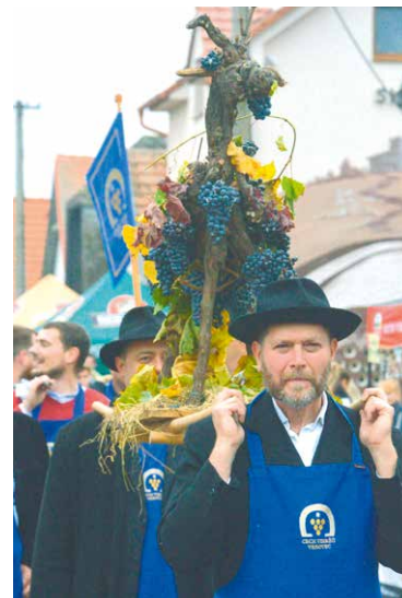
■ Vrbovecké vinobraní.

Největší vinařská událost ve Vrbovecké sklepní ulici je každoroční oslavou ukončení sklizně ve vinicích a příležitostí k oživení starých vinařských tradic. V sobotu 28. října se můžete těšit na průvod vrboveckých radních v dobovém oblečení, slavnostní lisození posledního hroznů za doprovodu muziky i na dávné zvyky – Ručení za Hroznového kozla a Ukládání Hroznového kozla na zimu do sklepa k šenkýřce, anebo na obdarovávání vinařů. A samozřejmě nebude chybět ani čerstvý burčák, mošt, mladé víno, spousta dobrot na zub, zpěv a cimbál.