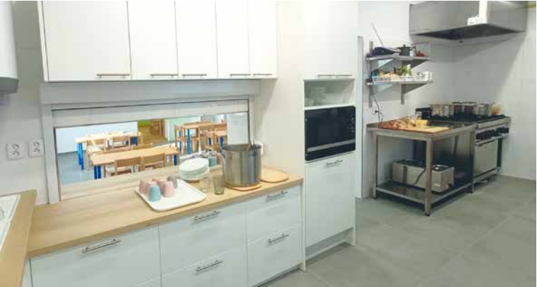
■ Nová kuchyně školy v Mramotících.

ké rozvody a výmalbu. Přibýlo také kontejnerové stání. Děti z MŠ na náměstí Armády už využívají nové hřiště. Na zahradě jim přibyla moderní barevná herní plocha s umělým povrchem a vyobrazením různých herních prvků. Zcela nová třída pak přibyla v MŠ na Slovenské ulici. Určena je pro děti od 2 do 3 let. Třída vznikla rekonstrukcí dvou místností bývalé školní družiny a doplnila tak nabídku předškolního vzdělávání pro děti mladší než 3 roky. Třidu, která by přednostně nabízela místo i tak malým dětem, zatím město nemělo.