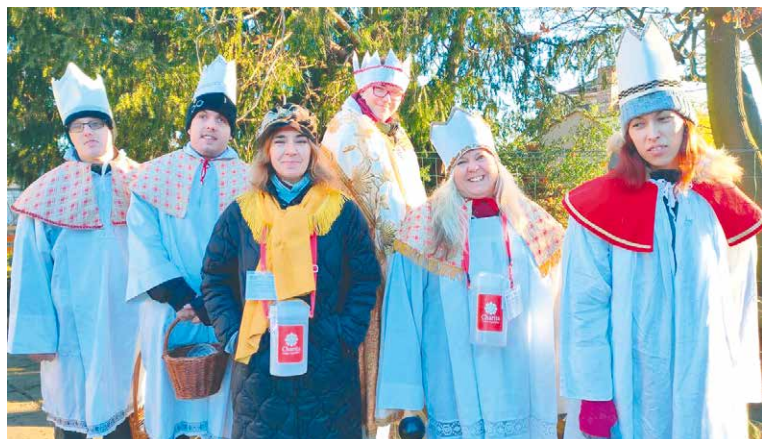
■ Od 1. do 15. ledna chodili městem v menších i větších skupinkách koledníci Tříkrálové sbírky.

Oblastní charita Znojmo slaví v tomto roce 30 let od svého založení. A slavit začala hned s nástupem nového roku, a to prací. Jako každý rok v lednu vyrazili do ulic města a do obcí koledníci Tříkrálové sbírky.