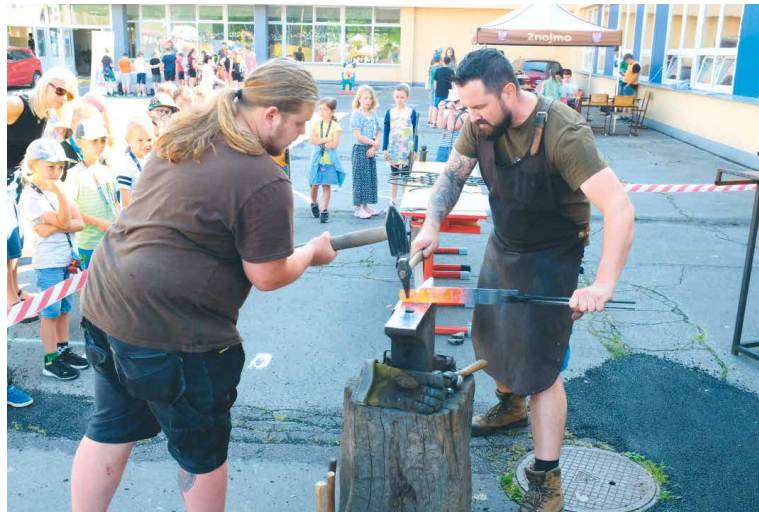
■ Vydařený Den povolání na Marešce.

„Podařilo se nám oslovit nejen znojemské střední školy či odborná učiliště, ale zavítaly k nám také nejrůznější firmy či sportovní oddíly. Samotný výběr budoucího povolání je častokrát považován za velkého strašáka, ale díky přibývajícím oborům či vzniku nových profesí se na trhu práce objevuje opravdu široké spektrum konkrétních povolání. A vybrat si správně to, co by nás naplňovalo, dělalo by nás šťastnými, to je jedna velká alchymie. O rozlousknutí této záhady se snažíme napříč veškerými aktivitami, a to například prostřednictvím besed s nejrůznějšími středními školami a odbornými učilišti, dále exkurzemi na úřadu práce a v neposlední řadě také již zmiňovaným