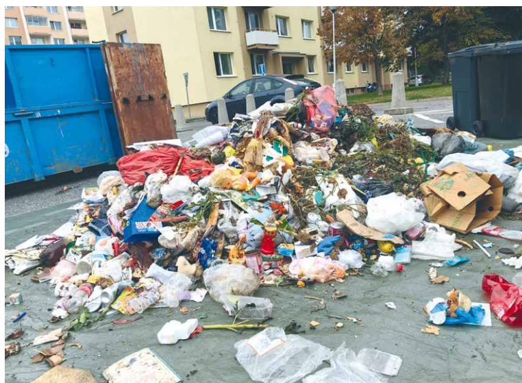
■ Fyzická analýza odpadu proběhla na parkovišti náměstí Svobody. Popelářské auto přinášelo obsah popelnic, který byl roztríděn na jednotlivé složky.

Do soutěže, která souvisela s fyzickou analýzou odpadu, se zapojilo 55 čtenářů, kteří odpověděli na otázku: Kolik procent z celkového množství odpadu by šlo ještě vytrít? Správnou odpověď B: 40–60 % poslalo 24 soutěžících, z nichž tři vylosovaní výherci získali volné vstupenky do nového Bazénu Louka. dm