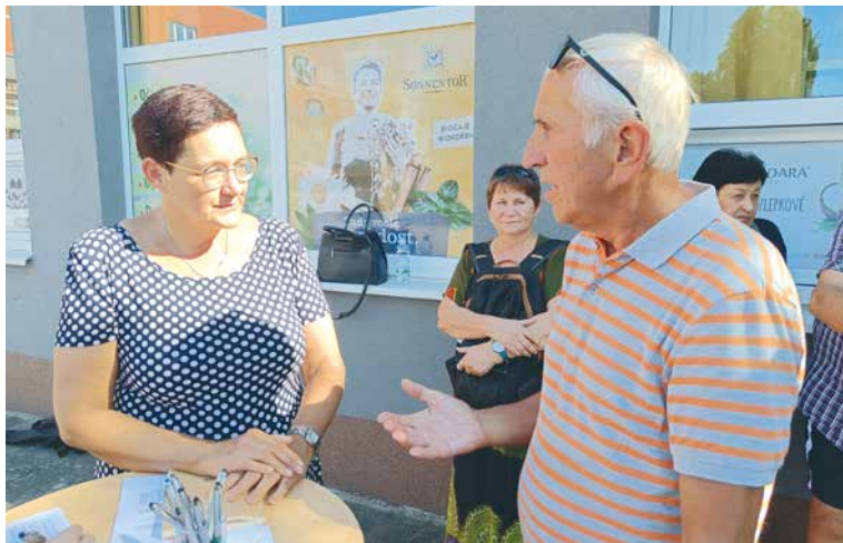
■ Starostka Ivana Solařová na setkání s občany.