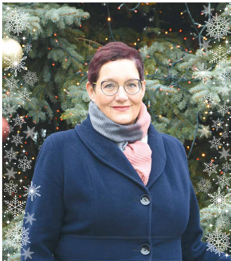
■ Ivana Solařová, starostka města Znojma