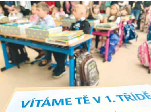
■ V září usedly děti nejen do školních lavic, ale také si některé z nich vybraly volnočasový kroužek.