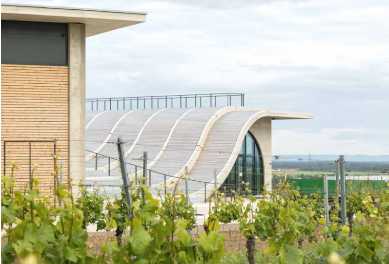
■ Vinařství Lahofer. Architektonický skvost si můžete prohlédnout se sklenkou vína v ruce i během mnoha koncertů, které zde v rámci Hudby na vinicích o prázdninách nabízí.

Kdo si chce vychutnat lahodnou sklenku vína s přáteli v jedinečném prostředí, ten jistě ocení tipy na místa, kde se víno snoubí se zajímavými stavbami a originální architekturou. Znojmsko a Podýjí nabízí celou řadu výletních cílů, ale jejím nejznámějším lákadlem pro místní i turisty je bezesporu víno. Degustace navíc zpestřují program řady kulturních a společenských akcí v regionu. A právě na takové zve destinační společnost ZnojmoRegion. Letos vám nabízí zajímavé spojení vína a architektury. Svou sklenku lahodného moku si tak můžete vychutnat nejen ve sklepních uličkách uprostřed vinic, ale i v unikátním prostředí s nezaměnitelným architektonickým rukopisem. Na své si přitom na Znojmsku přijdou jak milovníci historických památek a lidového stavitelství, tak příznivci moderních slohů. Stavba nového sídla v originálním a designově čistém stylu je totiž v posledních letech určitým trendem