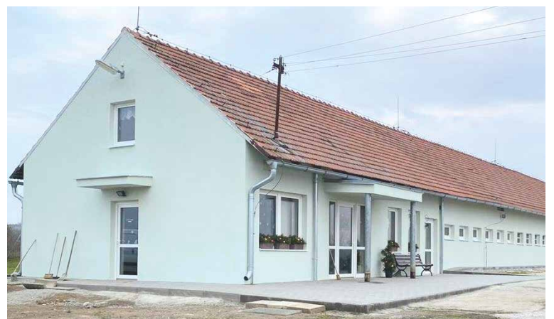
■ Městský útulek v Načeraticích s novou fasádou.

Realizace návrhu byla koncipována do několika etap, aby byl dodržen stanovený nejvyšší rozpočet participativního rozpočtu, tedy 750 tisíc korun. Nakonec ale bylo rozhodnuto o kompletní rekonstrukci celé budovy. Útulek dostal nové vnější omítky, nový okapový chodník kolem objektu a novou zpevněnou plochu u vstupu do objektu. Zrekonstruován byl dokonce i vstupní přístřešek. Část objektu, která je určena pro kočky, byla zateplena, včetně stropů, a byla vyměněna