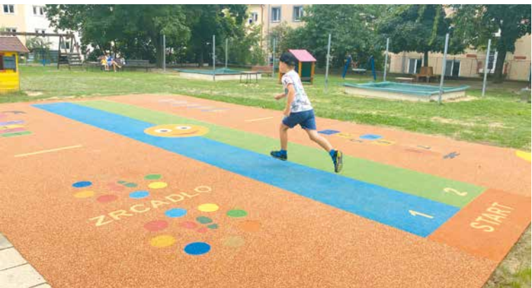
■ Netradiční povrch hřiště ve škole na nám. Armády.