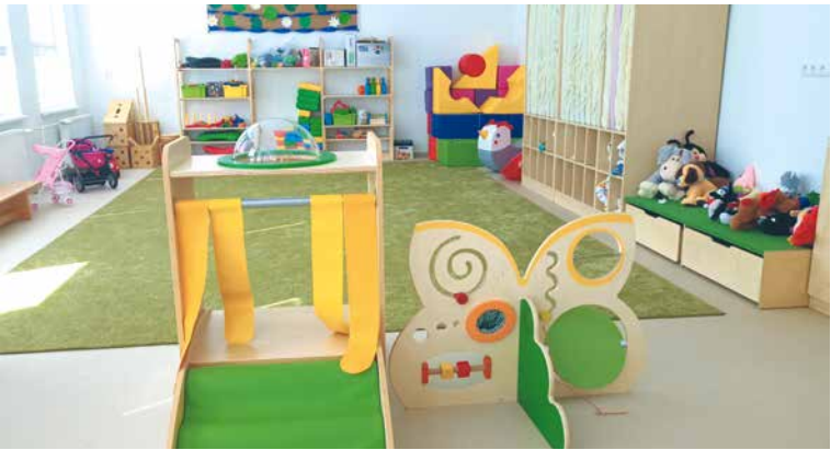
■ Nová třída ve škole na Slovenské ulici.