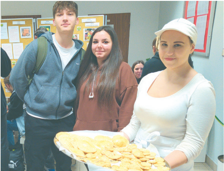
■ Upečený židovský chléb nabízeli žáci na tematické výstavě v budově školy.