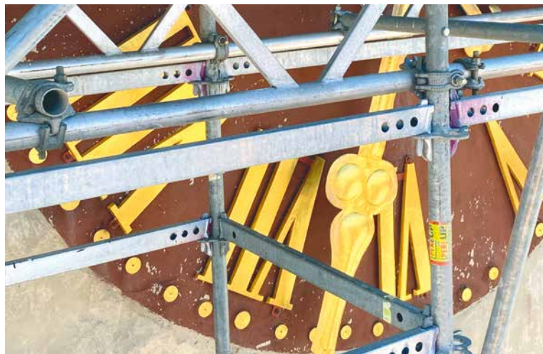
■ Zatím jsou ještě pod lešením, ale renovací projdou i věžní hodiny.