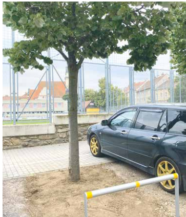
■ Počet parkovacích míst se instalací zábran nezmění.

První opatření k záchraně stromů provedli pracovníci městské zeleně už loni. „Provedli jsme hloubkovou injekci s aplikací hydrogelu a pro-