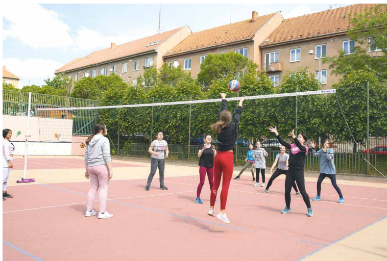
■ Venkovní hřiště základní školy na ulici Mládeže.

V areálu MŠ na náměstí Armády město chystá novou herní plochu včetně barevného vyobrazení prvků. Na MŠ Holandská se počítá s výmalbou a výměnou podlahové krytiny ve třídách. Nové podlahy budou mít i děti v MŠ na ulici MUDr. Jana Janského. V přímětické školce se dočkají dokončení rekonstrukce plotu, v MŠ na Pražské se opraví zahradní domek a vymaluje se kuchyně. MŠ Dělnickou čeká mimo jiné výměna plynových kotlů a v mramotické školce se pracuje na rekonstrukci kuchyně.