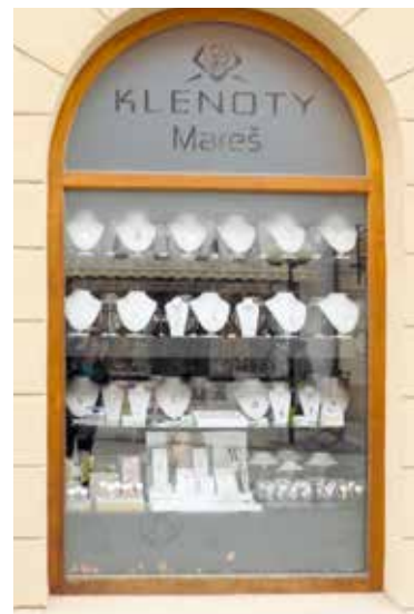
■ Vzorové řešení polepů na Klenotnictví Mareš. Původní, nevhodný stav (vlevo) byl nahrazen novým.