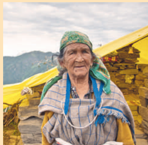
■ Z návštěvy v Himalájích.

V neděli 19. března si budete moci užít večer ve společnosti filmového festivalu Expediční kamera 2017. Celovečerní promítání filmů o dobrodružství, divoké přírodě, poznávání nového, o extrémních zážitcích i sportech uvidíte v Domě Na Věčnosti (Velká Mikulášská ul.). Program je rozdělen do dvou bloků. Blok A začíná od 18.00 hodin a postupně nabídne filmy Pura Vida (cyklistika na vodě, Švýcarsko), Projekt Moffat (hory a lezení, VB), Návrat do Zanskaru (himalájská expedice, VB) a Cesta do Kazbegi (cyklistická výprava, USA). Přibližně od 19.45 pak začíná blok B s nabídkou filmů Na jeden nádech (podvodní fotografování, USA), Big Wall Party (lezectví, USA), Divočinou Aljašky (čeští vodáci na Aljašce, ČR). lp