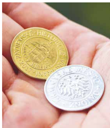
■ Mnoho lidí si originální suvenýr z největšího vinobraní v České republice ponechává na památku.

Na mincích, speciálně vyražených vždy jen pro vinobraní, je po-