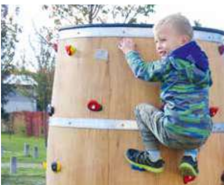
■ Na hřišti se sudy v budoucnu přibudou ještě další hrací prvky.

Na hřišti na Úprkově ulici je postavená velká prolézačka se skluzavkami, lanová pyramida, vláček s vagony a dvě pružinová houpadla. Ale tím tu práce nekončí. V plánu je doplnit další prvky, jako jsou houpačky, skluzavka či další prolézačka. V blízkosti Louckého kláštera vzniklo hřiště s vinařskou tematikou.