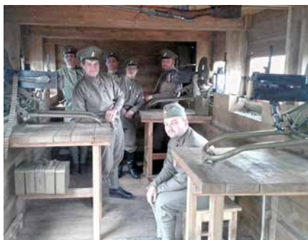
■ Legiovlak představuje naši vojenskou historii široké veřejnosti.

Legiovlak představuje naši vojenskou historii veřejnosti. Zaměřuje se pře-