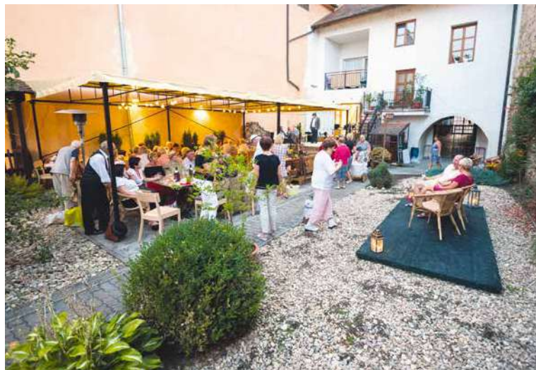
■ V atriu Chatky najdou lidé příjemnou zahrádku k posezení. Mázhauz, který je zaklenut čtyřmi poli křížové klenby, zaujímá celou přízemní část historického domu.