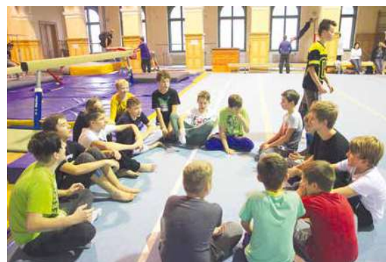
■ Parkour je moderním sportem 21. století. Aby byl vždy bezpečný, učí ho na workshopech zkušení instruktoři.

Všichni trenéři Zohir workshopu mají trenérské licence na parkour třídy B a zkušenosti s vedením sportovního tréninku. Techniky během parkour