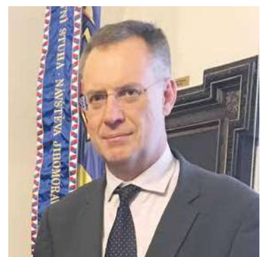
■ Diplomat Johan Oberholzer na znojemské radnici.

V této souvislosti, jen dva dny před otevřením haly ve Znojmě, přijal starosta na radnici diplomatické zastoupení Jihoafrické republiky v osobě Johana Oberholzera, Chargé d'affaires a.i. Jiho-