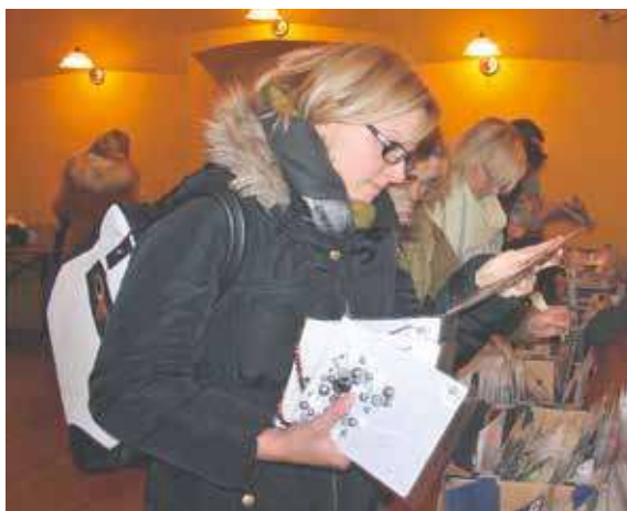
■ Šmukbazar je charita, na které můžete starou parádu vyměnit za novou.

Bižuterii čili šmuky (vždy zabalené samostatně v uzavřeném sáčku), šátky a šály můžete věnovat až do 27. listopadu. Sběrná místa jsou: prodejna