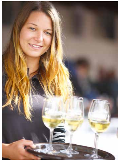
■ Burčákfest bude i s vínem.

Burčákfest, na který se můžete vydat 29. a 30. září do areálu Louckého kláštera, přinese novinku. Největší lákadlo – šlapání vína bosýma dívčima nohama – poprvé doplní muzika svižné bluesové formace Charlie Slavík Revue.