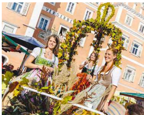
■ Vinobraní v Retzu