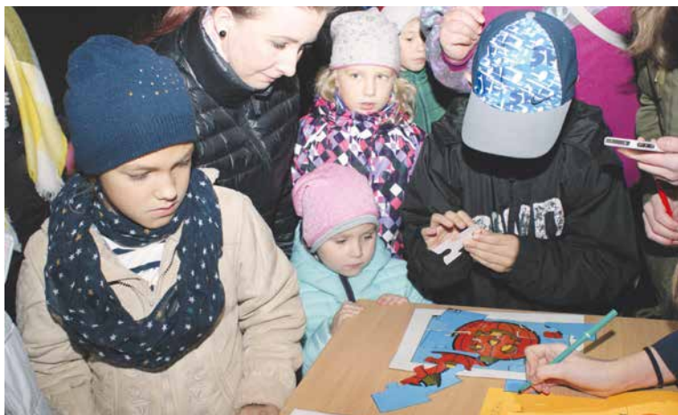
■ Přijďte si užít Dýňovou stezku.

zakoupit výrobky uživatelů zařízení charity nebo se zahřát teplým nápojem. Jediný den v roce si také můžete na náměstí opéct špekáčky na ohni. Přijďte se podívat 6. října od 18.30 do horního parku. Start je u vstupu do parku z Komenského náměstí (u lékárny). lp