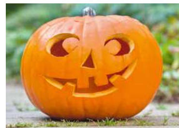
■ V dílně budou i dýňová strašidla.

Na dva dny 26. a 27. října mohou rodiče zapsat děti ve věku od 6 do 15 let do její výtvarné dílny v ateliéru ArtFashion. Najdete ho na ulici Přemyslovců 8 ve Znojmě, naproti vstupu do areálu pivovaru. Děti se mohou těšit na společné hry, procházky a podzimní tvoření. V celodenním programu je zahrnutý také oběd a pitný režim. Přihlášky a další informace získáte na tel. 602 395 544 a na adrese hlobilovaiveta@seznam.cz. Na umělecky zaměřeném prázdninovém kurzu se rozhodně nikdo nudit nebude. lp