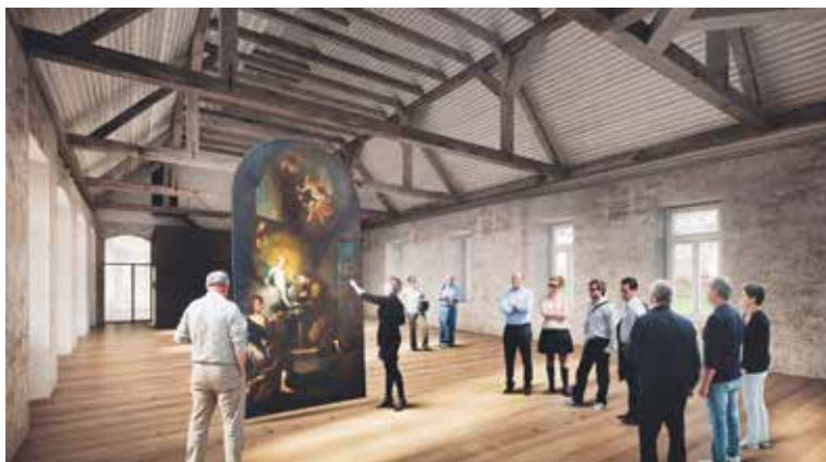
■ Sál s kapacitou dvě stě míst bude mít multifunkční využití na výstavy, besedy, plesy, menší konference a další společenská setkání. Vizualizace

Opravené je už pítko na Obrokově ulici a v příštím roce je v plánu oprava kašny na Masarykově náměstí. „Stejně tak budeme teď směřovat naši pozornost k Městskému lesíku a k venkovnímu kluzišti. Samozřejmě víme, že město potřebuje obchvat nebo nový krytý bazén. Na tomto taky pracujeme, i když to možná není na první pohled vidět – je to totiž běh na dlouhou trať. Od Fóra si slibujeme, že občané přijdou i s jinými věcmi, které je trápí a které je možné řešit relativně rychle,“ vysvětluje myšlenku Fóra starosta Vlastimil Gabrhel.