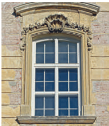
■ Podoba nového okna kláštera v Louce.

Postupně se namontovalo do pěti pater pětáct nových oken, která jsou ručně vyrobená a kopírují vzhled historických oken, která byla původní. Pro všechna okna je jednotné, že jsou kastlová, otvírají se dovnitř, s jednoduchým zasklením. Vyrobená jsou z masivního modřínu s nátěrem v barvě matné slonové kosti a doplněna masivními modřínovými parapety. V investicích do dalších nových oken v Louckém klášteře chce město pokračovat i letos. O postupu prací budeme informovat nejen ve Znojemských LISTECH. zp