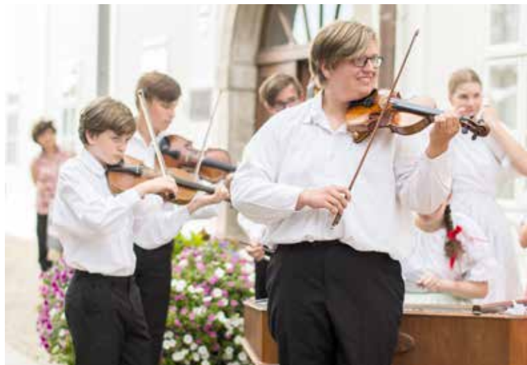
■ Na jubilejním pátém setkání zahraje pět cimbálek.

boru Dyjavánek) a děti z Hudebního kroužku při Základní škole Mládeže ve Znojmě. Organizátoři připravují i hudební překvapení v podobě hosta. Vstupenky za 100 korun zakoupíte na místě. lp