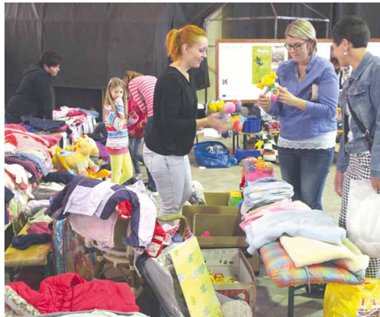
■ Vstup na Bazárek je zdarma a nakoupit můžete za skvělé ceny.

Bazárek tak pravidelně pomáhá na několika úrovních. Těm, kteří pomoc druhých potřebují ze sociálních důvodů, ale i třeba dětským pacientům, kterým se snaží zpříjemnit pobyt v nemocnici. Vstup na Bazárek v jízdárně Louckého kláštera je zdarma. lp