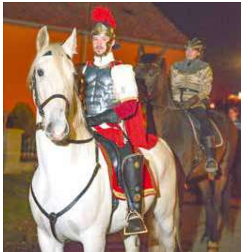
■ Svatý Martin na bílém koni povede průvod od dominikánského kláštera dvakrát.

Příchozí nebudou ochuzeni ani o průvod sv. Martina na bílém koni. Společně se Znojemskou Besedou ho připravuje vinařská firma Navajm. První průvod vyjde od kláštera dominikánů v 17.00 hodin, projde městem a skončí u Vlkovy věže, kde bude pro