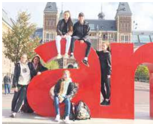
■ V krásném Holandsku gymnazistům angličtina jen svištěla.

a po zhlédnutí filmu Batavia o válečné lodi ze 17. století také zakotvenou rekonstrukci loď prolezli. Na závěrečné diskotéce se s našimi gymnazisty sešly asi čtyři stovky studentů ze všech holandských výměnných pobytů. lp