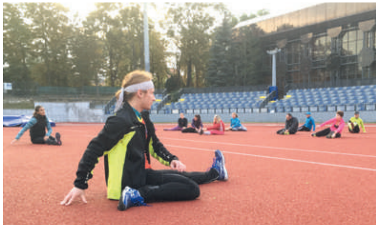
■ Zaběhat si můžete i na atletickém stadionu v Horním parku.