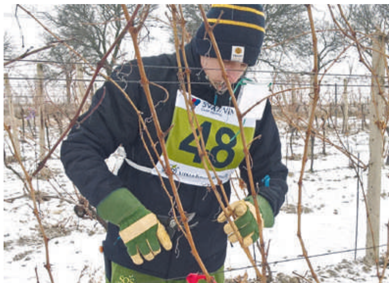
■ Řez probíhal ve školní vinici na odrůdě Frankovka, stáří výsadby deset let.