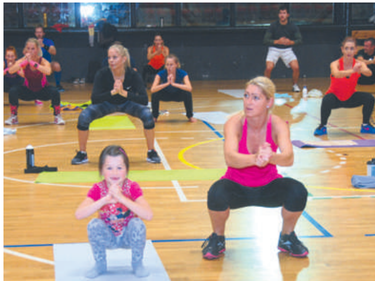
■ Cvičit mohou společně děti a dospělí.

16.00–17.30 Šachy (8–17 let) – Budova SVČ Znojmo, ulice F. J. Curie 16.00–17.00 Florbal pro děti ve věku 9–11 let – Medclub Znojmo, Jana Palacha 16.00–17.00 Tygrčici 1 – pohybové aktivity pro nejmenší (5–7 let) – Tělocvična ZŠ Slovenská 17.00–18.30 Stolní tenis pro všechny od 7 do 70 let – Tělocvična ZŠ Pražská – vstup z ulice Legionářská