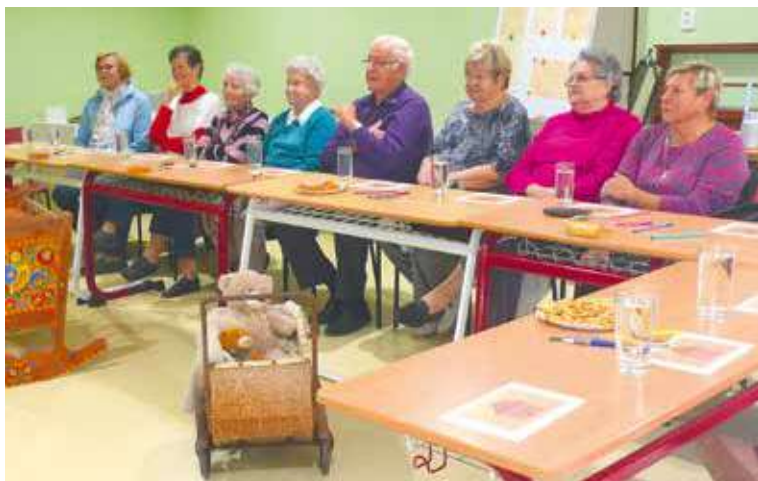
■ Reminiscenční odpoledne vyvolalo u seniorů vzpomínky.