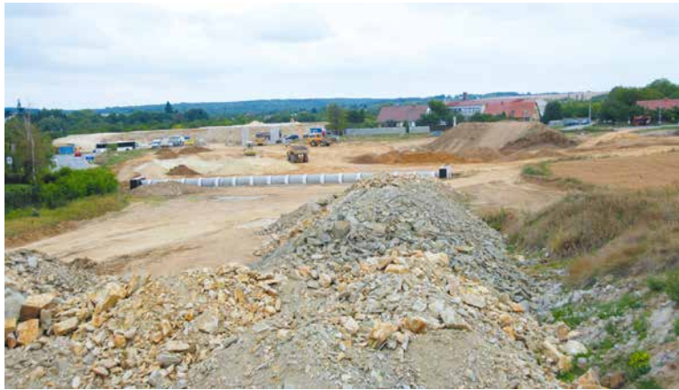
■ Pohled od židovského hřbitova na Přímětickou ulici.

V příštím roce se bude pokračovat odtěžením konsolidací, prováděním