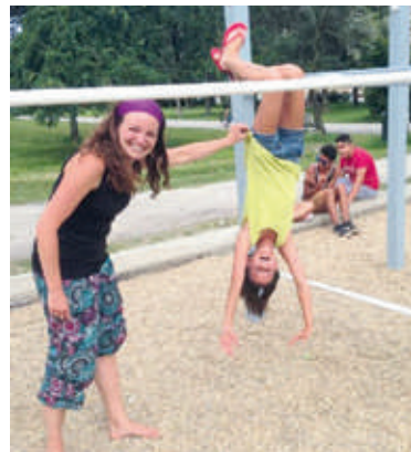
■ Pracovníci Klubu Coolna se snaží mladým lidem ukazovat, jak smysluplně trávit volný čas, a zároveň na ně preventivně působí, aby „nespadli“.

„Veškeré naše aktivity směřujeme tak, aby rozšiřovaly našim klientům obzory, učily je novým věcem nebo nabízely jiný úhel pohledu na jejich život. Na každý měsíc plánujeme program, který se nese v duchu nějakého aktuálního preventivního tématu. Je na klientech samotných, zda se programu zúčastní nebo ne. Máš problém nebo nápad, se kterým potřebuješ pomoci? Přijď, dveře máš otevřené. Docházku neděláme, klienti jsou tady dobrovolně. Chtějí-li na sobě makat, dodržují pravidla klubu, která jdou ruku v ruce