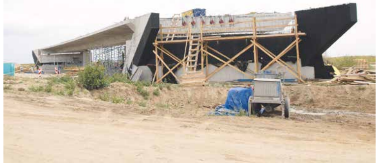
■ Napojení na Jihlavu.