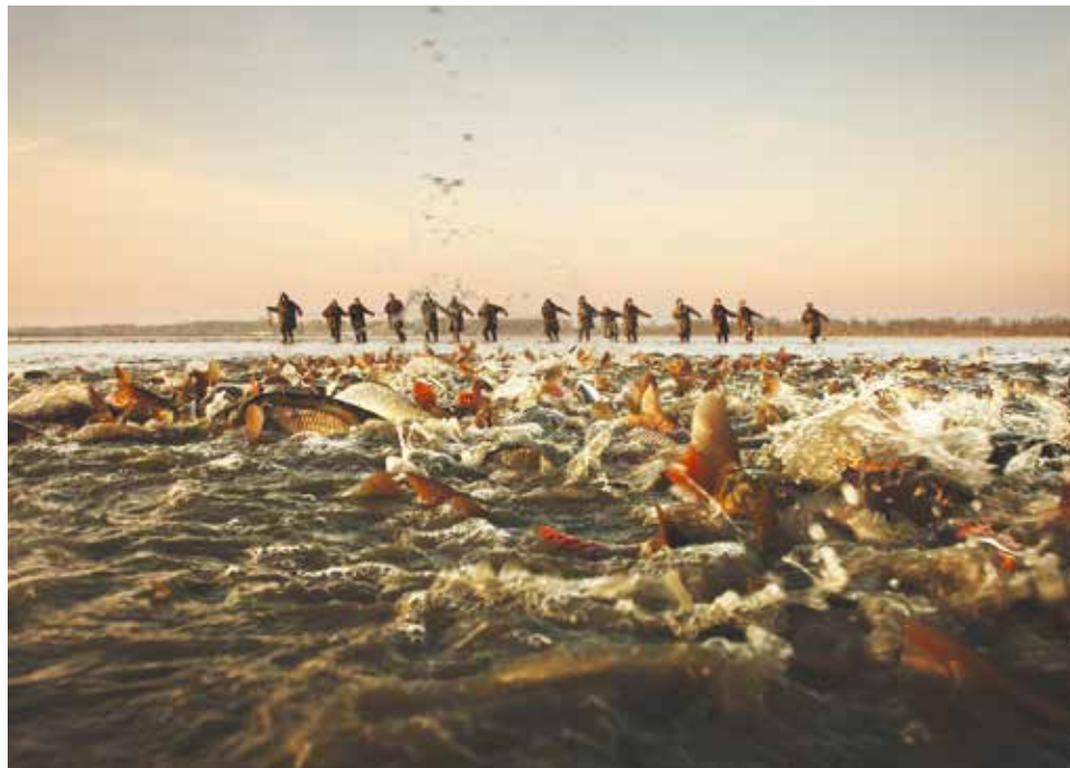
■ Vítězný snímek Zdeňka Dvořáka nese název Když voda vře.

lehce omluvně úspěšný fotograf, který přiznává, že jeho snímek byl z velké části i náhoda. „Fotím výlov několik let. Udělal jsem těch snímků stovky. Snažil jsem se i teď zachytit podobnou atmosféru, ale žádný se už nepovedl tak, jako ten vítězný. Zkrátka je to i o štěstí,“ dodává Zdeněk Dvořák. Fotografie roku pilotního ročníku soutěže