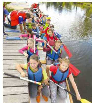
■ Nejmenší lodníci.

Od 10.00 do 18.00 bude možné nasednout do dračích lodí, minikajaků, rychlostních závodních lodí, cestovních turistických kánoí, kajaků nebo pramic. K dispozici budou i paddleboardy, aquazorbing nebo šlapadla. Program pro veřejnost bude připraven i na břehu. Od 10.00 do 19.00 hodin se můžete těšit na horolezeckou stěnu, skákací atrakce, malování na obličej nebo půjčovnu koloběžek. Jezdit bude