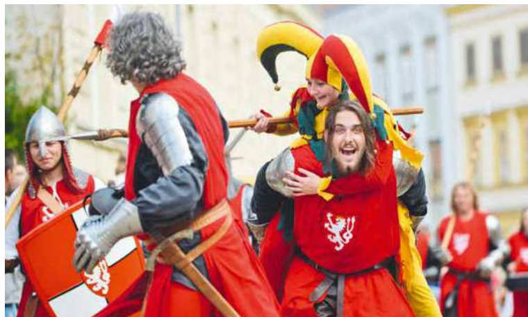
■ Vinobraní je vždy tak trochu potměšilé, hodně veselé a hlavně hrdé na svůj kraj.