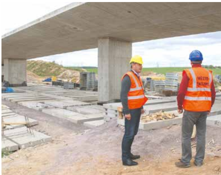
■ Stavbu mostu u nemocnice pravidelně kontroluje starosta Znojma Vlastimil Gabrhel.

Práce bedlivě sleduje i starosta Znojma Vlastimil Gabrhel. „Na kontrolních dnech jsme průběžně informování o průběhu stavby a je velice příjemné slyšet, že práce pokračují podle harmonogramu. Dokonce tu byla snaha celou výstavbu zrychlit a dokončit kompletně obchvat,