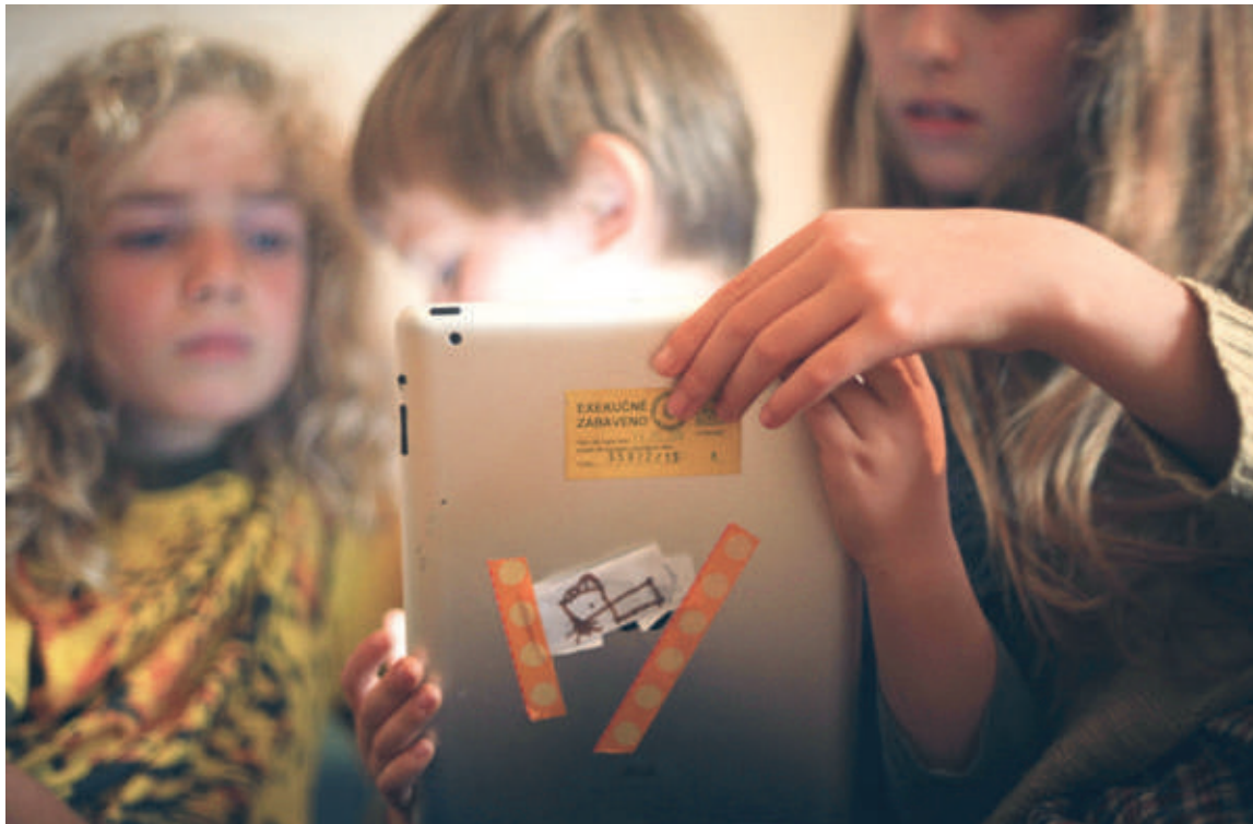
■ Festivalový snímek Exekuce odhaluje praktiky českých exekutorů. Na Jednom světě ho uvidíte 23. března.

A jako každý rok, i tento ročník festivalu pamatuje na žáky a studenty. Speciální projekce pro školy jsou připraveny od 23. do 28. března. Více na str. 5.