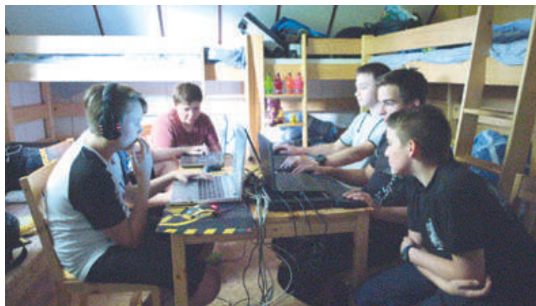
■ Ve filmu Děti on line režisérka Kateřina Hager ukazuje na portrétech tří mladých lidí, jak těžké je dospívání i výchova dětí v době, kdy se většina zábavy i hrozeb přesunula do kyberprostoru.

Snímek přináší vzácně bezprostřední vzhled do každodenního života islamských radikálů. Jak přemýšlejí, jak žijí, v čem se od nás liší, bojí se, pochybují? Jediný portrét fanatického islamismu.