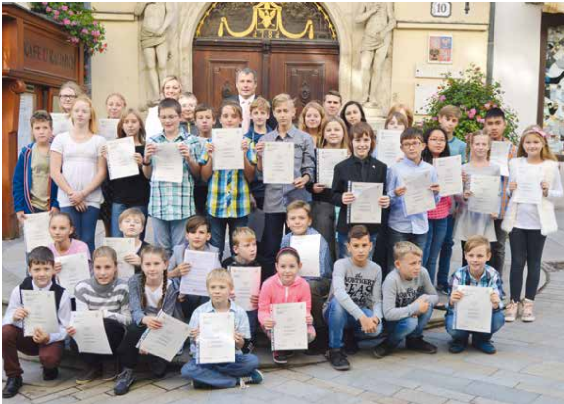
■ Tihle žáci umí anglicky. Za jejich snahu je odměnil i starosta Znojma Vlastimil Gabrhel (v poslední řadě uprostřed).

„Část Znojmo mluví anglicky jsme v projektu Kolumbus zavedli kvůli zvýšení konkurenceschopnosti Znojmáků na trhu práce. Jsem velice rád, že rodiče ve výuce jazyků své děti podporují a využívají možnosti nechat si jazykové certifikáty radnicí proplatit,“ řekl starosta. Více informací o projektu na www.znojmokolumbus.cz .