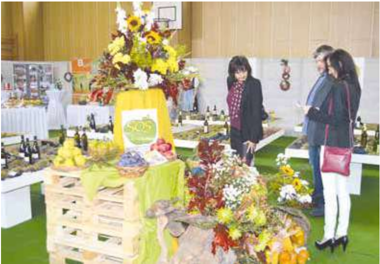
■ Výstava byla oživena květinovým aranžmá, venkovní ukázkou moderní zemědělské techniky a prodejem školních pekařských a cukrářských výrobků. Na snímku si výsledný efekt prohlíží hosté z rakouského Poysdorfu.