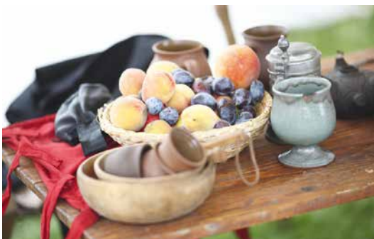
■ Středověká krčma nabídne dobovou krmi.

Na pravé středověké hostině ochutnáte v krčmě dobové speciality vybrané ve spolupráci s pražským Muzeem gastronomie. „Připraveny budou pokrmy podle receptů z doby Jana Lucemburského, té bude navíc přizpůsoben i styl stolování. Naším přáním je, aby si hosté Středověké krčmy po všech stránkách vychutnali středověký gastronomický zážitek. A na rozloučenou si jako suvenýr třeba odnesli dřevěnou lžici s logem vinobraní, kterou si tu