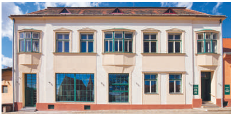
■ Opravená budova pivovaru.

Znojemský městský pivovar v areálu plánuje také vybudování pivovarské