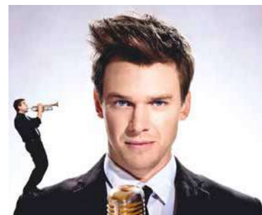
■ Je víc než jasné, že na vinobraní od toho brněnské formace B-Side Band s excelentním hlasem Vojty Dyka pořádně šlápne.