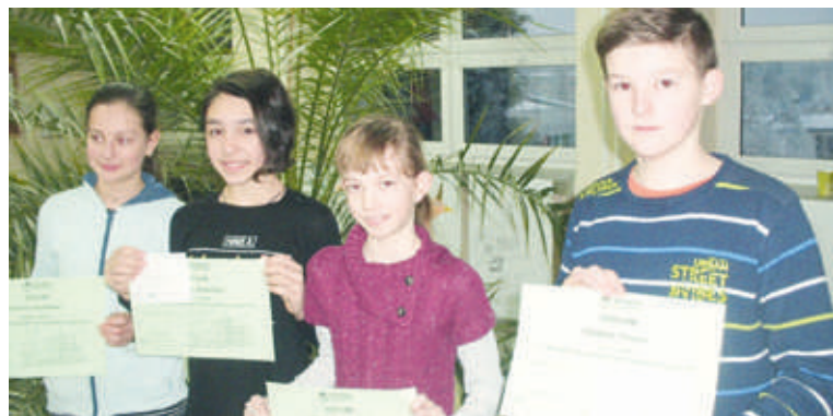
■ Žáci páté třídy, kteří zvítězili v matematické olympiádě.