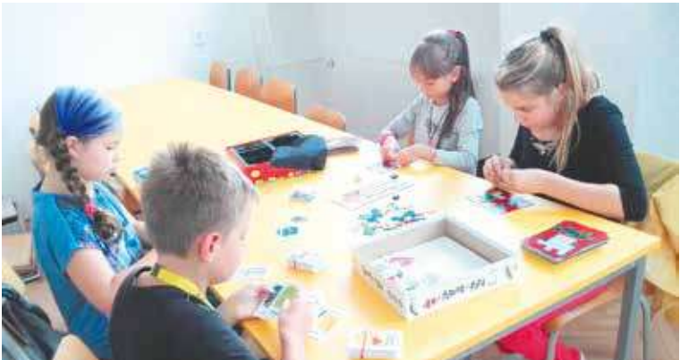
■ Dárek od Pegasu vystačil i na nákup deskových her.