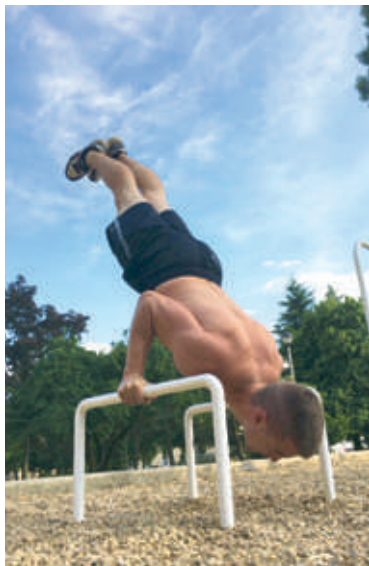
■ Workoutové hřiště předalo město veřejnosti k užívání vloni v květnu. Zájemci ho najdou v Kolonce nedaleko Pražské ulice.