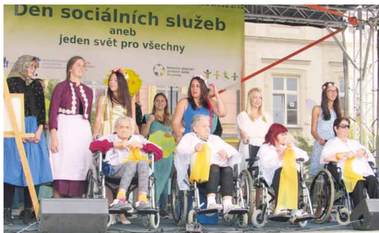
■ Divadelní představení s tématem lásky dvou mladých lidí, sehrané znojemskými studenty a božickými klienty, mělo u publika velký úspěch.

Záříjové akce odstartoval v centru města tradiční Den sociálních služeb. Na Horním náměstí se tak po roce opět sešli různí poskytovatelé sociálních služeb Znojemska, aby veřejnosti představili svoji práci.