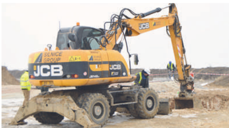
■ Na obchvat již vjely bagry.