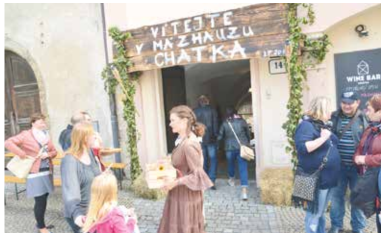
■ Vloni získal odměnu za dobové ztvárnění mázhauz Chatka na Masarykově náměstí.