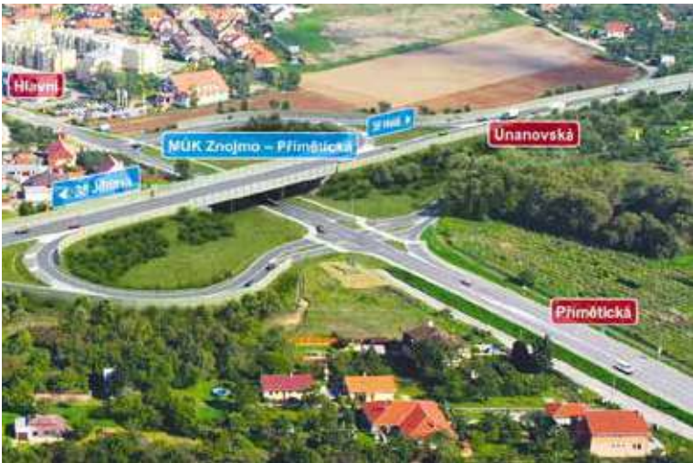
■ V aktuálně budovaném úseku od kasárenské po únanovskou křižovatku bude pět mostů. Ten poslední a největší, na Přímětické ulici, dělníci právě staví.