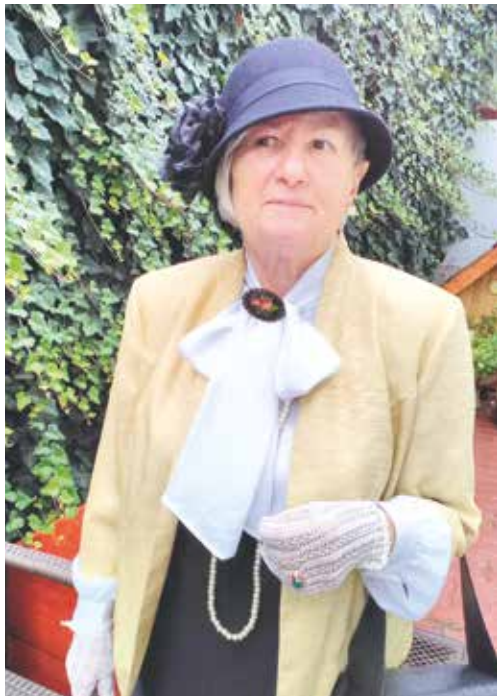
■ Poskládat si kostým a la 20.–30. léta 20. století není tak těžké, jak by se mohlo zdát.