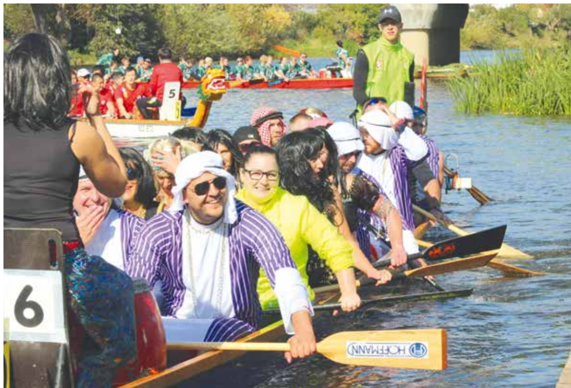
■ Na řece Dyji, u které nikdy nebývá o legraci nouze, se projedou třeba dračí lodě.