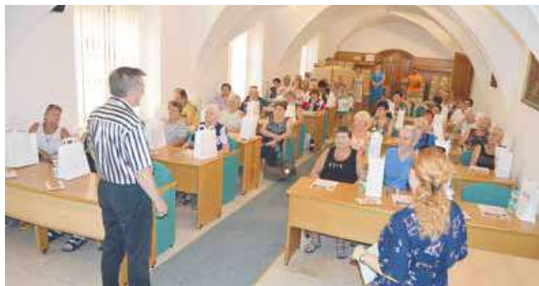
■ Senioři z Chrudimi při přijetí na radnici.