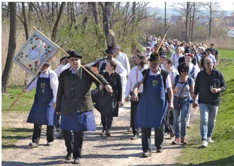
■ Odemykání naučné stezky Hroznové kozy každoročně pořádají Obec Vrbovec, Cech vinařů Vrbovec a Spolek přátel Hroznové kozy.

Návštěvníci v civilním i dobovém oděvu mohou celou trasu projít spolu s průvodem, nebo si mohou vybrat jen její část, jít svým tempem, využít možnosti posezení u jednotlivých ochut-