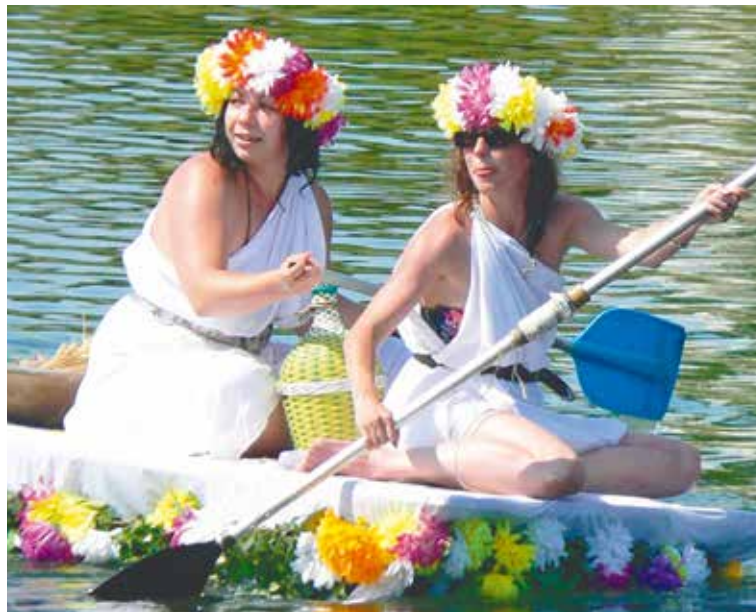
■ Divákům poskytnete i sedmá neckyáda podívanou nad všechny peníze.