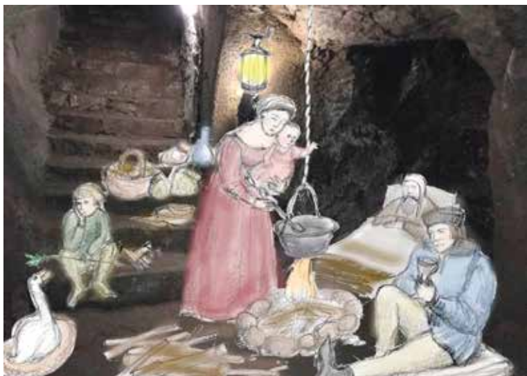
■ Ukázka scén s názvem úkryt před běsněním a požáry, která jako jedna z více scén v podzemí přibude.

Kromě nových figur se budou rekonstruovat i ty stávající. „Rekonstrukce se dočkají figury živočichů v podzemí, skřetů a figura alchymisty. Vše budeme realizovat za plného provozu Znojenského podzemí,“