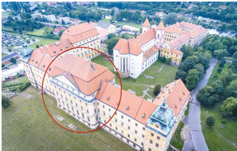
■ Snímek označuje střední část kláštera, ve které je plánovaná výměna oken.

Práce by měly začít na jaře a pokračovat do listopadu. Pro všechna okna je jednotné, že jsou kastlová, otvírají se dovnitř, s jednoduchým zasklením. Vyrobená jsou z masivního modřínu s nátěrem v barvě matné slonové kosti a doplněna masivními modřínovými parapety. Jedná se opět o ručně vyrobená okna, která kopírují vzhled původních historických oken a jejich vzhled schválili památkáři.