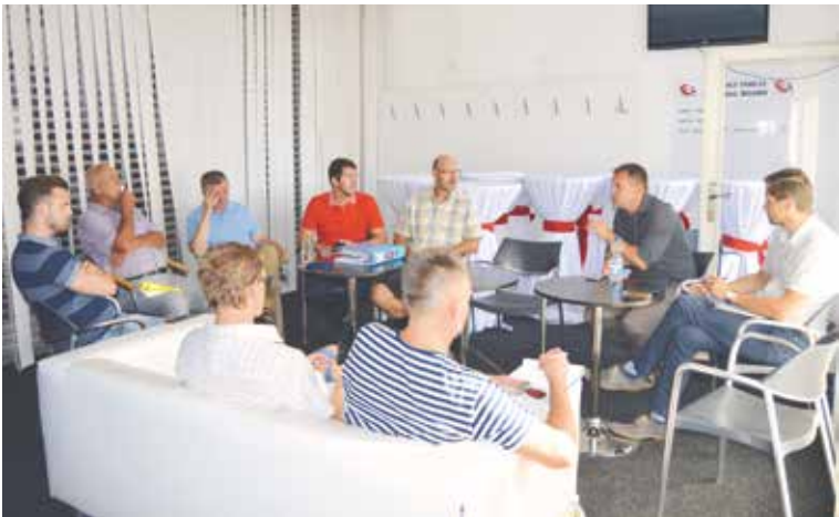
■ Při jednání vedení města s klubem HC Orli bylo pro všechny zásadní, že prim musí na stadionu hrát bezpečnost hráčů i fanoušků.