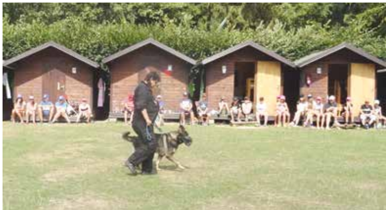
■ Děti na letním táboře ve Zblovicích nejvíce zaujal služební pes.

vyzkoušela vázat uzly a také střilet z airsoftové zbraně. Jejich běh změnil strážník ručním měřičem rychlosti a u nejšikovnějších byla změřena maximální rychlost 22 km/h. Na jednom ze stanovišť byly děti seznámeny také s prvky sebeobrany. Největší úspěch měl ovšem u dětí čtyřnohý fešák, který se předvedl v ukázce výcviku služebního psa. Každý táborník nakonec dostal od strážníků i malou odměnu. lp