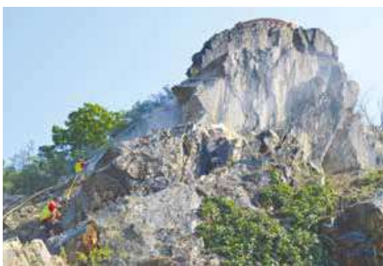
■ Práce na zabezpečení skal.

Vinohrady. Na tuto etapu je potřeba počítat s částkou přibližně 4 200 000 korun. V případě úspěšné žádosti o dotaci by vlastní podíl města činil přibližně 630 000 korun. pm