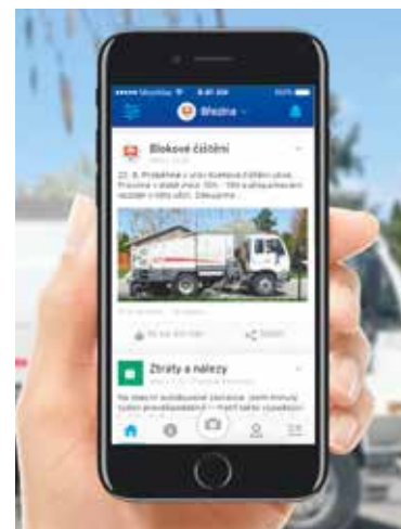
■ Informace o blokovém čištění můžete mít v mobilu.

Dalším modulem, který bude znojemská radnice aktivněji využívat, je hlasování. Pilotní hlasování prostřednictvím Mobilního rozhlasu proběhlo