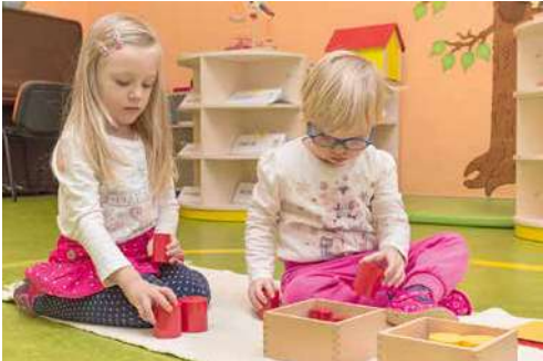
■ Děti pracují ve věkově smíšených kolektivech.

Ve Znojmě fungují Montessori třídy již od roku 2012 jako součást Základní školy Prokopa Diviše v Příměticích. Zápis do 1. tříd zde bude probíhat 7. dubna od 8.00 hodin. Rodiče ale mohou své děti přihlásit po individuální domluvě ( montessori@zsprim.cz ) také do vyšších ročníků, a to od 2. až do 6. třídy.