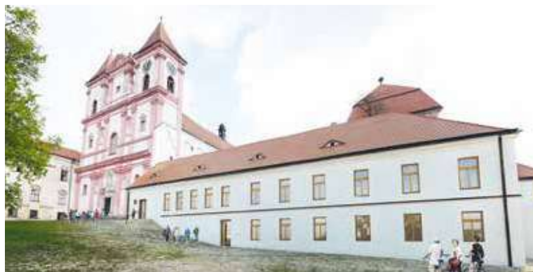
■ Vizualizace, jak bude po rekonstrukci vypadat stará škola vedle kostela sv. Václava v Louce.

Jako příklad dlouhodobě chátrající mimořádné památky byla vybrána