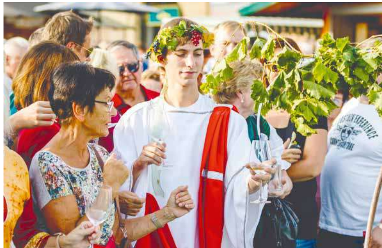
■ Vinobraní v Retzu.

tradičního vinobraní v Retzu. Slavnost, při které teče z kašny víno místo vody, začne v pátek slavnostním vyvěšením vinařského věnce na hlavním náměstí. Jednodenní vstupné v sobotu a v neděli je 5 Euro, v pátek 4 Euro. Děti a mladiství do 14 let mají vstup zdarma. Více na www.retzter-weinlesefest.at . lp