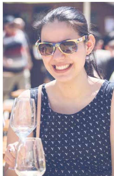
■ Úsměv a Znojmo k sobě patří.

Novým dějištěm kulturního a společenského dění má být od letošního jara i GaP – Galerie a Prostor spolku Umění do Znojma. GaP vzniká v městských prostorách na Kollárově ulici, které město na vlastní náklady rekonstruuje. Lidé zde najdou výsta-