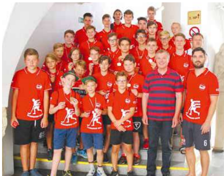
■ Úspěšní florbalisté na znojemské radnici.

Na světových hrách si děti užily: slavnostní zahajovací ceremoniál, olympijskou vesničku, potkaly sportovce ze všech kontinentů