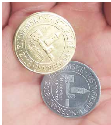
■ Mince, připomínající staré groše, se staly oblíbeným suvenýrem znojmského vinobraní. Na těch letošních je vyražen motiv hradebního opevnění.

Stříbrná mince je originálním suvenýrem evokujícím vzpomínku