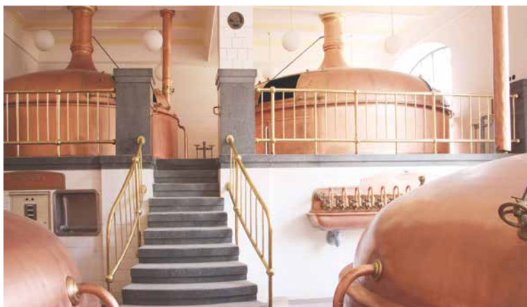
■ V autenticky dochovaném barokním objektu pivovaru se začalo vařit pivo v roce 1720. Na snímku je ceněná varna.

obnovu původního historického stavu. Znojemská varna je zařazena mezi velké stavby. Hlasovat pro ni můžete na tel. 736 301 599 SMS zprávou ve tvaru HLA (mezera) PAMATKY (mezera) příslušné číslo památky. Z každého telefonního čísla lze zaslat pouze jednu SMS zprávu. SMS hlas stojí stejně jako běžná SMS dle tarifu hlasujícího a odpovědní SMS je zdarma. Hlasování probíhá do 1. 4. 2018. Bližší info k soutěži na www.kr-jihomoravsky.cz/pamatky/index.php . lp