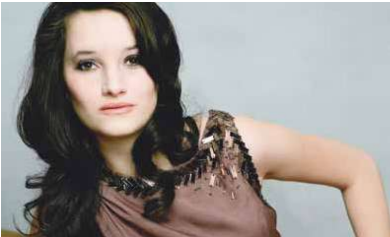
■ Znojmo je jediné v České republice, které si světově uznávaná sopranistka Anna Prohaska vybrala pro svůj úspěšný hudební projekt Had a Oheň . S orchestrem Il Giardino Armonico vystoupí 29. 7. v jízdně Louckého kláštera.

Vedle stálíc programu jako je koncert malých génů, koncert při svíčkách (letos budou pro velký zájem publika dva), piknik v přírodě nebo koncert znojemských hudebníků se