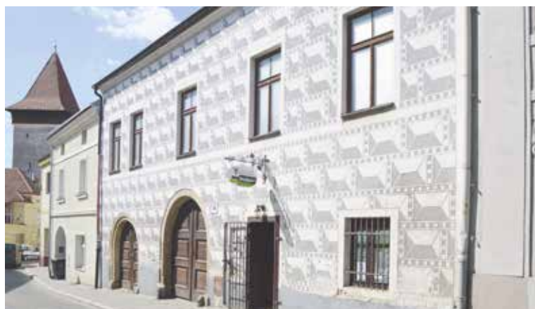
■ Druhá budova Domu umění s původní sgrafitovou fasádou s motivem psaníček. Vstup do ní je z ulice Dolní Česká.

než 3 250 000 korun. Hotovo bude v září. pm