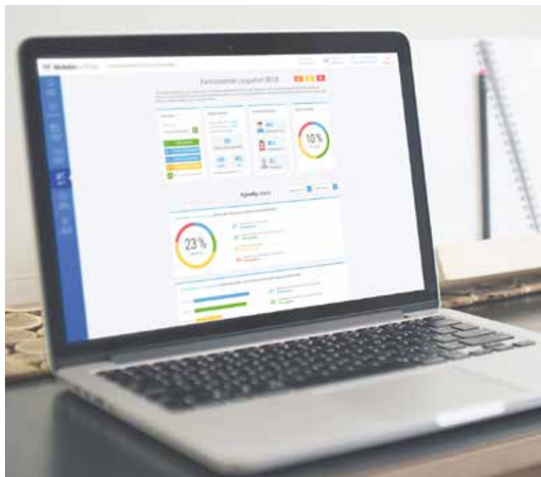
■ Podoba elektronického hlasování pomocí Mobilního rozhlasu.

Je tak nejvyšší čas se do systému Mobilního rozhlasu zapojit! Registrovat se lze na www.znojmo.mobilnirozhlas.cz , aplikace je ke stažení na Google Play a App Store. zp