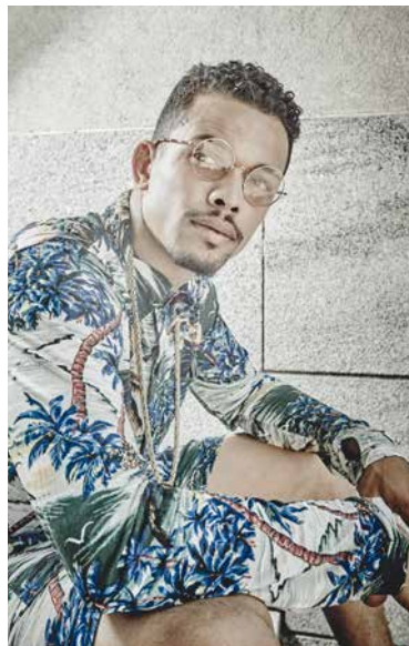
■ Do Znojma se opět chystá i zpěvák „zrající jako víno“ Ben Cristovao.