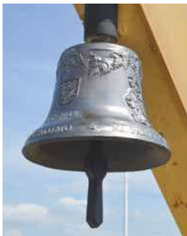
■ Originální grafickou výzdobu zvonu tvoří znak města Znojma, zpodobnění patrona hasičů sv. Floriána a vinná réva.