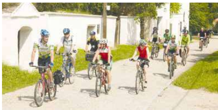
■ Vinařská stezka Šatovem.