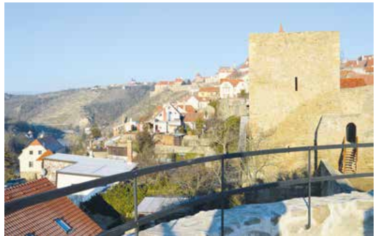
■ Prašná a Nová věž za Kapucínskou zahradou v Jižním hradebním příkopu.

Dům umění připravil na 8. září od 10.00 hod. akci Skrz skříčka vitráže – tvůrčí dílnu pro rodiny s dětmi k výstavě Šťastný život v secesi (nutná rezervace na: edukace@muzeumznojmo.cz , 515 255 261, 720 971 295). A v termínu 10.–12. září na stejném místě najdete edukační program pro II. stupeň ZŠ a SŠ Od Šimonova pivovaru po sbírku obrazů aneb čím vším byl Dům umění? (9.00–11.30).