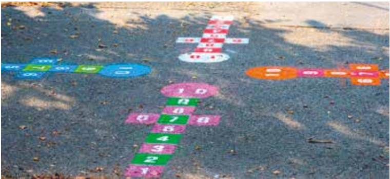
■ Hry na chodníku mohou hrát děti i každý chodec, mladý duchem.

Nabídnout dětem další možnost zdravého pohybu, to je cílem projektu Hry na chodník, do kterého se zapojilo i město Znojmo.