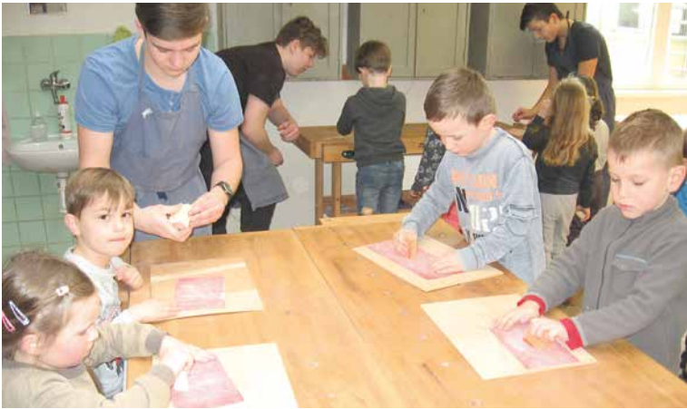
■ Společná práce se oběma věkovým skupinám líbila.

Jako každý rok opět přišly do školních dílen základní školy na ulici Mládeže děti z mateřské školy náměstí Armády, aby se pod dohledem starších žáků naučily novým dovednostem.