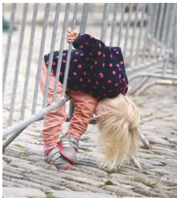
■ Vinobraní utahá každého.

Na nádvoří znojmského hradu k posezení poslouží balíky slámy a jako odkládací stoly dubové špalky. Přinést si můžete své jídlo, pití a maminky zde najdou místo ke kojení.