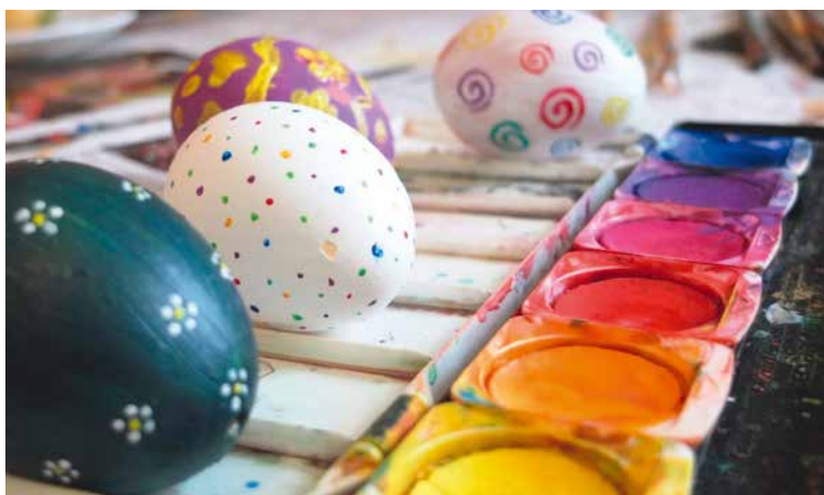
■ Na řemeslných dílnách vyzkoušíte třeba malování vajíček.

Sobota 31. března cílí na historické řemeslné dílny s nabídkou pletení pomlázek, malování kachních vajec, výroby zajců ze slámy a dalších aktivit. Navíc v každou celou hodinu bude vyhlášena soutěž o výrobky z historických dílen. Program pro děti má připravené i Znojenské podzemí, kde děti posbírají velikonoční vajíčka. A máte-li kreativní jarní výzdobu, přihlaste se do soutěže Velikonoční Znojmo o nejkrásnější venkovní výzdobu domů a bytů. Výherci získají třeba volné vstupenky na vinobraní. Mož-