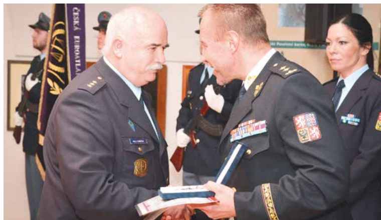
■ Pro oslavy dvacátých narozenin si vedení věznice vybralo krásné a důstojné prostory Louckého kláštera.