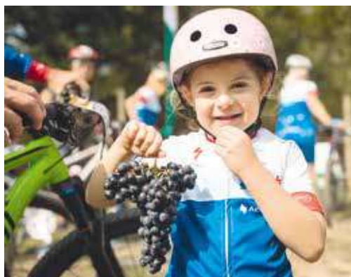
■ S kolem si dobře rozumí i děti.