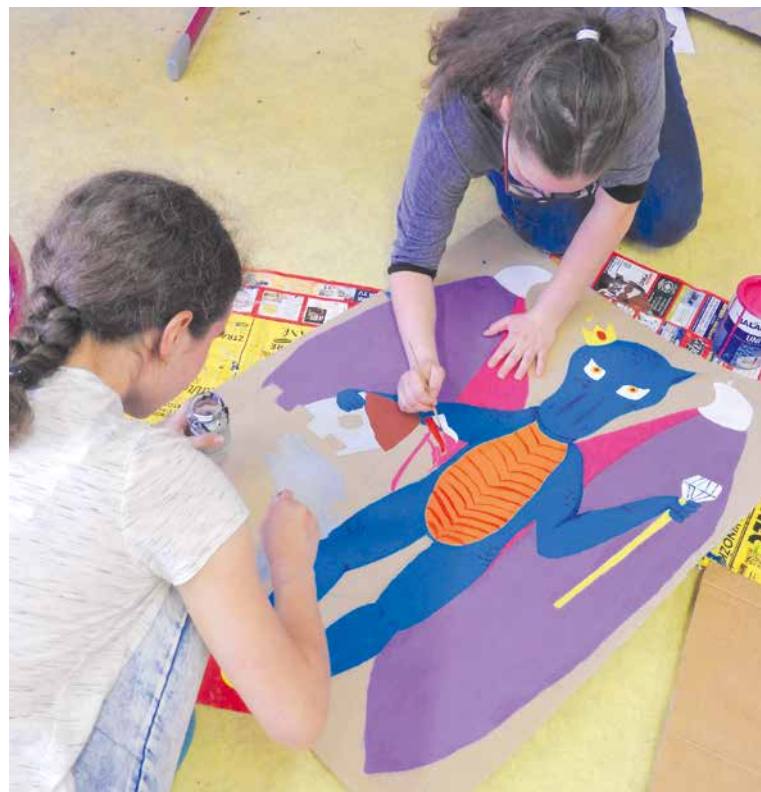
■ Malovat draky byla zábava. Děti je tvořily podle vlastní fantazie dva měsíce. Použily k tomu pevný papírový karton a balakrylové barvy.

výtvarné práce vyrobené vždy pouze z přírodních materiálů. Pracujeme s přírodními jílly, hlínou, semeny, sušenými květy, kameny, listy a další-