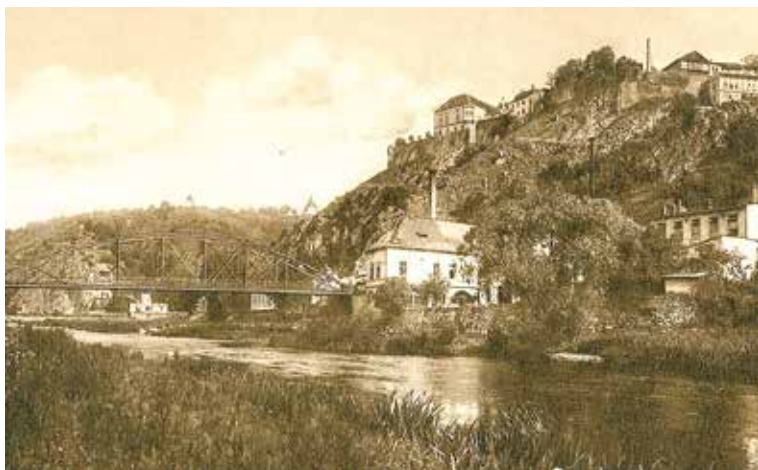
■ Historický snímek mostu.