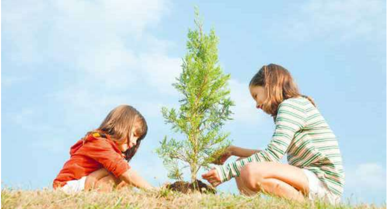
■ Pro děti, které přinesou stromeček zasazený na loňském Dni Země, bude připraven dárek.

Mezinárodní svátek věnovaný Zemi a životnímu prostředí připadá každoročně na 22. dubna. Slaví jej více než miliarda lidí po celém světě, tak se připojte i vy! Vstup je pro všechny zdarma. Více informací na www.znojmo-zdravemesto.cz a na plakátu. zp