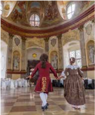
■ Hostina na zámku ve Vranově nad Dyjí nabízí 22. 7. vybrané lahůdky spojené s vínem. Hostinu doprovází hudba a tanec.

Vstupenky a celý program najdete na TIC na Obrokové ulici. Více také na www.hudbaznojmo.cz . lp