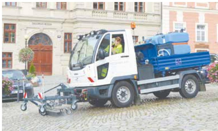
■ Znojmáci již nyní mohou v ulicích města potkat stroj, který bez použití chemie pomáhá udržet upravenou plochu náměstí.

Přidanou hodnotou tohoto přístroje je i možnost mytí. U přístroje