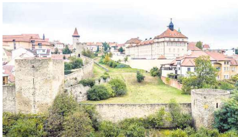
■ Nová prohlídková trasa vede po hradebním opevnění s několika věžemi. Na snímku jsou vidět čtyři z nich – v pozadí Vlkova, před ní (zleva) Psí, Prašná a Nová.