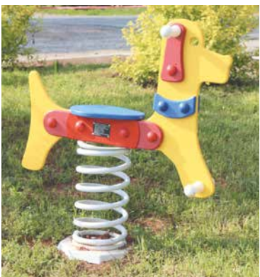
■ Nový herní prvek.

Dětská hřiště dostanou další nové skluzavky i houpačky. Do nových herních prvků na sedmi hřištích investuje město 483 000 ko-