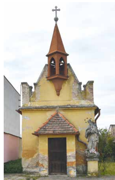
■ Kaplička se sochou sv. Jana Nepomuckého.

Znojmo do opravy kapličky investuje 1,6 milionů korun, přičemž 500 000 korun uhradí dotace z Jiho-moravského kraje. Práce, které by měly skončit do konce listopadu (v závislosti na počasí), provede firma OSP z Moravského Krumlova. V příštím roce se také počítá s restaurováním sochy sv. Jana Nepomuckého. Socha ale stojí příliš blízko kapličky, proto bude po zrestaurování přesunuta o asi 1,3 metru dál na důstojnější místo. zp, lp