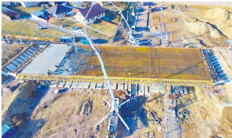
■ Před pár dny bylo dokončeno betonování největšího mostu obchvatu na Přímětické ulici.