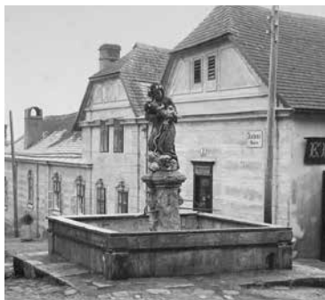
■ Kašna u Napajedelské brány.

V minulém čísle ZL jsme si přiblížili historický vývoj kamenné kašny na Dolním náměstí i její současnou žel zpitvořenou podobu. Dnes budeme v našem seriálu pokračovat dalšími třemi znojemskými kašnami. Tyto spojuje stejný osud: ani jedna z nich už nestojí. V roce 1897 totiž město Znojmo ve snaze přiblížit pitnou vodu občanům města vybudovalo síť pouličních litinových pump, které budou jistě mnozí dříve narození našeho města ještě pamatovat. Pumpy tedy převzaly funkci zdroje pitné vody, a město se tudíž rozhodlo „nepotřebné“ staré kašny odstranit, byť již tehdy se ozývaly prozíravé hlasy, že by bylo záhodno kašny zachovat kvůli jejich historickému rázu a okrase města.