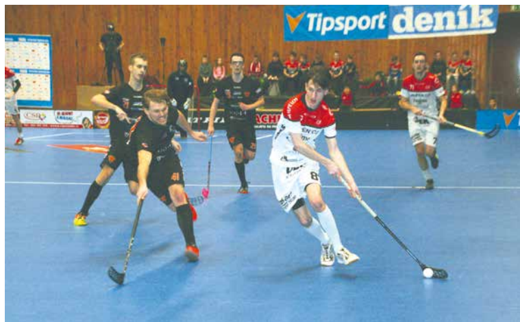
■ První únorové úterý hráli Znojemští na své palubovce v přímém přenosu kanálu ČT Sport a televizní kamery jim svědčily. Brněnské Bulldogs porazili 9:4.