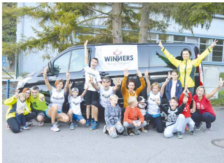
■ Večerní výběh Gránickým údolím a historickým centrem s Winners Nový Šaldorf odstartuje 22. března v 18.00 hodin u Vodáckého centra Stará vodárna.

Kromě běhání připraví Winners i vyjíždku se startem v obci Nový Šaldorf. Na kole za sousedy vyrazí cyklisté 24. března (nutná registrace). Pro zdatnější cyklisty, kteří dávají přednost náročnějšímu terénu, se chystá 31. března trailová vyjížďka Národním parkem Podyjí (vhodné je mít správně odpružené kolo a přilba je samozřejmostí). Nebude chybět tradiční procházka s lesníkem Gránickým údolím (30. března). Na jaře tu chystají Městské lesy i zalesňování, do kterého se veřejnost může aktivně zapojit. O jeho termínu budeme informovat. Veškeré informace naleznete na www.znojmo-zdravemesto.cz a na facebookových událostech samotných akcí. pm