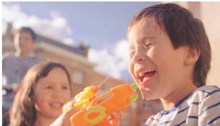
■ Bohové z Molenbeeku.

Vstupné je symbolických 80 korun / 40 korun pro školáky. Kino Svět disponuje i plošinou pro bezbariérový vstup.