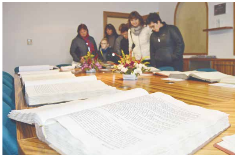
■ Kvidění budou i kroniky města Znojma.