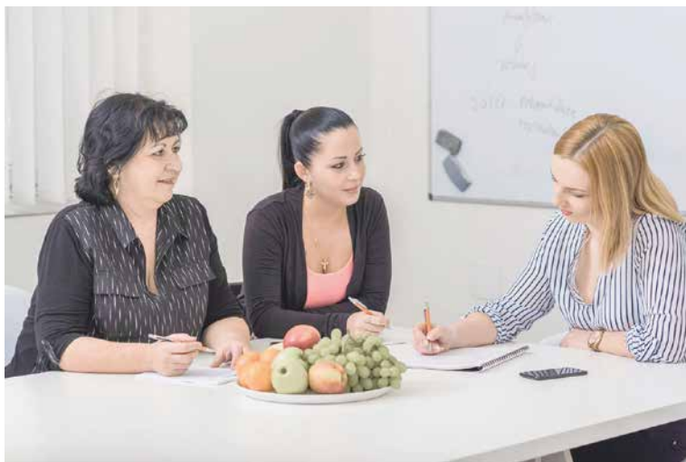
■ Kolibřík nabízí pomocnou ruku.