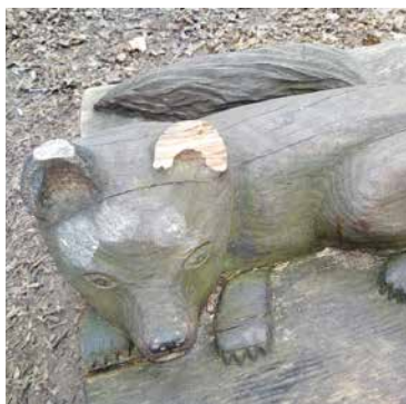
■ Vandaloři v Gránicích poničili dřevěnou sochu lišky.

Zahrnuje postupnou výsadbu asi dvou stovek nových stromů, především javorů a dubů, ale také již proběhlo kácení starých nebezpečných stromů a smrků napadených kůrovcem. V souvislosti s pracemi prováděnými těžkou technikou mohou být některé cesty poškozeny. Jejich opravy jsou naplánovány na jarní měsíce. Návštěvníci údolí by ale nyní při svých procházkách měli dbát větší opatrnosti a řídit se pokyny