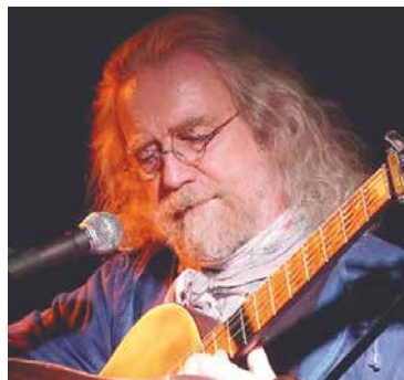
■ Jaroslav Hutka.