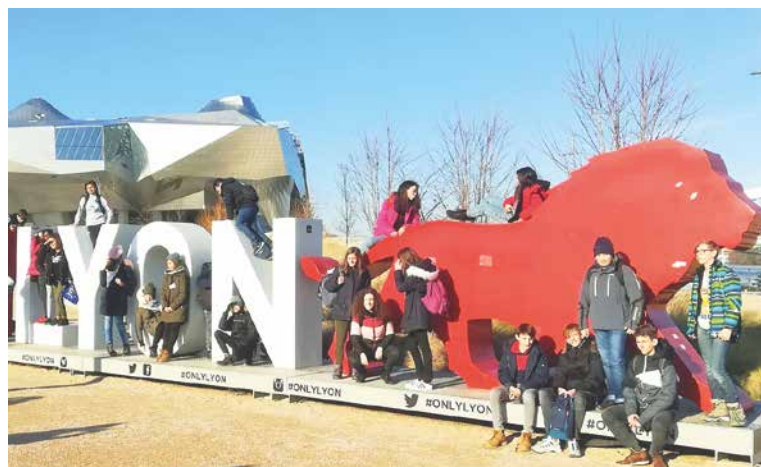
■ Znojemští studenti v Lyonu. Teď už připravují program pro své zahraniční vrstevníky.

Šest dnů ve sladké Francii uběhlo jako voda. Další setkání, na které přijedou všechny partnerské školy, bude v květnu ve Znojmě. Studenti GPOA pro ně připravují program obsahující to nejlepší, co město Znojmo nabízí – historické centrum, přírodu Podjív, dobrodružnou cestu Gránickým údolím i plavbu po řece Dyji. lp