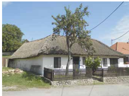
■ Venkovská usedlost, která za citlivou rekonstrukci již ocenění získala.

Vítěz Ceny veřejnosti vzejde z hlasování prostřednictvím SMS zpráv od 13. března do 5. dubna. Fotografie a popis vybraných památek, ze kterých mohou občané vybírat, najdou (cca po 23. únoru) na webu www.kr-jihomoravsky.cz . Výsledky soutěže budou vyhlášeny v květnu 2019.