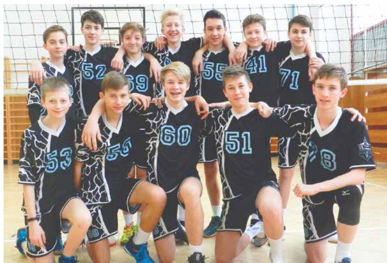
■ Úspěšný tým volejbalových starších žáků.

V úspěšné první polovině sezóny si žáci VK PFN Znojmo vybojovali postup do první osmičky Českého poháru. 19.–20. ledna v Nymburce se tak poměřovali s nejlepšími týmy České republiky. V první hrací den nejprve nestačili na nejspěšnější tým soutěže, ve kterém pod hlavičkou Lokomotivy Břeclav startují hráči Břeclavi, Beskyd a Ostravy. Poté si však znojemští volejbalisté s přehledem poradili s domácím Nymburkem a VK Ostrava shodně 2:0. V posledním sobotním zápase s pražským Prosekem se na palubovce strhla obrovská bitva, ve které sice hráči Znojma často tahali za delší konec, ovšem obě těsné koncovky lépe zvládl pražský celek. Nedělní program zahájili znojemští žáci s týmem Kladna – vítězem české části Českého poháru. Ve svém nejlepším utkání Znojmo svého soupeře zaskočilo skvělými vstupy do obou setů a po téměř bezchybném výkonu přehrál favorita 25:18, 26:24. Tímto vítězstvím se žáci VK PFN Znoj-