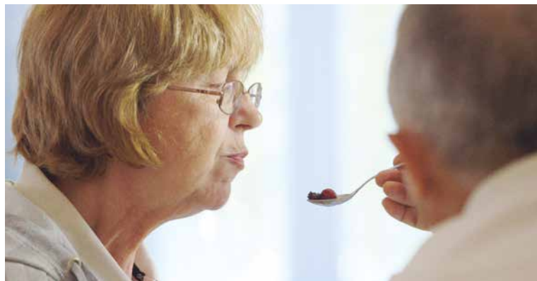
■ Láska a prázdná slova.

Několik přeživších se pomocí intimního scénického experimentu pokusilo zprostředkovat zážitek útoku na norský letní tábor v roce 2011. Experiment jim umožňuje přinést katarzi.