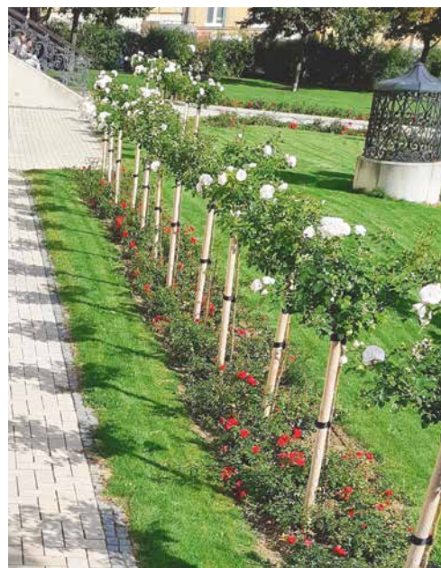
■ Nově vysazené růže v okolí divadla.

Městské divadlo Znojmo v příští sezóně oslaví 120 let své existence. Uplyne také dvacet let od komplexní rekonstrukce znojenského stánku Thálie. I když to zní neuvěřitelně, za tu dobu prošly divadlem stovky tisíc lidí, což se chtě nechtě podepsalo na vnitřním vybavení. Před dvěma lety proběhla výmalba diváckého zázemí a části hlediště, ale ozývají se i další bolístky. Aktuálním problémem je například opotřebení sedadel, a to nejen jejich čalounění. Stejnou pozornost by si zasloužily také tapety v lóžích.