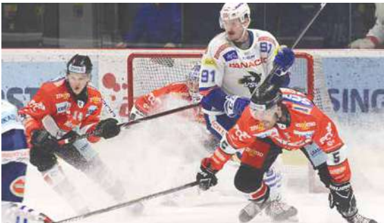
■ V akci na ledě.