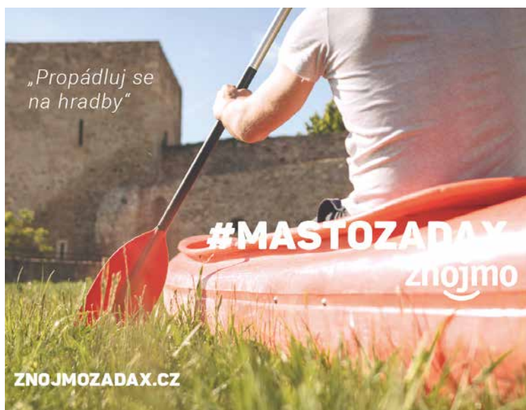
■ Letos jsme pádlovali s turisty a podnikateli nejen k hradbám. A byla to jízda!

„Naší myšlenkou bylo využít turismus jako nástroj pro podporu míst-