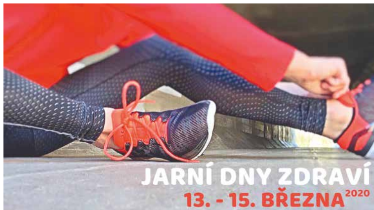
■ Ilustrační foto.

Na Fitness kongres, který se uskuteční 14. března, se vrací trojice oblíbených trenérů! Jakub Šigut, Sylva Hermanová a Klára Kořenská vyhecují k těm nejlepším výkonům na svých lekcích od 9.00 do 12.00 hodin. Poté