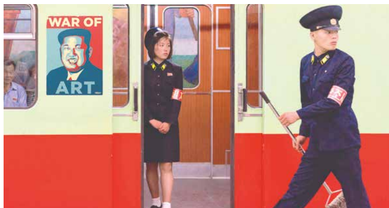
■ VÁLKA UMĚNÍ

Jak se zachováte, když nebudou klienti spokojeni s úklidem a začnou vás slovně i fyzicky napadat? Co uděláte, když vás budou chtít znásilnit? Tohle není kurz přežití, ale příprava filipínských služebných na jejich budoucí práci.