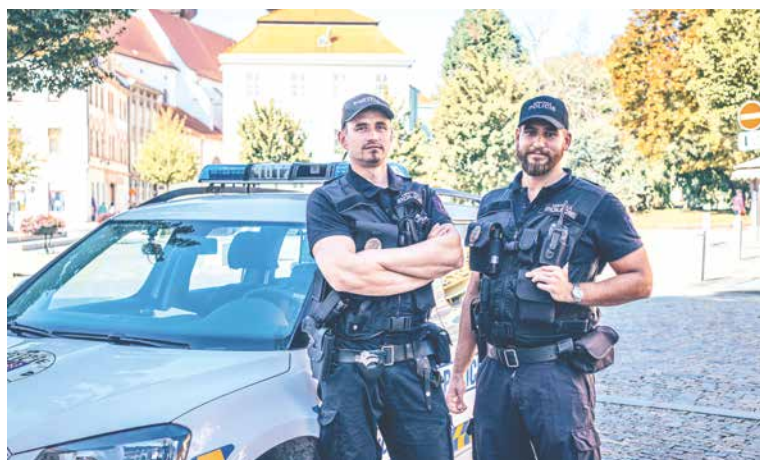
■ U Městské policie Znojmo je nuda neznámý pojem. Strážníci a strážnice mají každý den jinou náplň práce.

Základní předpoklady pro práci strážníka obecní policie jsou státní občanství ČR, věk minimálně 21 let, způsobilost k právním úkonům, střední školské vzdělání s maturitní zkouškou,