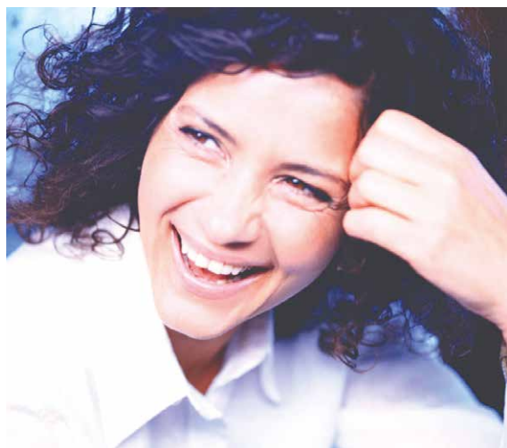
■ Bezesporu nejvýraznější osobností Šramlfestu bude zpěvačka a houslistka Iva Bittová.

O Ivě Bittové by se dalo mluvit velmi dlouho. Česká rodačka se významně zapsala na mezinárodní hudební scéně jako zpěvačka, houslistka a skladatelka. Světové uznání si získala svou unikátní technikou zpěvu i hrou na housle. Za svou dosavadní kariéru vydala osm sólových alb. Na Šramlfestu vystoupí v pátek 31. 7. v 19.30 hodin s kapelou Čikori, jejíž hudba je pestrá směsí jazzu a world music. „Jsme opravdu hrdí na to, že můžeme letos tuto hudební událost představit i ve Znojme,“ říká hudební dramaturg festivalu Jan Krejčí.