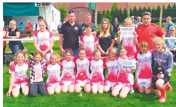
■ Tým dívek FK Znojmo na turnaji v Hodoníně.

FK Znojmo – Bratislava 6:2, Šišlákova 2, Piscová, Klásková, Veselá 2. eks