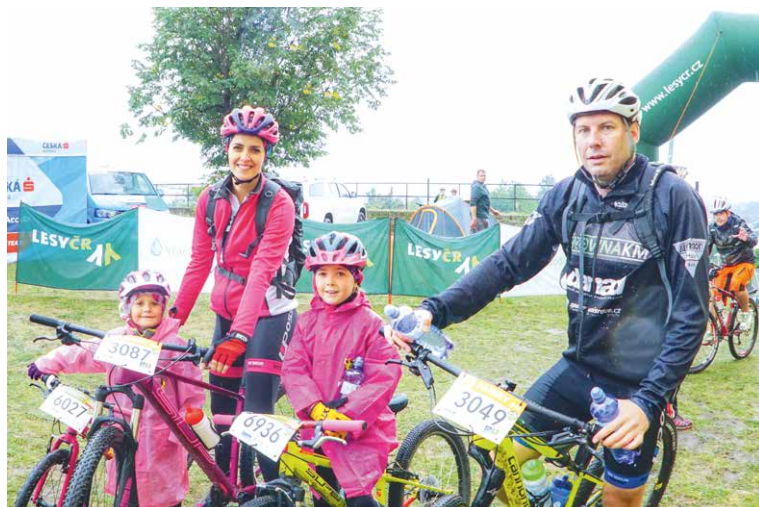
■ Kolo pro život je akce nejen pro profesionální cyklisty. Vyrazit můžete s celou rodinou na Family jízdu.

Letošní 7. ročník znovu přichystá pečlivě značené trasy s kouzelnými výhledy. Chybět nebudou občerstvovací stanice vybavené dary moravských vinic, sadů a cukrářských mistrů. Centrem dění se opět stane areál Louckého kláštera, kam se vejde celé zázemí a skvělé služby pro závodníky seriálu Kolo pro život. Sem se také budou v průběhu celého dne sjíždět účastníci všech vypsanych tras. V areálu kláštera se i letos pro veliký úspěch uskuteční 2. ročník pátečního sportovního odpoledne, které potěší všechny děti základních škol. Cyklokroužky, jejichž náplní není jen jízda na kole, ale celková všestranná pohybová aktivita pro školní i předškolní děti, tak obohatí již tolik nabitý program.