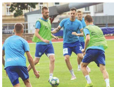
■ Fotbalisté 1. SC Znojmo trénují na novém ročníku MSFL.

Co dělali fotbalisté poté, co jim předčasně skončila soutěž? „Během celostátní karantény měli kluci volno a jak se začala uvolňovat ta opatření, tak jsme začali trénovat jako všichni. Dělali jsme to spíše herní formou. Moc jsme nenabírali fyzickou kondici, aby se kluci dostali do nějaké herní zátěže. Pak jsme měli týden volno a začali jsme trénovat naplno,“ přiblížil trenér 1. SC Znojmo Milan Volf. Jaké má představy o kádru pro MSFL: „V soutěži se může pětkrát střídát, takže potřebujeme širší kádr. Rádi bychom měli minimálně osmnáct hráčů, aby, když přijdou zranění, jsme měli vůbec s kým hrát. Budeme ještě zkoušet spoustu hráčů. Pokud se Franta Malár prosadí v Lišni, měli by přijít někteří hráči odsud.