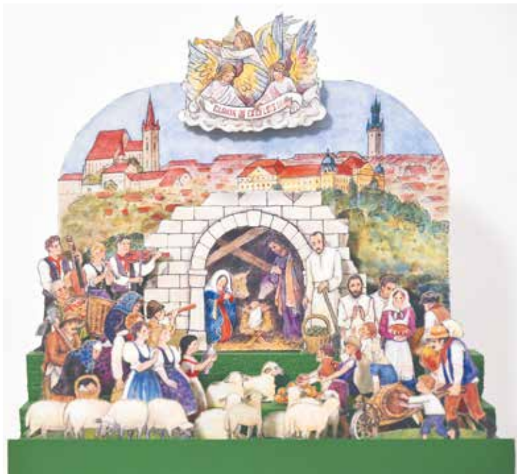
■ Vystřihovací papírový betlém od Znovínu Znojmo zdobí malované pozadí s dominantami našeho města.

Jihomoravské muzeum ve Znojmě pro změnu nabídne své výpravné publikace, a to včetně kuchařky s původními