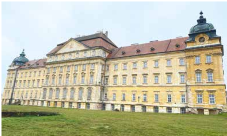
■ Východní fasáda s novými okny.