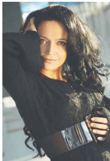
■ Zpěvačka Lucie Bílá odvolala v souvislosti s šířením koronaviru několik svých koncertů. Lidé se ale na ni mohou těšit na podzim, kdy vystoupí ve Znojmě během vinobraní.

Po dobu uzavření Turistického informačního centra Obroková lze provést nákup vstupenek pouze on-line.