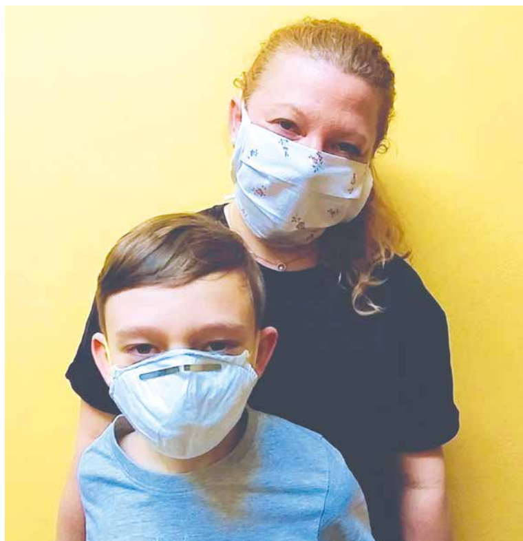
■ Vedení města rozjelo osvětovou kampaň NOSÍM ROUŠKU. Více se o ní dočtete na str. 10 a 11.

Stále vzácněji potkáváme v ulicích Znojma či v prodejnách potravin někoho, kdo nenosí roušku či si jinak nechrání nos a ústa. Přesto se i tací pořád najdou. Vláda přitom již před několika dny zakázala vycházení bez této ochranné pomůcky. Počet nakažených koronavirem v Česku rychle stoupá, a bohužel i náš region hlásí první nemocné. Reálný předpoklad je, že jejich počet bude ještě stoupat. Také proto rozjela znojemská radnice osvětovou kampaň Nosím roušku. Na zodpovědné chování každého jednotlivce apeluje ve své výzvě starosta Znojma Jan Grois, který se k stávající nelehké situaci vyjádřil také v rozhovoru na str. 3.