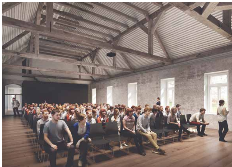
■ Interiér budoucího Centra Louka, které nabídne plně vybavený multifunkční sál.

Velkou roli pro pořadatele, kromě prostor samotných, hraje nabídka doprovodných aktivit, kterou můžou svým partnerům v daném městě poskytnout. „Pořadatelé kongresů stále hledají nová a atraktivní místa. Velkoměstům se logicky rovnat nemůžeme. Nicméně čím dál více jsou v kurzu menší, klidnější, ale přesto atraktivní lokality. A Znojmo má v této oblasti opravdu co nabídnout. Máme kvalitní gastro a ubytovací služby a portfolio turistických atrakcí jako podzemí, hradební opevnění nebo Expozici pivovarnictví. Zajímavé pro eventové manažery je určitě i blíž-