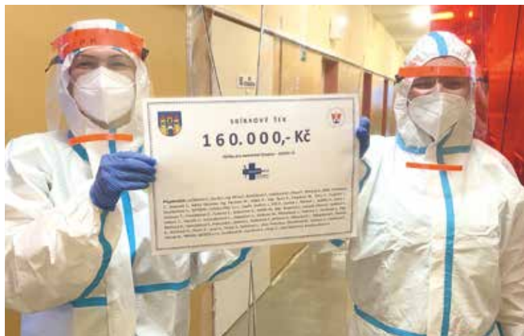
■ Šek ze sbírky pro znojemskou nemocnici v rukou nejpovolanějších.