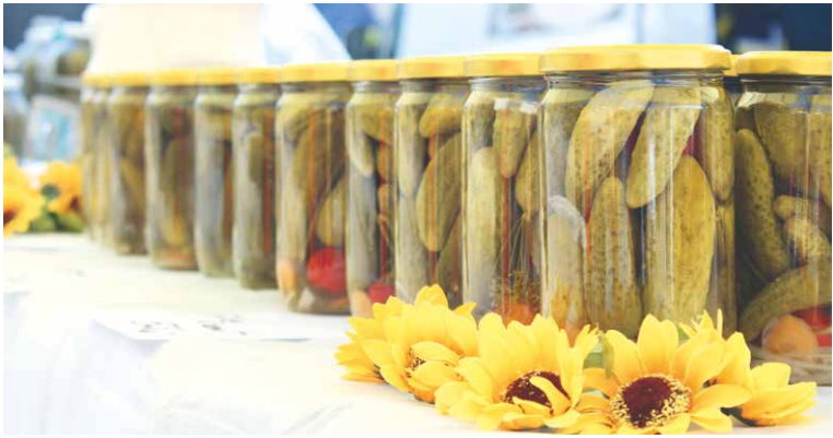
■ Okurky na slavnostech můžete zakoupit i ochutnat.