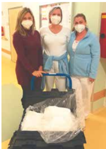
■ První ochranné obleky už slouží.

S místní firmou PPO Group mohlo město, respektive Centrum sociálních služeb, flexibilně specifikovat praktické detaily, které zlepšují a usnadňují práci personálu. Firma v podstatě vyrábí obleky na míru. „Některé obleky mívají poutka, která byla mnohdy zbytečná. Potom