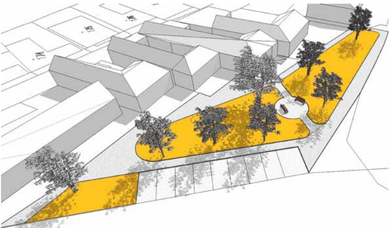
■ Vizualizace nové podoby návsi v Konicích u Znojma, jak si ji představuje navrhovatel.

uspořádat případně jarmark, vánoční trhy atd.“ uvedl ve svém návrhu Jaromír Svoboda. Realizace projektu se měla uskutečnit v loňském roce, ale potřebná povolení ke stavbě se podařila získat až v listopadu 2019, proto