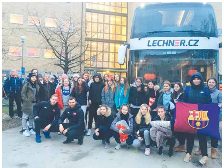
■ Znojenská výprava ve švédském Göteborgu.

Dorostenky čekala skupina o pěti týmech a rovněž i ony musely skončit