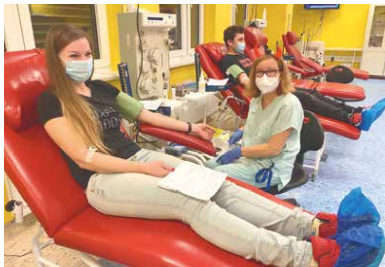
■ Jako každý rok, i letos se personál při Mikulášském odběru vybavil čertovskými rohy.

darovalo poprvé 15 žen a 16 mužů. Přičemž nejmladšímu dárci bylo 18 a nejstaršímu 50 let. I přesto, že jich bylo více, nemocnice respektuje a váží si jejich upřímnosti a odpovědnosti při odhlášení z důvodu zdravotních obtíží. Největší spotřebu transfúzních přípravků mají chirurgická oddělení a hematologická ambulance. lp