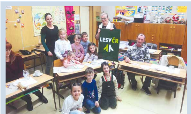
■ Za finanční podpory Lesů ČR připravila na konci roku 2019 Základní škola Václavské náměstí tvořivé dílny s vánoční tematikou pro děti 1. stupně i pro jejich rodiče a prarodiče. Vydařené odpoledne v budově školy na Slovenské ulici obohatila i vánoční výstavka výtvarů žáků. Text lp

profesí, která je navázána na databázi Národní soustavy povolání, uživatel si tak k doporučené typové profesi může zobrazit podrobnosti – například potřebné schopnosti a dovednosti, typickou náplň práce a dosahované platové rozmezí. Licence, kterou škola zakoupila, jim umožňuje pracovat se všemi moduly v plné verzi po celý školní rok, k výsledkům se žák může neomezeně vracet na svém mobilu, PC a konzultovat je se svými nejbližšími, ať už jsou to kamarádi, přátelé, rodiče, a samozřejmě ve škole s kariérovým poradcem.