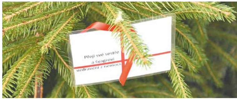
■ Nesobecká přání zdobila stromček Denního stacionáře sv. Damiána.

Město Znojmo jako každý rok v prosinci vyhlásilo soutěž Vánoční Znojmo. V lednu nového roku jsou tak známi vítězové.