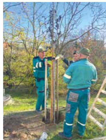
■ Pracovníci městské zeleně při výsadbě.