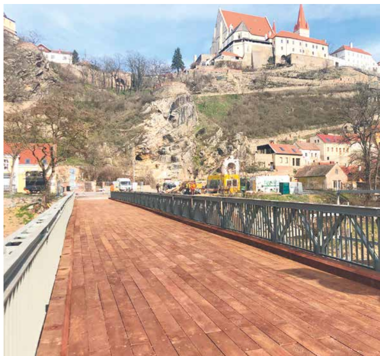
■ V poslední fázi prací byla položena nová mostovka a ochranné zábradlí.

Rekonstrukce mostu přes Dyji, který je celoročně hojně využívanou cestou nejen zahrádkářů, ale i turistů a obyvatel Znojma, byla zahájena v září minulého roku a měla být zrealizována do konce listopadu 2019. Po rozebrání a otryskání konstrukce ale stavbaři zjistili, že některá místa jsou vlivem koroze zeslabená více, než se při průzkumu před stavbou zdálo, a tak bylo nutné povolat statika a most nechat vyztužit. Po vyztužení mostu pokračovaly další práce. Město do rozsáhlé rekonstrukce investovalo téměř 9,7 milionů korun. Práce na mostu zahrnovaly opravy základů piliřů i výměny čtyř dřevěných piliřů. Dále se opravily opěry a zděný piliř, doplnila se křídla mos-