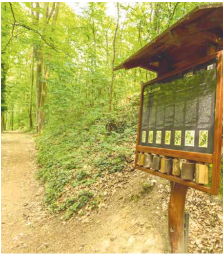
■ Lepší, než kupa dětí na jednom hřišti mezi domy, jsou individuální výlety do přírody v blízkosti bydliště. Třeba do Gránického údolí (na snímku).

Všechny tipy jsou určeny rodinám s dětmi a každý popis uvádí, pro jak staré děti je dané místo či aktivita vhodná. Přehled je přitom každý den aktualizován podle momentální bezpečnostní situace. Stáhnout si jej můžete na www.znojmoregion.cz . in, lp