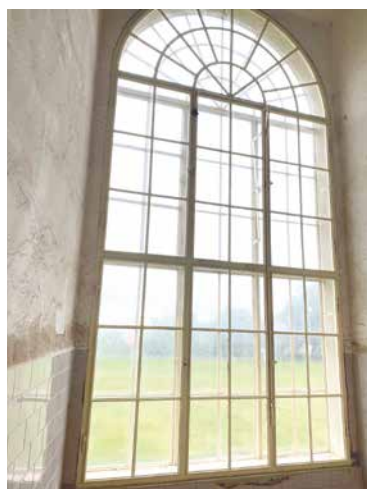
■ Ne všechna okna v klášteře mají klasický vzhled.

Do v pořadí již šesté etapy výměny oken město investuje téměř 3,8 milionu korun. Stejně jako v předchozích letech město získalo dotaci z Ministerstva kultury (z Programu zachrany ar-