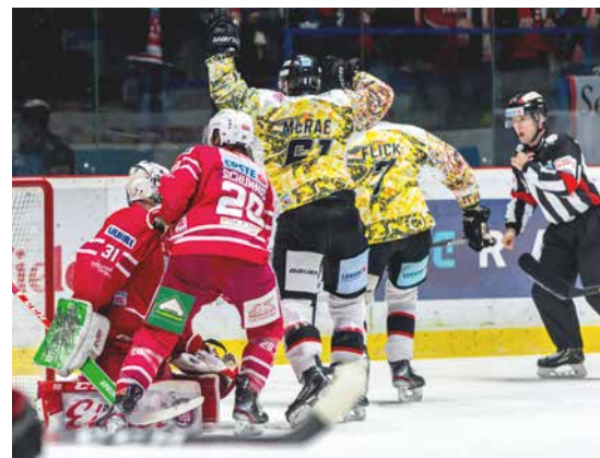
■ Akce ze zápasu.

Tato suma bude následně věnována Nemocnici Znojmo, kde ji využijí ke zvelebení centrálního příjmu. „Jsem velmi mile překvapen sounáležitostí fanoušků znojemských Orlů, kteří do aukce charitativních dresů investovali peníze ve prospěch naší nemocnice. Částka značně předčila naše očekávání a jsme za ni velmi vděční. Už proto jsme se rozhodli peníze investovat do prostředí, kterým projde největší počet našich pacientů, tedy do centrálního