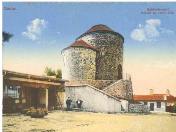
■ Pivovar v době vzniku.