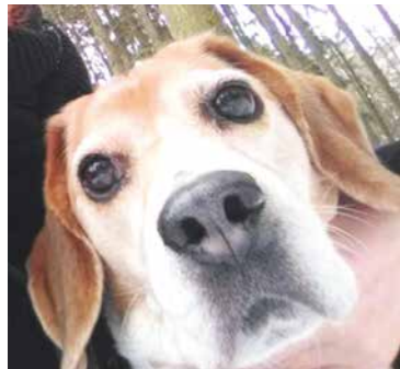
■ Ilustrační foto.

Od poplatku ze psů je osvobozena osoba nevidomá, osoba, která je považována za závislou na pomoci jiné fyzické osoby podle zákona upravujícího sociální služby, osoba, která je držitelem průkazu ZTP nebo ZTP/P, osoba provádějící výcvik psů určených