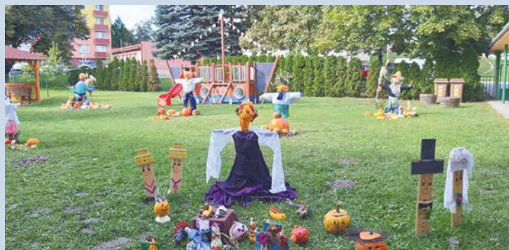
■ Každoroční aktivita U nás za plotem, kterou pořádá pro rodiče s dětmi Mateřská škola Holandská, opět přinesla krásnou podzimní výzdobu. „Máme sedm tříd a každá třída si vytvořila svého panáka. Letos jsme ve školce tvořili pouze s dětmi, ale děti mohly nosit výrobky, které si udělaly s rodiči doma,“ uvedla učitelka Eva Holíková.