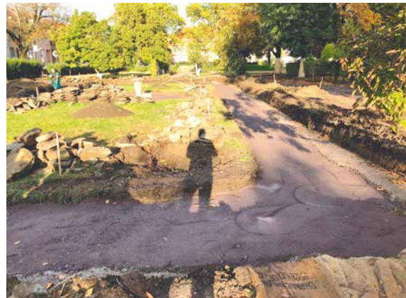
■ Práce na obnově parku běží podle plánu.

Opravené cesty budou v části mlátové, v části vydlážděné (u slunečních hodin), proběhne úprava zeleně, opraví se sluneční hodiny a doplní mobiliář. Buduje se také nový vstup do parku, aby senioři z blízkého pečovatelské-