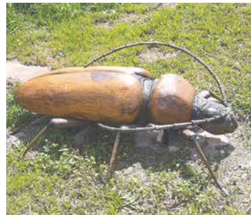
■ Po dřevěných broucích budou moci děti i chodit.

Projekt Život v trávě, který připravilo a financuje město Znojmo, má dětem i dospělým přiblížit místní faunu. Konkrétně jde o pět druhů brouků žijících v přírodě našeho kraje. Na jejich vyhotovení už nějaký čas pracuje umělecký řezbář Petr Steffan. Jeho práce se blíží ke konci. Dřevění brouci o velikosti 1–1,5 m jsou z tvrdého