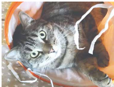
■ Kastrovaná kočka.

Pro svůj záměr pomáhat toulavým kočkám našly zástupkyně spolku porozumění na znojemské radnici, kde