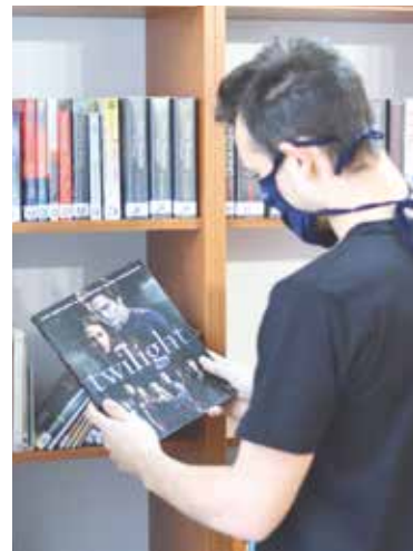
■ Studenti využívají na škole novou anglickou knihovnu.