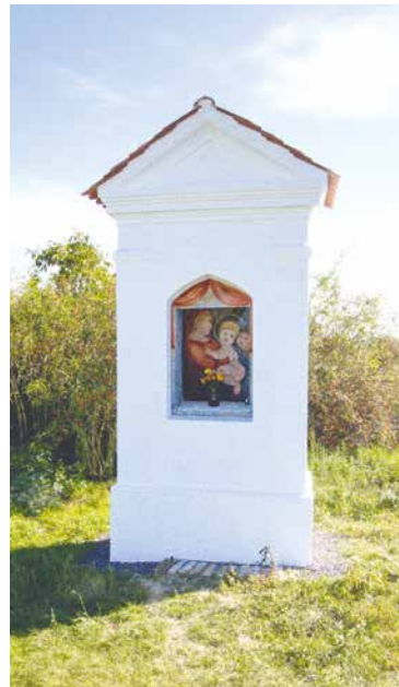
■ Současná podoba načeratické kapličky a před opravou.