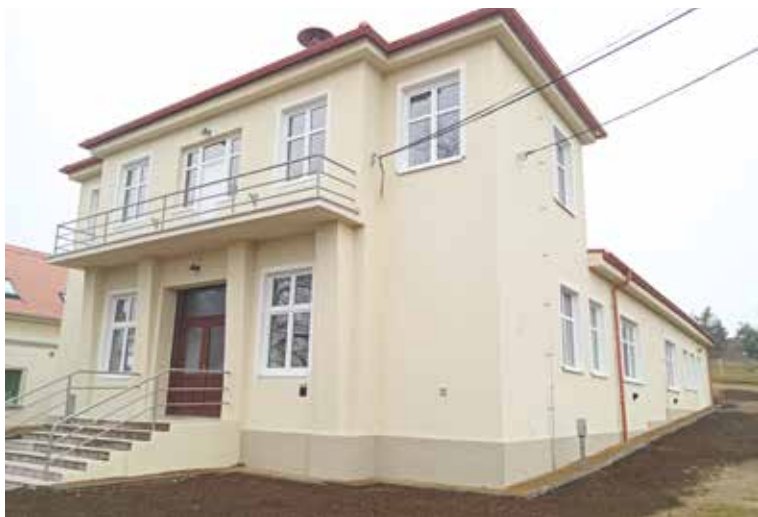
■ Kulturní dům v Konicích.

„Kulturní domy jsou pro společenský život zásadní, proto do nich postupně investujeme,“ říká starosta Jan Grois. Letošní investice v Konicích nebyly první. Okna a vchodové dveře a velké interiérové dveře vedoucí do sálu jsou nové už od loňského roku. Kromě Konic se letos pracovalo i v Derflicích. Ve zdejších kulturních domech se zrekonstruovaly sociální zařízení a vyměnila se také všechna stará okna a dveře za nová. Sem letos radnice investovala 590 000 korun. zp