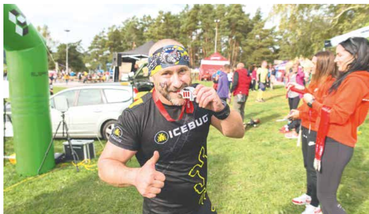
■ Závodem prošli i zkušení sportovní borci.