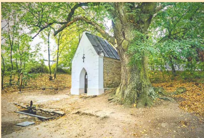
■ Samaritánka před a po opravě.