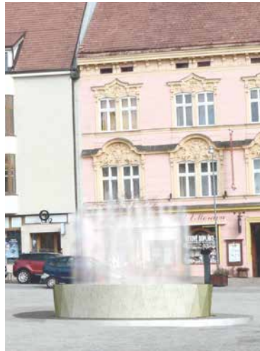
■ Kašna Koruna Znojma – vizualizace.