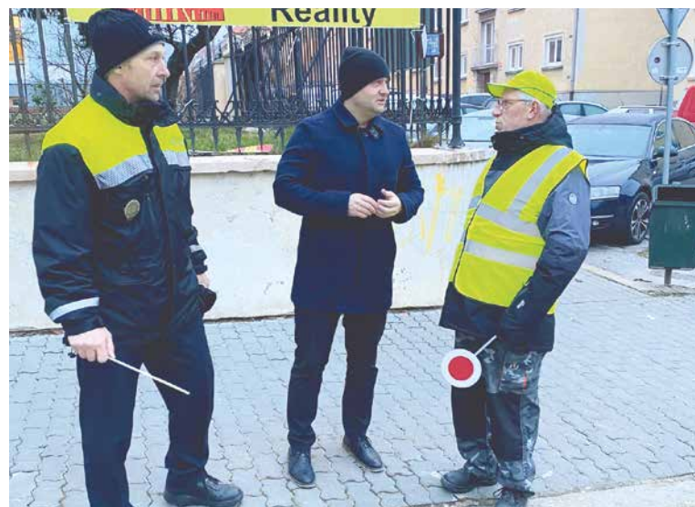
■ Seniori hlídají u méně frekventovaných přechodů v blízkosti škol. Nejfrekventovanější přechody zůstanou v gesci strážníků.