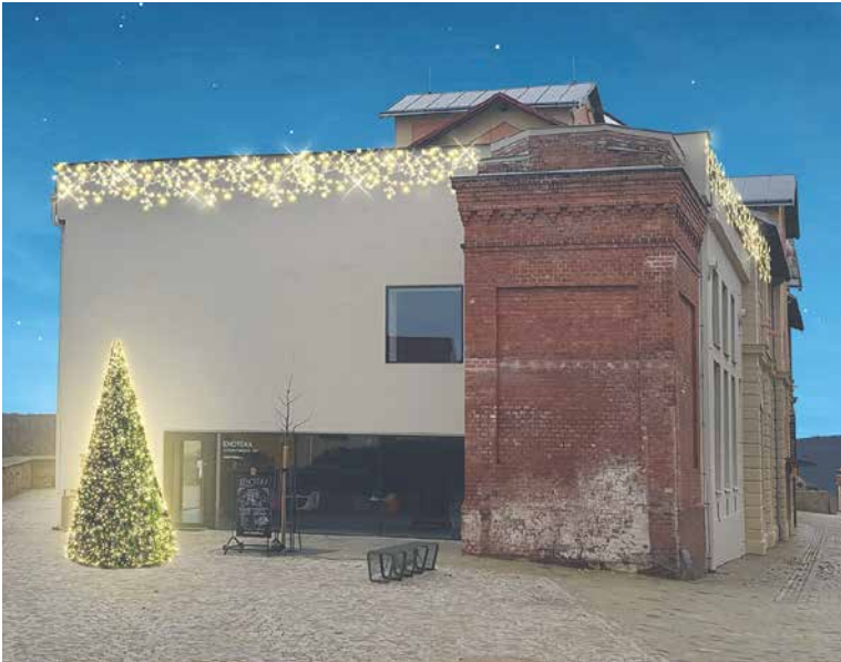
■ Na budovách v Hradní ulici bude poprvé vánoční osvětlení. Vizualizace.

Koledy uslyšíte z reproduktorů na náměstích, ale poprvé také v Hradní ulici a z radniční věže. Až se budete rozhodovat, kdy se vydat na procházku městem, určitě byste měli zvolit alespoň jeden střední podvečer. Právě v tu dobu, od 18.00 hodin, se v podání trubačů z výšky radniční věže rozezní půlhodinové pásmo lidových koled. A pod věží bude otevřené Dárkové vánoční okénko ZnojmoRegionu s nabídkou regionálních výrobků a služeb (více o něm na str. 15).