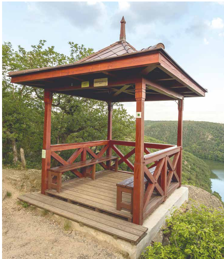
■ Vydejte se načerpat síly do podzimní přírody. Treba na vyhlídku Králově století v Národním parku Podyjí.

a také sociální sítě, kde naleznete nejčerstvější informace. Děkujeme vám za pochopení. lp, zp