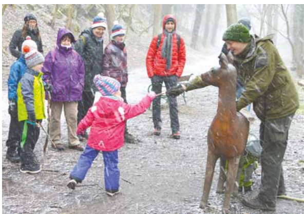
■ Vycházka s lesníkem.

především smrky napadené kůrovcem a staré nebezpečné stromy. Lesník proto vysvětlí postup přirozené obnovy lesa, vliv kůrovce na zdraví stromů, ale také pohovoří o životě lesní zvěře v zimních měsících. Procházka se uskuteční v sobotu 25. ledna od 13.00 hodin a sraz je u Spáleného mlýna. pm