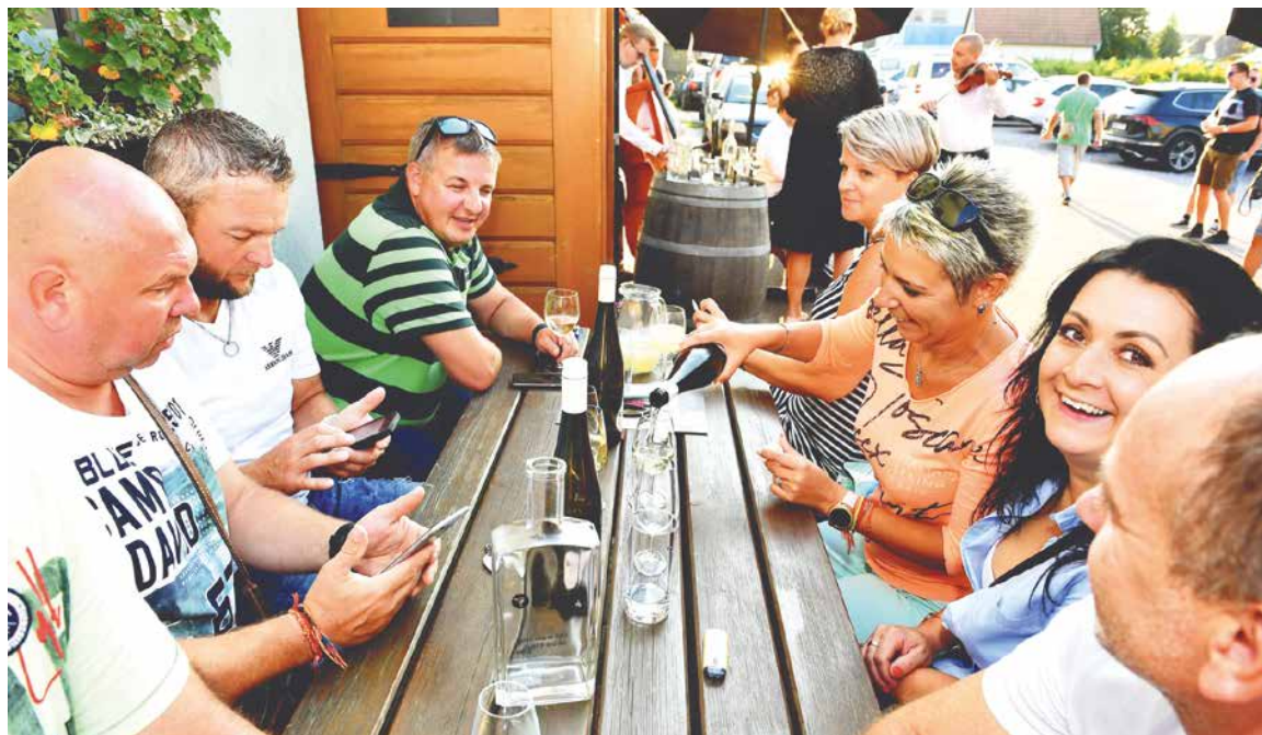
■ Vyhlášené znojmské víno a s ním spojené množství akcí bylo pro turisty velkým lákadlem.