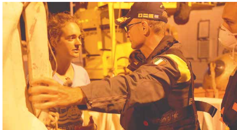
■ LOŽ SEA-WATCH 3

Klimatická krize volá po naší pozornosti už dlouho, na rozdíl od velkých přírodních katastrof jsou ale její projevy svou pozvolnou plíživostí nenápadné. V českém obzoru byly donedávna téměř až neviditelné. Vyprahlé louky, usychající lesy, prázdné studny či vyschlá koryta řek už ale nemohou přehlédnout ani ti, kdo globální klimatickou krizi zlehčují či popírají. Srážek je dost, ale kvůli narůstajícím teplotám a dlouhodobě špatné péči o zemědělskou půdu a lesy se i po vydatných deštích voda z krajiny rychle vypaří. Tedy doslova naprší a uschne.