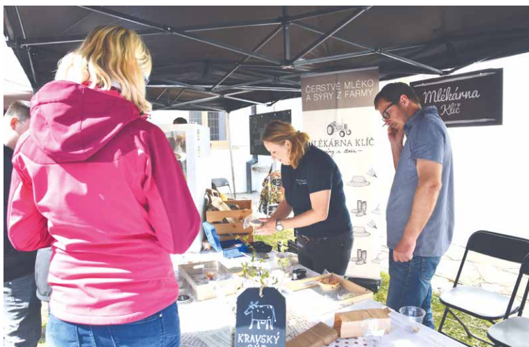
■ Farmářský den představuje zajímavou nabídku zboží i kulturní program.

a v celé křížové chodbě kláštera, aktivity pro děti pak najdou rodiny v zadním traktu. Ve stejný den 7. srpna mohou lidé navštívit i výstavu Tradice jedné hranice na znojemském hradě, která se lidových tradic a obyčejů týká a byla inspirací pro letošní téma Farmářského dne, a také se mohou podívat na Slavnosti okurek na nedalekém Masarykově náměstí. V loňském roce přivítali na Farmářském dni více než 1500 návštěvníků a i pro tento rok věří organizátoři zajímavé akce v minimálně stejný zájem veřejnosti. lp