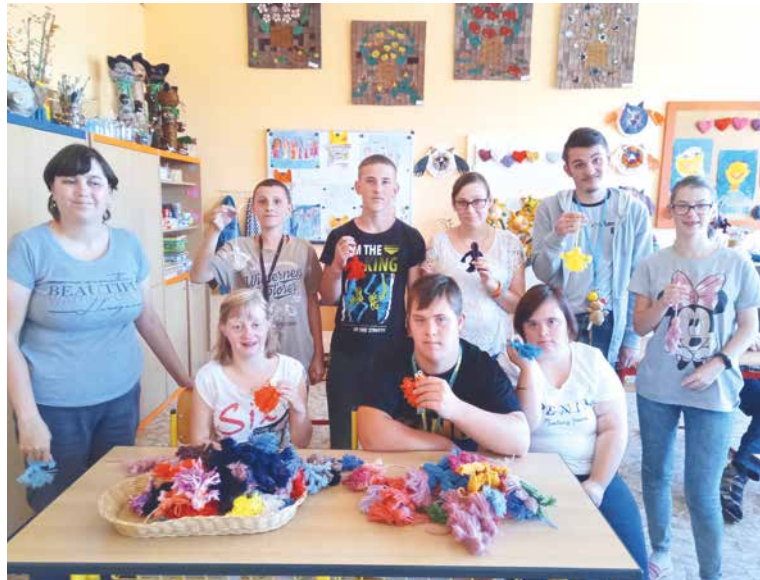
■ Žáci vyrobili 130 kusů vlněných panenek.