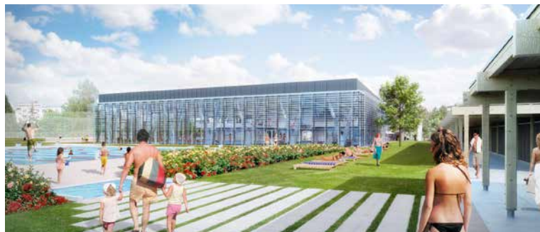
■ Vizualizace. Autor návrhu Architektonická kancelář Burian-Křivinka, Brno. Kapacita krytého bazénu bude 207 osob.