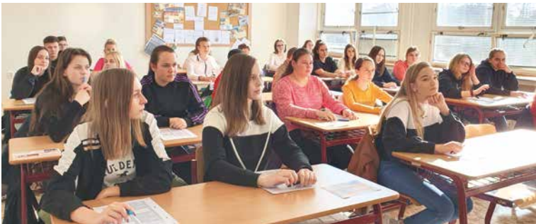
■ Zájem o únorové zkoušky nanečisto byl veliký.