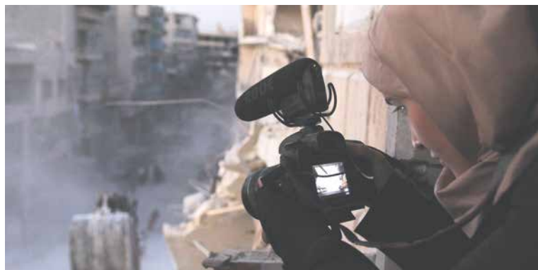
■ PRO SAMU

Veřejnost uvidí vybrané dokumenty ve večerních hodinách od 24. do 27. března. Každý film bude po projekci opět doprovázena beseda se zajímavým hostem, který bude odpovídat na dotazy diváků. Atmosféru zahajovacího dne 24. března obohatí hudba, víno a drobné občerstvení pro diváky v předzářní kina Svět. Vstupné pro veřejnost na festival Jeden svět je 80 korun na každý film.