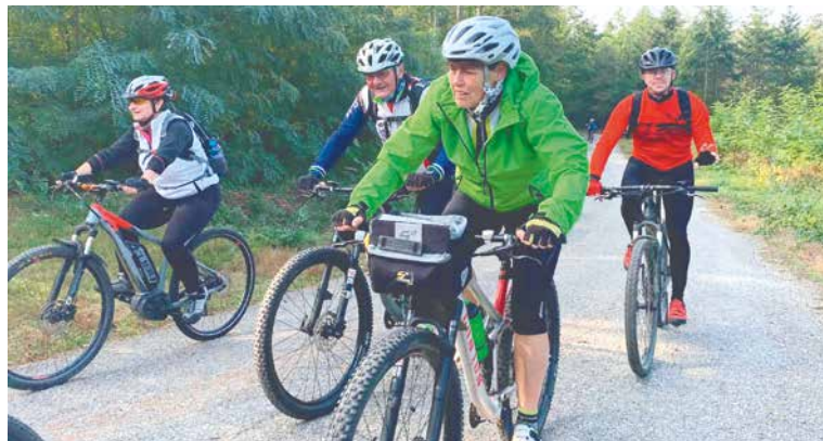
■ Projed se na kole přírodou, třeba jako účastníci Podzimních dnů zdraví, je skvělou relaxací pro zdraví, v tuto dobu více než jindy potřebnou.

ka otužování pod vedením Plaveckého klubu Znojmo. Patnáct účastníků se dozvědělo zajímavé informace o otužování a zároveň si mohli na vlastní kůži zdraví prospěšnou činnost vyzkoušet. Organizátoři děkují partnerům akce, kteří i v nestandardním režimu pomohli se zajištěním programu. pm