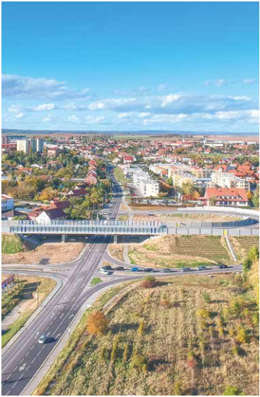
■ Vloni otevřená část obchvatu.

Během územního řízení navíc spolek podával námítky na tzv. systémovou podjatost, v důsledku toho se celé řízení protáhlo o několik měsíců. V případě, že by spolek s námitkou systémové podjatosti uspěl, celé územní řízení by musel řešit stavební úřad v jiném městě. Do územního řízení se navíc snažily vstoupit Děti Země a Voda z Tetčic, které nyní zablokovaly stavbu dálnice na Vídeň.