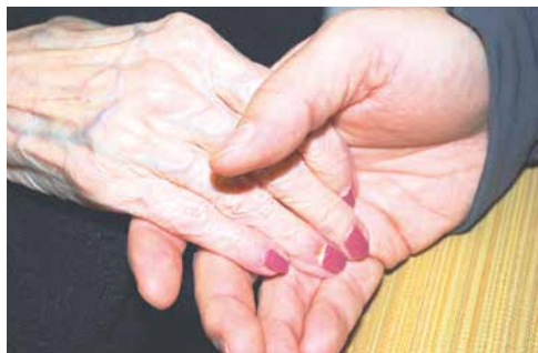
■ Ilustrační foto.

Již nyní eviduje radnice desítky dobrovolníků. Každý dobrovolník, který k seniorům či jiným lidem přijde, bude mít oficiální průkaz s razítkem města a také telefonním kontaktem, přes který bude možné totožnost dobrovolníka ověřit. Na speciálním webu www.opateniznojmo.cz bude k nalezení i vzor průkazu. Dobrovolníci se do plánu „Chci pomáhat“ mohou hlásit i nadále pomocí dotazníku. Více informací na https://opateniznojmo.cz/chci-pomahat/ zp, lp