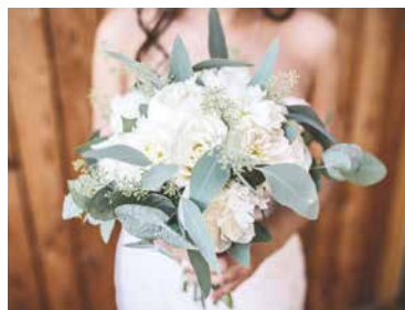
■ Svatební kytici vloni držely desítky nevěst.

I takové sliby slyšel znojemský oddávající na jedné svatbě z celkového počtu 224 uzavřených manželství roku