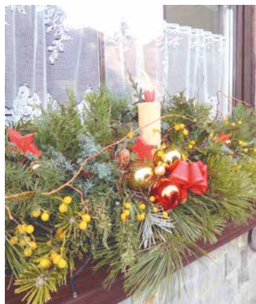
■ Pohled na vánočně vyzdobená okna může být pro mnohé inspirací.

Desátý ročník soutěže se letos výjimečně vyhlašuje pouze v jedné kategorii – O nejkrásnější vánoční výzdobu. Soutěžit mohou občané Znojma a jeho městské části.