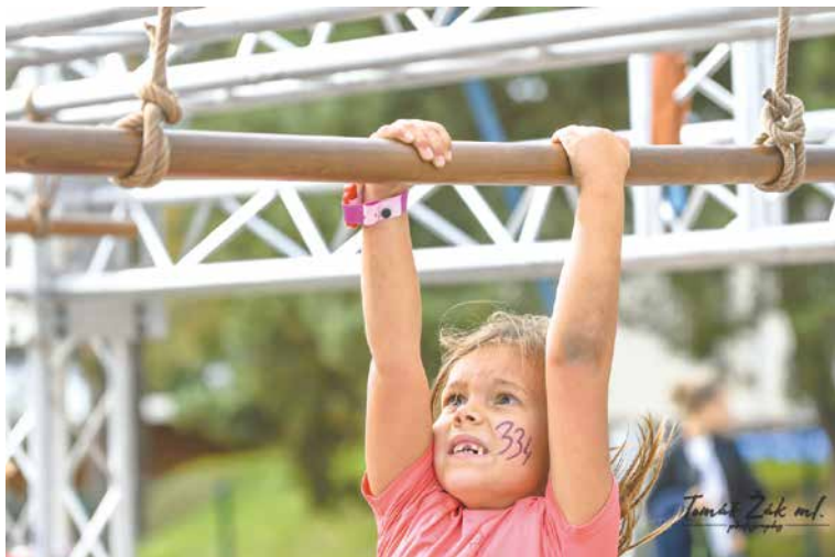
■ Malá závodnice na Kaskáda Race.