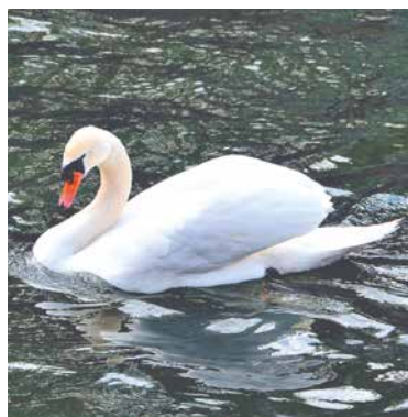
■ Labuť na řece.