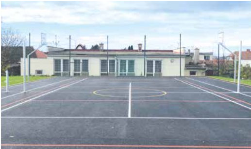
■ Nové hřiště v Kasárnách.