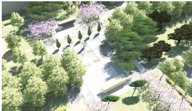
■ Vizualizace nové podoby Kolonky.

„Pokud vás zajímá zeleň a chcete ovlivnit její podobu ve městě a další rozvoj zeleného Znojma, přijďte 30. ledna do Agrodому a zapojte se do diskuze,“ zve místostarosta Jakub Malačka. pm, lp