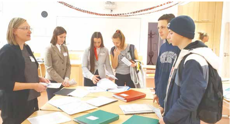
■ Největší zájem návštěvníků budil školní bar, sociální činnost, automechanici, truhláři, vybavení školy, obor Kuchař-číšník, školní kuchyně a další.

Střední škola na Přímětické ulici (SOU a SOŠ SČMSD, Znojmo) uspořádala 10. ledna Den otevřených dveří. Na škole se ve stejný den konal také první ročník školní soutěže Svačinka na Přímce. Budova školy se zaplnila třemi stovkami návštěvníků, kteří se zajímali o jednotlivé obory i přírodovědné či humanitní předměty. Prezentace byla pestrá - od češtiny a cizích jazyků, přes maturitní zkoušky, zahra-