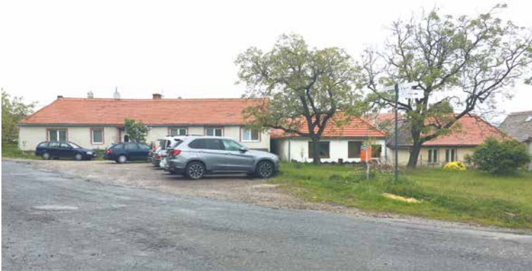
■ Nynější podoba návsi v Konicích není zrovna oku lahodící.

Navrhovatel projektu Konice u Znojma – náves řeší ve svém návrhu chybějící zpevněné parkovací stání, chodníky, posezení, doplnění samotné zeleně návsi. „Návrh bude přínosný pro všechny občany městské části Konice. Měl by tvořit místo, kde se lidé mohou potkat, popovídat si,