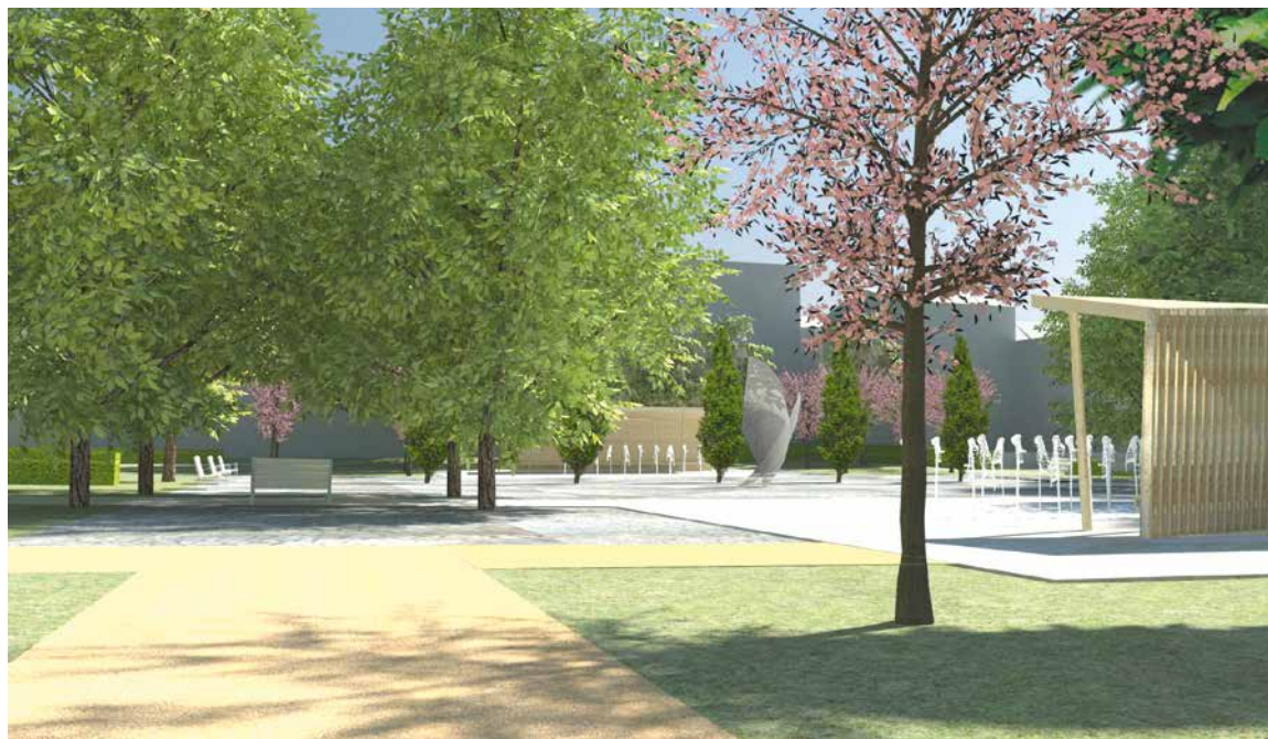
■ Vizualizace nové podoby Kolonky.