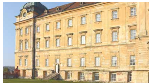
■ Na výměně oken v Louckém klášteře znojemská radnice pracuje od roku 2016. Od té doby se repasovalo 152 oken. Jen na novém konventu kláštera je 450 oken.

parapety budou řešeny štukatérsky v rámci budoucích oprav fasád. Do výměny 38 oken letos Znojmo investuje téměř 3,8 mil. korun. Stejně jako v předchozích letech město žádá o finanční podporu Ministerstvo kultury, a to z Programu zachrany architektonického dědictví. pm