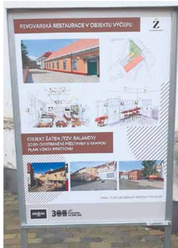
■ Výstava v areálu pivovaru.

Výstava pod názvem Minulost, současnost a budoucnost areálu pivovaru ve Znojmě, která je k vidění v ulici Hradní do poloviny prosince, připomene stručně nejen historii, ale zejména dění v areálu v posledních deseti letech, kdy je v majetku města. Nechybí proto ani vzhled do vizí a plánů do budoucna. Rozvoj areálu pivovaru je jednou z priorit a zároveň složitých úkolů radnice. Jde o vstupní bránu k rotundě sv. Kateřiny a hradu a také nejceněnější místo v centru historického města. Významnou roli