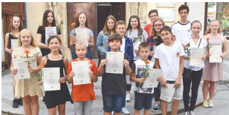
■ Jazykové vybavené děti se v cizině neztratí.

ně YLE Starters dosáhlo 8 žáků, úrovně YLE Movers 3 žáci, úrovně YLE Flyers 5 žáků a úrovně KET for Schools celkem 5 žákyň. „Efektivní jazykové vzdělávání na naší škole dokladuje skutečnost, že do letošního roku jsme ve spolupráci s Jazykovou školou P.A.R.K. připravili na ostré testy Cambridge již 222 žáků, kteří tyto jazykové certifikáty úspěšně zvládli,“ uvedla ředitelka Hubatková. Všichni žáci, kteří úspěšně zkoušku složili a získali certifikát, mohou nyní požádat město Znojmo o jeho proplacení. pm