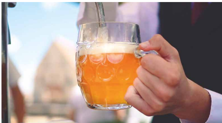
■ Ilustrační foto.

k pivu! Město Znojmo, Znojemská Beseda a Znojemský městský pivovar připravily na sobotu 1. srpna pořádnou oslavu, u které rozhodně nemůžete chybět! Na stage u rotundy proběhne v 16.00 slavnostní zahájení akce, křest a dražba pivního speciálu