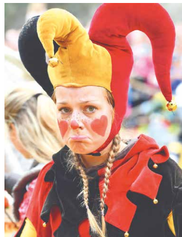
■ Ani největší svátek vína v České republice se letos neuskuteční.

Doporučující stanovisko, vinobraní za současné situace nepořádat,