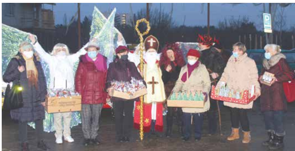
■ Soubor Znojmské Grácie je zajímavý tím, že ho tvoří pouze seniory s průměrným věkem 72 let. Elán, kterým soubor disponuje, takový věk ovšem zcela stírá.

Seniory velmi potěšila nejen nadílka od Grácií, ale hlavně jejich nápad, který jim udělal obrovskou radost v nelehké době a zpestřil jim předvánoční čas. Grácie tak poděkovaly seniorům, že mohou ve společenské místnosti domova během roku trénovat svá originální taneční vystoupení. Však také častokrát byly na mnoha akcích vítanými účinkujícími, které seniory pokaždé odměnili obrovským potleskem. A ten jim za laskavost a vstřícnost vůči spoluobčanům patří tentokrát dvakrát tak velký. lp