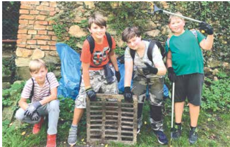
■ Do akce Uklidme Znojmo se zapojilo 130 dětí z místních základních škol. Všichni vyrazili do Gránického údolí, aby společně uklidili nepořádek.

On-line formou se Znojmo zapojilo do oblíbených osvětových kampaní. Na webu www.znojmo-zdravemesto.cz si zájemci mohou prohlížet zajímavá videa a tematické články ke Dni Země a Dni bez úrazu i ke kampani Den bez tabáku, do které se Znojmo