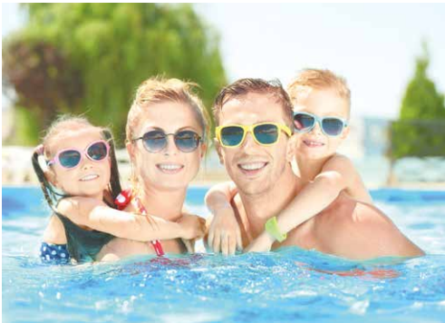
■ Dovolena u vody.