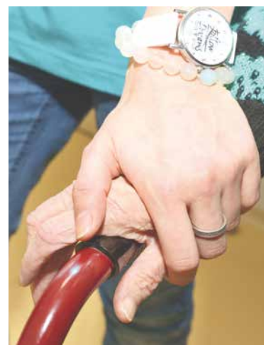
■ Ilustrační foto.

ADRA pomáhá různým cílovým skupinám a právě teď hledá dobrovolné společníky pro seniory, osoby se zdravotním postižením, osoby chronicky duševně nemocné a závislé na návykových látkách. Zapojte se do dobrovolnických programů ve Znojmě a okolí a věnujte jednu hodinu týdně ve prospěch někoho druhého. Školení pro nové zájemce pořádá ADRA ve čtvrtek 30. ledna od 17.00 do 19.00 hodin na adrese Dobrovolnickém centru ADRA, Dolní Česká 13, Znojmo. Bližší informace na tel. 607 144 090 nebo na dana.aulik@adra.cz . lp