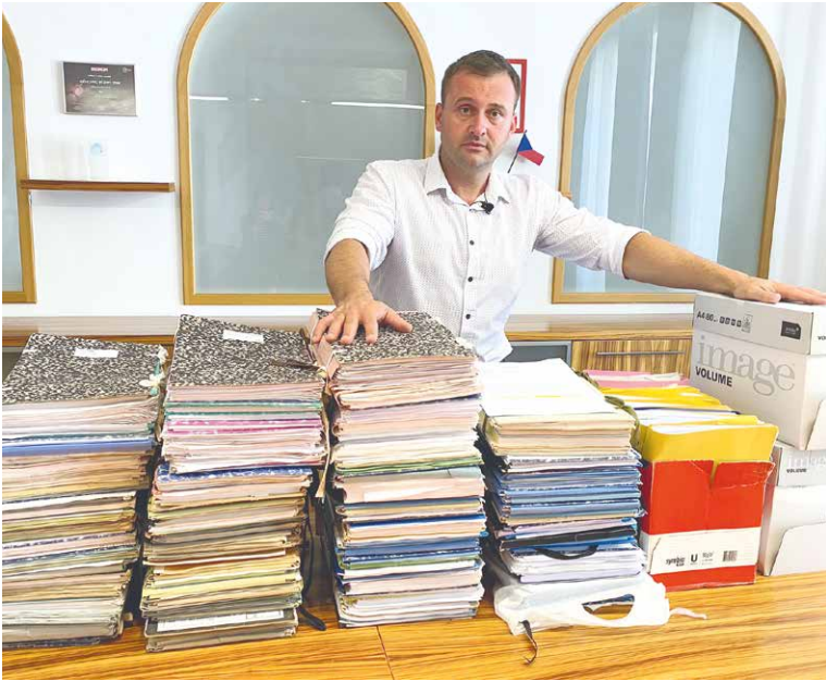
■ Spis k obchvatu má tisíce stránek. Námítky k němu 687 stránek.

Podle Groise místní samospráva udělala v posledních dvou letech maximum pro dostavbu obchvatu. Obchvat Znojma se stal součástí programových priorit vlády, podařilo se přesvědčit vládu i poslance, aby změnili zákon o liniových stavbách tak, aby pod něj spadl i znojemský obchvat.