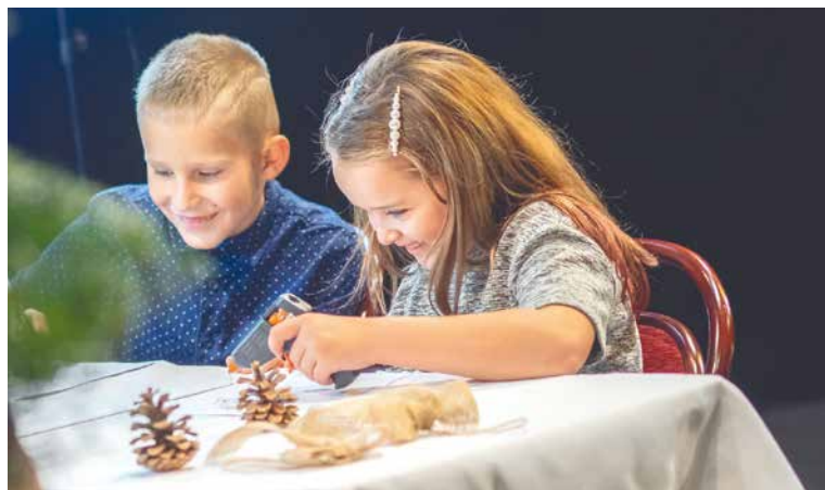
■ Jájiny dílničky znovu přinesou inspiraci k vánočnímu tvoření.