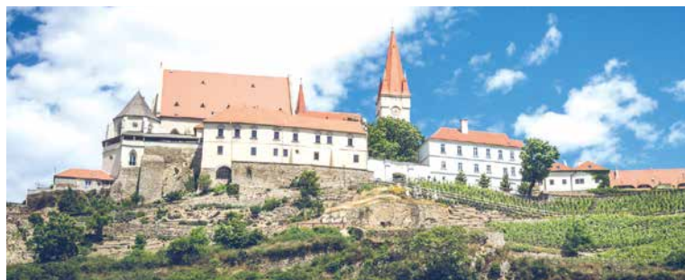
■ Atraktivita Znojma, jako místa k návštěvě, stále stoupá.