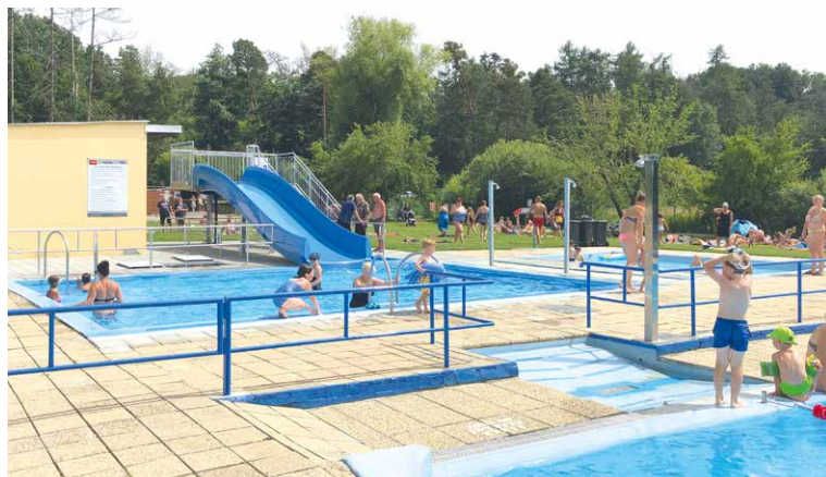
■ Koupaliště v Mramotících s novou skluzavkou.

Malačka. Sportovní nadšenci mohou ve Znojmě využívat osmnáct městských sportovišť, která slouží pro třiatdvacet různých aktivit. pm