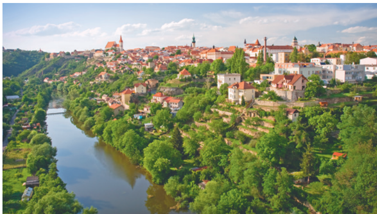
■ Znojmo, pohled od jihu.

Znojmo se v posledních letech vyšplhalo mezi TOP nejatraktivnější cíle České republiky, a to bude v dalších sezónách odrazovým můstkem nejen pro další zkvalitňování nabídky služeb cestovního ruchu, ale také pro nastartování eventové/kongresové turistiky.