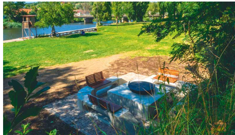
■ V okolí griloviště jsou umístěny mobilní toalety a odpadkové koše.

Samotné ohniště bude v běžném stavu uzavřené zámek. Klíče k zpřístupnění je možné po dohodě rezervace vyzvednout v Turistickém informačním centru na ulici Obroková. „Vzhledem k tomu, že od Nového roku budeme provozovat také nové turistické informační centrum v areálu Louckého kláštera, počítáme s přesunutím rezervačního místa právě tam, kde to budou mít návštěvníci pouze pár desítek metrů od griloviště,“ doplňuje František Koudela. Veškeré potřebné informace naleznete na webu www.znojemskabeseda.cz . KS, lp