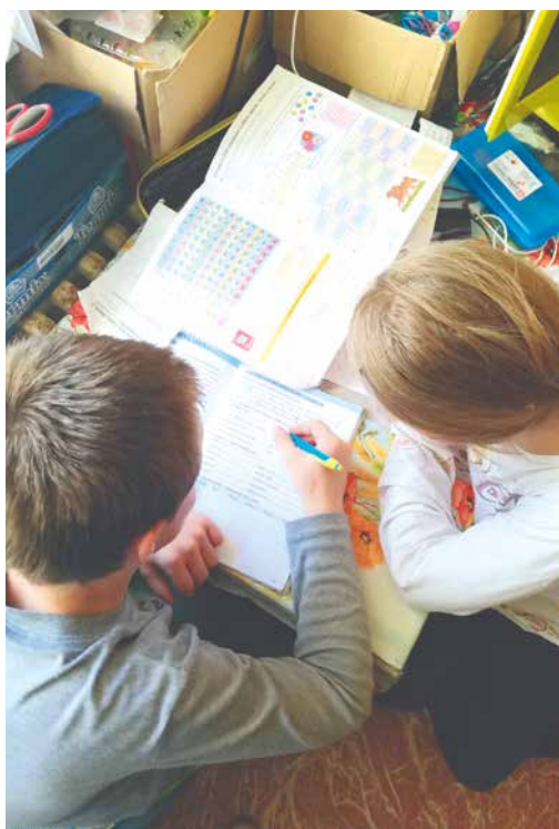
■ V současné situaci není proces učení pro děti, rodiče, ale ani pedagogy snadný.

V rámci projektu Podpora vzdělávání v domácím prostředí budou