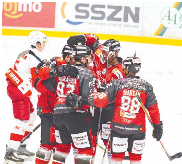
■ Hokejisté HC Aqotec Orli Znojmo

To je složitá otázka. My bychom soutěž hráli i bez diváků, přeci jen nyní již existuje spousta možností, jak