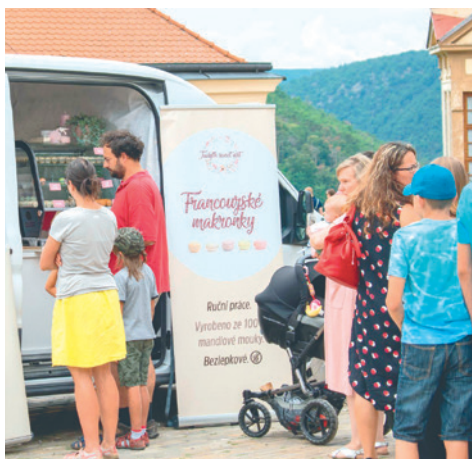
■ Pamatováno je na mlouny, ale také vyznavače dobré kávy a vegetariány.

Přijede na čtyřicet prodejců. Na své si přijdou milovníci burgerů, mexické kuchyně, pečeného masa, luxusních žebreků, různých druhů italské pasty, grilovaných ryb, asijských nebo hmyzích specialit. Můžete se těšit na rozšířenou gastro