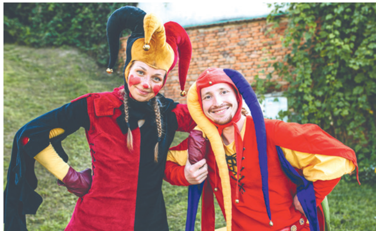
■ Šašci nemohou chybět ani na znojemském vinobraní, ani na VINAŘSKÝCH T(R)IPECH.