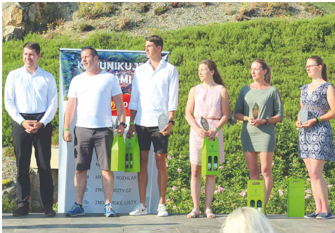
■ Vyhlášení nejlepších sportovců roku 2020 u znojemské rotundy.