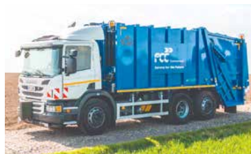
■ Ilustrační foto.

V případě platby přes SIPO je nutné se dostavit na MěÚ Znojmo, Obroková 12,