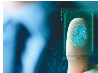
■ Ilustrační foto.

V souvislosti se zákonnými změnami proběhne od čtvrtka 29. 7. do pátku 30. 7. 2021 plošná odstávka systému občanských průkazů a cestovních pasů. V těchto dnech nebude možné o tyto doklady požádat. V pátek 30. 7. pak nebude možné ani převzít vyhotovené výše zmíněné doklady. V termínu 29. až 30. 7. může občan požádat pouze o vydání OP bez strojově čitelných údajů s dobou platnosti jeden měsíc (zhotoveno na počkání). K žádosti bude potřeba předložit dvě průkazové fotografie. Provoz systému bude opětovně zajištěn od pondělí 2. srpna.