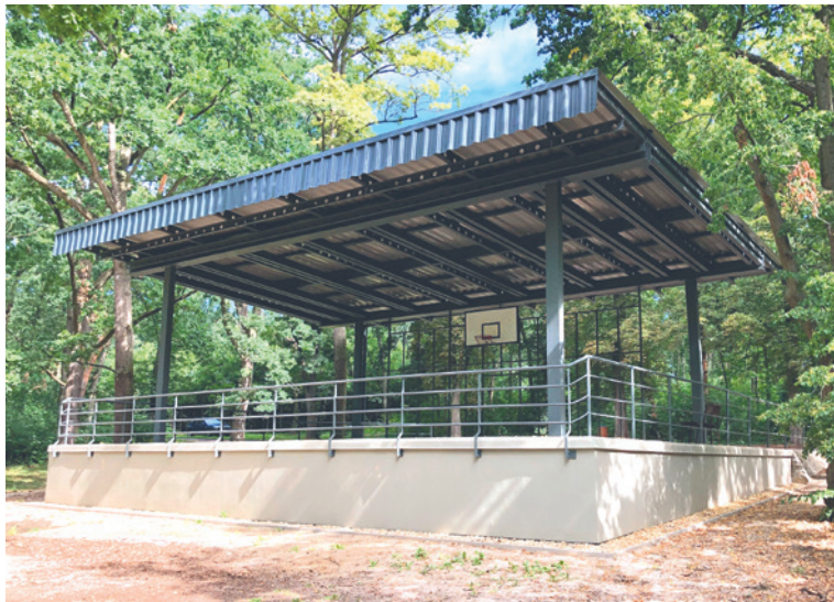
■ Opravené pódium v Městském lesíku, který je lidmi hojně a často rekreačně využíván. Za jeho zalesněním stála na přelomu 19. a 20. století péče Okrašlovacího spolku.