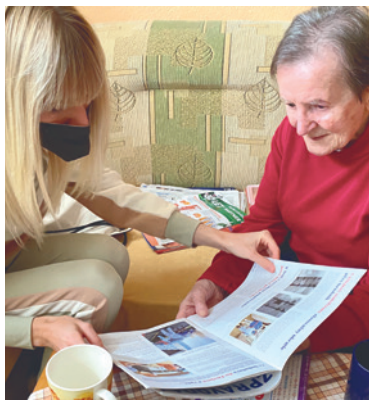
■ Ilustrační foto.