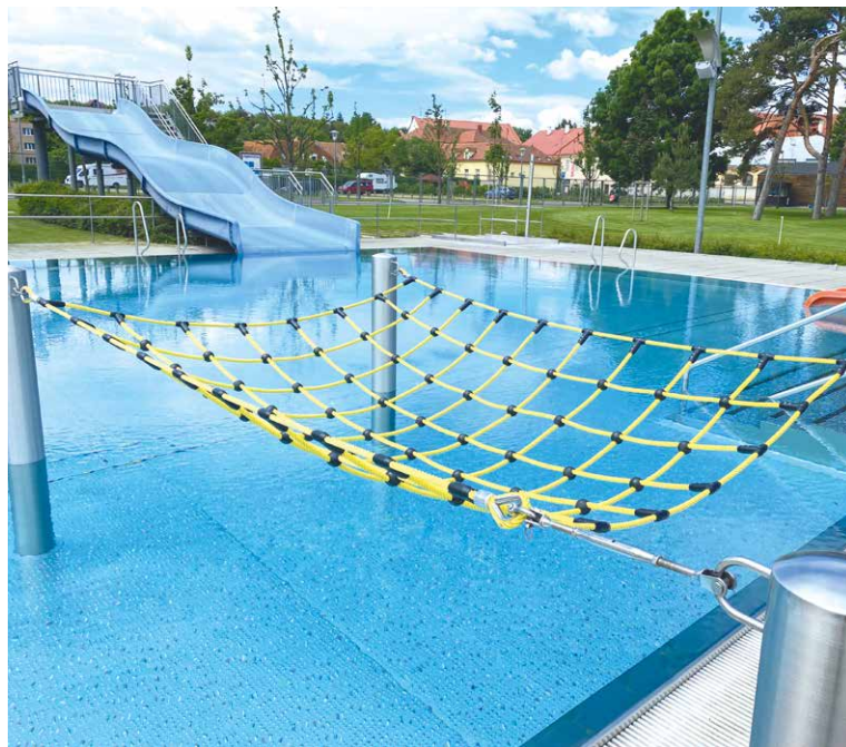
■ Atrakce plovárny Louka.

vstupem na plovárnu ovšem musí všichni návštěvníci respektovat aktuální vládní opatření v souvislosti s Covid-19. lp