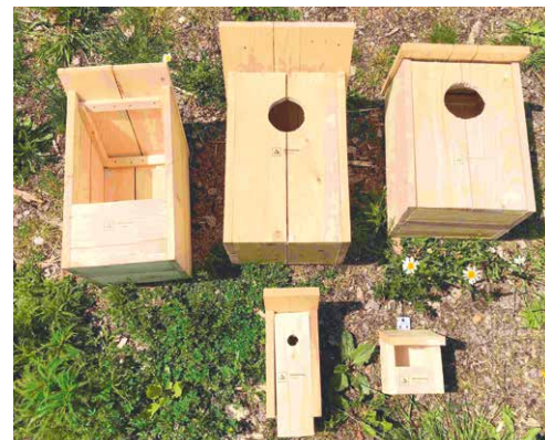
■ Budky nabízené k adopci jsou vyrobeny ze dřeva znojemských lesů.

Zájemce z řad veřejnosti se tak může rozhodnout sám, kterou z budek adoptuje. Každá budka bude zaměstnanci lesů instalována na konkrétní místo v Městských lesích Znojmo. Dárce pak obdrží GPS souřadnice a certifikát o adopci. „Dřevo, ze kterého jsou budky vyrobeny, pochází z našich lesů, kde se hospodáři trvale udržitelým způsobem. Garantem tohoto hospodaření je certifikace PEFC. Cílem certifikace je zachování lesů a jejich rozšiřování, abychom my i generace budoucí mohli využívat environmentálních, sociálních a ekonomických přínosů, které lesy