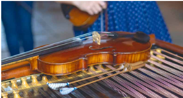
■ Na večery u cimbalu se nezapomíná.

V devátém ročníku celostátní akce Noc divadel nemůže zůstat stranou naše krásné Městské divadlo. Na sobotu 20. listopadu připravilo pro návštěvníky pestrý program. Začne v 16.00 hodin ve foyer divadla, kde vystoupí děti ze Základní umělecké školy Znojmo. Z místa u baru budou znít filmové melodie, bude možné se fotografovat v kostýmu a také usednout do hlediště a podívat se na divadelní představením 3 VERZE ŽIVOTA . V komedii o tom, že v životě stačí jedno špatně zvolené slovo ve špatnou chvíli a všechno je jinak, hrají dva manželské páry skuteční manželé (jen se ve hře trochu promíchají) herci Linda Rybová a David Prachař, Jana Janěková ml. a Igor Chmela. Představení začne v 18.00 hodin a je zdarma (nutná je rezervace místa na TIC, Obroková ul., tel. 515 222 552). lp