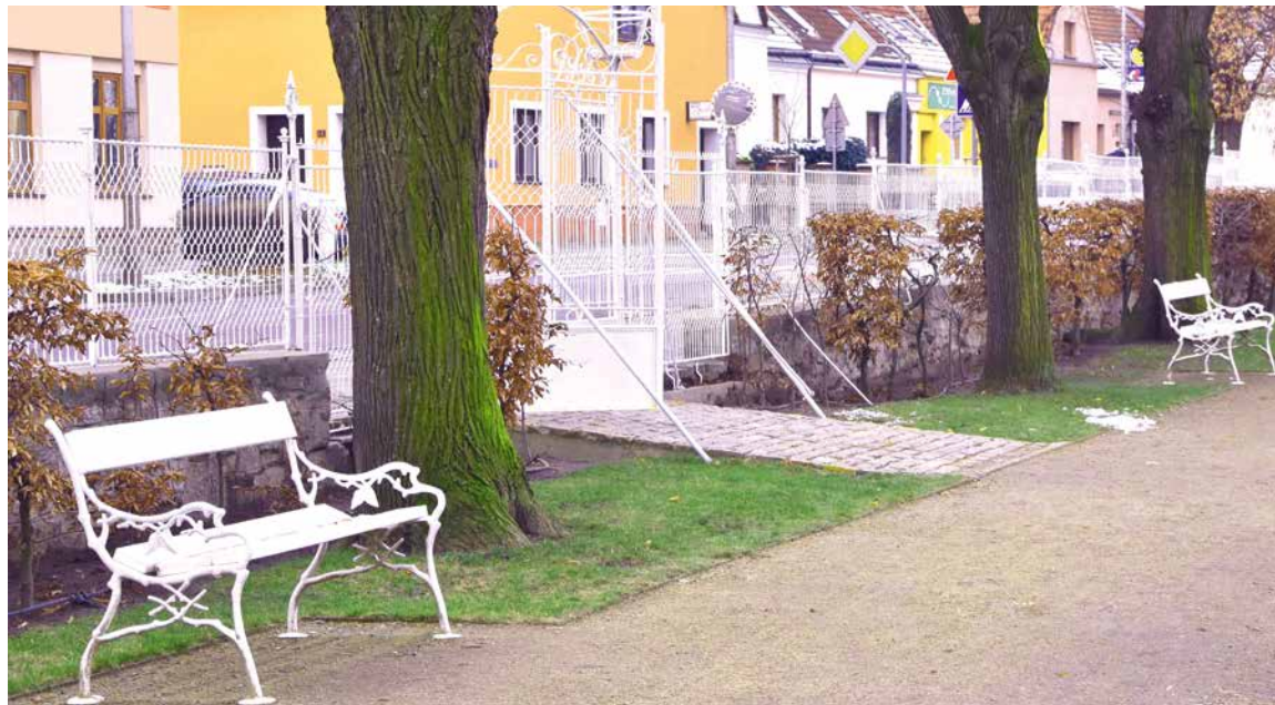
■ Součástí památkové obnovy Jubilejního parku je i nový plot. Barvu dostal bílou podle historických podkladů.