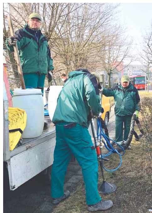
■ Aplikace hydrogelu pomocí injektážního stroje.

„Na tom, že jsme byli vybráni, má samozřejmě velkou zásluhu vedení naší Městské zeleně, která se aktivně snaží vyhledávat možnosti rozvoje zeleně a nebrání se novinkám. Velký dík za tento přístup,“ dodal starosta Malačka. pm