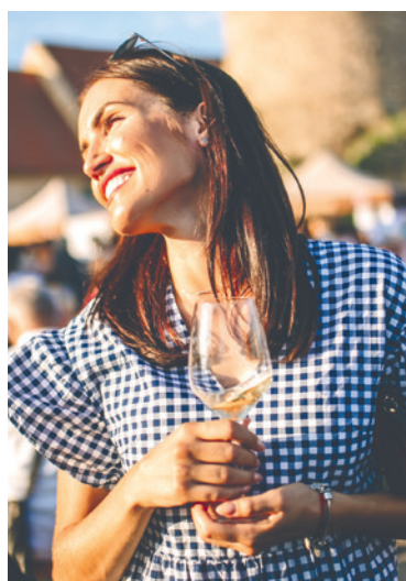
■ Festivalová atmosféra na pozadí historického Znojma.

Facebooku a Instagramu VOC Znojmo. Podrobný program jedné z nejnavštěvovanější akce města vyjde také v tištěné podobě 2. září ve speciálu Znojenských LISTŮ. lp