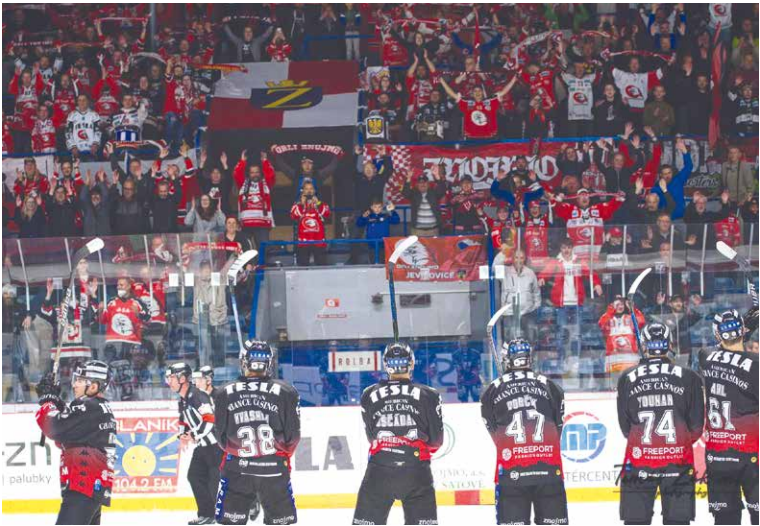
■ Fanoušci a jejich hokejové hvězdy.