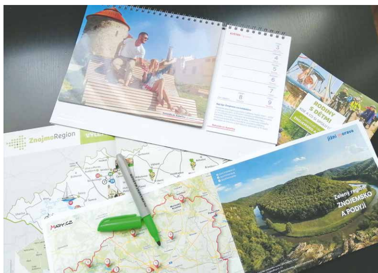
■ Nové propagační materiály jižní Moravy.

Jednotný design, aktuální informace, přehledné tipy na nejzajímavější turistické cíle, krásné fotky. To všechno najdete v nových tiskových materiálech, které se připravují pro návštěvníky Jihomoravského kraje. Textové i obrazové podklady za turistickou oblast Znojmo a Podyjí přitom dodává destinační společnost ZnojmoRegion, která má celou naši oblast na starosti. Hotové budou na přelomu března a dubna a najdete je pak ve všech regionálních infocentrech znojemského okresu.