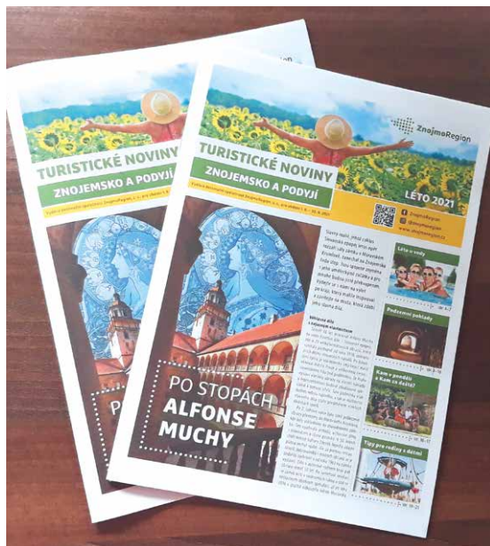
■ Podoba novinky – Turistické noviny Znojenska a Podýjí.

Turistické noviny Znojenska a Podýjí jsou zdarma k dispozici na všech regionálních informačních centrech, u členů a partnerů ZnojmoRegionu i na nejvýznamnějších turistických cílech v oblasti. V jejich vydávání chce ZnojmoRegion určitě pokračovat i v dalších letech. IN