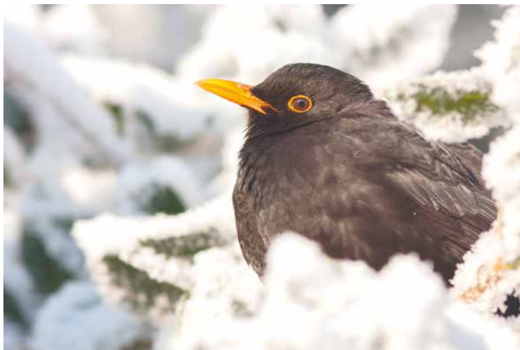
■ Kos černý.

Oblíbenou zábavou dětí i dospělých je v zimních měsících krmení vodního ptactva. Ve Znojmě jsou to nejvíce labutě na řece Dyji. Doporu-