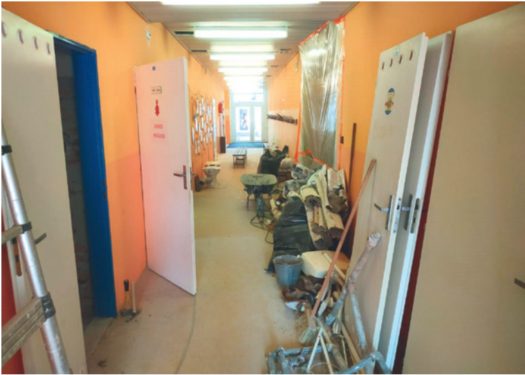
■ Obvyklý prázdninový obrázek školních chodeb. Do 1. září ale stavební materiál zmizí.

V prázdninových měsících střídají žáky a učitele ve školních budovách opraváři, malíři a dělníci. Město Znojmo a školy, které zřizuje, se tak pustily do pravidelných oprav i větších investic. V rozpočtu bylo letos vyčleněno více než 31 milionů. „Z celkové částky putuje do mateřských škol přibližně 5,7 milionů korun, do základních pak 25,8 milionů korun. Vzhledem k uzavření škol a distanční výuce se s některými opravami začalo dříve než obvykle, a tak už jsou některé hotové nebo se na nich pracuje. Další čekají na výsledky výběrového řízení,“ řekl místostarosta Jan Grois, který má v gesci školství. S největší položkou v rozpočtu je počítáno na financování projektu na Základní škole JUDr. J. Mareše. Projekt vyřeší problém s přehříváním budovy v letních měsících. „Předpokládané náklady jsou vyšší než 28 milionů korun, proto jsme využili možnost žádosti o dotaci z Evropské unie. Poskytnuta nám bude dotace v maximální výši 11,8 milionů korun. Aktuálně se připravujeme na výběrové řízení