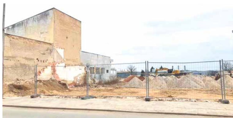
■ Stav objektu bývalých jatek k 23. březnu 2021.