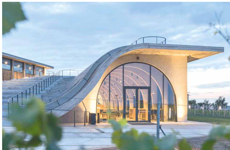
■ Nepřehlédnutelná vlna Vinařství LAHOFFER.

bralo zlato v kategorii Velká vinařství (produkce nad 250 000 l/rok). V roce 2020 otevřelo vinařství novou, architektonicky výjimečnou výrobní, administrativní a návštěvnickou budovu a uspořádalo první ročník letního kulturního festivalu Vlnobyty. Letos je již připraven druhý ročník kulturní aktivity. V roce 2019 prostřednictvím své sesterské společnosti architektonicky ojedinělou přestavbou zrenovovalo vinařství část bývalého znojemského pivovaru na Enotéku znojemských vín – degustační prostor pro veřejnost se 120 vzorky vín výhradně ze Znojemské vinařské podoblasti. I tady se blýská na prestižní ocenění, tentokrát nesoucí jméno významného světového architekta Ludwiga Mies van der Rohe. Mezi 449 nominovanými projekty je jedenáct z České republiky a hned dva ze studia Chybík + Kristof Architects & Urban Designers. Nominováni jsou za projekt Vinařství LAHOFFER a projekt Lahofer - Enotéka Znojmo. Cena se vyhlašuje jednou za dva roky, letošní výsledky tak budou známy v dubnu 2022. lp