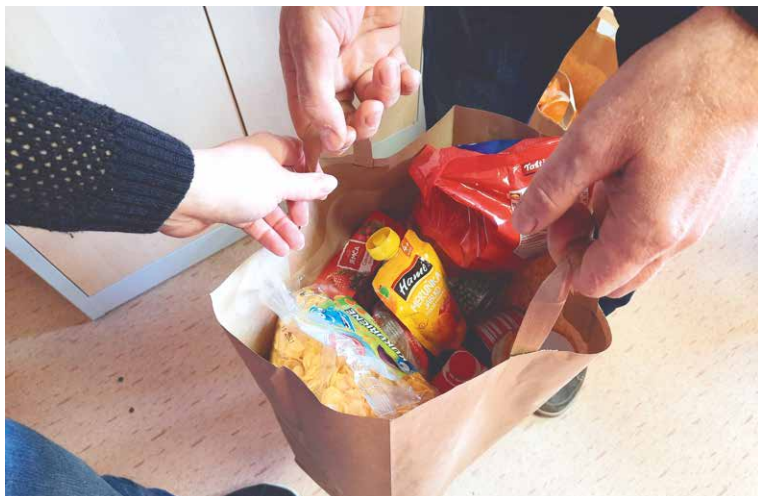
■ Velkou pomocí je pro potřebné vždy získání trvanlivých potravin.