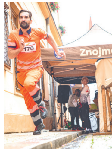
■ Závod Znojmo Extreme 790 odstartuje na Obrokové ulici v sobotu 28. srpna.

Sportovci znovu podpoří osoby s mentálním postižením. Startovné, 1 000 korun za tým, bude letos věnováno Dennímu stacionáři sv. Damiána Znojmo na Hradišti, který provozuje Oblastní charita Znojmo. Na startovní trať se navíc postaví i tým ze stacionáře. Soutěžit se bude v kategoriích muži, ženy a mix, každý tým musí mít pět členů. „Účastníci závodu se mohou těšit na speciální medaile. Přímou