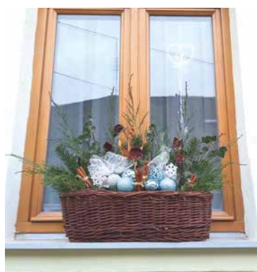
■ Vítězná výzdoba Petronely Hájkové.