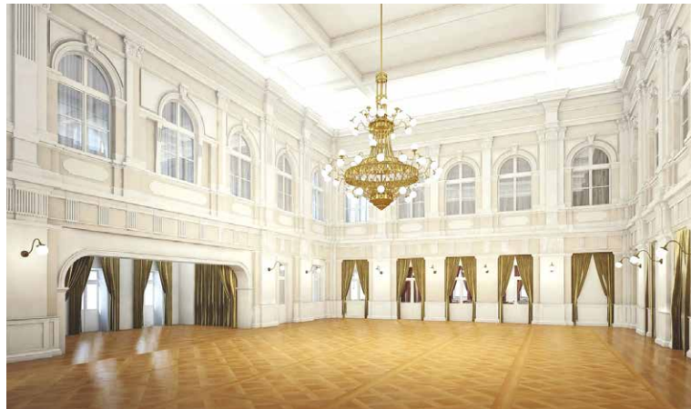
■ Možná moderní podoba tanečního sálu.

Objekt Domečku v sobě skrývá velký společenský sál v přízemí, kde má vzniknout taneční parket a pódium, jak tomu bývalo za časů jeho někdejší slávy. Domeček bude sloužit i jako restaurace s prostornou stinnou zahrádkou směrem do parku. Ve spo-