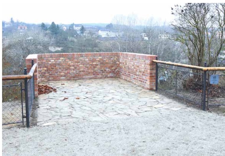
■ Opravenou vyhlídku v Louckém parku už stačil před pár dny poškodit sprejer. Naštěstí má zeď speciální nástřik, který dovoluje nežádoucí „dílo“ odstranit.