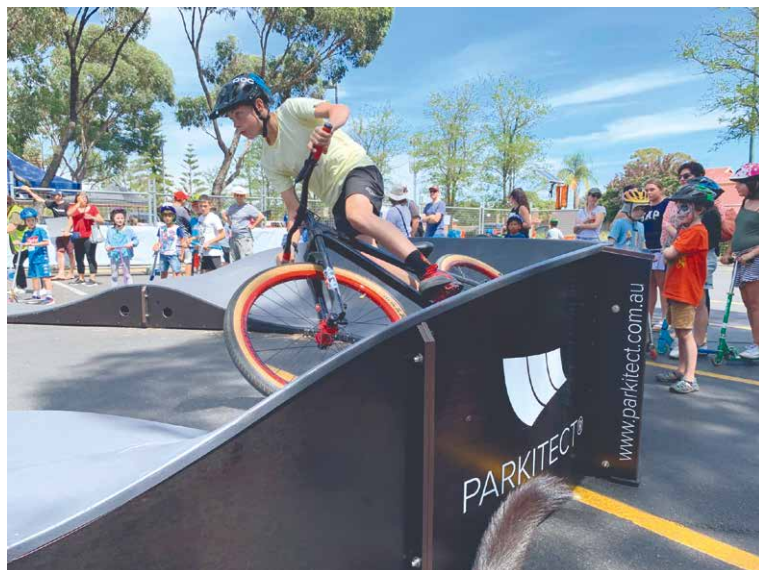
■ Pumptrack – návrh počítá se zakoupením a umístěním modulárního pumptracku na území Znojma. Uměle vytvořený uzavřený okruh dává cyklistům všech kategorií možnost rozvinout svoji jízdní zručnost.

Na vyhotovení projektů ve městě jsou vyčleněny 2 miliony korun, stejně jako na projekty v městských částech. „Děkuji všem navrhovatelům, kteří se do letošního ročníku zapojili. Poděkování patří také všem respondentům, kteří svým hlasováním vyjádřili svůj názor. Ukázali, že jim jejich okolí není lhostejné a záleží jim na dalším rozvoji města Znojma. Letos se do hlasování zapojilo o 2 093 respondentů více než v loňském roce. Jsem moc rád, že