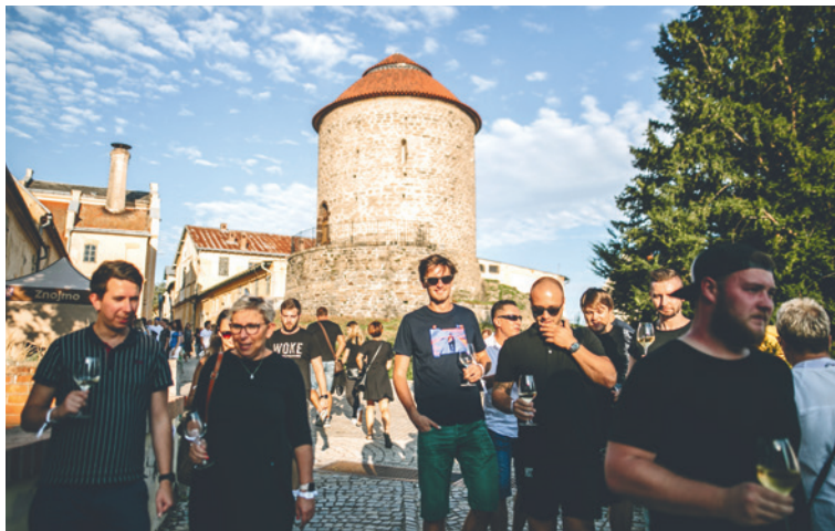
■ Festival charakterizuje dobrá nálada a přátelská atmosféra v kulisách krásného Znojma.