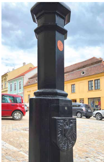
■ Patky sloupů veřejného osvětlení s reliéfem znaku města Znojma.

Rekonstrukce se týkala také vodovodních a kanalizačních přípojek a přípravy pro položení metropolitní sítě. Nové je veřejné osvětlení, parkovací stání, vydlážděná je celá plocha obou ulic. Přibyl podzemní kontejner na separovaný odpad (určený pro plast), novinkou jsou stojany na kola. Současně je zde připraveno napojení na možné umístění dobíjecí stanice pro elektrokola. Novinkou je zeleň. „Chtěli jsme ulici Horní Českou osvě-