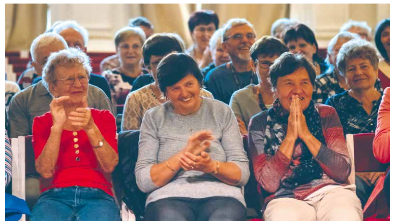
■ Hosté z Břeclavska na klauniádě Kočkabaret.