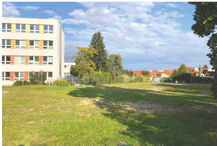
■ Místo, kde bude parkoviště umístěno.

Parkoviště je navrženo jako jednosměrné ve spodní části pozemku a při jeho realizaci nedojde ke kácení stávající zeleně, pouze se odstraní část náletových keřů, a to na místě budoucího nájezdu a výjezdu na parkoviště. Svah, který v ploše odděluje horní část pozemku, bude osazen novým živým