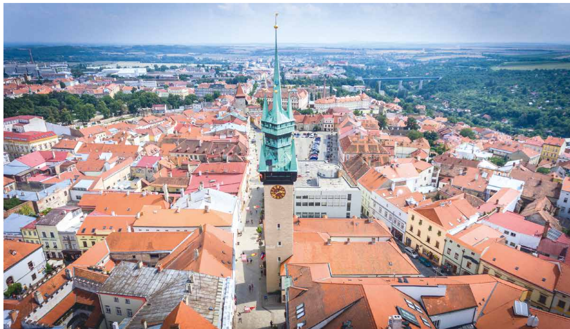
■ Silueta radniční věže je charakteristický symbol města Znojma.