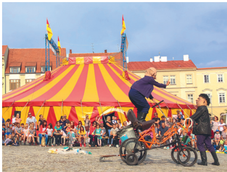
■ Hrát se bude pod šapito i venku, stejně jako v předchozích ročnících.