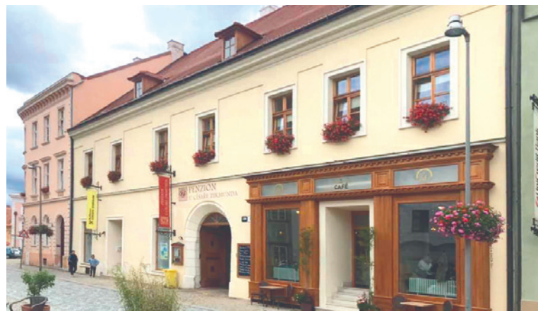
■ Bývalá a současná podoba domu.