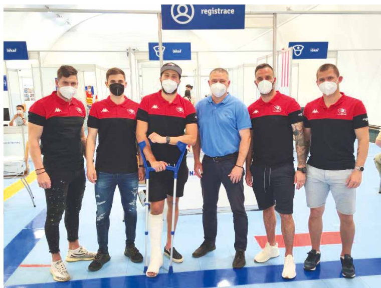
■ Hokejisté Orlů pomáhali v nemocnici.