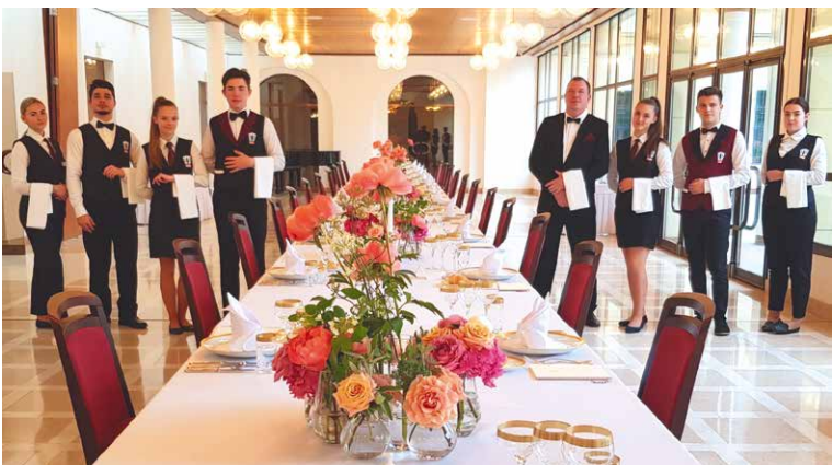
■ Žáci na velvyslanectví ve Vídni.