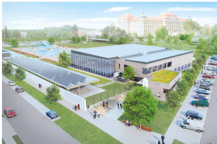
■ Vizualizace nového krytého bazénu v Louce.

„Pro finální rozhodování jsme chtěli mít co nejvíce relevantních podkladů, protože se jedná o strate-