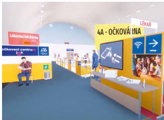
■ Očkovací centra modelovali odborníci kraje ve spolupráci s vědci z VUT Brno – vizualizace najdete na YT kanále města ( www.youtube.com/znojmoofficial ).

„Očkování je jediný způsob návratu do normálního života a já jsem moc rád, že díky skvělé spolupráci a koordinaci s krajem a nemocnicí jsme schopni prakticky v horizontu maximálně dvou, tří týdnů připravit k ostrému provozu naše očkovací centrum. S registrací na očkování seniorů 80+ budou i nadále pomáhat naši pracovníci sociálních odborů na číslech 733 781 612 a 733 781 614. Volat mohou v pracovních dnech od 8.00 do 16.00. Jen dodám, že na konkrétní termín se budou moci senioři přihlásit ve chvíli, kdy bude jasné, kdy vakcíny do Znojma dorazí. Konkrétní datum zatím nemáme, ale seniorům, se kterými jsme v kontaktu, dáme vědět. Ostatním doporučujeme sledovat web nemocnice a taky speciální web www.opatreniznojmo.cz , tam najdou vždy aktuální informace,“ dodává starosta Znojma Jakub Malačka. zp, lp