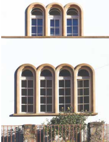
■ Weinbergerova vila – krása detailu.

může vložit maximálně 3 fotografie. Soutěž vrcholí předáváním cen a diplomů u příležitosti Mezinárodního dne památek a sídel v Národním muzeu v Praze, a to 20. dubna 2021. lp