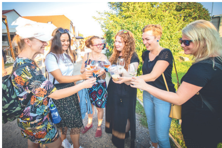
■ S VINAŘSKÝMI T(R)IPY jsou spojena přátelská setkání nad vínem.

Do kulturního programu VINAŘSKÝCH T(R)IPŮ se vejdou nejen cimbálůvky a hudba, která bude znít přímo u některých sklepů, ale také připomínka historie. Doporučujeme podívat se s dětmi nejen na hrad, ale také na středověké ležení v Jižním hradebním příkopu za Vlkovou věží, kejklířská vystoupení, řemeslné dílny nebo si vyzkoušet střelbu z luků. Znojemem bude znít charakteristický řízný zvuk vinobraní, o který se postará bubenická družina Tambora Bohemica.