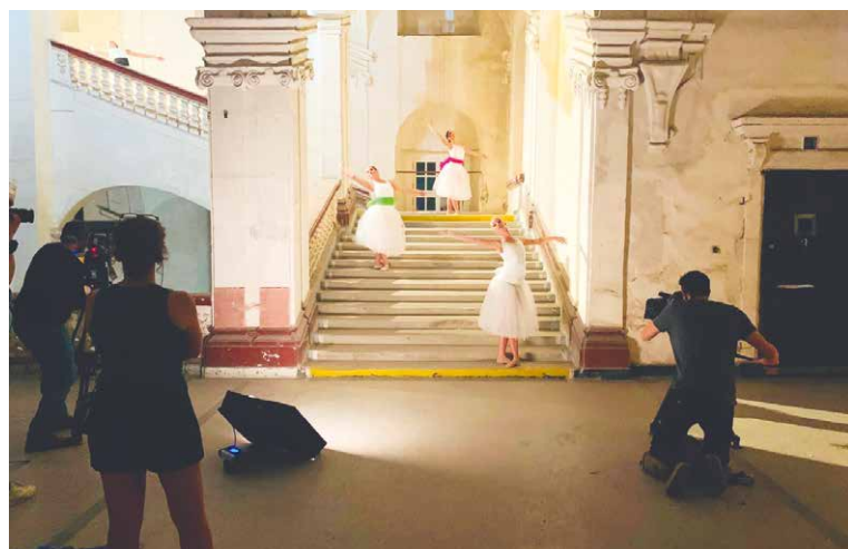
■ Natáčení v chodbách kláštera v Louce.