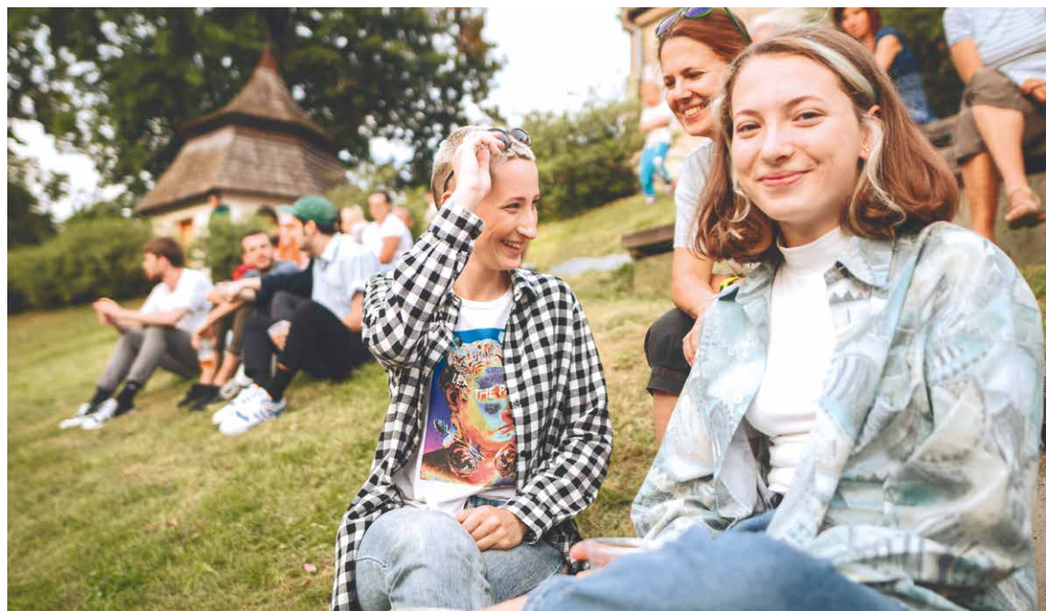
■ Užijte si léto ve Znojmě i na oblíbených akcích, které se podařilo přesunout do prázdnin.

Znojmo žije divadlem nebo program na Káře. I další instituce a organizátoři, kteří se připojili do programu prázdninových měsíců, jsou už nedočkavě připraveni na startu - Hudební festival Znojmo, Jihomoravské muzeum, zážitkové prohlídky i jízdy městem a další. Více se dočtete uvnitř LISTŮ a ve speciální osmistránkové příloze. lp