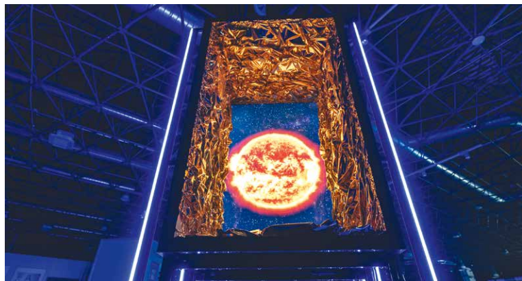
■ Exponát pro Dubaj vystaví v Domě umění.

v Dubaji (1. 10. 2021 – 31. 3. 2022). Model vypadá jako velký dutý kvádr a odkazuje na dva významné jihomoravské technologické obory – elektronovou mikroskopii a vesmírný průmysl. Zároveň vychází z tématu spojení perspektiv mikro a makro světa. Od soboty 6. listopadu vypukne na Horním náměstí (6.–14. 11.) a ve sportovní hale Dvořákova (6 a 7. 11.) zábavná i naučná show pod taktovkou brněnských popularizátorů vědy a techniky. lp