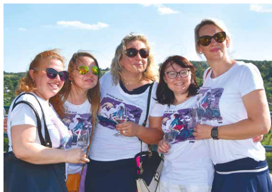
■ Tým BĚHny.