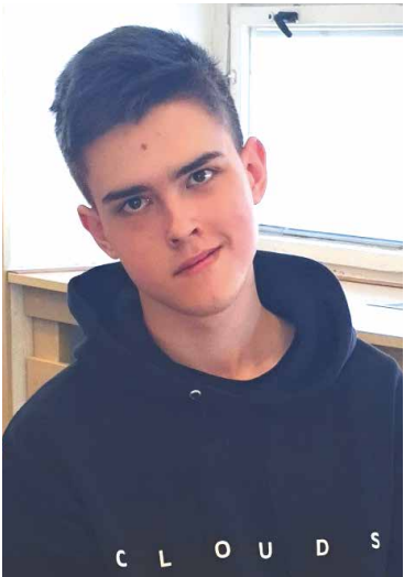
■ Vojtěch Havlík.