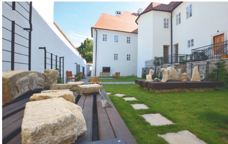
■ Muzejní expozice Tichá řeka kamení v minoritském klášteře.