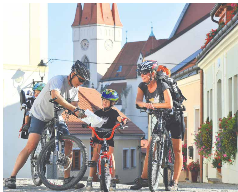
■ Mapy cyklotras jsou v infocentrech mezi turisty stále více žádané.

zde také výlety vhodné pro koloběžky či in-line brusle, které jsou díky zpevněnému povrchu cest ideální i pro výpravu s kočárkem.