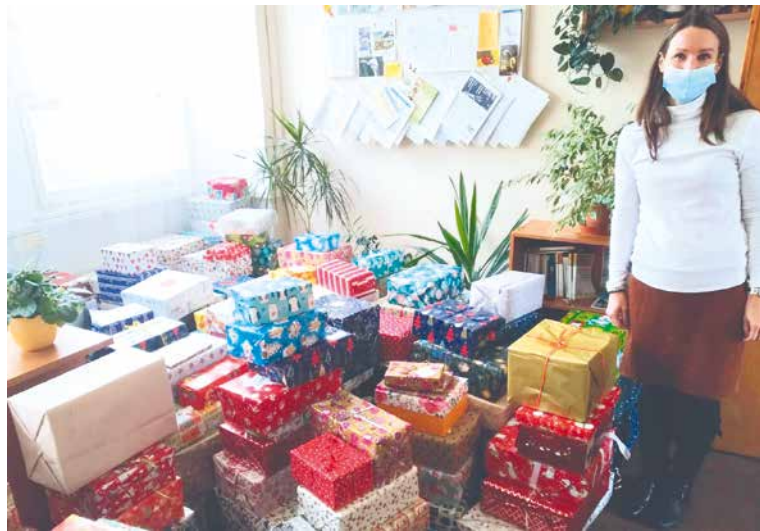
■ Kancelář pracovníce sociálního odboru zaplnily balíčky, které udělaly radost druhým.

Loňský rok plný nenadálých změn a situací zakončili pracovníci sociálního odboru Městského úřadu Znojmo rozdáváním radosti druhým.