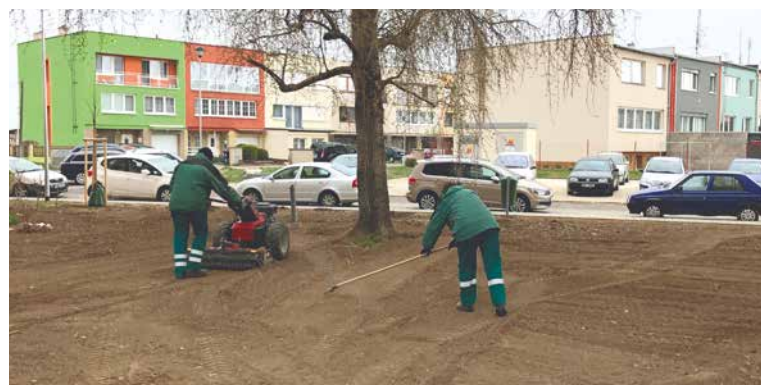
■ Městská zeleň už vysela trávníky.

Do sídliště, které pochází ze 70. let, se od jeho vzniku prakticky neinvestovalo. Obyvatelé se tak po mnoha letech budou moci těšit, že s jarem se vnitroblok zazelená a zkrásní. kj