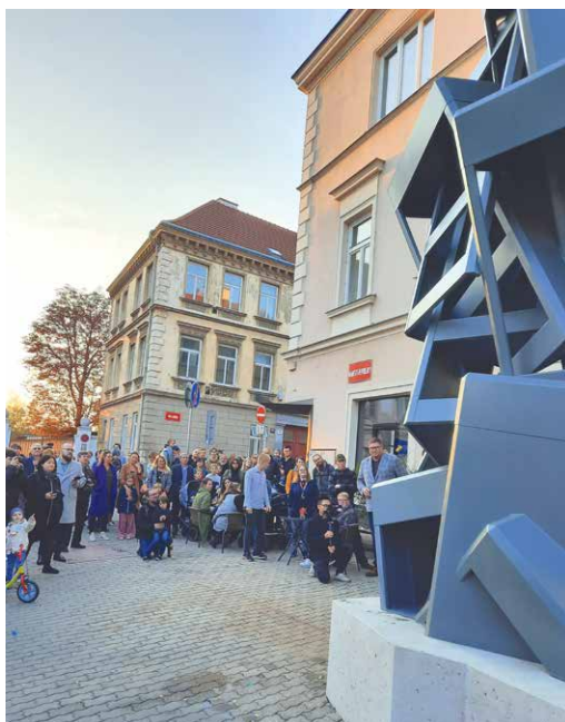
■ Na odhalení sochy přišla více než stovka lidí.

Maxima Velčovského, který je známý svými parafrázemi běžných předmětů, jež následně transformuje do nových, neobvyklých rolí. Pro konkrétní pro-