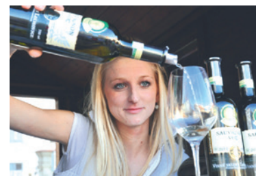
■ Ochutnáte nejen letošní vína VOC.

Vína VOC Znojmo sjednocuje mimořádná aromatická chuť, způsobená střídáním studených nocí a teplých dnů v době zrání hroznů, což má velký vliv právě na tvorbu aromatických látek. Díky těmto podmínkám jsou vína z okolí Znojma velmi výrazná a dobře rozpoznatelná.