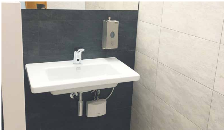
■ Sociální zařízení bylo modernizováno s ohledem na to, že se jedná o veřejností hojně navštěvované místo.

nější cenovou nabídku ve výběrovém řízení. zp