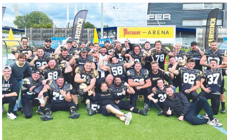
■ Rytíři po vítězství v Grazu.

Steelsharks Traun, který si tím zajistil účast v semifinále. St. Pölten dosud ve čtyřech utkáních ani jednou neuspěl. eks