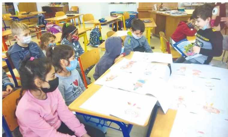
■ Prvňáci si maskota Sovíka také nakreslili do svých čtenářských deníků.

Když Znojemské vinařství (MAP), tvůrce projektu Sovíkovo putování, poslali do světa maskota Sovíka, doputoval také do 1.C Základní školy Václavské náměstí ve Znojmě.