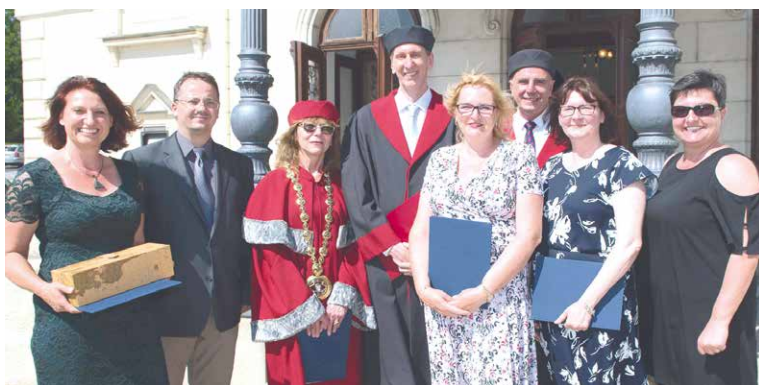
■ Noví bakaláři si převzali jmenování v městském divadle.