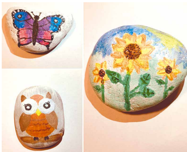
■ Fotky malovaných kamínků se často objevují na sociálních sítích jako je Facebook, kde jsou řízeným cílem výletů.