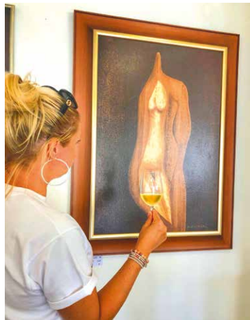
■ Jedno z vystavených děl.

Obohacena je o sochařská díla jeho otce Jana (1910–1974) a dědeč-