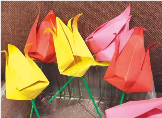
Papírové tulipány do kytice.

Aktivně se zapojily do projektu Tulipánový měsíc a Pošlete přáníčko onkologicky nemocným, jejichž cílem je přinést s jarem naději všem, kteří se setkávají s onkologickým onemocněním. Jde o projekty neziskové organizace Amelie, která onkologicky nemocným pomáhá. Dívky v rámci výuky učební praxe tedy šily, kreslily, stříhaly, lepily, psaly citáty a vzkazy. Snahou bylo vše vytvořit s podtextem tulipánů. Vznikly tak originální