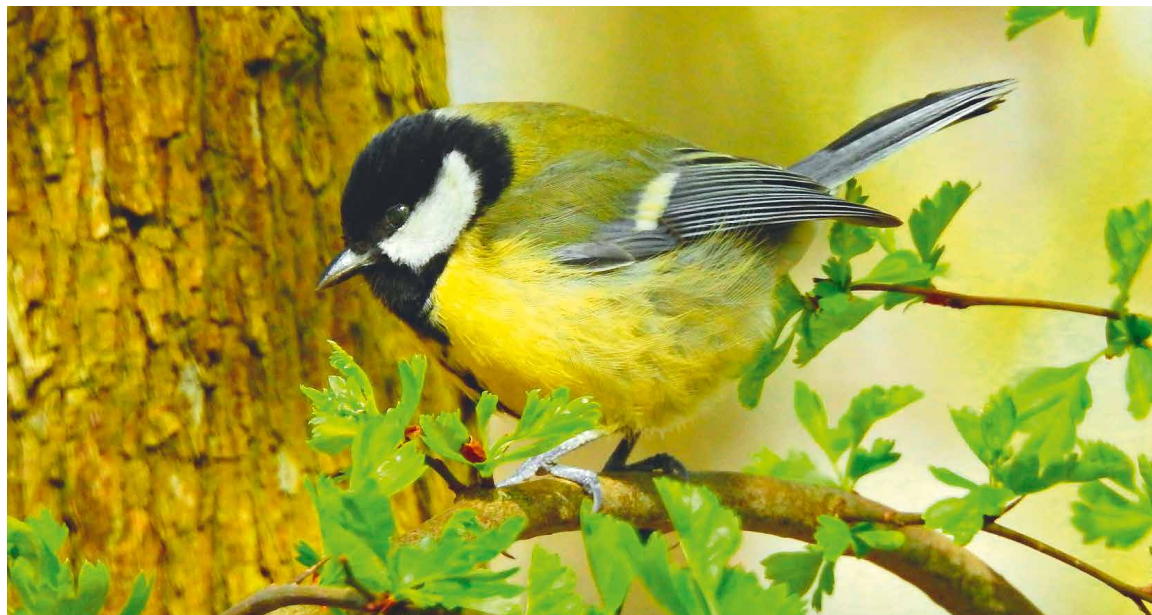
■ Budku k hnízdění, kterou si dárce adoptuje, určitě ocení i sýkorka.

Ideální čas k umístění ptačích budek je jaro. Zapojit se tak mohou zájemci už nyní. Více na str. 14.