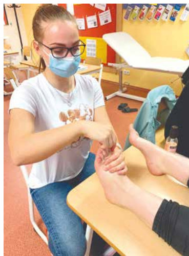
■ Zájem o kvalifikovanou pomoc z oblasti reflexní terapie stoupá.

Studentky oboru Sociální činnost ze střední školy na Přímětické ulici (SOU a SOŠ SČMSD, Znojmo) mají možnost se ve druhém ročníku rozhodnout pro volitelný předmět reflexní terapie.