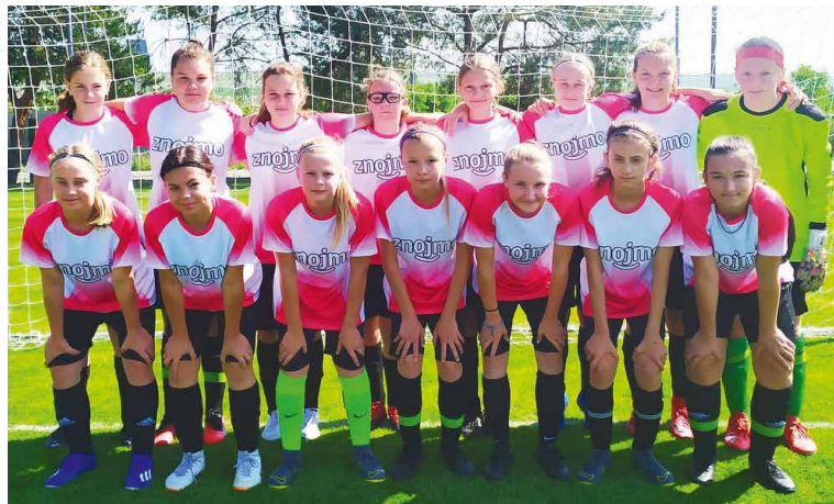
■ Divčí tým FK Znojmo, který byl založen v roce 2017, bude hrát moravskou část celorepublikové 1. ligy žáků.