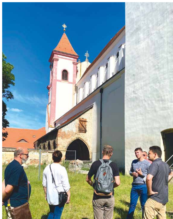
■ Debata o budoucnosti Louckého kláštera.

V případě úspěšné realizace projektu zpřístupnění nejstarších částí kláštera s kostelem se pak jako další kroky nabízejí adaptace takzvaného důstojnického pavilonu (budova naproti kostelu v těsné blízkosti řeky Dyje) pro účely hotelu a navazujících služeb. A konečně pak využití barokního konventu na střeoevropskou galerii církevních řádů. „K tomu však povede ještě dlouhá cesta. Jsem moc rád, že se díky vzájemné komunikaci a ochotě spolupracovat rýsuje pro Loucký klášter velmi slibná vize a konkrétnější budoucnost,“ konstatoval historik Kacetl. lp, zdroj: JK