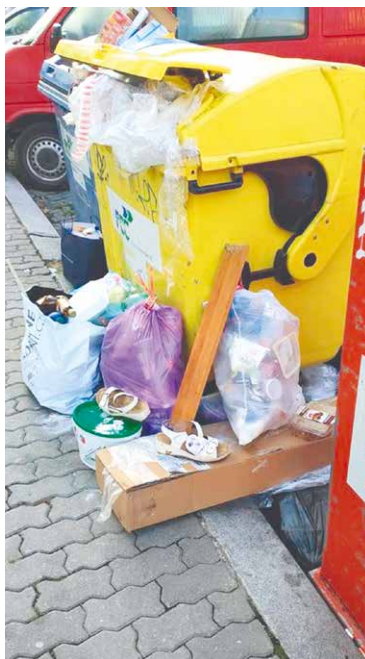
■ Černá skládka v ulicích města.

Městská policie se na kontrolu pořádku u kontejnerů a černé skládky zaměřila v posledních měsících loňského roku. Strážníkům pomáhá kamerový systém a v některých lokalitách i fotopasti. „Lidé odloží vedle kontejnerů na tříděný odpad například nábytek, staré spotřebiče, matrace, židle, monitory a podobně. Jelikož je ale odkládání odpadu mimo kontejnery a podobné nádoby zakázáno, dopustí se tím přestupku. Správně měli tyto věci odvézt do sběrného dvora. Pokud zaznamená hlídka nebo kamera, že někdo odkládá odpadky na místě, které k tomu není určeno, osobu pokutujeme. V případě porušení zákona můžeme na místě uložit pokutu až do výše 10 000 korun, ve správním řízení může být výrazně vyšší,“ vysvětluje ředitel Městské policie Ivan Budín.