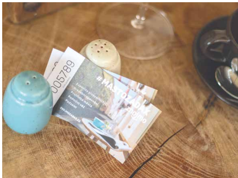
■ Nová rozměrově menší podoba poukazů je praktičtější.

A že má Znojmo opravdu co nabídnout, se můžete přesvědčit na webu Znojemské Besedy už teď. Najdete na něm tipy na výlety kam pěšky, kam