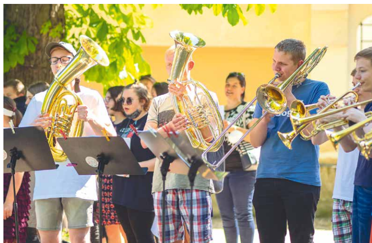
■ Společné hraní po několika měsících.