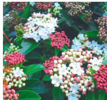
■ V nové výsadbě lesoparku se objeví také krásné kaliny, kterých existuje na dvě stě druhů. Některé keře zdobí květy i v chladných měsících.