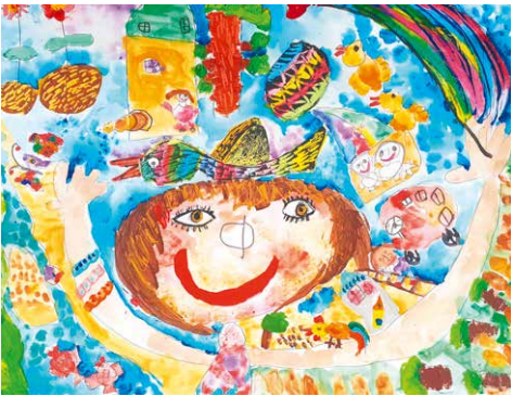
■ Z vybraných děl bude uspořádána výstava v prostorách Městského úřadu ve Znojmě.

Výtvarné práce musí být v jednotném formátu velikosti A3 (297x420 mm), je možné ale zvolit libovolnou techniku. Každý může zaslat pouze jednu práci, která musí být