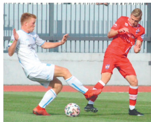
■ Momentka z pohárového duelu proti Líšní.

Jeho úkolem tak je tým během podzimu stabilizovat a sehrát. „Tím, jak se to hodně měnilo, v naší hře ještě nejsou ty správné automatismy, které jsou základem jakékoliv sportovní činnosti. To je největší problém. A proti mužstvům, která mohla v době korony trénovat a my ne, nám chybí sehraň. Musíme být trpěliví, nepanikařit při nějakých nezdarech a pracovat, pracovat a pracovat. Nic jiného nám nepomůže. Pro mě je cílem stabilizovat kádr a předvádět pohledný fotbal. A až si to sedne, můžeme se bavit v zimě o cílech. Když měníte kádr, nemůžete vykládat, že cíl je hrát o první místo. Samozřejmě ne-