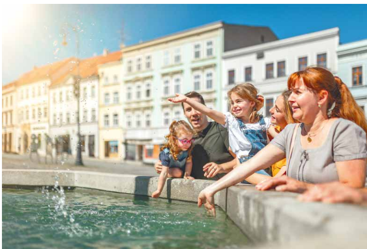
■ Znojmo navštívily v létě celé rodiny.

„Byla to druhá jízda projektu #mastozadax, který v České republice nemá obdoby. Na pokladnách jsme