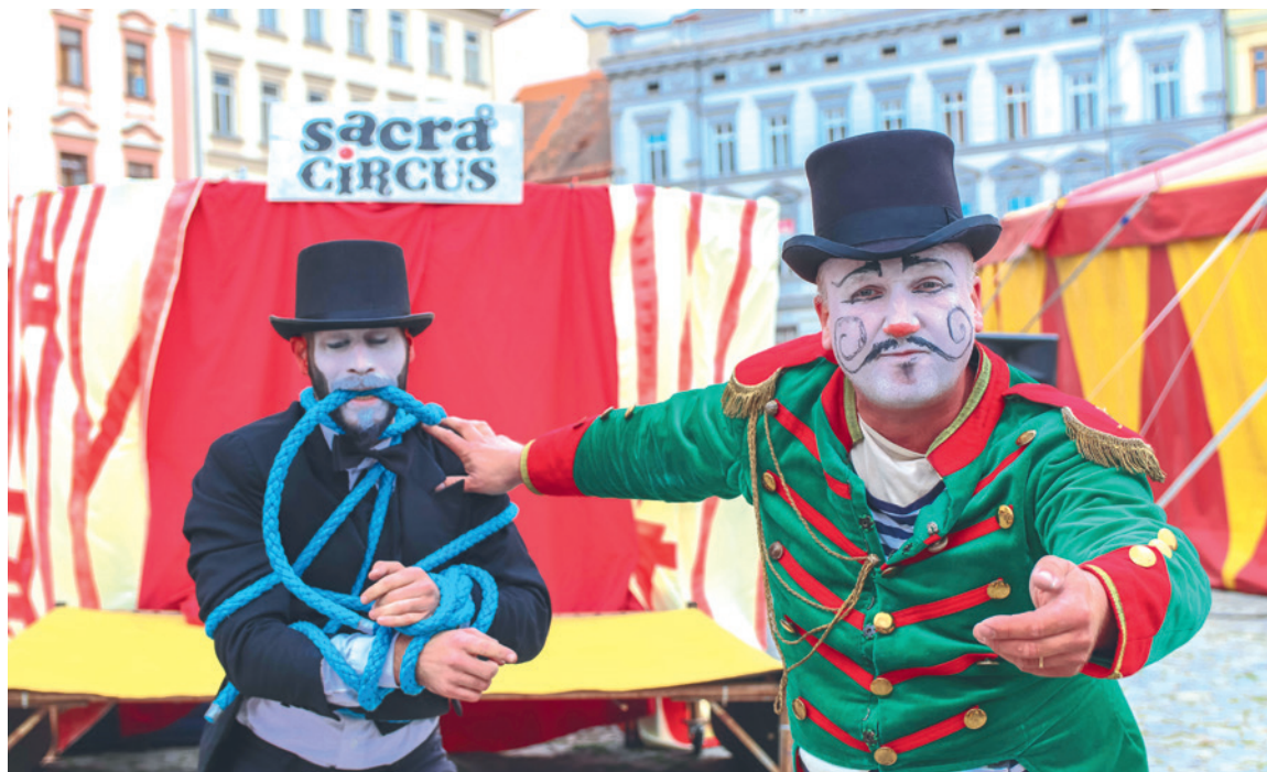
■ Na Horním náměstí se vrací šapito i herci, kejklíři a akrobaté.