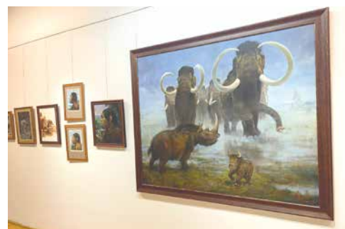
■ Ukázka z výstavy.

Součástí výstavy jsou také paleontologické ukázky fauny i flóry z depozitářů znojemského muzea. lp