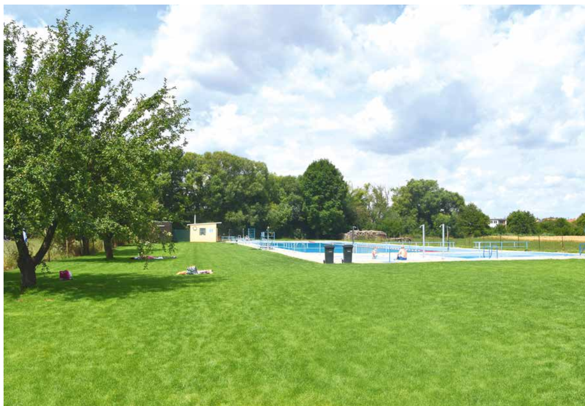
■ Koupaliště v Mramotících.