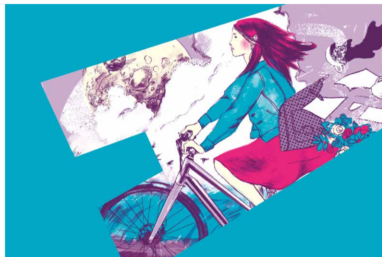
■ Letošní oficiální vizuál soutěže Do práce na kole!

Čtyři vlny registrací: 1. vlna registrací (1.–28. 2.) poplatek 320 Kč, 2. vlna re-