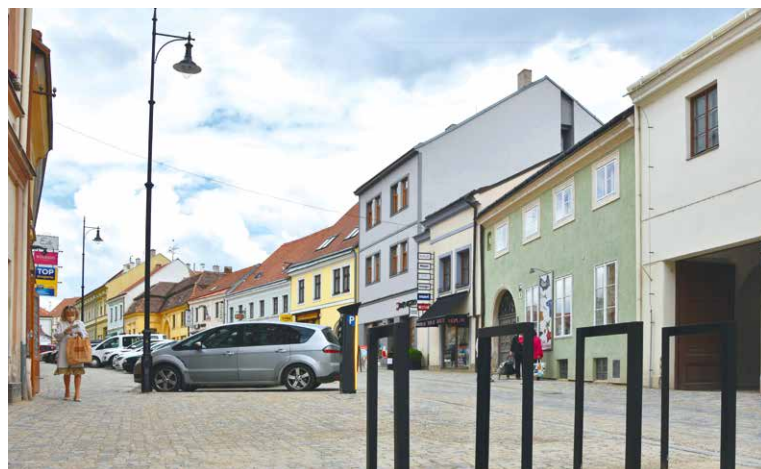
■ V dolní části ulice u prodejny Cyklo Kučera a u Znovínu Znojmo přibýly stojany na kola.

žit zelení. Po této stránce jsme ale moc možností kvůli inženýrským sítím neměli. Jsem vděčný alespoň za vysazení jednoho stromu. Naším záměrem především bylo, aby ulice získala jednotný vzhled a ten korespondoval s ostatními částmi historického jádra, které již v minulosti rekonstrukcí prošly. K tomu jsme zvolili i originální sloupky veřejného osvětlení, jehož patky zdobí reliéf našeho znaku,“ říká starosta. Nová světla jsou umístěná také na budově Cyklo Kučera a na bývalé lékárně na Kovářské. Slouží k nasvětlení kostela Nalezení sv. Kříže.