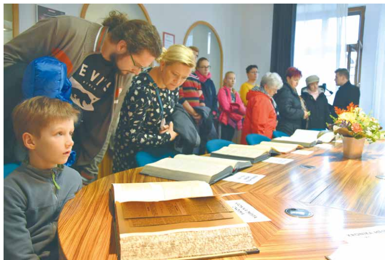
■ Každoročně se akce těší velkému zájmu veřejnosti. Zde při prohlídce kronik.

Návštěvníky už při vstupu do budovy vítá cimbálová muzika. Hlavní částí programu jsou komentované prohlídky radnice, které začínají ve vestibulu každou půlhodinu v čase od 9.30 do 13.00 hodin. Odtud mohou lidé pokračovat do pracoven starosty, místostarostů i tajemnice města, do zasedacích místností zastupitelstva a rady města (prohlídka kronik města Znojma se odehrává za přítomnosti