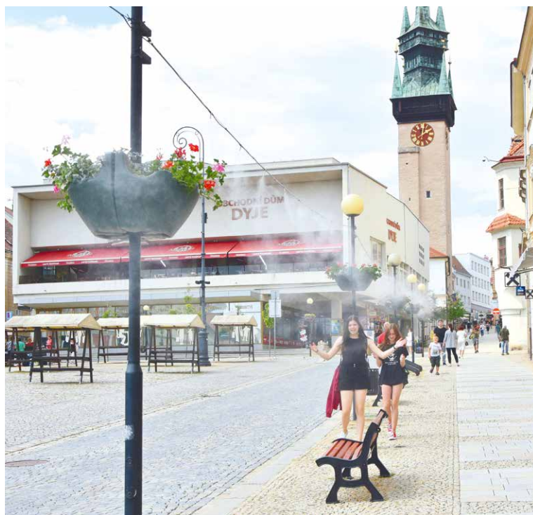
■ Novinka na Masarykově náměstí – osvěžující suchá mlha.

V boji proti parnu pomohou i planty na Divišově náměstí, které před budovou okresního archivu poskytnou vyhledávaný stín. Jsou nezvykle rostlé tak, že jejich koruna tvoří plochu podobnou slunečníku. Stromy jsou vysazené v nádobách, které budou osázeny i letničkami. pm, lp