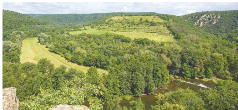
■ Vinice Šobes v Národním parku Podyjí.

Dokončená studie městu Znojmo poslouží jako podkladový materiál pro zhodnocení potenciálu Šobesu pro zápis do indikativního seznamu Ministerstva kultury a následně na seznam UNESCO. lp