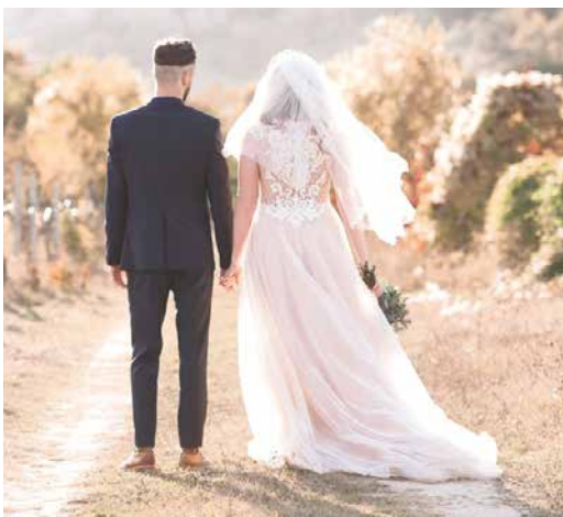
■ Svatby se konaly i pod širým nebem.

Obřadní síň zažila v minulém roce i svatby jubilejní: Rubínové (40 let) – 10 obřadů, Zlaté (50 let) – 17 obřadů a jednu Diamantovou (60 let). A do života bylo uvítáno 78 dětí. lp, zdroj: J. Ryšavá