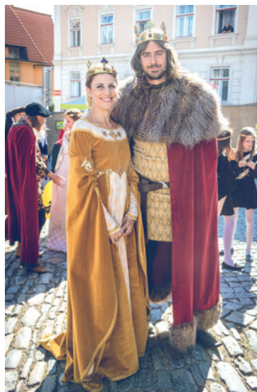
■ Královský pár.

Jedinečná akce VINAŘSKÉ T(R)IPY podruhé přivítá na Znojemsku návštěvníky v druhém zářijovém víkendu na několika místech ve Znojmě a v okolních obcích.