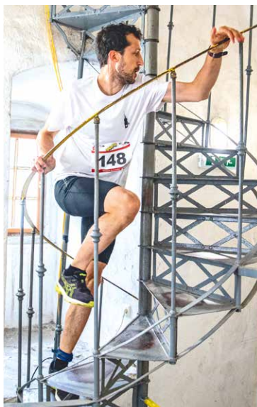
■ Náročný výběh na radniční věž.

Registrace odstartovala 28. června a startovní listina je již téměř plná.