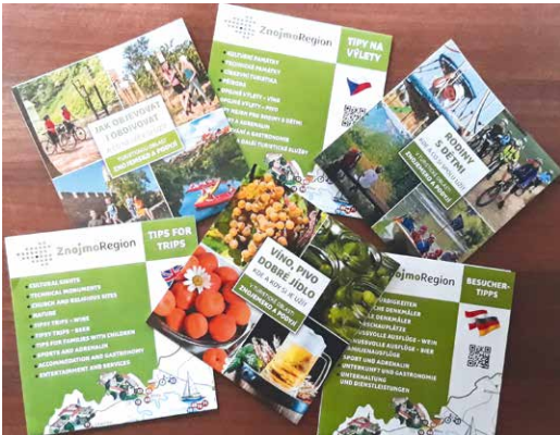
■ Všechny tiskové materiály, které ZnojmoRegion nabízí zdarma, jsou k dispozici také on-line na www.znojmoregion.cz/turisticke-produkty .

Letos se navíc série s nezaměnitelným designem rozšířila o zcela nový kousek – praktický itinerář pro dovolenou na Znojmsku a v Podyjí, který nabízí konkrétní celodenní programy v jednotlivých oblastech regionu celkem až na patnáct dnů. Kromě výletních cílů samotných přitom doporučuje i kvalitní ubytovací a stravovací služby