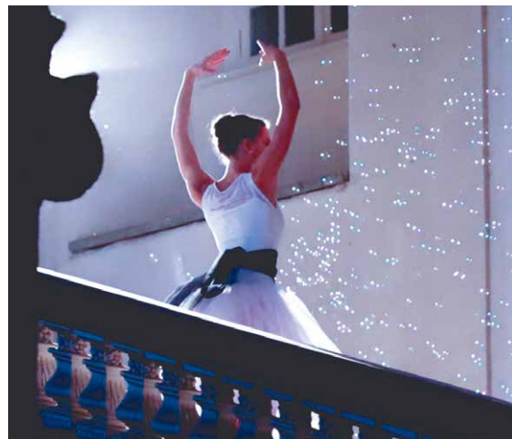
■ Natáčení v chodbách kláštera v Louce.

kláštera. Již úvodní záběr na osvětlený klášter ve tmě prozradil, že budou mít co do činnosti s tajemnou atmosférou a napětím. To uvnitř ještě umocnily svíčky rozmístěné po chodbách. Soutěžící se v prostoru pohybují po tmě, plní úkoly a práci jim ztěžují baleríny ozbrojeny laserovými zbraněmi.