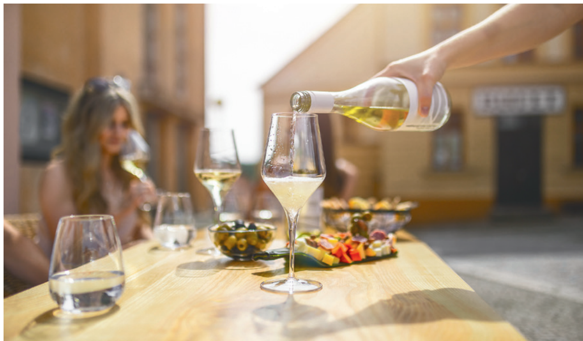
■ Snímky z loňského ročníku lákají na skvělou nabídku VINAŘSKÝCH T(R)IPŮ.

dopravy) a vše zajímavé, o co byste rozhodně neměli na VINAŘSKÝCH T(R)IPECH přijít, vám ochotně sdělí v době konání 10.–12. září v InfoPointu ZnojmoRegion na Obrokové ulici (pod Turistickým informačním centrem). Podrobnosti najdete už nyní na webu znojenskabeseda.cz. Více se programu jednotlivých vinařství věnujeme na str. 4 a 5. lp