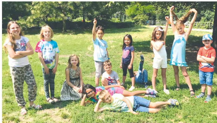
■ Učení může být zábava.