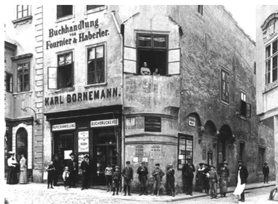
■ Dům Budčických dříve a dnes.

A mimochodem, rodina Budčických je podepsána nejen pod výše zmíněným architektonicky zajímavým domem, ale také pod stavbou dvojité, takzvané Svatováclavské kaple na Mikulášském náměstí. lp