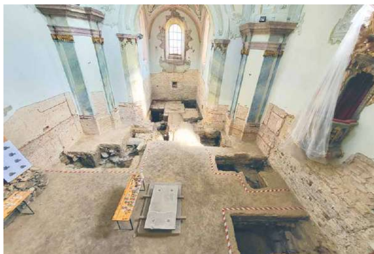
■ Archeologové pod základy kostela sv. Hippolyta odkryli nejen unikátní rotundu, ale také pozůstatky dvou kostelů z 13. století, na jejichž základech byl kostel postaven.