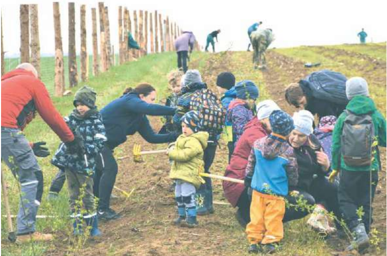
■ Dobrovolníci osadili sazenicemi dvě třetiny plochy. Zbývajících 5 000 sazenic zasázeli zaměstnanci lesů na dalších dvou plochách o velikosti 1 hektaru.

Dobrovolníci pomohli vysázet nový lesopark v Příměticích.