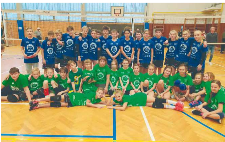
■ Mladí znojemští volejbalisté na turnaji v Letovicích.

Ze znojemského volejbalového klubu vyrazilo 35 hráčů zeleného a modrého minivolejbalu poměřit své hráčské dovednosti s ostatními mladými volejbalisty z celého kraje. Celkem se do hry zapojilo 24 družstev v zeleném minivolejbalu a 36 družstev v modrém minivolejbalu. Hrál se vždy ve skupinách po šesti týmech, jež byly seřazeny podle výsledků předchozího kvalifikačního turnaje.