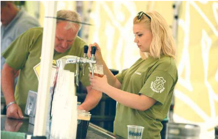
■ Nejen pánové, ale i dámská část návštěvníků Pivních slavností si ráda pochutná na dobře vychlazeném pivu.

Na třech scénách se představí energická hudba různých žánrů. Ta největší vyroste u Enotéky na ulici Hradní, kde vystoupí mladá rocková kapela Křídla, znojemská formace The Queues, také Jamaron a ve večerních hodinách pak známé skupiny O5 a Radeček a Morčata na útěku.