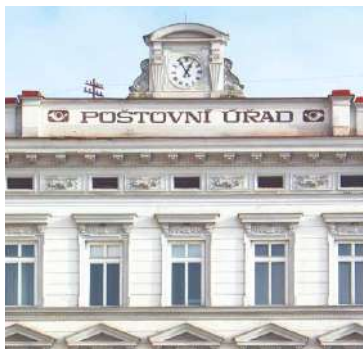
■ Budova pošty v sobě skrývá nejen prostory k možnému vybudování kanceláří, ale také dva prostorné dvory a garáže.

„Aktuálně je vypisováno výběrové řízení na nového dopravce městské autobusové dopravy. Chceme mimo jiné navýšit frekvenci spojů na Horní náměstí, aby se občané mohli k bu-