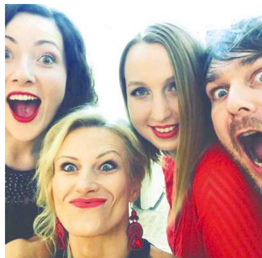
■ Koncert polského vokálního kvarteta SOUND PACK uslyšíte na JazzFestu Znojmo 21. února.