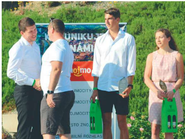
■ Z vyhlášení nejlepších sportovců za rok 2020.

V návrhu nominace uveďte kategorii, do které dotyčného přihlašujete, sport, který provozuje, jeho jméno, v případě kolektivu pak zástupce, datum narození, název TJ či SK, který reprezentuje, adresu a kontaktní telefon. Nezapomeňte uvést výčet jeho největších sportovních úspěchů za rok 2021. Pokud bude navrhujeícím sportovní klub či TJ, připojte razítko, v případě fyzické osoby pak jméno a příjmení, podpis a kontaktní telefon či email. Navrhovatel totiž může být i fyzická osoba, ne jen TJ či SK.