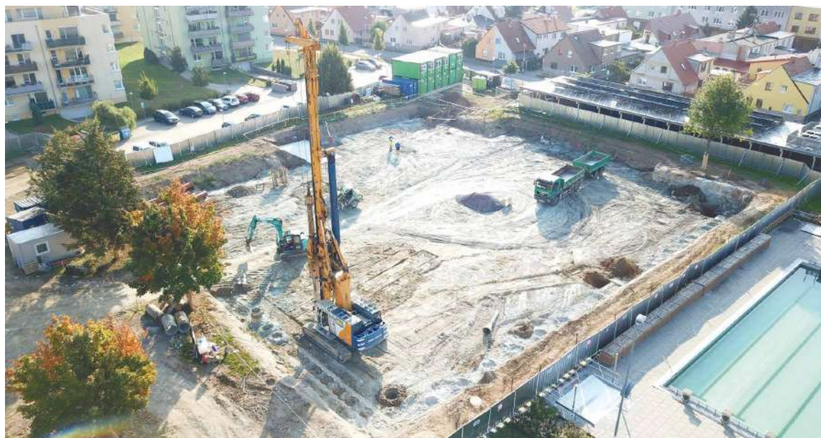
■ Práce na stavbě krytého bazénu.