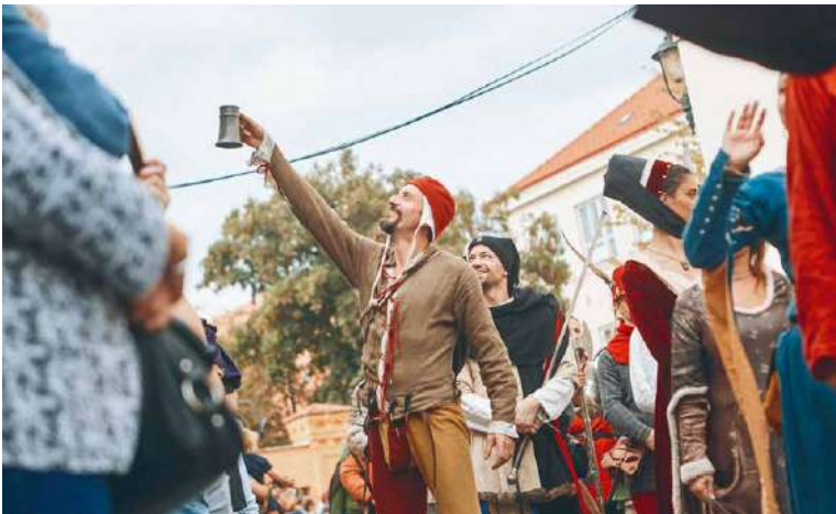
■ Atmosféra vinobraní je neopakovatelná.

programu vinobraní (pátek a sobotu) můžete výhodněji koupit už nyní v síti Ticketstream nebo v TIC na Obrokově ulici. KS, lp