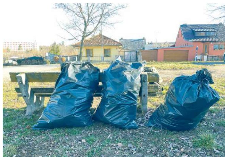
■ Za hodinu a půl sesbírali bezdomovci deset pytlů odpadků.

Úklid se bude opakovat i v následujících týdnech ve vytipovaných lokalitách. Práce budou vždy probíhat za dozoru jednoho z pracovníků Charity, který všem zúčastněným vyplátí ihned po odvedené práci stravenku. sch, lp