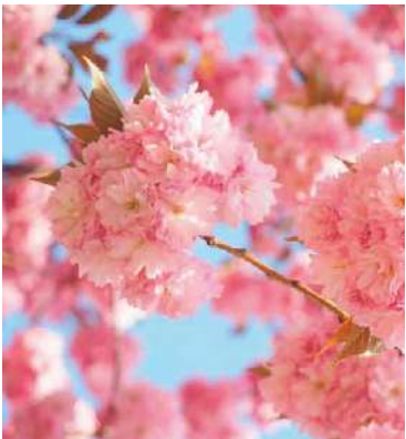
■ Adoptovat můžete i okrasnou třešeň sakuru.

Pokračování ze str. 1. Adoptovat v revitalizované Kolonce bude možné podle druhů javor klen, javor babyku, habr obecný, sakuru ozdobnou a třešeň ptačí. Za symbolickou částku 1 500 korun obdrží dárcé certifikát o adopci stromu a přímo u stromu bude po dobu dvou až tří let upevněna pamětní tabulka se jménem dárce. Každý dárcé se bude moci také aktivně zúčastnit výsadby „svého“ stromu. O přesném termínu výsadby budeme včas informovat. Jedna osoba nebo instituce může adoptovat pouze jeden strom. Peníze