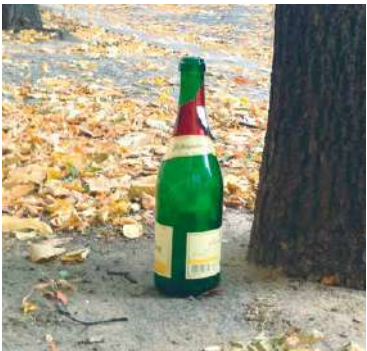
■ Ilustrační foto.

ve věcech majetkových. Důvodem je, že po uložení správního trestu se vlastníkem odejmutého alkoholu stává stát. Věc je následně předána právě Úřadu pro zastupování státu ve věcech majetkových,“ říká Petr Hladký, ředitel Městské policie Znojmo. Strážníci už začali nový nástroj využívat. Stalo se tak na Divišově náměstí, kde zabavili alkohol popíjející ženy, která opakovaně konzumuje alkohol na veřejnosti a na už udělené pokuty v minulosti nereaguje. sb, lp