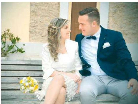
■ V minulém roce bylo ve Znojmě uzavřeno 172 občanských a 40 církevních sňatků.

I v minulém roce jako už mnohokrát u zamilovaných došlo na rčení, že věk je jen číslo. Ani jednadvacitiletý