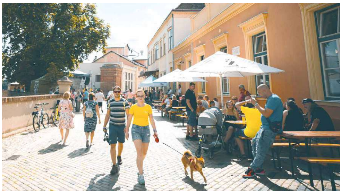
Areál městského pivovaru je atraktivním cílem pro turisty i místní. V sobotu 6. června zde mohou všichni navštívit Pivní slavnosti 2022.