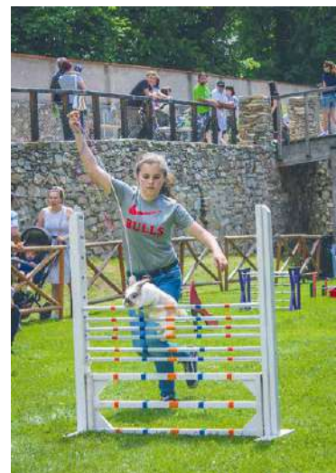
■ Organizátoři věří, že se i letos budou děti dobře bavit.