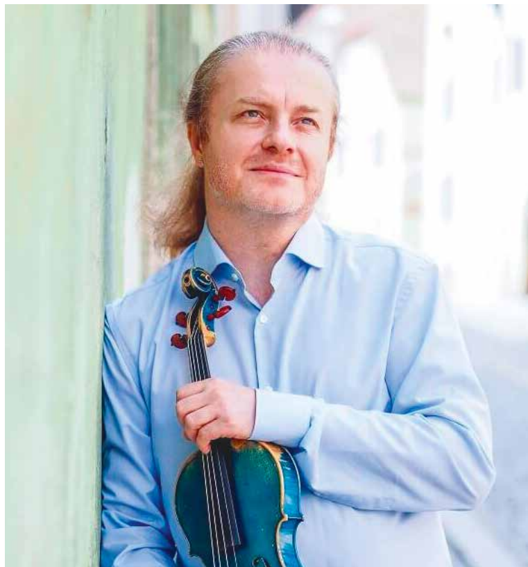
■ Patron festivalu Pavel Šporcl.

Program festivalu najdete na webu hudbaznojmo.cz a vstupenky na jednotlivé koncerty si již můžete zakoupit například na TIC, Obroková ul. lp