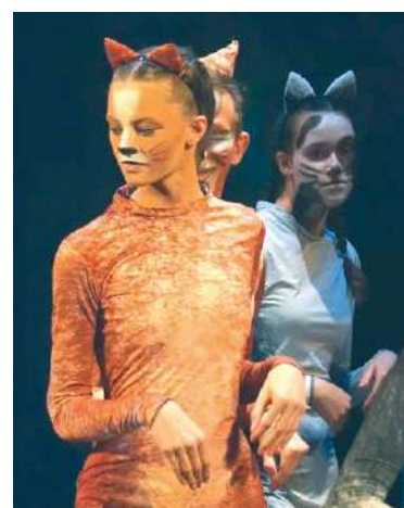
■ Tanečníci a slavný muzikál Cats.