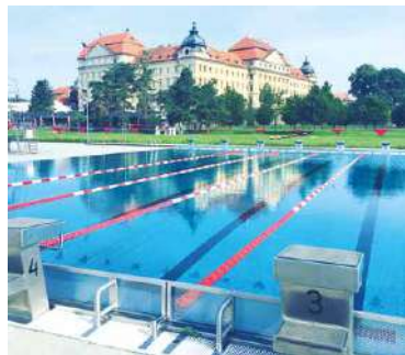
■ Plovárna Louka.

Koupaliště Mramotice přivítá první plavce v pátek 1. července. Více informací k ceníkům a otevírací době na webu sportovisteznojmo.cz. lp