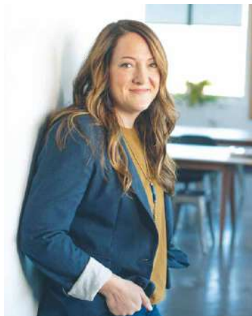
■ Usměvavý pedagog je dětmi vždy vítáný.

Vedení města si pedagogických pracovníků váží, a od roku 2014 už předalo ocenění dvaadvaceti inspirujícím osobnostem. Jak důležitá je učitelská profese, se asi nejvíce projevilo v době, kdy se děti musely učit formou distanční výuky. Někteří rodiče tak možná poprvé viděli, co vše obnáší toto krásné a zároveň náročné povolání žen a mužů vzdělávajících jejich potomky. Své favority tak může navrhnout na ocenění i široká veřejnost.