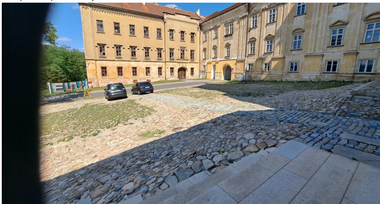
Foto - celkový pohled na budovu TIC Louka