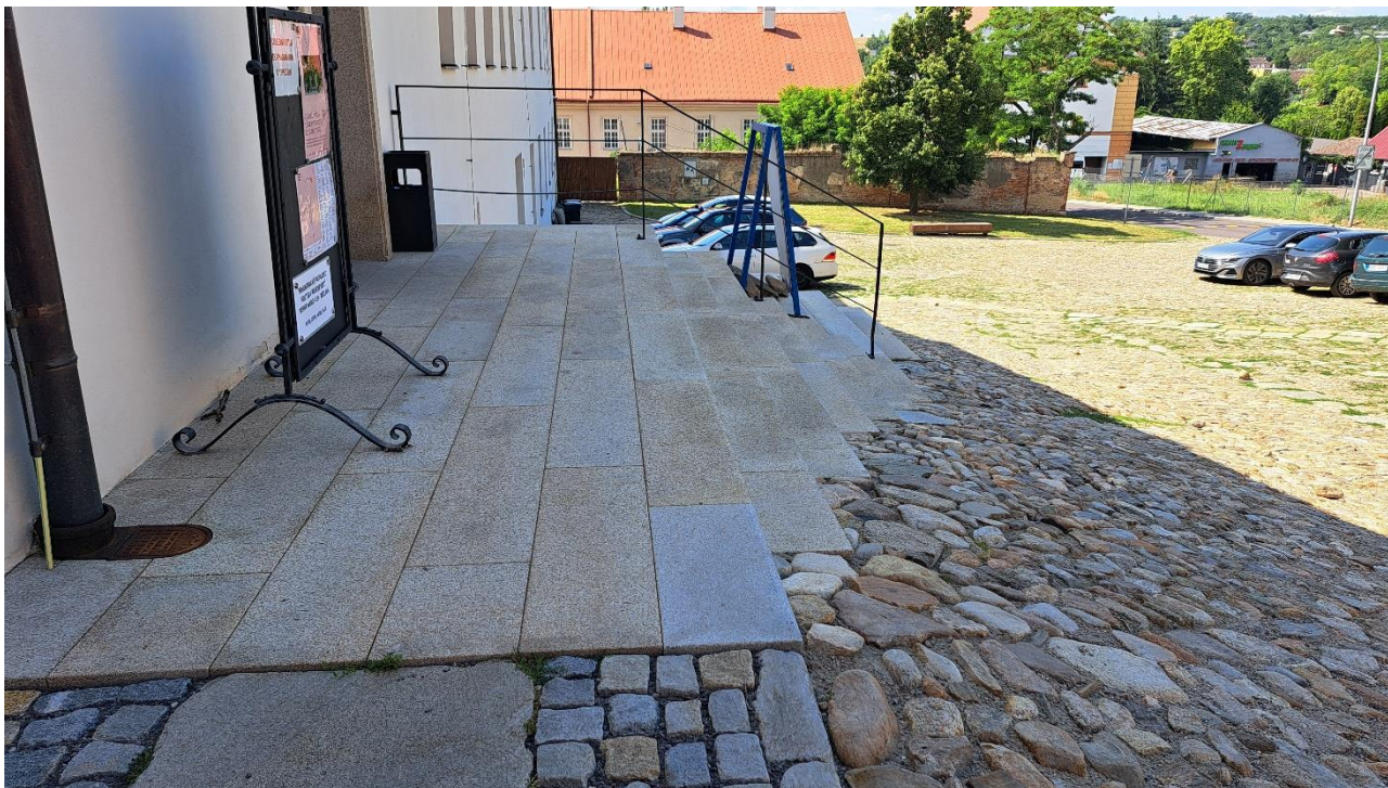
Foto - vchodové dveře do TIC Louka

Foto - přístup ke vchodovým dveřím do TIC Louka