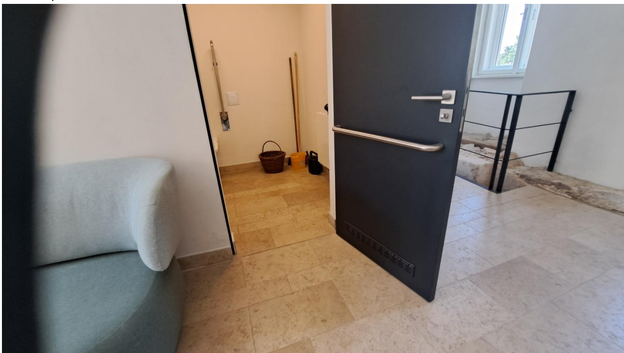
Foto - vstupní dveře na toaletu

Bezbariérová toaleta je v hale TIC - vstupní mechanické dveře šířka 90 cm/kabina o rozměrech 1,7 x 1,7 m/prostor okolo mísy umožňuje přední a boční přístup/sklonná madla po obou stranách záchod. mísy.