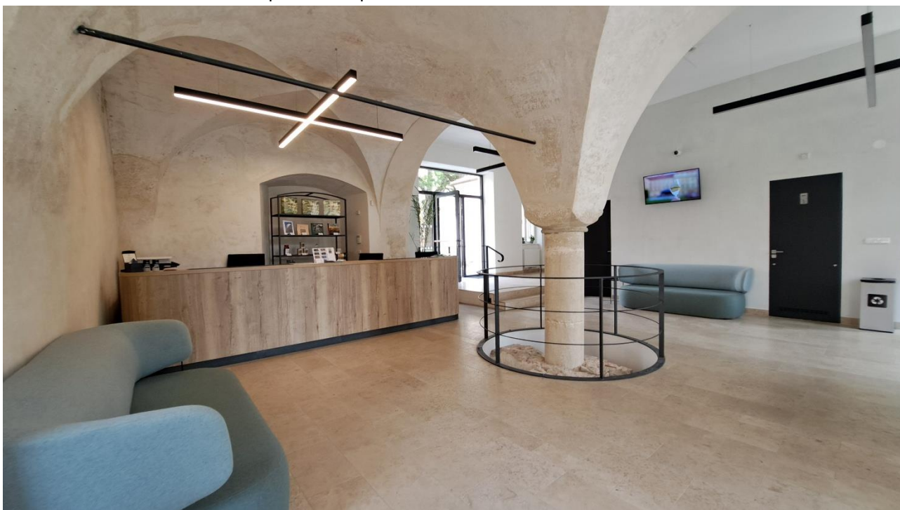
Foto - interiér TIC Louka s informačním pultem a vstupem na bezbariérové WC

Interiér turistického informačního centra je prostorný a nachází se zde informační pult s obsluhou. V úrovni vchodu je bezbariérové WC. Po mírném nájezdu do vyvýšeného podlaží je přístup do konferenčního sálu a na nádvoří Louckého kláštera. Rampa - šířka 110 cm a délka 3 m, vstupní dveře na nádvoří - šířka 1 m, práh vysoký 1 cm.