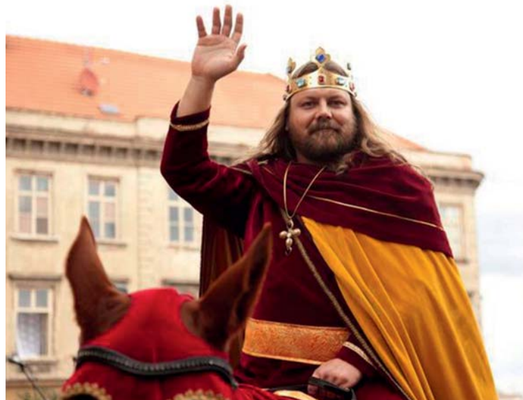
■ Ilustrační.