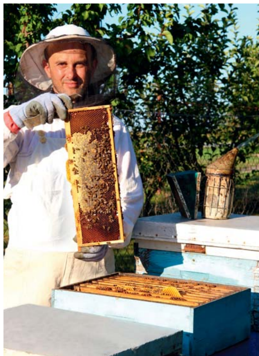
■ Včelaři – ilustrační foto

Největším přínosem včelí činnosti je totiž paradoxně opomíjená