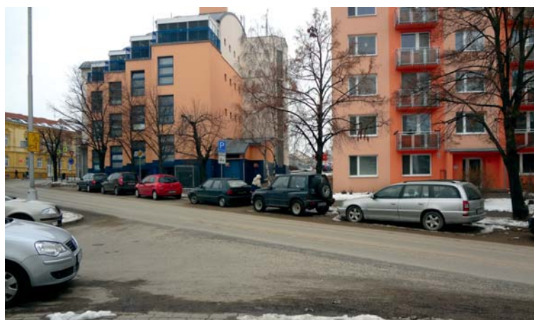
■ Na tomto místě u Kauflandu se vybuduje nikoli klasický přechod pro chodce, ale místo pro přecházení.

V současné době je přechod pro chodce umístěn na mostě vedoucí přes železniční trať. I laik vidí, že do standardně bezpečného přechodu má daleko. Nejenže chybí osvětlení, ale chodci rovněž přebíhají v podstatě tři