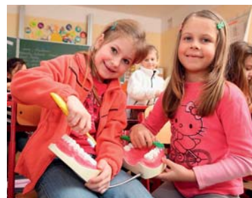
■ Ilustrační foto. Archiv dm drogerie markt

Žáci zhlédli zábavní vzdělávací film Jak se dostat Hurvínkovi na zoubek, natočený ve spolupráci s Helenou Štáchovou v pražském Divadle Spejbla a Hurvínka, vyzkoušeli si správnou techniku čištění zubů a letos navíc dostaly možnost zapojit se do soutěže o nejzajímavější projekt na téma Prevence zubního kazu. Deset nejzdařilejších projektů a vítězné první