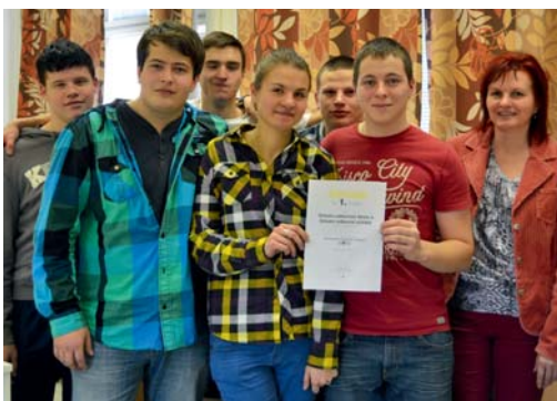
■ Zlatí studenti z Dvořákové.

Žáci třetího ročníku oboru Agropodnikání a prvního ročníku oboru Podnikání soutěžili v projektu Studentská obchodní snídane o nejlepší podnikatelský talent.