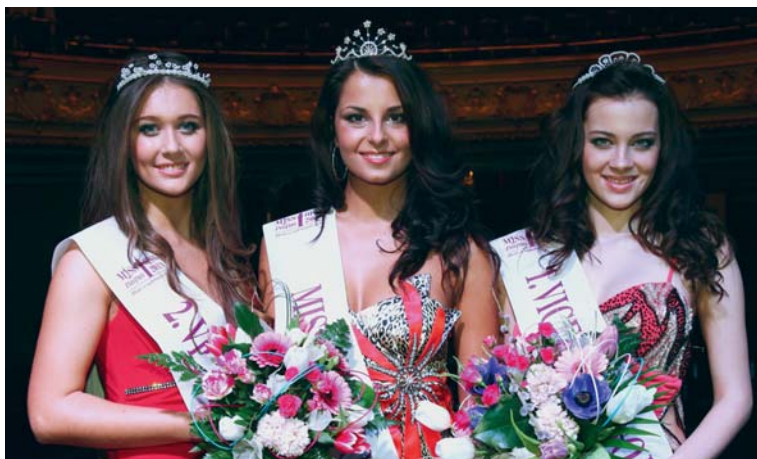
■ Tři nejkrásnější dívky Znojma.