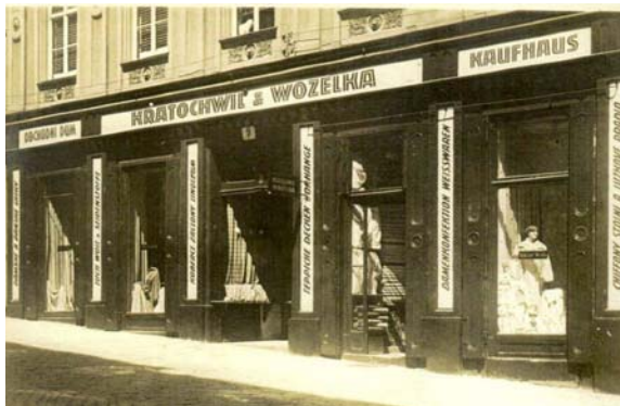
■ Původní dřevěný portál, patrně z r. 1938.

Všechny úpravy se dějí pod přísným dohledem památkářů z Národního památkového ústavu Brno i Správy nemovitostí města Znojma, která výměny iniciovala a je také investorem. lp