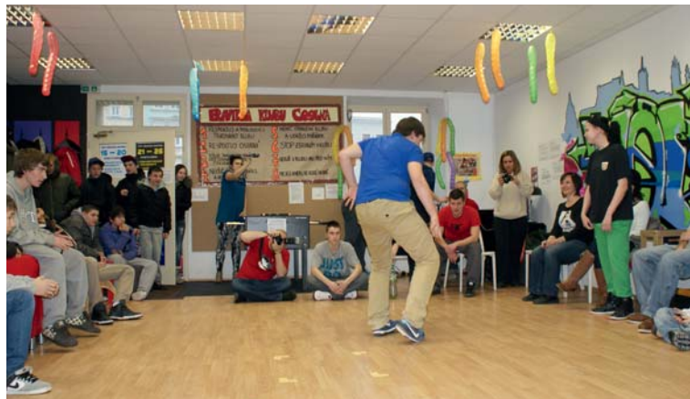
■ Na narozeninách nemohl chybět tanec.

K vidění byla kronika Klubu Coolna. Dokreslovala období, kterým zaří-