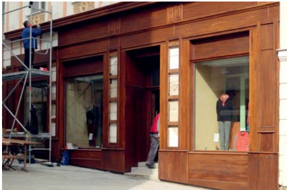
■ Nový portál má životnost více jak padesát let.