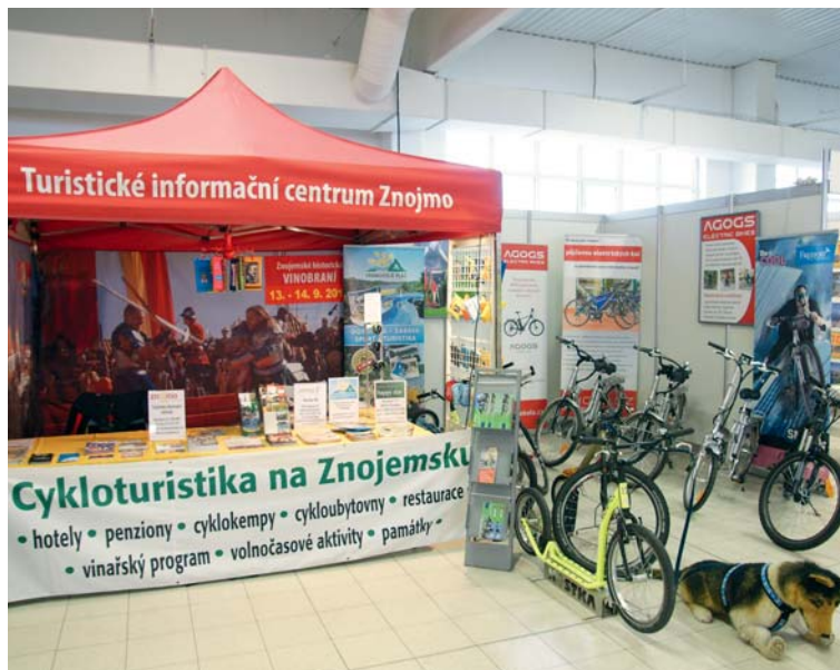
■ Znojmský stánek Cyklo Klubu Kučera hlídal plyšový pes se speciálním postrojem pro zvíře běžící vedle jedoucího kola.

„Prezentace jsou nezastupitelné v osobním jednání především se zájemci o pobyt v našem regionu, kteří vítají podrobnější a aktuálnější informace z oblasti ubytování, stravování i volnočasových aktivit,“ objasnil Čestmír Vala důvod, proč se podobných veletrhů CKK pravidelně zúčastňuje. lp