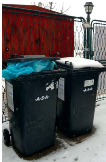
■ Ilustrační foto

K nákladům za skládkování směsného komunálního odpadu je samozřejmě navíc třeba přičíst ještě náklady za odvoz komunálního odpadu, který provádí .A.S.A. EKO Znojmo. Za měsíc to dělá 891 tisíc korun. Další 144 tisíc měsíčně činí pronájem nádob na odpad, tedy popelnic. Město jej rovněž platí firmě .A.S.A. EKO Znojmo, protože jsou jejím majetkem. Kolik takových popelnic skutečně je, zůstává ale zatím velkým otázkou. Udělat v tom pořádek je nyní pro město důležitý úkol.