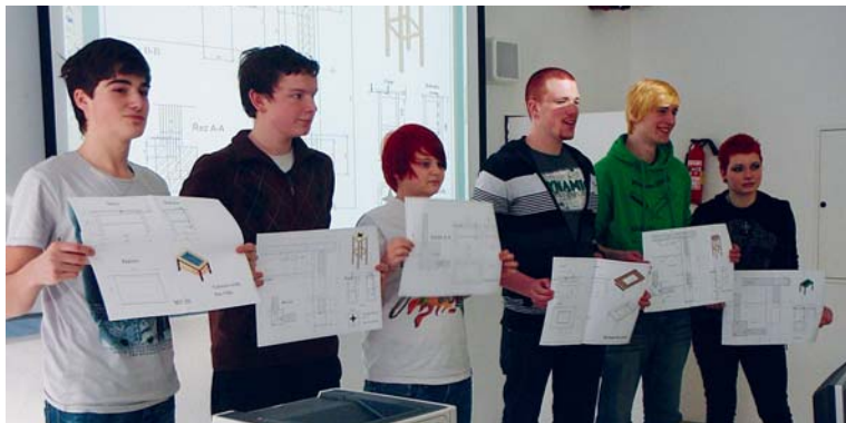
■ Truhláři při prezentaci svých návrhů. Mezi hochy se neztratila ani budoucí truhlářka z Německa.

Cestování, nová přátelství, nové zkušenosti. To jsou priority současných mladých lidí. Kdo by nechtěl během studia poznávat cizí země, jejich obyvatele, kulturu i pracovní podmínky. Žákům SOU a SOŠ na ulici Přímětická se to daří díky účasti školy v evropských projektech. Škola se rozhodla, že využije dotačního programu Fondu budoucnosti, a umožní tak svým studentům dosáhnout odborných kvalit srovnatelných se zeměmi EU.