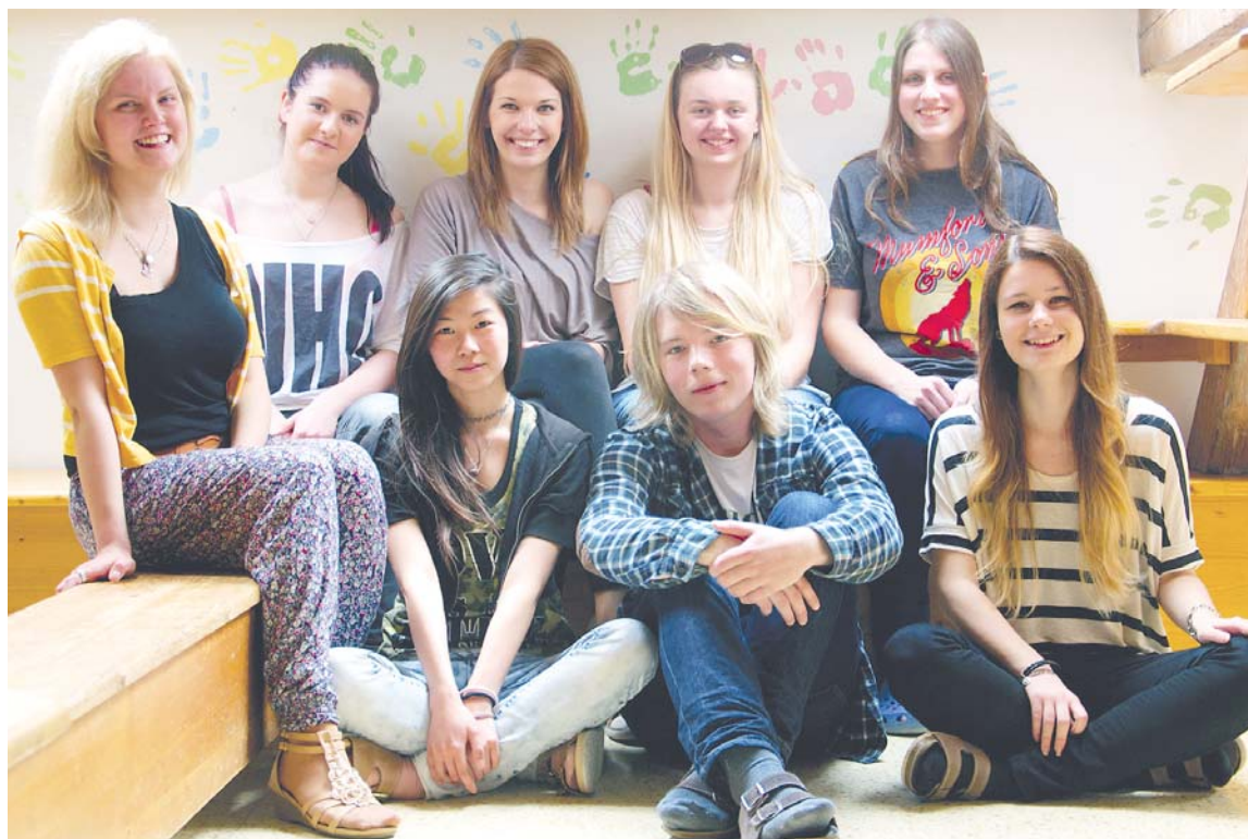
■ Úspěšní angličtináři z Pontassievské.