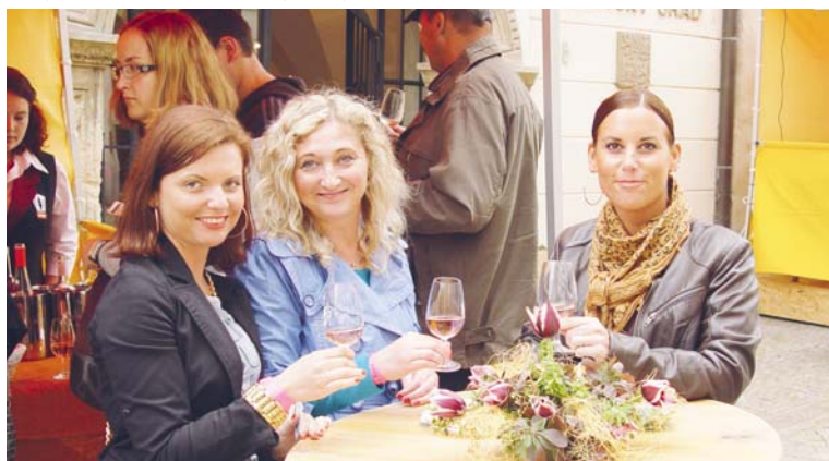
■ Tři usměvavé dámy nebyly jediné, které si letošního Jarovínu užívaly plnými douškami.

aby ochutnaly výsledky mezinárodní soutěže růžových vín Jarovín Rosé 2013. U dobrého vína se potkali