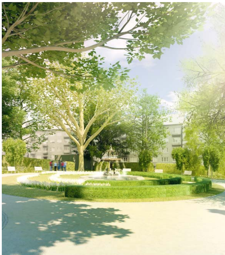
■ Vizualizace, jak bude vypadat okolí kolem kašny.

práce měly začít v lednu 2014, a potrvají asi pět měsíců. Pak přistoupí pracovníci zeleně k nové výsadbě, která musí být hotova do 15. května 2014. Stejně jako v první části revitalizace parku se i tentokrát budou moci lidé do sázení nových stromů aktivně zapojit. Začít mohou už v tomto roce adopcí stromů, o které budeme podrobně informovat již v příštím vydání Znojmských LISTŮ. lp