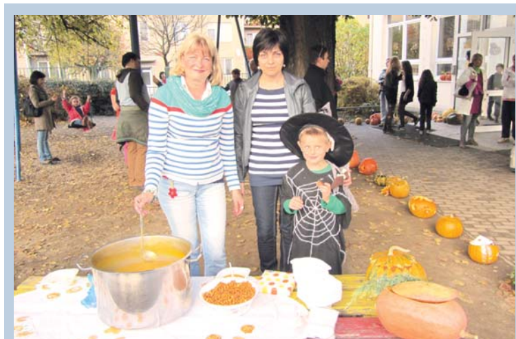
■ Dýňový podvečer na základní škole na ulici Mládeže. Skvěle připravená podzimní zábava se stejně jako vloni setkala s velmi kladnou odezvou žáků, rodičů i pedagogů. Čas zaplněný soutěžemi, atrakcemi, muzikou, pohoštěním i tvorbou z dýní byl pro účastníky časem stráveným příjemně mezi přáteli. A toho není nikdy nazbyt. Text a foto: lp

Velkou část posluchačů tvořili studenti oboru Sociální činnost, kteří zájmem a citlivým přístupem dokázali, že své profesní zaměření zvolili správně. „Mělo tu být ještě víc lidí z naší třídy. Bylo to skvělé!“, byla reakce většiny mladých posluchačů bezprostředně po skončení semináře. Ten Věra Brabcová připravila v rámci Týdne sociálních služeb ve Znojmě. lp