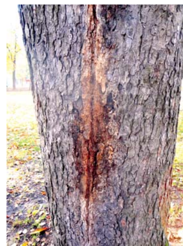
■ Kmen jírovce maďalu.

Alarmující havarijní stav jednoho ze stromů ve znojmském městském parku byl důvodem, proč musel být urychleně odstraněn. Podle aktuálního znaleckého posudku z 20. října 2013 byl jírovec maďal nedaleko kašny v dolní části parku v havarijním stavu. U tohoto jedince existovalo bezprostřední riziko možného zhroutilí či rozlomení. Dendrolog proto doporučil jeho bezodkladné odstranění. lp