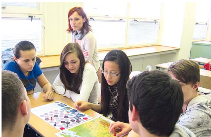
■ Studenti při zábavné formě studia jazyků.