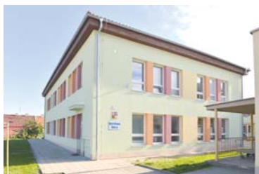
■ Fasáda MŠ Pražská.

Provoz mateřské školy byl zahájen 1. září 1976. Děti jsou v mateřské škole rozděleny do pěti tříd. Prioritami MŠ jsou společně s rodiči podporovat u dětí přátelské vztahy, rozvíjet toleranci a pocit bezpečí, podílet se na vytváření vzájemné důvěry a prostředí zabraňující vzniku šikany. Chceme vést děti a rodiče k aktivnímu poznání přírody, posilovat tělesnou zdatnost dětí a učit zásadám zdravého životního stylu. Četbou a vyprávěním u dětí rozvíjíme slovní zásobu, která jim umožní lepší komunikaci s kamarády i dospělými.