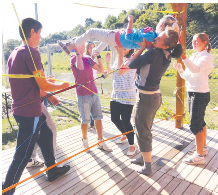
■ Sportovní vyžití s přidanou hodnotou zábavy na břehu řeky Dyje.

A pokud se vám ani jedna z nabízených možností nezamlouvá, město a jeho nejbližší okolí skrývá v rámci sportovních a kulturních aktivit mnohá další dobrodružství, která můžete na školním výletě společně objevovat. Tipy na výlety nabízí portál Znojemské Besedy www.znojemskabeseda.cz (sekce Objevte Znojmo) nebo stránky www.centrumvodarna.cz . lp