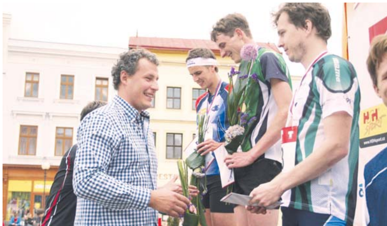
■ Starosta Znojma blahopřeje nejlepším orientačním běžcům mistrovství republiky.

Centrum Znojma se stalo 8. května dějištěm zajímavé podívané. O titul mistrovství republiky si to zde rozdali na sprintových tratích orientační běžci. Start byl v Horním parku, a běžce pak čekalo putování podle mapy uličkami starého Znojma.