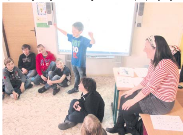
■ Výuka cizích jazyků s rodilou mluvčí na ZŠ Mládeže.