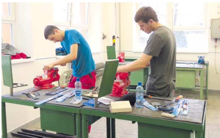
■ Šikovní učni na soutěži v Kyjově.