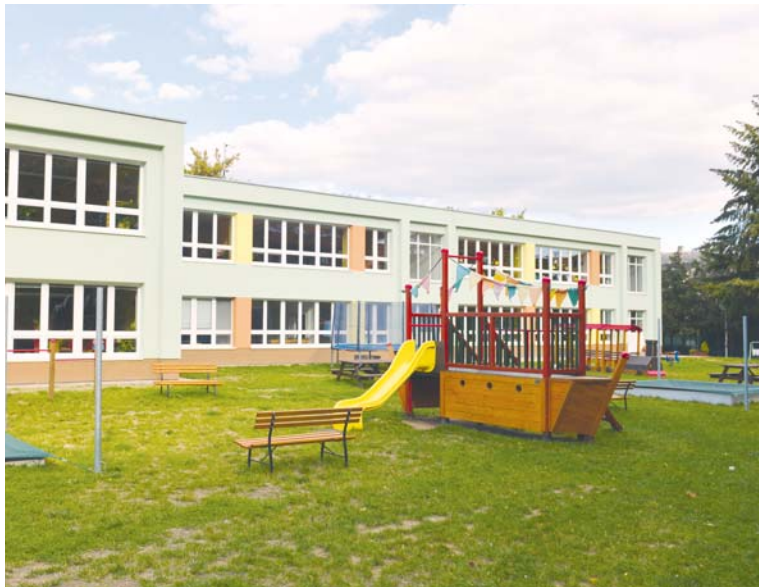
■ Nová fasáda budovy a herní prvky v MŠ na náměstí Armády.