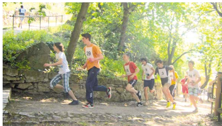
■ Zvládnout serpentinu do vrchu chce pořádnou fyziku.

„Sportu, a vůbec pohybu mezi mladými lidmi ubývá. Upravené prostředí Karolíniných sadů vyložené láká se jím proběhnout, a tak mě v roce 2006 napadlo uspořádat v nich běh do vrchu pro školou povinné děti,“ vysvětlila důvody, které ji před lety vedly k nastartování sportovní aktivity s využitím krásného prostředí města. „Kdo vyjde, popřípadě vyběhne serpentinu Karolíniných sadů, je většinou zcela vyčerpaný nebo-li kaput. Odtud také vznikl název Karolinka kap(ut). V prvním ročníku se na start postavilo kolem šedesáti dětí, většinou ze zvědavosti. A pak už to šlo samo.