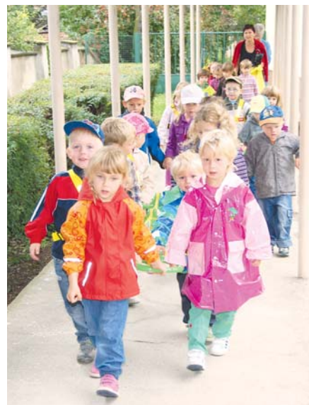
■ Pěkné, vkusné a čisté prostředí je jedním z faktorů, které formují osobnost dítěte.

standardy. Ani pak však nesloží znojemská radnice ruce do klína. Věnovat se prý bude úpravám školních zahrad a venkovních prostor, které děti užívají.