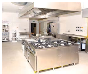
■ Moderní kuchyně v MŠ Holandská.

Mateřská škola Holandská se skládá ze dvou mateřských škol, mateřské školy Holandská a mateřské školy Loucká s celkovým počtem deseti tříd, z toho dvě třídy s logopedickou péčí. Mateřská škola patří k největším předškolním zařízením ve městě Znojme. Umístění obou mateřských škol je v blízkosti údolí řeky Dyje, která umožňuje přímé pozorování přírody a přírodních jevů, nabízí se tak k realizaci environmentální výchovy, umožňuje řadu výletů, přímé pozorování přírody, což prospívá zdraví dětí. Mateřská škola spadá do celostátní sítě