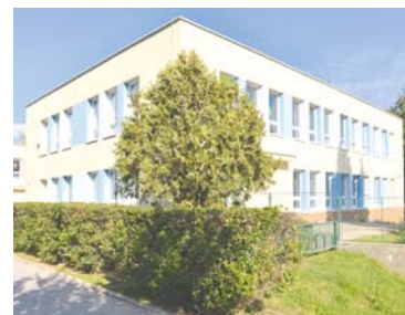
■ Zateplená fasáda MŠ Dělnické.

Gránická 8, která je dvoutřídní. Kapacita je 40 dětí. Provoz této MŠ je také celodenní. Mateřská škola Dělnická je školou pavilonového typu. Do provozu byla uvedena v roce 1970. Třídy jsou umístěny ve třech jednopodlažních pavilonech. Odloučené pracoviště Gránická je školou rodinného typu. Je umístěna ve vile v blízkosti Gránického údolí. Mateřská škola Gránická byla uvedena do provozu v roce 1955 jako 1. mateřská škola ve Znojmě s celodenním provozem.