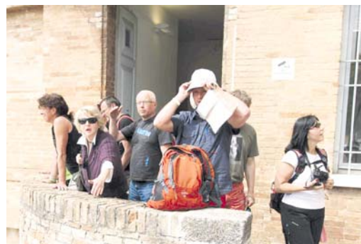
■ S platným pasem si v klidu užijete dovolenou.

Z provozních důvodů je možné odbavit posledního žadatele deset minut před koncem provozní doby.