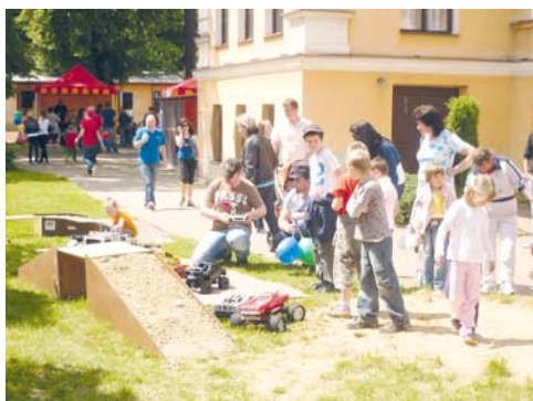
■ Modelbrani se vždy těší velké pozornosti veřejnosti.

V areálu DDM Znojmo se 17. května na Modelbrani 2014 sejdou po roce modeláři a široká veřejnost, jejíž zájem je každoročně narůstající. Letošní 8. ročník soutěže modelářů se oproti minulým ročníkům rozroste o kategorie funkčních železničních modelů. A po dvouleté odmlce si opět děti budou moci slepit svůj vlastní model.