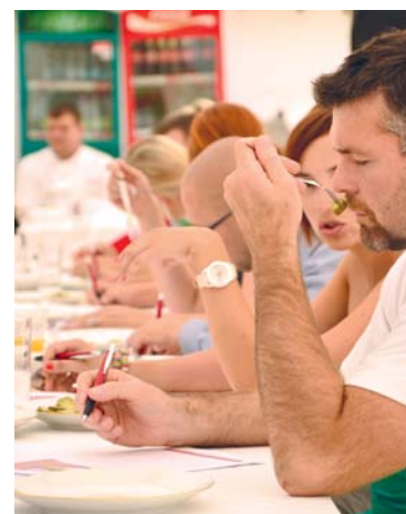
■ Slavnosti okurek a ochutnávka.

Od 13. do 20. srpna přiveze druhý ročník divadelního festivalu Znojmo žije divadlem! známé herecké osobnosti, divadélka, workshopy, několik scén po celém městě a samozřejmě šapito na Horním náměstí. Hlavní festivalovou hvězdou bude bezesporu