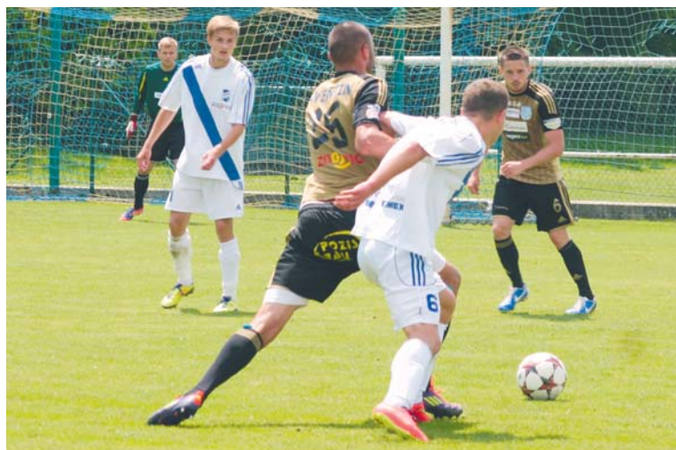
■ I v přípravných zápasech znojemští hráči příkladně bojovali.

Jak na tom mužstvo je, se ukáže v prvním ligovém zápase na hřišti Kolína v neděli 3. srpna od 17 hodin. eks