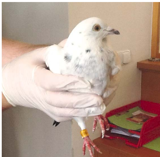
■ Zraněný sportovní holub našel svého majitele.