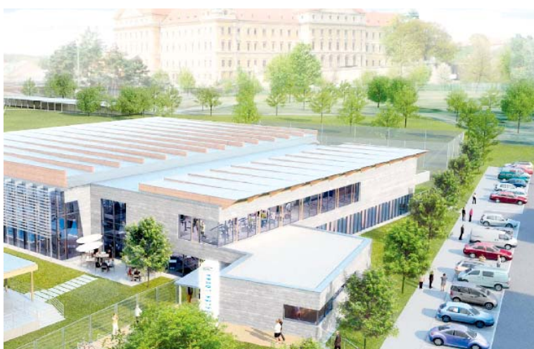
■ Vizualizace krytého bazénu v Louce.

Včera (23. 6. – pozn.red.) jsem se spolu s dalšími členy Pro Znojmo zúčastnil veřejné debaty o budoucnosti plavání v krytém bazénu ve Znojme. Byly představeny dvě varianty: a) rekonstrukce / rozšíření stávajících lázní v centru na náměstí Svobody; nebo b) stavba nového krytého bazénu v areálu letní plovárny Louka.