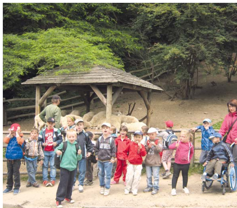
■ Návštěva u zvířátek byla pro každé z dětí obrovským zážitkem.

Celý výlet pro děti připravila a financovala NADACE PHOENIX DĚTEM OD SRDCE, která za tímto účelem uspořádala v parku na ulici 17. listopadu v první půli června zábavné odpoledne pro veřejnost. Díky dobrým lidem se na něm sešlo více jak 13 000 korun, za které mohly jet děti na výlet. „A za to jim upřímně děkujeme,“ poděkoval kolektiv dětí i pedagogek. lp