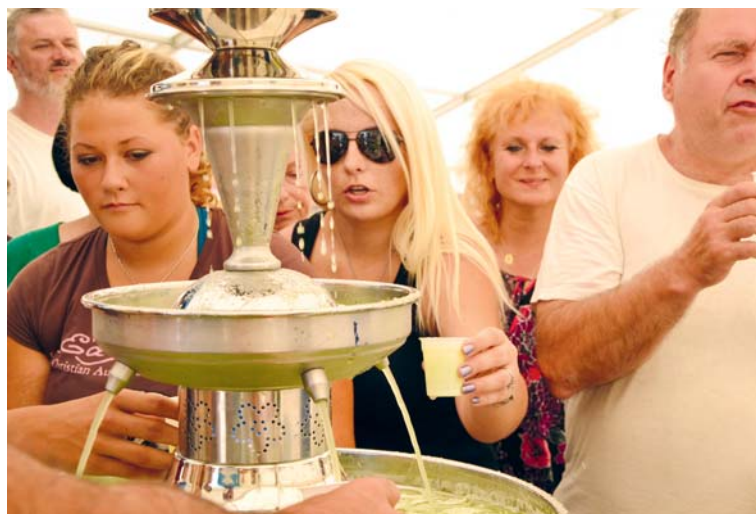
■ Okurková fontána.

„Další novinkou letošních Slavností okurek budou farmářské trhy