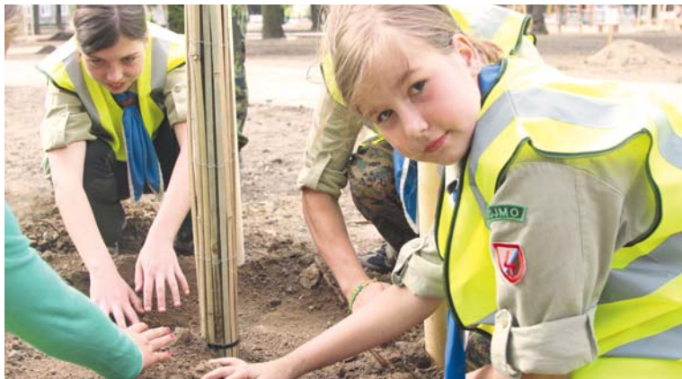
■ Svůj strom si zasadily desítky lidí včetně mladých skautů.

lých stromů. Každý nově vysazený strom byl označen tabulkou se jménem svého adoptivního rodiče nebo i celé skupiny. Příkladem za všechny jsou členové znojmských skautů, kteří vysazením svého stromu obohatili, jako mnoho jiných občanů, městskou zeleně. lp