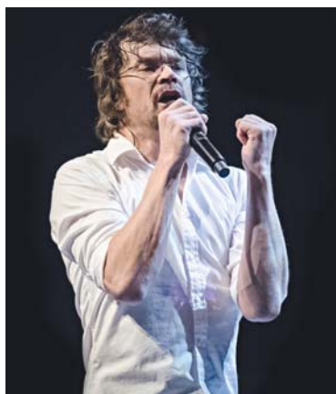
■ Dan Bárta se vrací do Znojma.