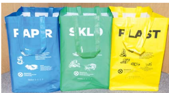
■ Tašky na separovaný odpad jsou spojené suchých zipem, aby vytvořily ucelený set.

Třídění odpadu má přitom pozitivní vliv nejen na životní prostředí, ale i na finanční stránku odpadového hospodářství. Z aktivní politiky města v nakládání s odpady těží i občané. Poplatek za popelnice byl letos po několika letech snížen z pěti set na čtyři sta korun.