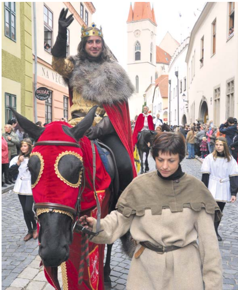
Stejně jako vloni pozdraví své poddané král Jan Lucemburský v podání herce Miroslava Hraběte.

s potěšením si vás opět po roce dovoluji pozvat na Znojenské historické vinobraní. Jako organizátoři největší společenské a kulturní události roku návštěvníkům znovu nabídneme tradiční historický program, doplněný o řadu novinek, a také bohatou paletu kulturních vystoupení pěveckých, divadelních i artistických. Líbí se mi, že na struktuře programu se v podstatě nic nemění, a přitom se mění skoro všechno. Do městských bran opět vjede král Jan Lucemburský, ale jeho průvod bude ještě bohatší a početnější než jindy. Na pódiích, jež budou rozeseta po náměstích a ulicích, se představí dětským i dospělým divákům množství umělců, zastupujících různé žánry, takže každý si může vybrat, co je mu blízké.