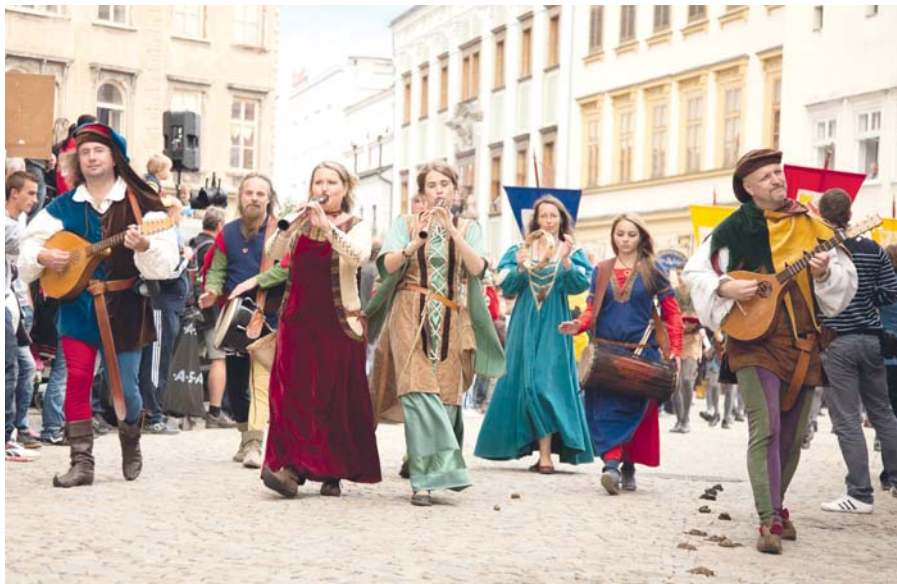
■ Skupina Lucrezia Borgia a středověká hudba v ulicích.