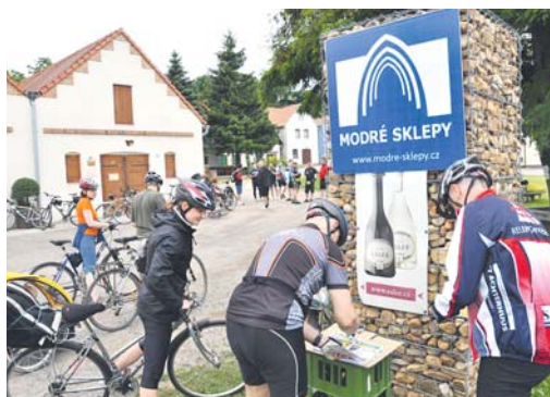
■ Ilustrační foto.

Naplánujte si s rodinou nebo přáteli výlet po vinařských stezkách Znojemska. Předposlední sobotu v září se ve Znojmě a jeho okolí bude konat další ročník akce s názvem Tour de burčák, kterou připravila Nadace Partnerství ve spolupráci s městem Znojmem, Znovínem Znojmo a dalšími vinaři.