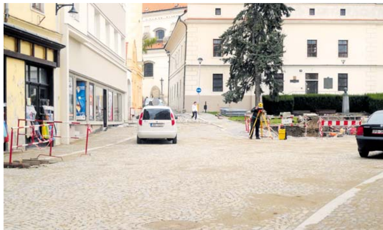
■ Divišovo náměstí ve dnech, kdy probíhaly poslední úpravy.

S pracemi se však pro letošní rok ještě neskončilo. Po vinobraní se bude v opravách a regeneraci ulice Velká Michalská pokračovat podle plánu. Půjde o rekonstrukci ulice Velká Michalská a navazující komunikace na části