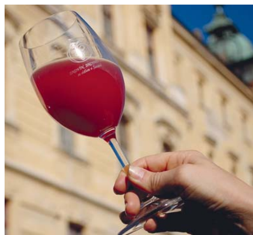
■ Ilustrační foto.

V sobotu se festival rozběhne již od 11.00 hod. a jedno z hlavních lákadél BURČÁKFESTU – ŠLAPÁNÍ HROZNŮ BOSÝMA DÍVČIMA NOHAMA – začne za zvuku středověké