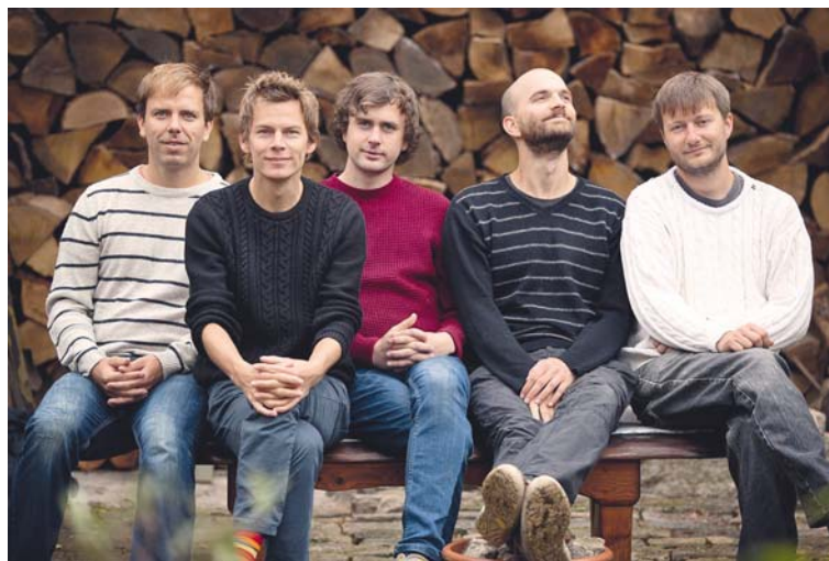
■ Kapela Zrní.

Kapela s jedinečným, osobitým zvukem, která si tvoří svůj vlastní