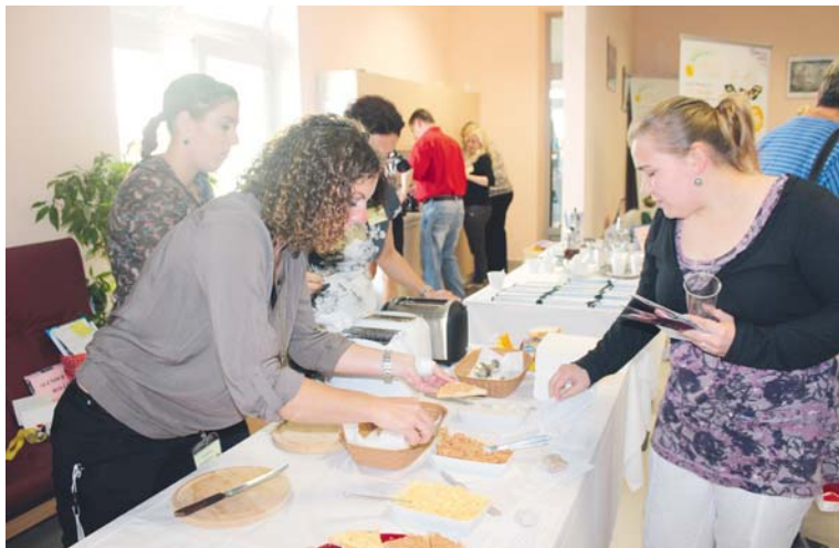
■ Zdraví a dobrá nálada je spjata i s kvalitní stravou bohatou na vitamíny.

Centrum sociálních služeb Znojmo zorganizovalo v Domově pro seniory ve Znojmě pro sto padesát svých pracovníků druhý ročník Dne zdraví. Dobrý nápad mnoho z nich uvítalo.