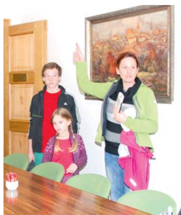
■ Radnice vítá všechny generace.

V čase 9.00–12.00, 13.00–15.00 hod. dostanou návštěvníci možnost navštívit v budově Obrokova 10 obřadní síň města, v zasedací místnosti najdou výstavu vítězných prací výtvarné soutěže na téma Třídíme odpad nebo se v tento den mohou pokochat pohledem na Znojmo z výšky, neboť vstup do radniční věže je zdarma. Ti, co vystoupají desítky schodů dominanty města, dostanou jako bonus komentovanou prohlídku radničních věžních hodin.