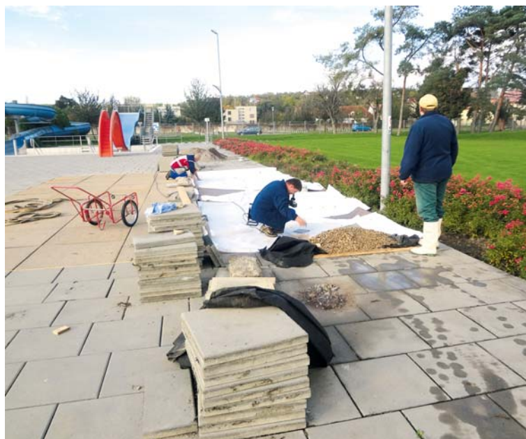
■ Izolace má zabránit ničení růžových keřů stříkající vodou z vodotrysků.

„Veškeré stavební úpravy, které mají odizolovat padající vodu z vodotrysků tak, aby neničila růže, provádějí naši pracovníci v rámci běžného pracovního zařazení. Tím, že vše zvládáme svépomocí, jsme ušetřili minimálně