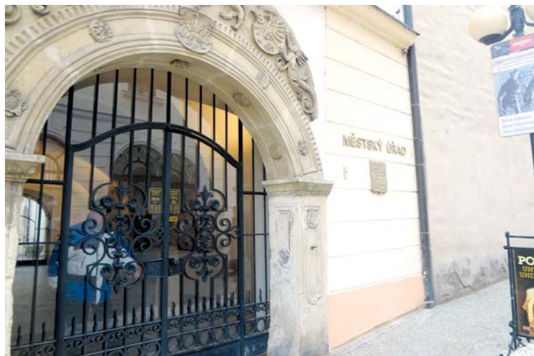
■ Městský úřad ve Znojmě.

Připravujeme možnost, že i komerční subjekty budou napojeny na základní registry a občanům se tak v případě změny adresy trvalého pobytu zase o něco zjednoduší komunikace nejenom s orgány státní správy, ale rovněž i s komerčními subjekty. zp