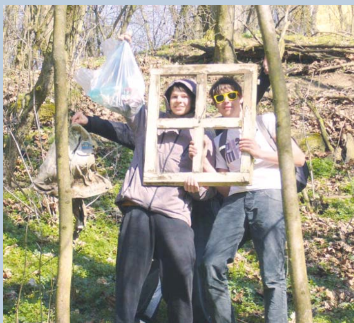
■ Žáci prvního ročníku SOŠ Podjíjí oboru Informačních technologií zorganizovali v rámci předmětu Chemie a ekologie již poněkolkáté sběr odpadu v Městském lesíku ve Znojmě. Nasbíraný odpad roztřídili a přenesli do kontejnerů na tříděný odpad. V následujícím období se chystají do sběrného dvora v Dobšicích. Seznámí se s další cestou odpadu vhozeného do kontejnerů, jeho možným zpracováním a využitím v průmyslovém odvětví. lp, foto: Archiv

Kontakt: Městský útulek Načeratice, tel.: 602 307 801, www.utulek-naceratice.blog.cz