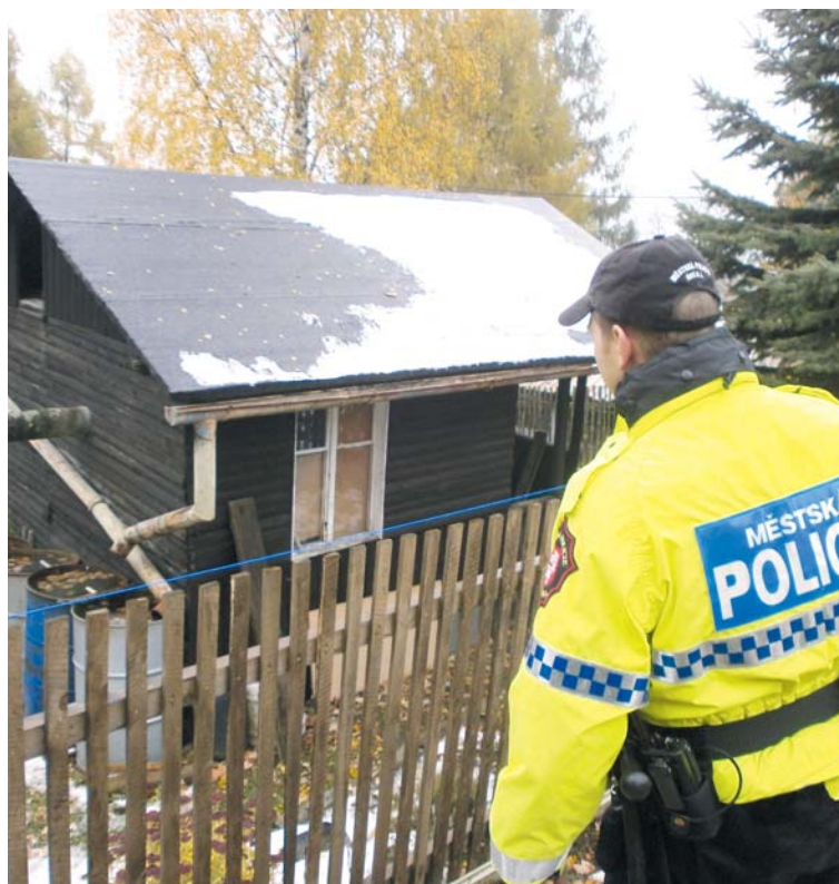
■ Strážníci městské policie kontrolují zahrádkářské kolonie i v zimních měsících.