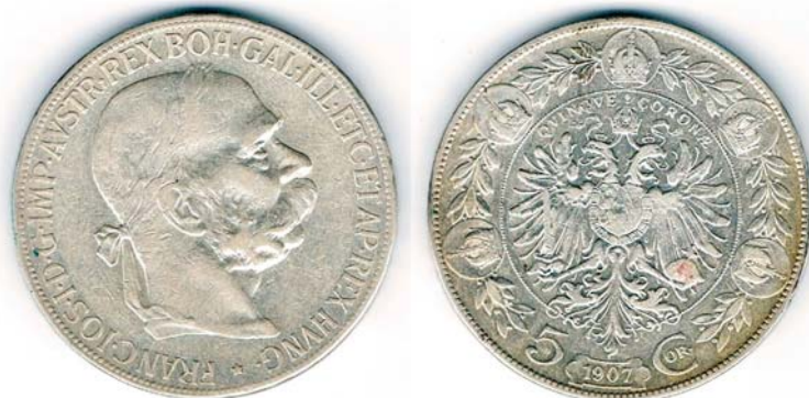
■ Pětikoruna rakousko-uherské měny z roku 1907 patří rozměrově k největším z vystavených mincí pokladu.

„Poklad obsahuje 5 001 kus stříbrných mincí o celkové hmotnosti asi 40 kilogramů. Všechny pocházejí z období vlády císaře a krále Františka Josefa I., kdy se nejprve platilo takzvanou rakouskou zlatkovou měnou. V pokladu jsou z ní zastoupeny jednozlatkové nominály. Po roce 1892 začala platit měna korunová, jejíž tradici drží Česká republika jako jediná z nástupnických států podunajské monarchie dodnes. Z rakousko-uherské korunové měny jsou v pokladu zastoupeny jednokoruny, dvoukoruny a veliké pětkoruny. O motivu zakopání pokladu můžeme jen přemýšlet. V nuzných časech Velké války, kdy přemýšleli lidé očekávali růst inflace, znehodnocování měny, byly uschované mince s vysokým obsahem cenného kovu zárukou, že i po válce za ně jejich strádající získají jistou protihodnotu. Mince byly zakopány na tajném místě a jejich majitel si je již nikdy nevyzvedl,“ přiblížil historii pokladu kurátor muzea historik Jiří Kacetl. Laická veřejnost i odborníci numismatici uvidí vzácné mince ve světle nových zajímavých informací.