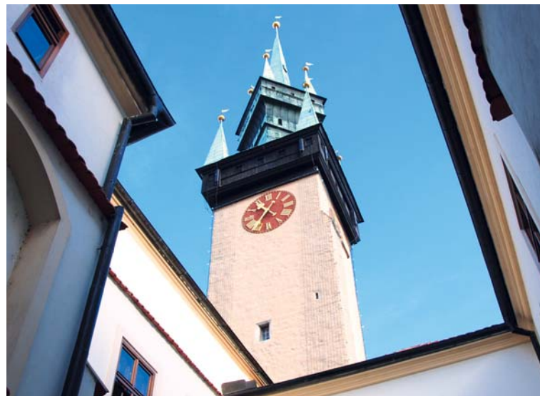
■ Radniční věž.

vлакonoši v dobových kostýmech a starosta Znojma, který je připraven na přátelské neformální setkání a diskuzi s občany. Více na str. 2. lp