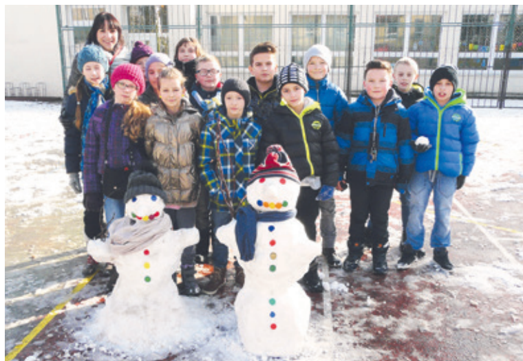
■ Klasického sněhuláka postavili žáci 4.C ZŠ Mládeže v jednom z mála dní, kdy napadl ve Znojmě sníh.

Děti ze základní školy zatím postavily 31 sněhuláků a vybraly za ně 1 950 korun, ale částka ještě není konečná. S nedostatkem sněhu si některé třídy poradily po svém a tvoří sněhuláky z jiných materiálů. Jak je vidět na kreativité žáků, když je touha pomoci, způsob se vždy najde. lp