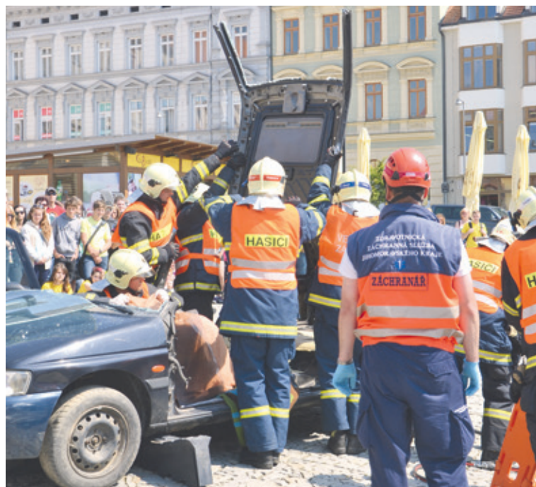
■ Každý rok se může veřejnost v centru Znojma přesvědčit, jak společně pracují složky policie, hasičů a záchranářů. Ukázky se vždy těší velkému zájmu občanů.

Přístup k těmto telefonním číslům je zcela bezplatný z pevných telefonních linek, mobilních telefonů i z veřejných telefonních automatů.