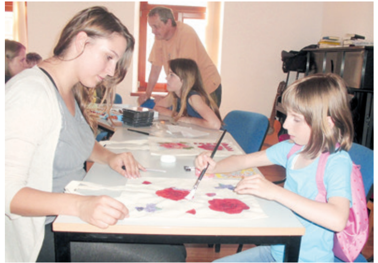
■ Ilustrační foto.

Jaký úžasný výsledek tento program má jsme nezjistili hned, ale vlastně až po těch několika letech, když jsme viděli,