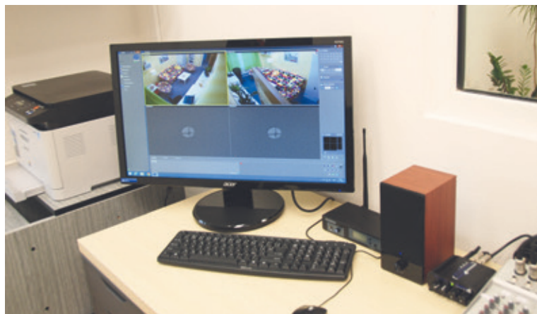
■ Za stěnou je schováno technické zařízení zaznamenávající průběh výslechu.