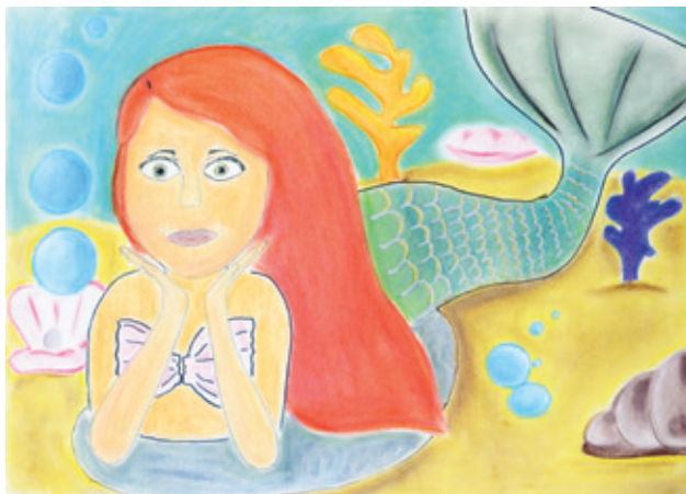
■ Obrázek s názvem Víla je jednou z oceněných prací předchozího ročníku.

minimálně ve formátu A3. Všechna díla budou rozdělena podle věku autorů do tří kategorií: 1.–3. třída, 4.–6. třída a 7.–9. třída. Žáci, kteří se