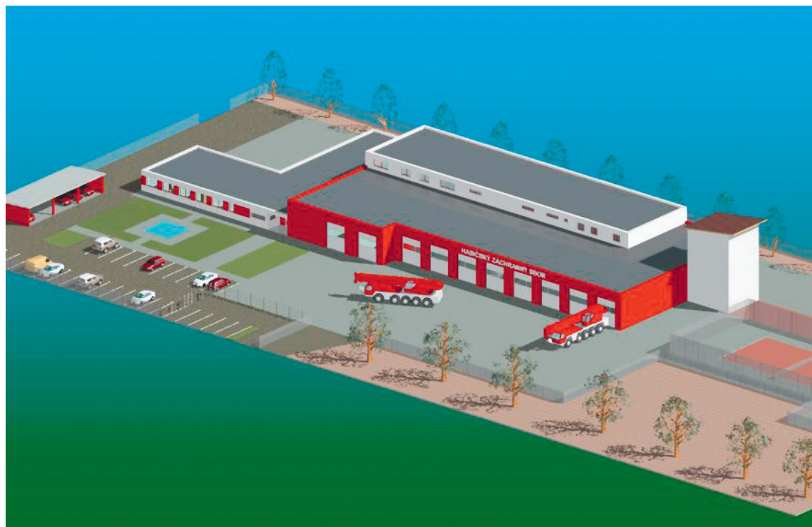
■ Hasičská stanice bude stát na Pražské ulici ve Znojmě.

Vlastimil Gabrhel. „Je nezbytné, aby hasiči měli pro svou práci důstojné prostředí, perfektní technické vybavení a zázemí.“ lp