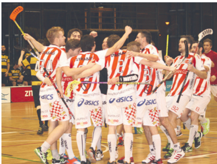
■ Budou se znojemští florbalisté radovat i v play-off?

Znojmo tak může sice skončit i na prvním místě, daleko pravděpodobnější je ale třetí, případně čtvrtá či pátá příčka. Co to znamená? Ve florbalu si týmy na prvních třech místech mohou vybírat soupeře pro play-off. Bronzový stupínek by znamenal výběr ze dvou možných protivníků. Z pohledu výběru pak není příliš rozdíl mezi čtvrtou a pátou příčkou. Výhodou, byť ošemetnou, je, že čtvrtý tým tabulky začíná čtvrtfinálovou sérii dvěma zápasy doma. O úskalích jak výběru, tak začátku čtvrtfinále doma ví ve Znojme