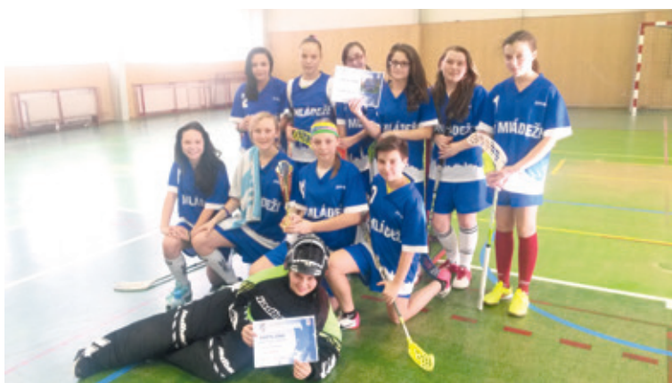
■ Úspěšný tým florbalistek ZŠ Mládeže.

Dívčí tým znojemské Základní školy ulice Mládeže na něm prošel základní skupinou bez porážky a zajistil si tak postup mezi nejlepší čtyři celky. V souboji o postup do finále si pak znojemské dívky poradily s týmem ZŠ Žarošice 3:1. Ve finále na ně čekal silný soupeř v podobě domácích florbalistek. Po velmi vyrovnaném boji se z výhry bohužel pro Znojmo radovaly domácí Pohořelice. I přes prohru si děvčata z Mládežky zaslouží velkou pochvalu za předvedený výkon.