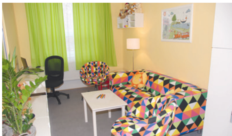
■ Domácké prostředí pomůže dětem lépe se vyrovnat se stresem při výslechu na policii.