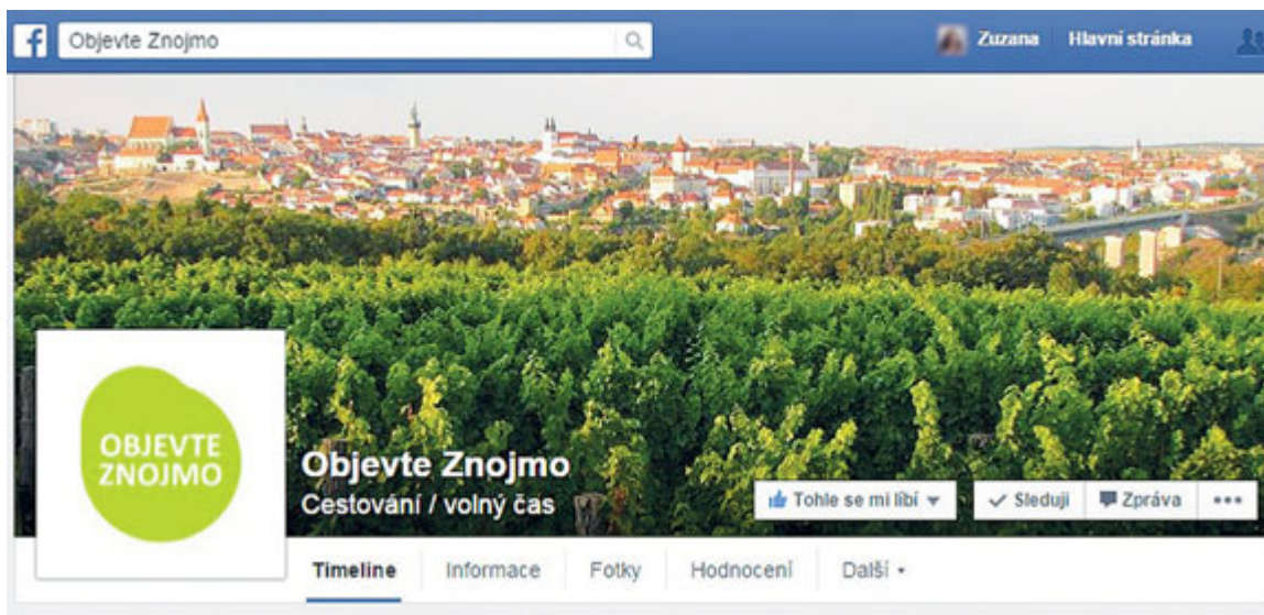
Facebookovou stránku Objevte Znojmo – www.facebook.com/objevteznojmo – bude spravovat Znojenská Beseda. Příspěvková organizace města, která se o marketing Znojma stará.

oficiálního facebookového profilu a tento typ komunikace je ze strany občanů vnímán velmi pozitivně. Kromě komunikace se na sociální síte začíná přesouvat i marketing. Znojenská Beseda tak po svém novém webovém portálu cílí právě na facebook. Pokračování na str. 6.