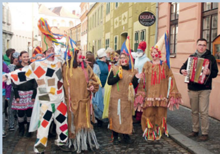
■ Obnovovat lidové tradice v městském prostředí není jednoduché. Přesto masopustní průvod chodí Znojmem každý rok. Organizátorem průvodu masek je škola GPOA Znojmo. Příště se můžete přidat i vy!