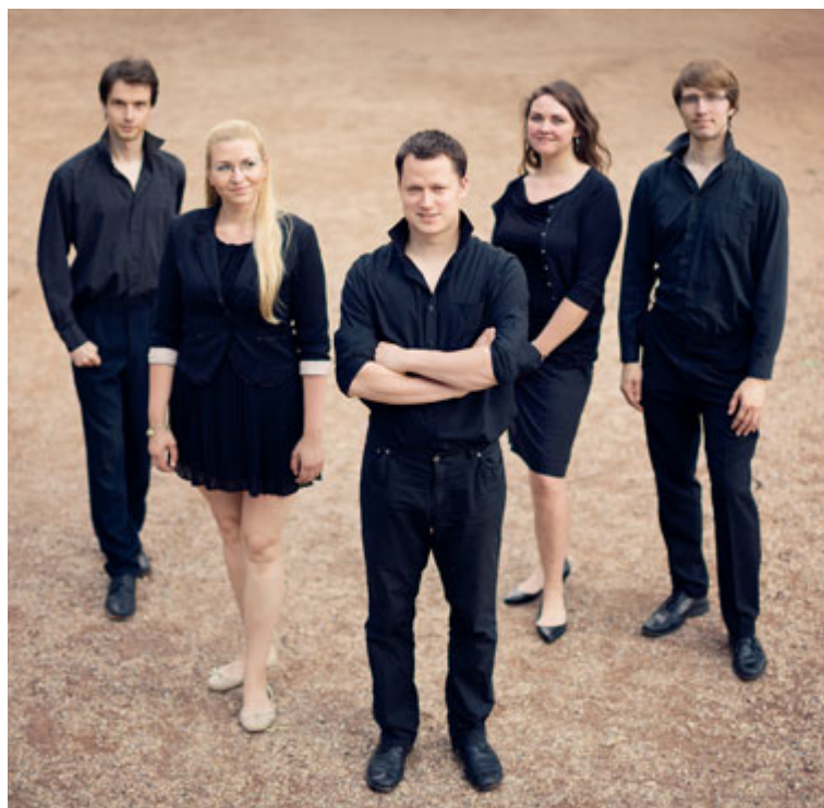
■ Brněnský vokální soubor Illegal Consort otevře svým koncertem v mikulášském kostele duchovní velikonoční svátky ve Znojmě.

V České republice je mnoho ansámblů, které se věnují staré hudbě. Většina z nich ovšem čítá mnoho členů. Illegal Consort je komorní vokální soubor, který se intenzivně věnuje čistě vokální hudbě a to v počtu 4–8 zpěváků. V posledních třech letech se věnujeme převážně tvorbě Carla Gesualda da Venosy, jehož dílo uvedeme právě i na koncertě ve Znojmě. Gesualdo je sám o sobě velice zajímavá osobnost a jeho hudba je velmi odlišná od jeho současníků. Díla jsou velmi náročná a vyžadují opravdu zkušenosti s jejich interpretací. Responsoria,