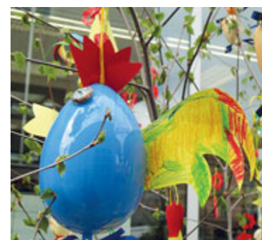
Ilustrační foto.

A nejen věřící budou moci spočinout v klidném prostředí kostelů a vychutnat si velikonoční koncerty. Křesťanské svátky obohatí 11. dubna od 17.00 hodin VELIKONOČNÍ KONCERT EXULTA-