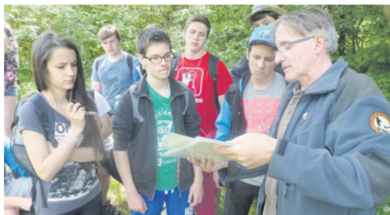
■ Práce žáků začala v krajině Podyjí. Výsledky toho, co se v terénu naučili, později prezentovali v Domě umění před veřejností.

Náměty na výuku v terénu chce Správa národního parku nabídnout i dalším školám na Znojemsku, pracovní listy i metodické komentáře uveřejní na svém webu. Zájem už projevily i další školy. lp