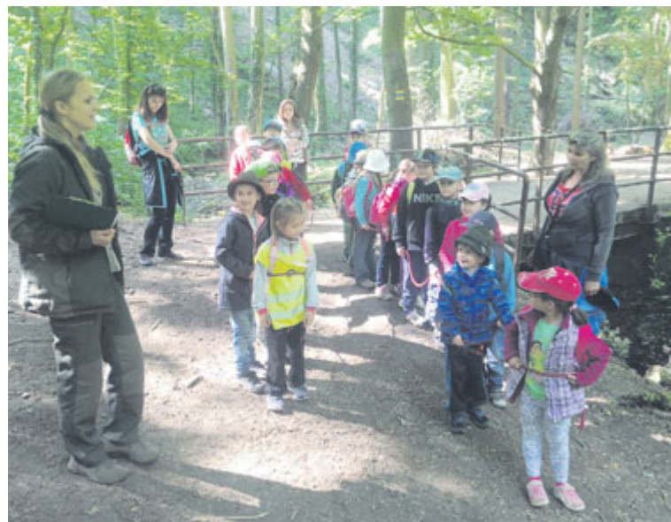
■ Děti s lesníky při procházce Gránicemi.

K Týdnu lesů, který se v Česku koná od roku 2008, se Městské lesy Znojmo připojily poprvé. Navíc i nyní nabízí zájemcům z řad škol či skupin návštěvu lesa v doprovodu lesníka. Zájemci se mohou domluvit na adrese: gabrhele-va@znojmolesy.cz . tz