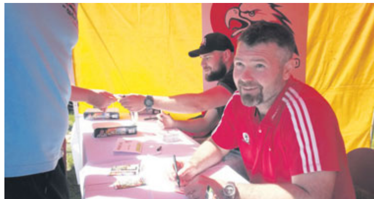
■ Hokejisté při autogramidě na Modelbrani 2015 v areálu DDM.