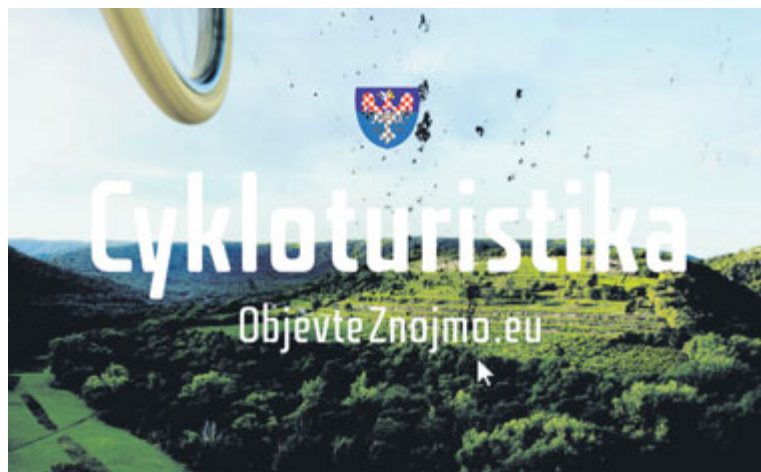
■ Billboard podél silnic a v železničních stanicích cílí na cyklisty.

„Už nyní se ke mně dostala spousta pozitivních ohlasů na vylepené billboardy. Myslíme si, že zvolená forma propagace je ideálním médiem právě pro podporu cestovního ruchu se značkou města Znojma a věříme, že se bude líbit, bude mít úspěch a především efekt přilákat k nám nové návštěvníky,“ komentuje billboardovou kampaň v originální zpracování ředitel Znojemské Besedy František Koudela. zp