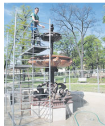
■ Poslední zkoušky vodních trysek a kašna opět zdobí městský park.

Restaurovaná kašna v Dolním parku je opět ozdobou města. Nyní zbývá doladit její okolí. Toho se chopí pracovníci Městské zeleně, kteří kolem kašny vysadí dvojitý lem z dvě stě padesáti buxusů a téměř čtyř stovek levandulí. Vše doplní téměř tisícovka tulipánů a samozřejmě bude i nový trávník. lp