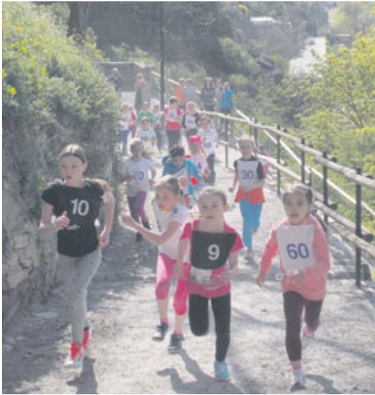
V Karolininých sadech proběhl už 9. ročník okresního kola Karolinka kap(ut)u aneb Běhu do vrchu.

Závodu se zúčastnilo jedenáct základních škol včetně gymnázií a mateřská škola Dělnická. „Celkový počet závodníků předčil veškerá očekávání. Na start se postavilo 371 dětí! Nádherné počasí doplnilo skvělou atmosféru,“ uvedla Tamara Bulantová ze Základní školy Václavské náměstí, která akci skvěle zorganizovala.