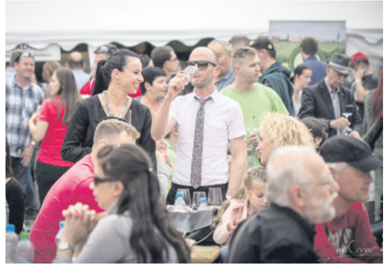
■ Kompletní fotogalerii z Festivalu vína VOC 2015 naleznete na www.vocznojmo.cz i na www.facebook.com/vocznojmo .