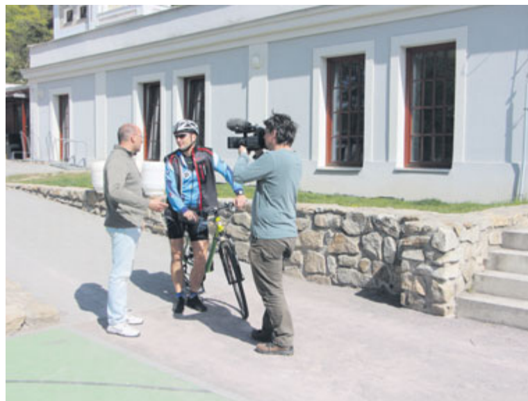
■ Filmaři z Cyklotoulek na Staré vodárně, kde na chvíli vyměnili kolo za loďku. Natáčení jarního dílu Cyklotoulek proběhlo v dubnu, v televizi díl ze Znojma odvysílali začátkem května. Ke zhlédnutí je i na webu www.cyklotoukytv.cz .

článek s titulkem Sedm míst, kde si dát rande ve Znojme, což jenom podtrhuje krásu a romantičnost našeho historického města. Press trip chystáme i letos. Natáčeli jsme také s polskou televizí TVP 2 jeden díl z velmi populárního gastronomického cestopisu, na podzim zase s Českou televizí známé Cyklotoulky, kdy jsme redaktorům ukázali nejen naše památky, ale také četné vinice v okolí. Filmařům se u nás tak líbilo, že na jaře vzniklo pokračování. Spolupracovali jsme také s Czech-American TV, která v USA odvysílala tři filmy o Znojme. Letos jsme rozjeli propagaci města na facebooku, připravili jsme billboardovou kampaň Objevte Znojmo a chystáme i spoustu dalších aktivit. Znojmo má turistům co nabídnout, jen jim ho ukázat,“ komentuje práci Znojemské Besedy v oblasti cestovního ruchu její ředitel František Koudela. zp