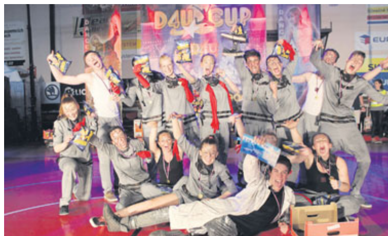
■ Zlatí tanečníci.

Porota 6. ročníku DANCE 4 YOU CUP PRAHA – s tématem Tanec proti drogám – ocenila znojenské tanečnický jako nejlepší v kategorii tanečních formací. Se zlatou choreografií Mad Art se nyní Might Shake připravuje na mistrovství republiky 6. června v Brně. Vyzkoušet si tančit se členy úspěšného studia může každý. Například na tanečním táboře ve Vanově u Telče, kde se již podvanácté sejdou milovníci rytmu a hudby. Děti mohou přijet 26. 7.–1. 8. a dospělí 1.–8. 8. Více informací o tanečním studiu i táboře získáte na tel. 777 236 291. lp