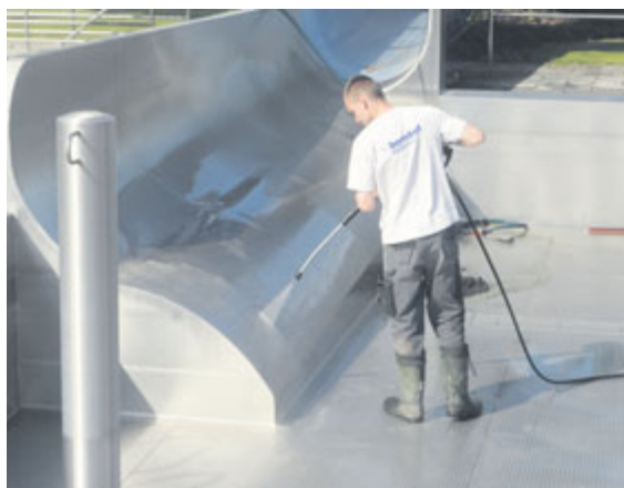
■ Kčištění nerezových van bazénů používali specialisté vysokotlakový čističi čili vapku.

Tým uklízeček umyl všechna okna, vyčistil šatny a přilehlé okolí. Na dveřích do šaten byly strženy staré potrhávané popisky a nahrazeny novými. Na zelených plochách došlo k vertikaci travníku ( provzdušnění – pozn.red. ), úpravě zeminy a ostříhání pásů růží.