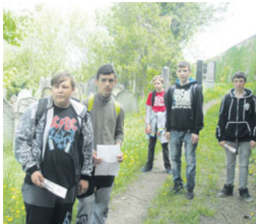
■ Znojemští žáci v Mikulově, kde žila svého času druhá nejpočetnější židovská obec v českých zemích.

Žáci druhého stupně Mateřské, Základní a Praktické školy ve Znojmě navštívili Mikulov.