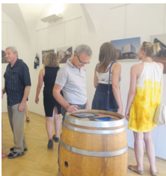
■ V originální instalaci najdou lidé sudy s tablety poskytujícími informace k jednotlivým stavbám.