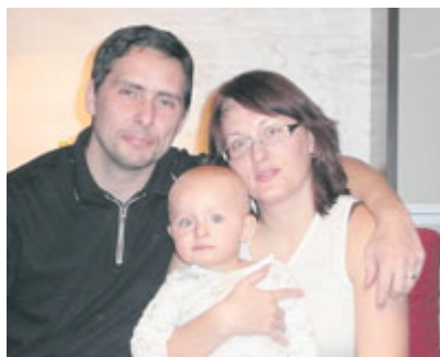
■ Ilustr. foto.

Z velké části za ní stojí práce pracovníků odboru sociálních věcí a zdravotnictví. Pod jejich vedením již také mnoho akcí na podporu manželství a vzájemných vztahů v rodině proběhlo.