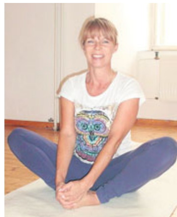
■ Martina Mangová.

Od té doby nasbírala nemalé množství pozitivních ohlasů od účastníků kurzů jógy, které pravidelně vede.