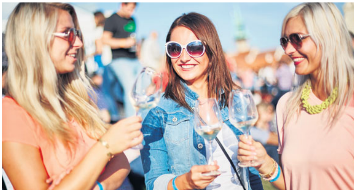
■ Podzim je ve Znojmě vždy ve znamení dobré zábavy, jídla, vína a burčáku.

velkolepý průvod a celé umělecké pojetí, dále stovkám účinkujících v průvodu i na jednotlivých hudebních či divadelních scénách stejně jako desítkám techniků a zvukařů, kteří vystoupení zajišťovali. Velký dík patří pochopitelně i všem lidem z městského úřadu a příspěvkových organizací, kteří se na organizaci největšího svátku vína také podíleli,“ nešetřil chválou starosta Znojma Vlastimil Gabriel. lp, zp