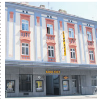
■ Po celé délce budovy je nová stříška, chránící před deštěm čekající diváky na novém chodníku.

Na řadu přišla modernizace vstupního prostor a videopůjčovny. Nejviditelnější je kompletně opravená fasáda s novým nátěrem, obklady a osvětlenou římsou. Vyměněna byla okna a všechny dveře včetně vstupních s kování a bezbariérovým vstupem. Chybí už jen nainstalovat osvětlení na římsu. Dlouhodobá modernizace interiéru i exteriéru kina tak bude dovršena. Náklady na venkovní rekonstrukci prostor vyšly na téměř pět milionů korun. Investorem bylo město. lp