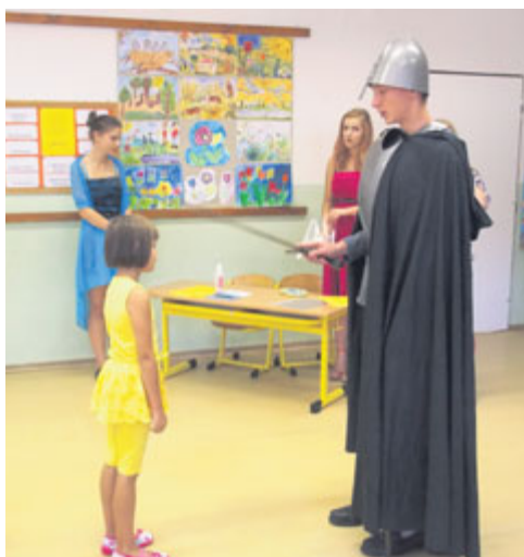
■ Devátáci, kteří originální pasování prvňáčků připravili, tak předali pomyslnou školní štafetu svým nástupcům.

Na chvíli opustil své místo na kašně před školou, aby v plné zbroji vešel do 1. třídy a slavnostně uvedl nové děti do stavu žactva prvního stupně. Když nováčci společně odříkali slib, chopil se svatý Václav meče a jednoho po druhém pasoval na školáka. Každý novopečený prvňáček pak stvrdil obřad otiskem palce. Placka na památku mu bude připomínat slib, že se bude pilně učit a škola se stane jeho kamarádem. lp