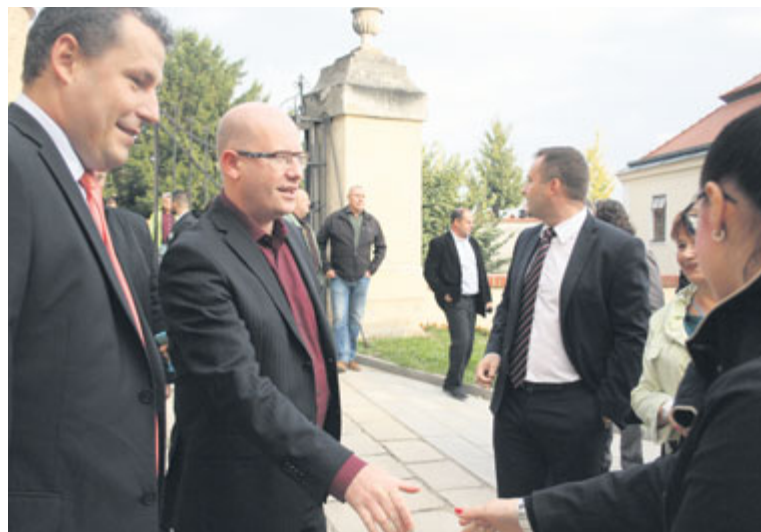
■ Premiér Sobotka a starosta města na znojenském hradě.