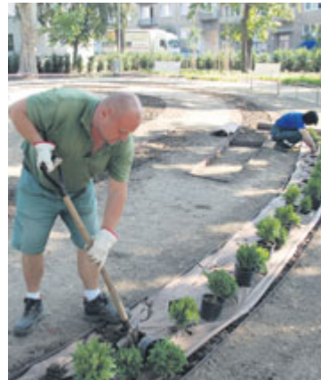
■ Svýsadou v okolí kašny začali pracovníci městské zeleně v posledním prázdninovém dni.

Lidé si užívají revitalizovanou část Dolního parku s novým dětským hřištěm již více jak rok. Chybělo jen opravit kašnu a její okolí. Restaurovaná parková dominanta se na své místo vrátila koncem dubna, poté začaly práce na zvelebení jejího okolí. Zelenou výsadbou v okolí kašny tak byla zcela dokončena revitalizace části Dolního parku, se kterou znojemská radnice začala v minulém roce. lp