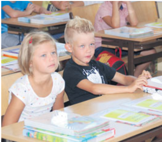
■ Stovky dětí usedly 1. září do lavic.

Znojmo letos do mateřských a základních škol proinvestuje téměř dvacet milionů korun. Patnáct milionů putuje do základních škol, čtyři miliony šest set padesát tisíc pak do školek. Dalších čtyři sta