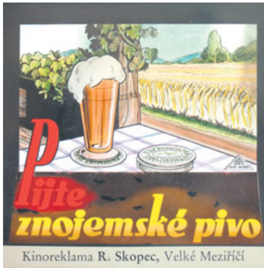
■ Prvorepubliková reklama na Znojemské pivo.

S obnovením značky a výroby Znojemského piva navazuje Znojemský městský pivovar na rok 1720, kdy se začala psát historie vaření zlatavého moku ve Znojmě.