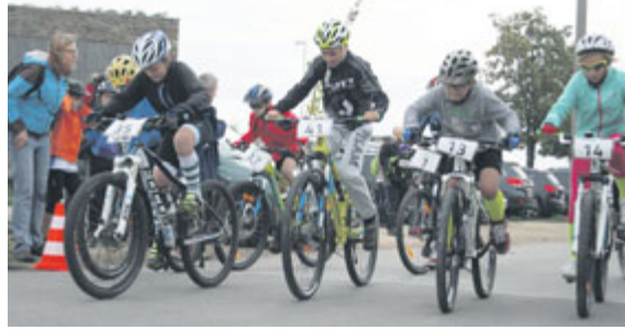
■ Start jedné z mládežnických kategorií.

Na třech okruzích o celkové délce 58,5 km jezdili zkušení bikeři. Tuto trať absolutně nejrychleji zdolal s více