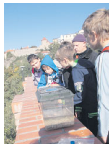
■ S pránostikami o vodě, bouřkách a dešti seznámili žáky odborníci z Jihomoravského muzea.