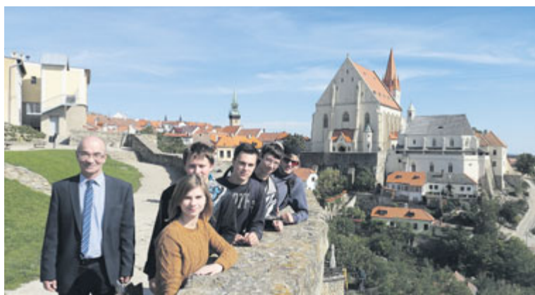
■ Učitelé a žáci z Ruska ocenili nejen špičkové vybavení znojemské školy, ale i krásy Znojma.