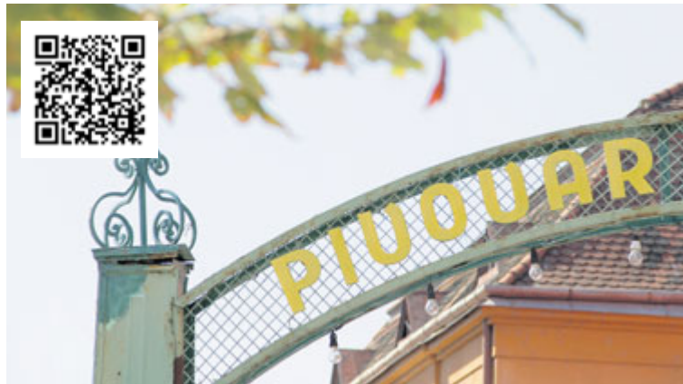
■ Video o areálu pivovaru, ze kterého je záběr, si můžete načíst z QR kódu.

„Jelikož se vše shodou okolností seběhlo těsně před komunálními vol-