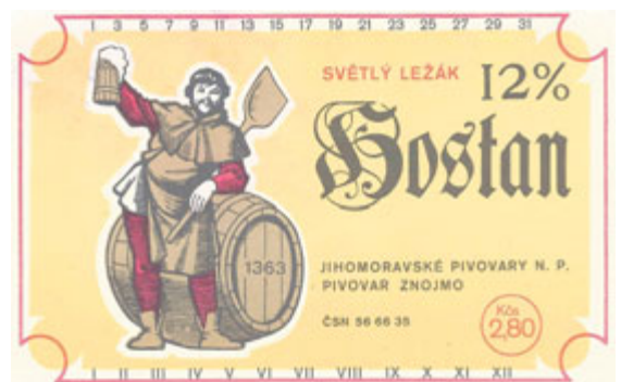
■ Etiketa Hostanu.