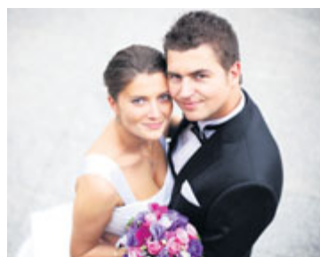
■ Blíží se svátek zamilovaných a vloni se ve Znojmě 14. února vzaly dva páry.

Vloni bylo na znojenské matrice uzavřeno 229 manželství, to je o pětadvacet více než v roce 2014. Většina „ano“ zazněla v obřadní síni městské radnice (186 párů), ale třiadvacet novomanželů stvrdilo svůj slib před Bohem v několika krásných kostelech na Znojmsku, mezi kterými jednoznačně drží prim kostel sv. Mikuláše ve Znojmě. Lásku si snoubenci slíbili v Louckém klášteře, u kapličky, na Hradišti, na hrádku Lampelberg ve Vrbovci, v Jubilejním parku, v Modrých sklepích i v popickém domě Charlese Sealsfielda. Určitě největší počet „svateččanů“ měli