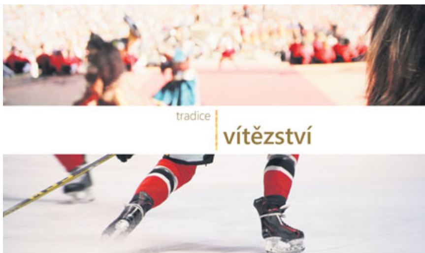
■ Jednadvacáté století je našťestí pouze ve znamení slavných bitvy na sportovních kolbištích.