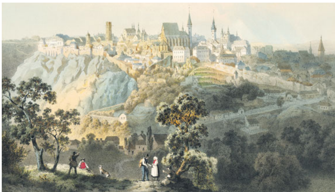
■ Dobová podoba Znojma. Obraz je z majetku Jihomoravského muzea ve Znojmě.

V roce 2016 slaví město Znojmo 790 let od založení královského města králem Přemyslem Otakarem I. A právě v tomto duchu se ponese i celý rok 2016. Podtitul Znojmo 790 budou mít kulturní, společenské i sportovní akce. A cílit bude město