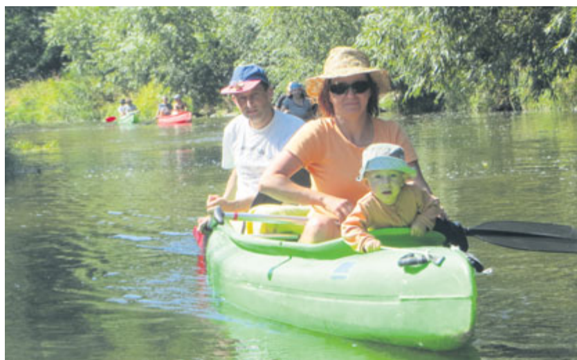
■ Vodáci na Dyji měli skvělou sezonu.