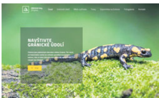
■ Podoba novinky – webových stránek Gránic.

nejen informace o Gránickém údolí, ale také zdejší trasy včetně map, fotogalerii či informace o historii a geologické stránce údolí. Představuje také mloky, kteří v Gránicích žijí. Na webu naleznete také informace k nedávno otevřené naučné stezce S mlokem Gránickým údolím. zp