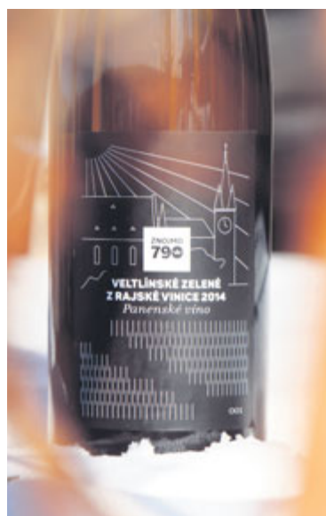
■ Víno z městské Rajske vinice nese originální etiketu.

Leden symbolizuje 9. století, ve kterém má svůj počátek tradice Znojma coby vyhlášené vinařské metropole, a kde se v tomto období začaly zakládat první vinice.