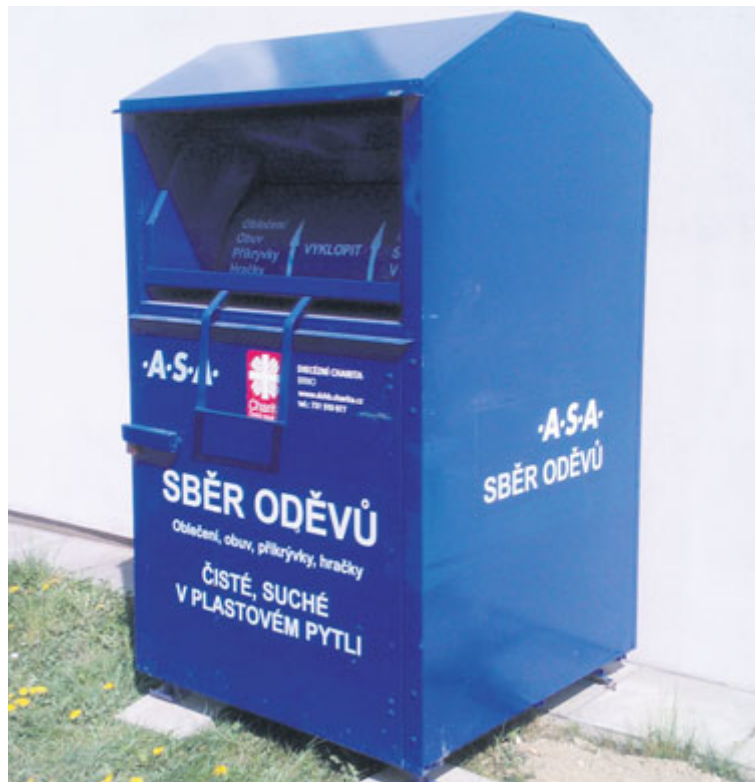
■ Kontejner na vyřazený textil.

Stála před velkým problémem. Jak a kde získat dostatek kvalitního použitého textilu, aby bylo možné pracovní místa pro postižené zaměstnance zachovat. V této situaci se vedoucí dílen obrátila na společnost .A.S.A.