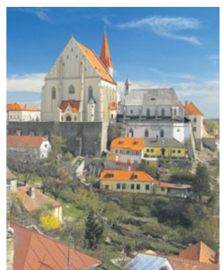
■ Kostel sv. Mikuláše a staré město s okolní přírodou jsou hlavním lákadlem turistů.