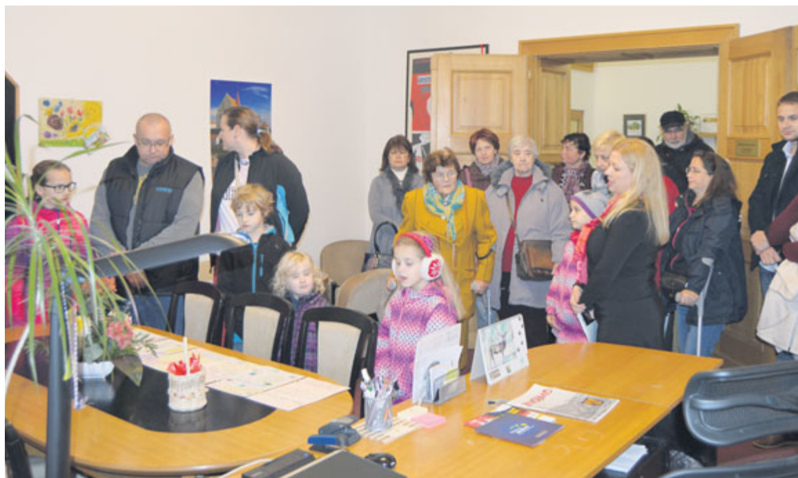
■ Zájem o prohlídku prostor radnice ze strany obyvatel nejen Znojma rok od roku roste.

zakázán. „Po řadě videí, které znázorňují ty hlavní kulturní akce města Znojma, jsme nyní chtěli vytvořit i krátký spot ke Dni otevřených dveří. Jedná se o charakterově odlišnou akci, ale u lidí se setkává s oblibou. Každoročně nám chodí noví a noví návštěvníci, a to nejen ze Znojma,“ říká starosta Znojma Vlastimil Gabrhel. Den otevřených dveří radnice pořádá město Znojmo od roku 2012, a protože zájem veřejnosti roste, bude v této tradici pokračovat i nadále. zp