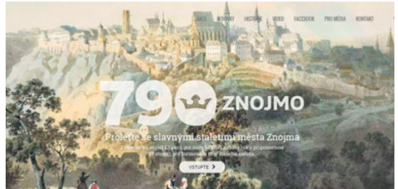
■ Úvodní strana webu k 790. výročí Znojma.

Při výběru kulturních akcí, které město letos podpoří, bude jedním z kritérií tematické připomenutí roku založení královského města. „Tematickým připomenutím se rozumí zařazení symbolů oslav do programu či názvu akce. V případě sportovců například zařazením loga na dresy či na bannery u hrací plochy, v případě kulturních akcí uzpůsobení programu některé z historických událostí města a podobně,“ vysvětlila mluvčí města Zuzana Pastrňáková.