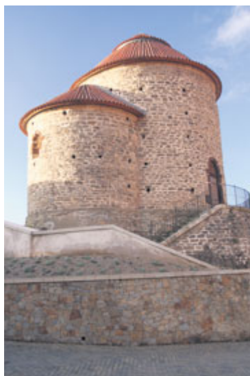
■ V březnu/11. století bude rotunda tématem dětské fantazie.

Základní myšlenkou celého projektu Znojmo 790 je vytvoření seriálu dvanácti tradičních i nových akcí, které během dvanácti měsíců postupně připomenou dvanáct století, které formovaly tvář Znojma. Od