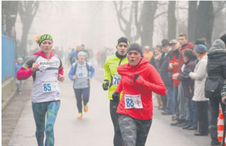
■ Každý z 215 běžců a běžkyň se ze sebe na trati Vánočního běhu snažil vydat vše.

Přelom roku nebyl pro znojemské sportovce jen ve znamení vánočních svátků a silvestrovských oslav, ale na své si přišli i vyznavači běhání. V období od 19. prosince do 9. ledna měl desetidílný seriál závodů Znojemský běžecký pohár na programu hned čtyři akce a přiblížil se tak do svého finále, které se uskuteční dvěma závody v dubnu.