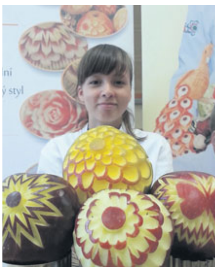
■ Ozdobné vyřezávání ovoce a zeleniny, tak jak ho umí na znojenské střední škole.

Absolvováním kurzu získá každý účastník účastnický list, případně certifikát Carvingové akademie. Zájemcům o kurz veškeré dotazy rádi zodpoví přímo na škole (tel. 537 020 555). lp