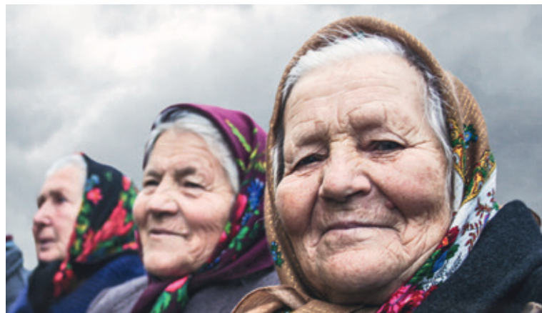
■ Do prostředí Černobylu míří snímek Bábušky .