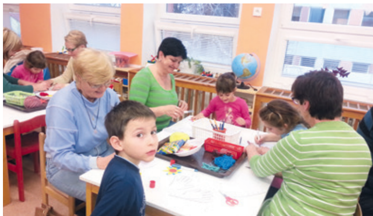
■ Než se všichni rozešli, stačili si ještě v pohodové atmosféře společně vyrobit srdíčko pro radost, které si odnesli domů.