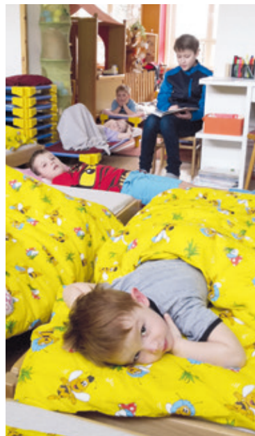
■ Starší děti chodí předčítat svým mladším kamarádům.

Přijít ze školy domů a hned se pustit do domácí přípravy na následující den je představa, která obecně mnoho dětí příliš neláká. Ovšem žáci 5. tříd Základní školy Mládeže ve Znojmě mají v této oblasti velkou výhodu. Jeden čtvrtek v měsíci se vydají do znojmské mateřské školy na náměstí Armády a malým dětem předčítají před spaním pohádky. Nejenže si tak mohou odškrtnout splněný úkol ze čtení, ale učí se pracovat s mluveným slovem, rozvíjí své komunikační dovednosti i paměť a především vztahy mezi sebou. A zvláštní forma učení je prospěšná i druhé straně. Je všeobecně známé, že pro předškolní děti je čtení literatury mimořádně důležité pro rozvoj budoucího učení se na vyšším stupni vzdělání. lp