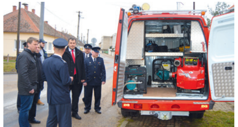
■ Nové požární vozidlo předal mramotickým hasičům starosta Znojma Vlastimil Gabrhel (uprostřed).

500 000 korun pak pokryla dotace z Jihomoravského kraje. lp