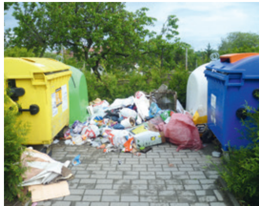
■ Budme ke svému okolí ohleduplní a dávejme odpad tam, kam patří!

Jednou stranou mince je odstranění nepořádku a druhou, aby čistota na uklizených místech zůstala co nejdéle. V tomto směru má nezastupitelnou roli městská policie (tel. číslo 156), na kterou je třeba se obrátit, pokud jste svědky zakládání černé skládky nebo jiného nesprávného nakládání s odpady. Je možné, že i vy sami dotyčného upozorníte nebo pořídíte fotografii,