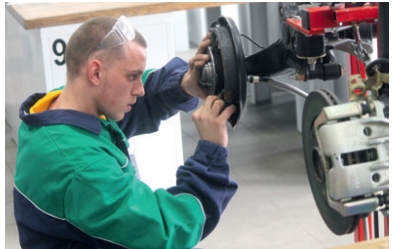
■ Praktickou část soutěže si automechanici odbyli na profesionálně vybaveném pracovišti společnosti PSOTA Transport.

Výměna rozvodů i stovka otázek vědomostního testu. Nejen toto museli zvládnout mladí automechanici, kteří bojovali v soutěži Autoopravář – junior 2016. Zlato nakonec zůstalo doma!