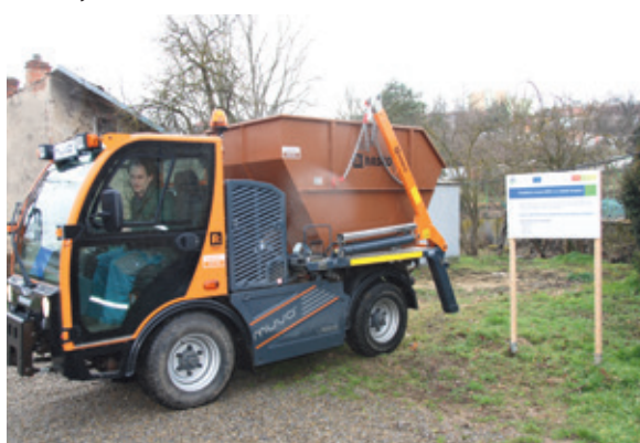
■ Kontejner na bioodpad bude stát i na Kuchařovické ulici vedle zahrádkářství Městské zeleně.

umístěny velkoobjemové kontejnery, do kterých budou lidé moci vhodit trávu, listí a větve. Vše bude následně odvezeno a zpracováno na kompostárně v Únanově.