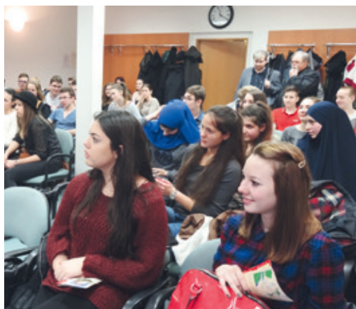
■ Setkání v knihovně.

skupině vyskytly i ty extrémní. Setkání ale potvrdilo, že pro novou generaci nejsou zásadní činy historie, ať již společné nebo rozdílné. Mladí lidé neřeší to, co bylo, ale zajímá je budoucnost. Vidí v ní spolupráci, poznávání a navazování nových kontaktů. Nezáleží jim na tom, zda je někdo Moravan, Čech nebo Rakušan. Školy se na setkání domluvily na další spolupráci. lp