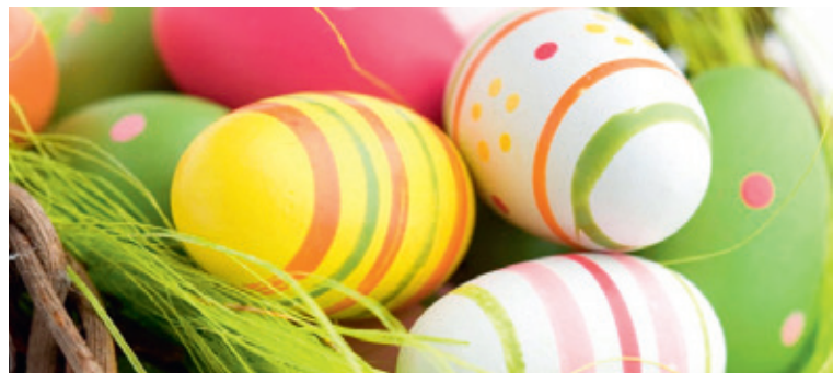
■ Ilustrační foto