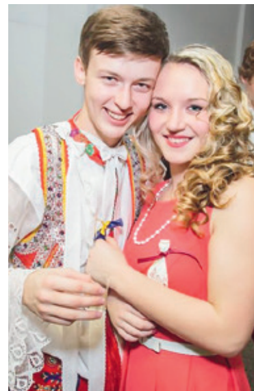
■ Tradice Velikonoc je uchovávána díky mladé generaci.

Poprvé se také v rámci Znojemských Velikonoc bude konat Kabelkománie. Lidé budou moci přijít do stanu na Horním náměstí a za symbolickou cenu zde zakoupit kabelku. Všechny získané peníze pak půjdou Nadaci pro transplantace kostní dřeně. Akci s charitním podtextem podporují známé osobnosti, znojemští hokejisté a fotbalisté, řada dobrovolníků, VOC