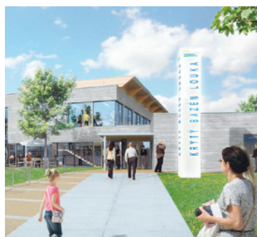
■ Studie nového vstupu ke krytému bazénu v Louce.

„Znojmo potřebuje technologicky kvalitní krytý bazén, který bude kapacitně vyhovovat požadavkům veřejnosti. Stávající Městské lázně s jistotou dosluhují, což si dobře uvědomujeme. Vybudování nového krytého bazénu však znamená obrovskou časovou i fi-