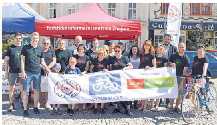
■ Ocenění cyklisté.

Oproti loňskému roku, kdy se Znojmači zapojili poprvé, se několikrát navýšil počet účastníků. Mottem letošního ročníku bylo tisíc důvodů, proč jezdit Do práce na kole a novinkou bylo, že se do soutěže mohli zapojit i chodci, běžci, longboardisté a skateboardisté, kteří to mají do práce v jednom směru minimálně 1,5 km. zp