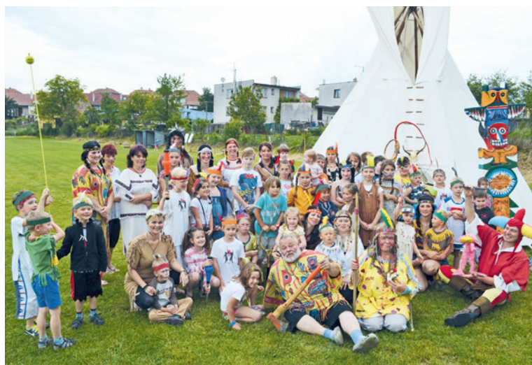
■ V Dětský den se Mramotice změnila na indiánskou osadu.