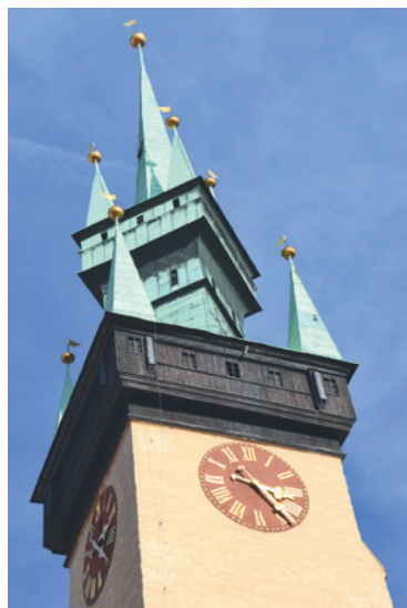
■ Radniční věž jako výzva.