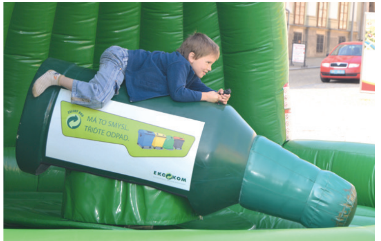
■ Atrakce rodeo láhev v kontejneru vyzkoušely mladší generace.

Návštěvníci různých věkových kategorií se zapojili do vědomostní soutěže o ceny či vyzkoušeli originální atrakci ve stylu čtyř barevných kontejnerů i nafukovací popelářské auto ke skákání a další. Na své si přišly hlavně děti. Další zajímavé informace o tom, jak s odpady správně nakládat, najdete na webu www.rodinaokurkova.cz . lp