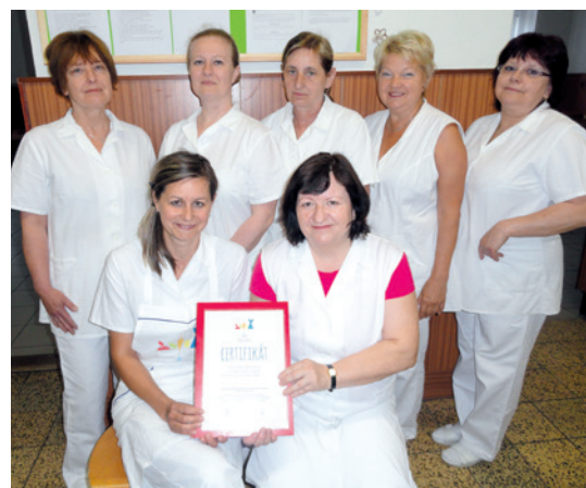
■ Kolektiv pracovníků oceněné jídelny, kde vaří z kvalitních surovin nejen mnoho nových pokrmů, ale zařazují také nové a méně tradiční suroviny.

Do projektu Zdravá školní jídelna se přihlásily školní jídelny z celé republiky. Jedinou z okresu Znojmo byla právě Základní škola náměstí Republiky, která je vlajkovou lodí tohoto projektu na Znojemsku. tp, lp