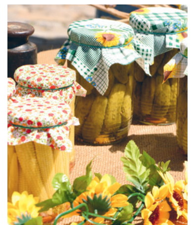
■ Vzorky bývají nejen chutné, ale i pěkné.

Podmínkou je přinést do soutěže o Nejlepší sterilovanou okurku dva vzorky, do soutěže o Nejlepší rychlokvašku stačí jeden. lp