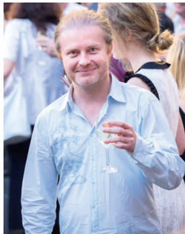
■ Pavel Šporcl říká, že na Hudební festival Znojmo jezdí rád za přáteli, úžasným publikem a milou atmosférou.