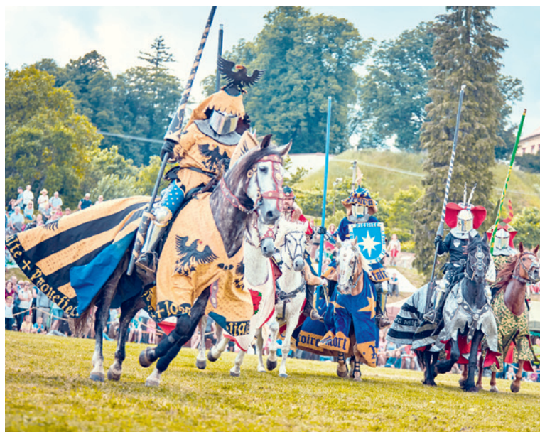
■ Štvcanci v kostýmech doby Karla IV.