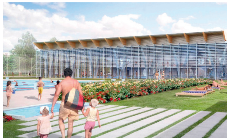
■ Studie bazénu. Další je možné si prohlédnout na webu www.znojmo-zdravemesto.cz v sekci Projekt krytého bazénu. Nový krytý bazén počítá s kondičním plaveckým bazénem se šesti dráhami, dále s relaxačním bazénem, dětským brouzdalištěm a zázemím s whirl-poolem.

vloni právě s ohledem na srovnávací studii na radě města. zp