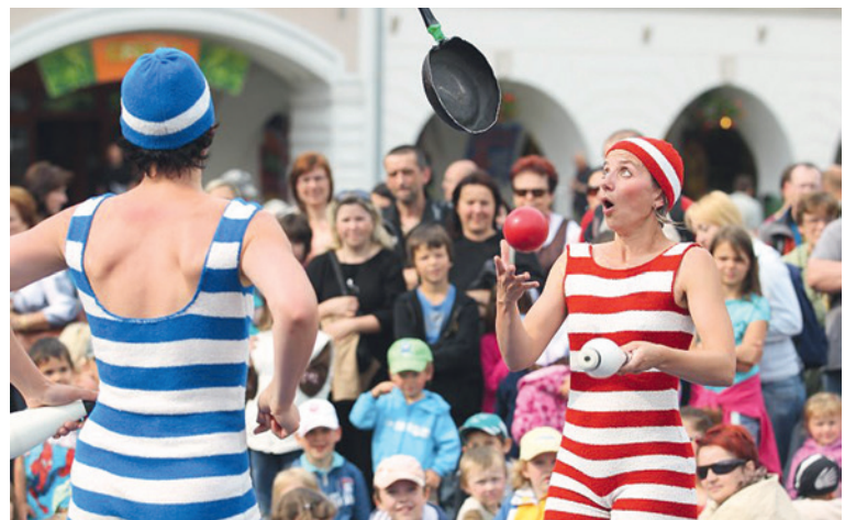
■ Divadlo Kufr zahraje na Šramlu pohybově – žongléřskou klauniádu pro děti i dospělé Tančiček Adušiadási.