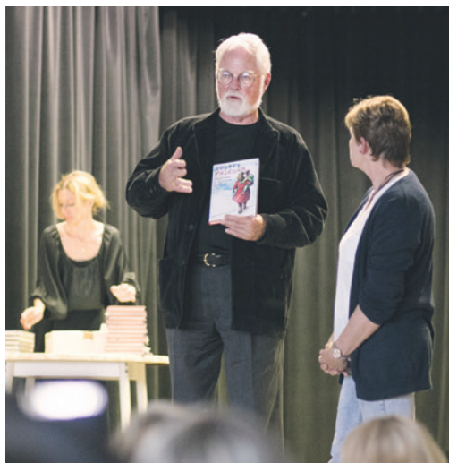
■ Zájem o Roberta Fulghuma byl velký. Ochoťně svým čtenářům podepsal knihy i pózoval na společných fotografiích.