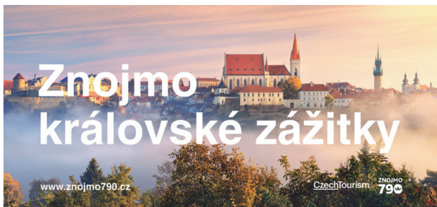
■ Graficky elegantní billboardy budou k vidění na dálnicích D1 a D2 až do konce července, poté je v měsíci srpnu vystřídá vizuál Znojmského historického vinobraní 2016, které se koná 16.–18. září.

Tourism zahrnula mezi své partnerské eventy. lp