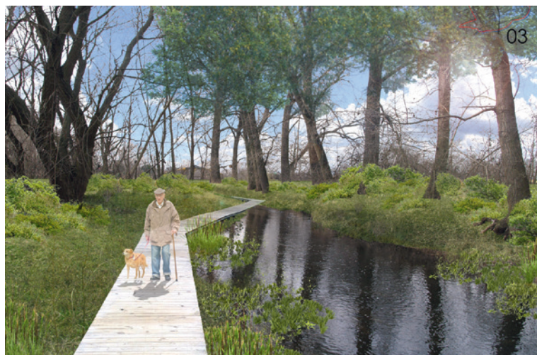
■ Vizualizace Lér, nad kterými občané diskutovali o zpevněných plochách, zeleni, typu i počtu sportovních hřišť, plochy vyhrazené pro venčení psů, parkování nebo zemědělské využití části lokality.

rezerva Lér v územním plánu právě pro místo pro aktivní odpočinek je tou správnou cestou a variantou, kterou bychom se v budoucnu měli zabývat. Léry jsou jako celek krásným územím, které je potřeba chránit,“ doplňuje starosta. Využitelnost území všeobecně ovlivňuje i fakt, že se z velké části nachází v záplavovém území a částečně i v jeho aktivní zóně a že jím má v budoucnu procházet kapacitní komunikace. zp