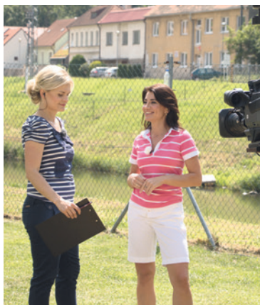
■ Moderátorky pořadu u řeky Dyje.