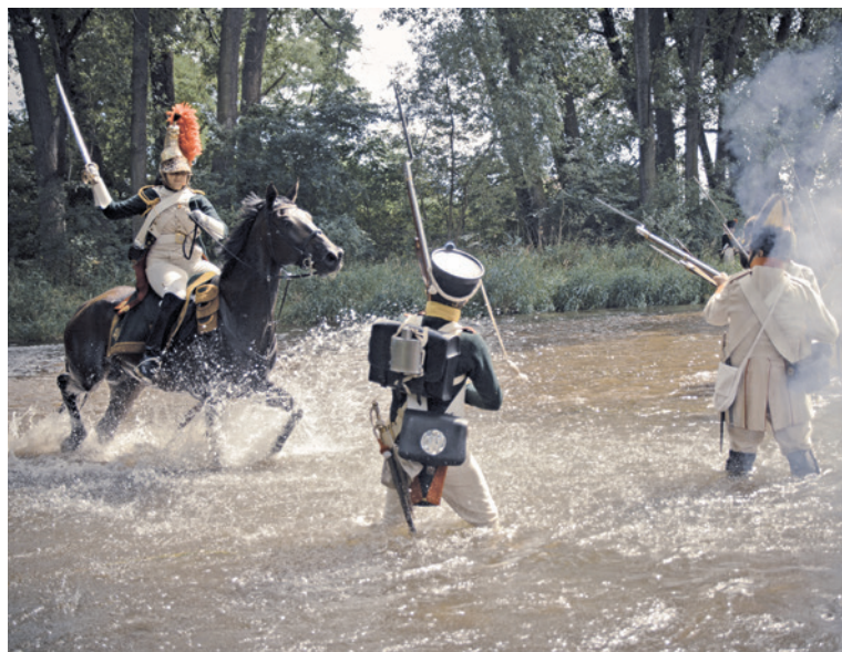
■ Bitva u Znojma (10.–11. 7. 1809) je jedním z významných vojenských střetnutí na území střední Evropy. Ukončena byla příměřím, kdy císař Napoleon pronesl legendární větu: „Krvě již bylo prolito dost!“