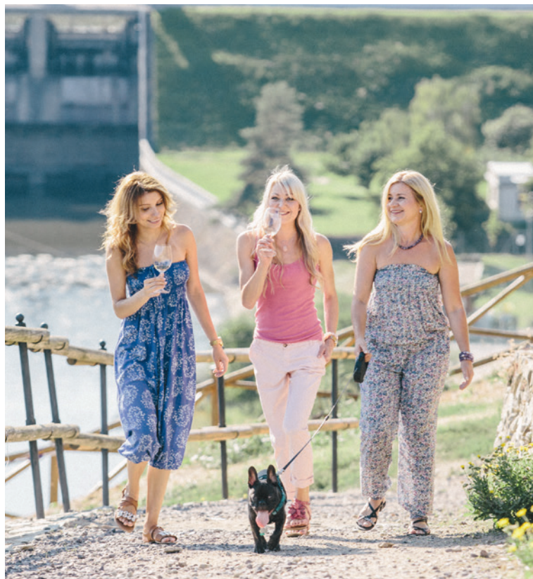
■ Klétu patří voda, zábava i dobré moravské víno.

Odpočívat v prázdninových měsících mohou nejen děti, ale i jejich rodiče, a tak se v programové nabídce najdou akce pro všechny věkové kategorie. Znovu se můžeme pod večerní oblohou podívat na filmy letního kina, popíjet k tomu dobré víno nebo Znojenské pivo či ochutnat nějakou místní lahůdku v dobrých restauracích. Připravena je řada zajímavých výstav na znojenském hradě i v Domě umění. Zasmát se u pouličního divadla a zatancovat si může na dalším ročníku Šramlfestu a určitě neprohloupí ten, kdo se vydá na hudební festival nebo na rytířský turnaj pro Karla IV. Stačí sledovat plakáty kulturního léta, které se objeví po celém Znojmě. O některých akcích si přečtete už nyní na stranách 8, 9 a dalších. lp