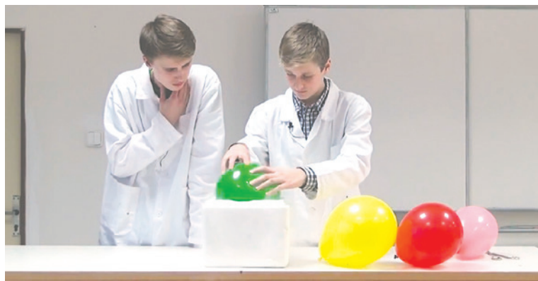
■ Úspěšní studenti museli pro svůj pětiminutový snímek vytvořit scénář, promyslet scénu a stát se herci i sami sobě režiséry.

Třetí místo v celorepublikové soutěži zaměřené na fyziku získali za své video dva studenti ze Znojma.