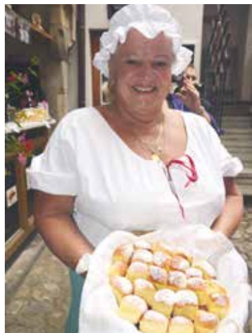
■ Ke správnému mázhauzu patří dobové oblečení a jídlo.

„Snažíme se, aby znojmské mázhauzy měly neopakovatelnou atmosféru s nádechem středověku a zapadaly do koncepce našeho vinobraní. Proto