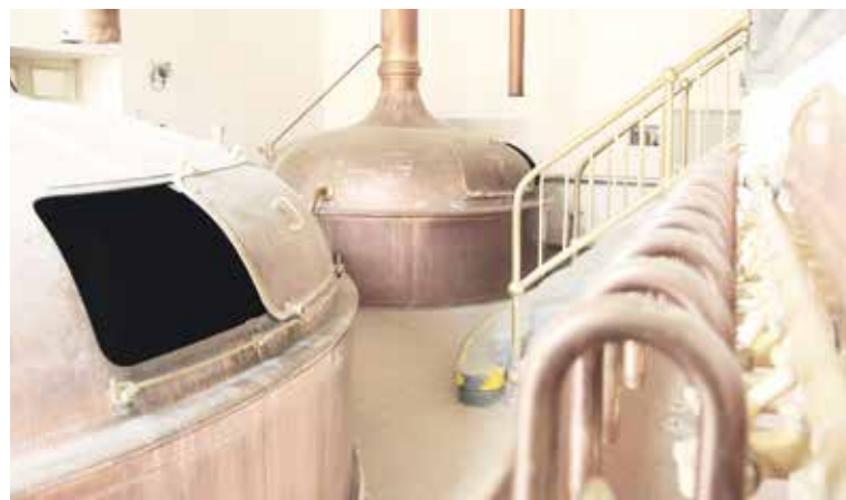
■ Hlavním exponátem budou původní varny z roku 1930.

Hlavním exponátem muzea bude původní technologické zařízení varny z roku 1930, které bylo vyrobeno ve Škodových závodech v Plzni. V roce 2010 bylo prohlášeno za kulturní památku. Sestává z vystírací kádě, rmutového kotle, mladinového kotle, scezovací kádě a zcezovacího korýtka. Majitelem tohoto unikátního vybavení je společnost Heineken, se kte-