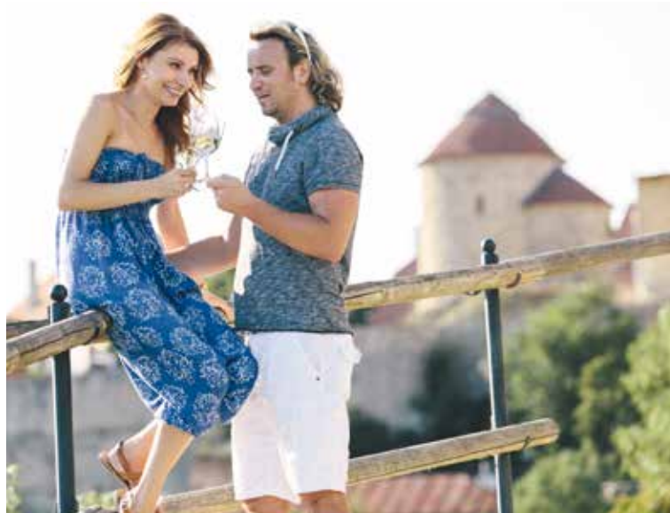
■ Romantické Znojmo. Na skleničku vína se v létě můžete vydat například na degustační stánek na Rajské vinici nebo na Vlčkovu věž.

LISTŮ, je opravdu nabitý. Tak si jej užijte. Přejeme vám krásné léto! zp