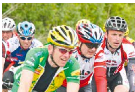
Loňský závod přilákal na 2 500 cyklistů.

Přihlásit na závod se lze do 7. září 2016 přes webové stránky www.koloprozivot.cz . Kdo se nestihne zaregistrovat, má šanci se ještě přihlásit osobně v předvečer závodu v Louckém klášteře nebo v den závodu hodinu před závodem. Více informací o závodě na www.koloprozivot.cz . tp