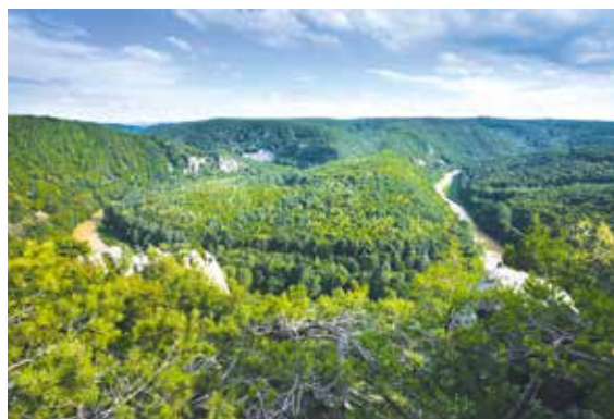
■ Šobes patří ke klenotům Znojemska.

Podle dosavadních výzkumů mohou archeologové na Šobesu očekávat četné nálezy z mladší a pozdní doby bronzové, popřípadě ze starší doby železné. lp