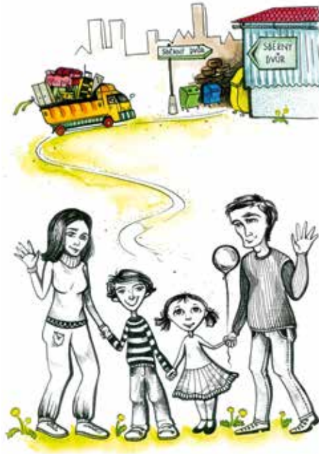
■ „Dáváme odpady tam, kam patří,“ nabádá rodina Okurkova.

Přímětický sběrný dvůr navíc disponuje moderní rampou. „Každý, kdo přijede s odpadem, rovnou najede na rampu, kde jsou k dispozici velkoobjemové kontejnery na různý typ odpadu. Pracovníci sběrného dvora, kteří rampu obsluhují, rádi každému pomohou a poradí. Nikdo se tak nemusí bát, že by to sám nezvládl.“