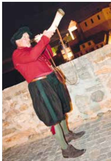
■ Ponocný je připomínkou dnes již zaniklého povolání.

Od pátku 17. června až do konce září mohou lidé v nočních ulicích Znojma potkat ponocného. Ten je připomínkou dnes již zaniklého povolání. V minulosti měla nočního