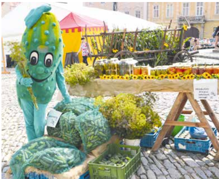
■ Na slavnostech budou okurky na každém kroku.