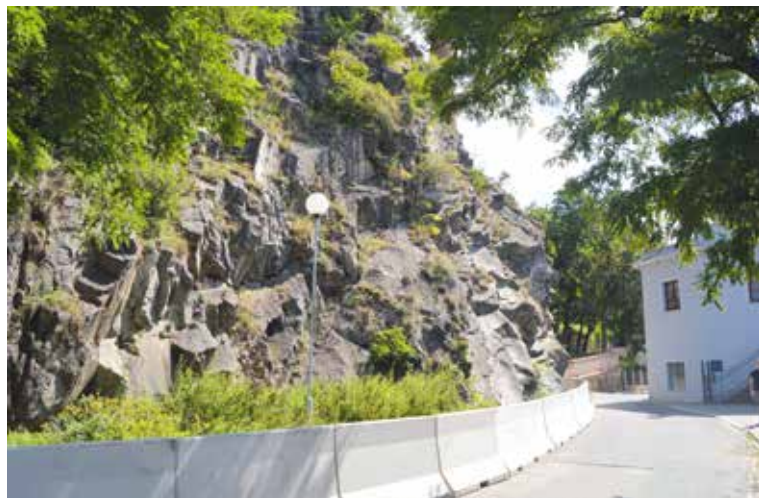
■ Z bezpečnostních důvodů jsou tu od loňska instalována betonová svodidla. Odstráněna budou nejpozději na konci září.

Muzeu motorismu připravovalo město již delší dobu. Navazuje tím na práce, které v dané lokalitě a na ulici Koželužská a ulici Napajedla proběhly před dvěma lety. tp