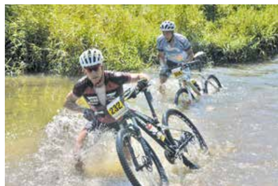
Závod přináší i mnoho překážek.