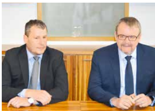
■ Jedno z posledních jednání ohledně dostavby obchvatu s ministrem dopravy Danem Ťokem (na fotce vpravo) absolvoval starosta Gabrhel ve Znojmě na jaře.

bych rád poděkoval celé vládě, panu premiérovi Bohuslavu Sobotkovi, Jihomoravskému kraji v čele s hejtmánem Michalem Haškem a zástupcům Ředitelství silnic a dálnic za spolupráci. Dostavba obchvatu se stala prioritou vlády a tyto konkrétní kroky to jen dokazují,“ doplňuje Gabrhel. Pokračování na str. 3. zp