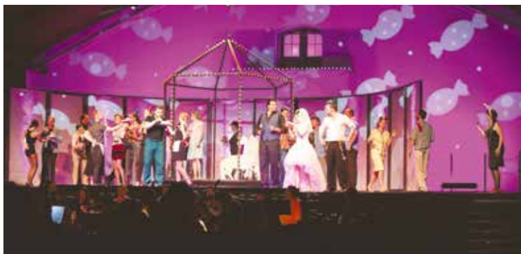
■ Festivalovou operu Don Giovanni připravil ve Znojmě za pouhých sedmáct dní tým čítající sto deset lidí.

„Město Znojmo by mělo vědět, že se stalo hudebním centrem repub-